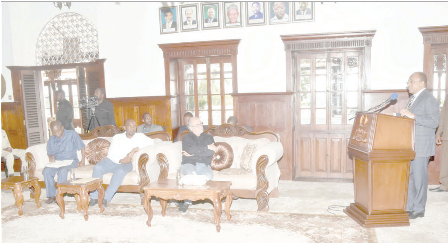
Rais wa Zanzibar na Mwenyekiti wa Baraza la Mapinduzi, Dk. Hussein Ali Mwinyi, akizungumza na kuwapongeza madaktari bingwa wazalendo wa kitengo cha upasuaji wa ubongo na mishipa ya fahamu kutoka Hospitali ya Mnazi Mmoja, katika hafla iliyofanyika Ikulu, jijini Zanzibar juu.