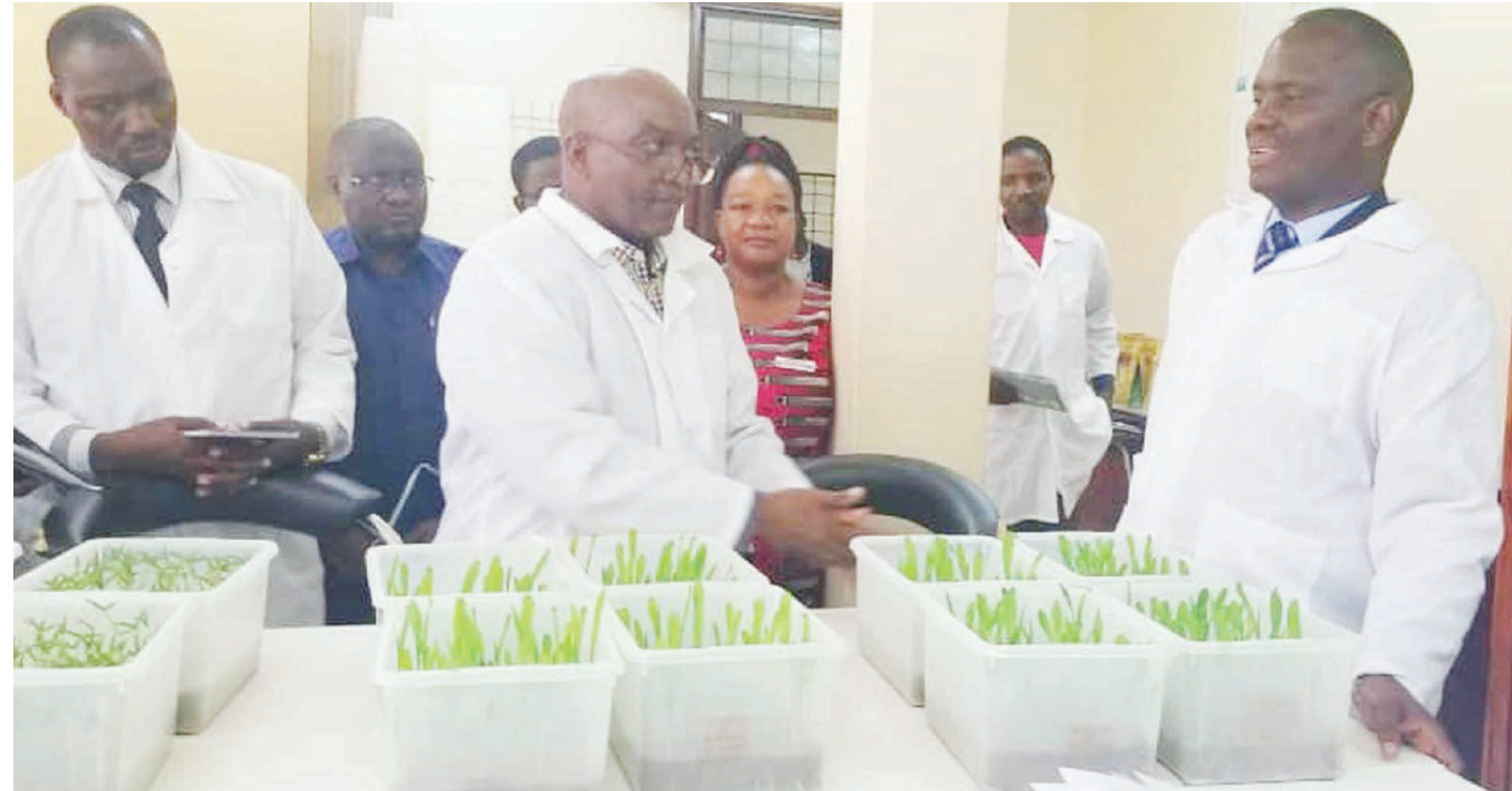
Huduma ya uandaaji mbegu ikiendelea katika maabara za TOSCI.

• Waleta mbegu 'feki' wanaangukia sheria; uagizaji mbegu nje umebakia 'kiduchu'