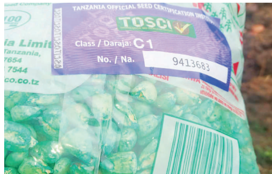
Mbegu iliyoidhinishwa na TOSCI, tayari kwenda sokoni.

zingine zilizochangia kuongezeka uzalishaji wa mbegu nchini ni pamoja na uwepo wa mazingira mazuri ya wawekezaji