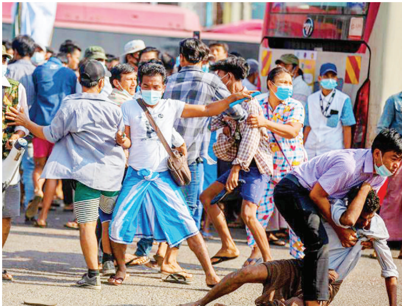
Wanajeshi wakikabiliwa na waandamanaji wanaounga mkono demokrasia, wakati jeshi lilipokuwa likitoka msaada huko Yangon, nchini Myanmar, jana.

Rais aliyeondoka madarakani, Donald Trump awali alikuwa akituhumiwa kuzibia masikio madai ya ukiukaji wa haki za binadamu unaohusishwa na mrithi wa Saudi Arabia, Mohammed bin Salman, lakini maswali yanabaki juu ya msimamo wa Rais wa Marekani Joe Biden. BBC