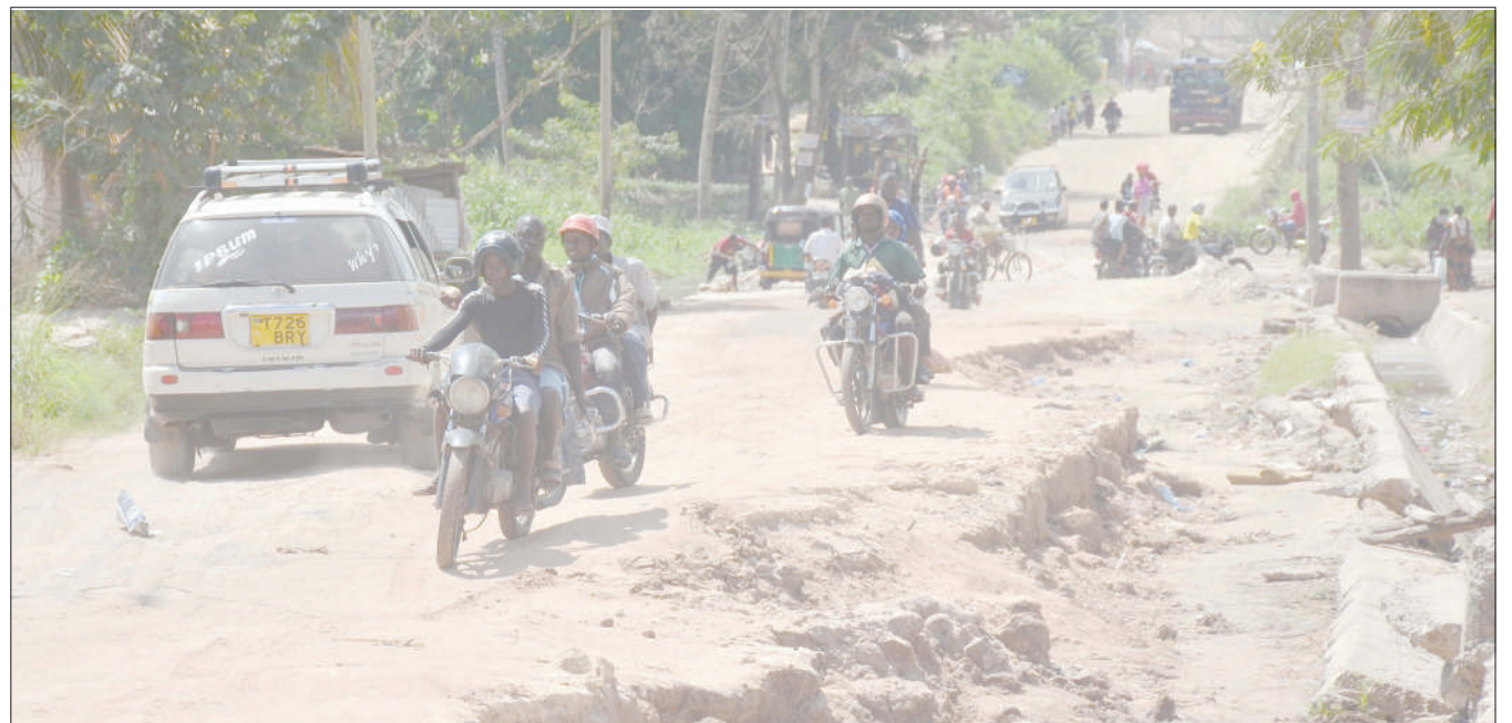
Waendesha pikipiki wakipita kwenye barabara iliyoharibika vibaya inayohitaji kukarabatiwa katika eneo la Chanika, jijini Dar es Salaam jana.

Meneja huyo pia alisema mbali na NHC kupangisha nyumba zake, imekuwa ikishiriki katika upangaji miji na ujenzi wa miradi mbalimbali ya kimkakati ikiwamo ujenzi wa hospitali za rufani za Mwalimu Nyerere mkoani Mara na ile ya Kanda ya Kusini mkoani Mtwara.