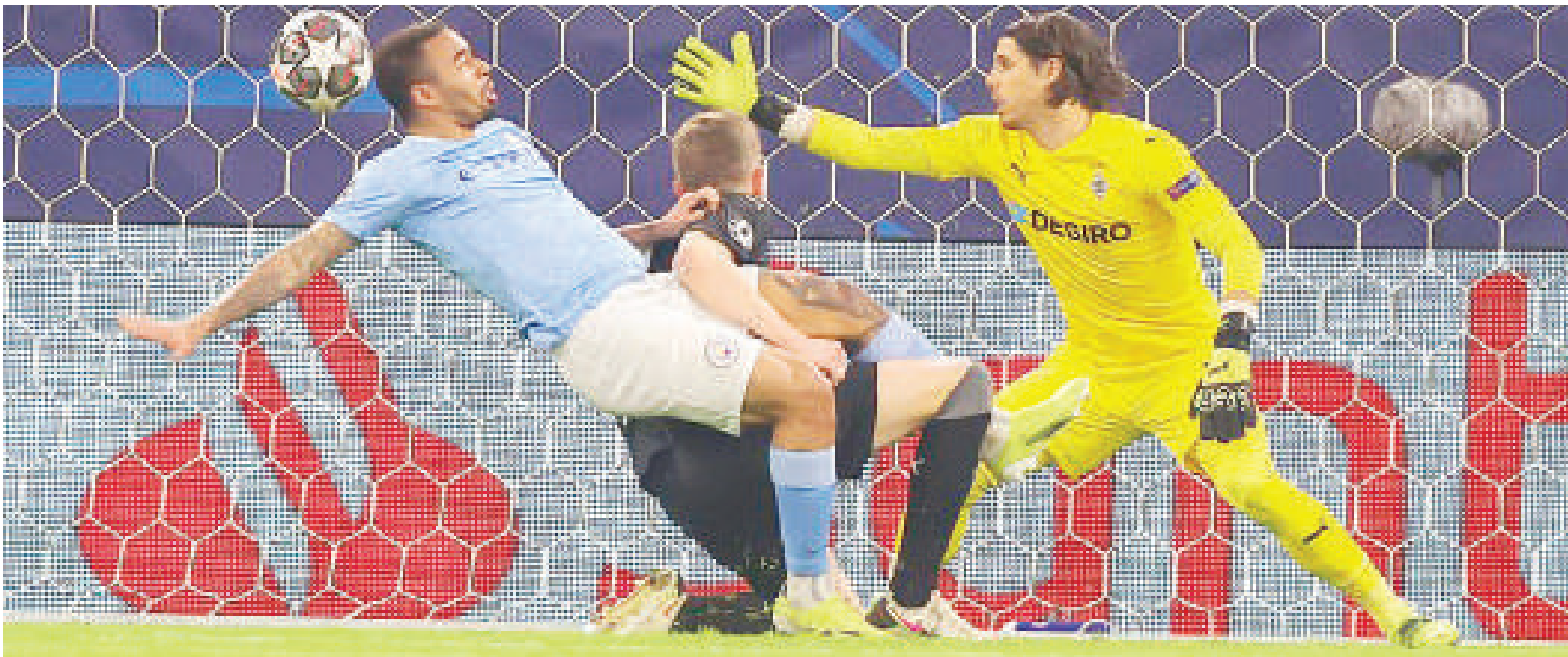
Mshambuliaji wa Manchester City, Gabriel Jesus (kushoto), akifunga bao la pili kwa timu yake huku golikipa wa Borussia Mönchengladbach, Yann Sommer (kulia), akishindwa kuokoa hatari hiyo katika mechi ya Ligi ya Mabingwa Ulaya iliyochezwa jijini Budapest, Hungary juzi usiku. City ilishinda mabao 2-0.