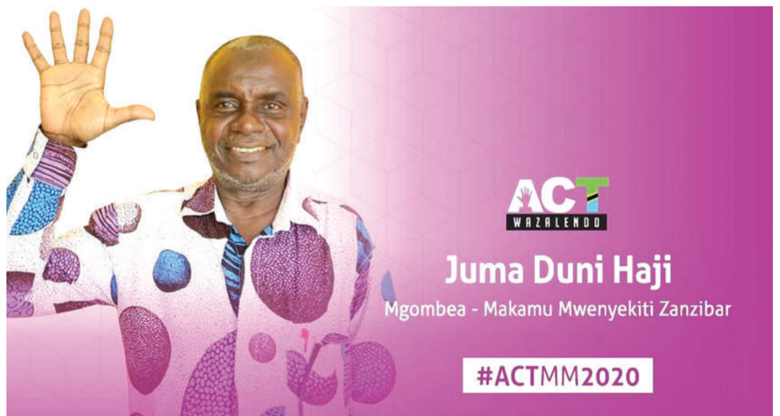
Juma Duni Haji, Mwenyekiti wa ACT Wazalendo.

Chama hicho kimefanya mikutano katika mikoa ya Dar es Salaam, Tanga, Pwani, Lindi, Mtwara, Ruvuma, Tabora na Kigoma ambapo walitumia nafasi hiyo kutambulisha Mawaziri Kivuli wa chama hicho.