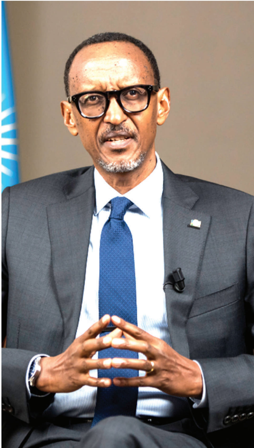
Rais Paul Kagame.

Jitihada za kuhamia kwingine zimepamba moto katika nchi nyingi ambazo hazina uwezo wa kihisia, kiimani, kinadharia au kisiasa wa kubadi-