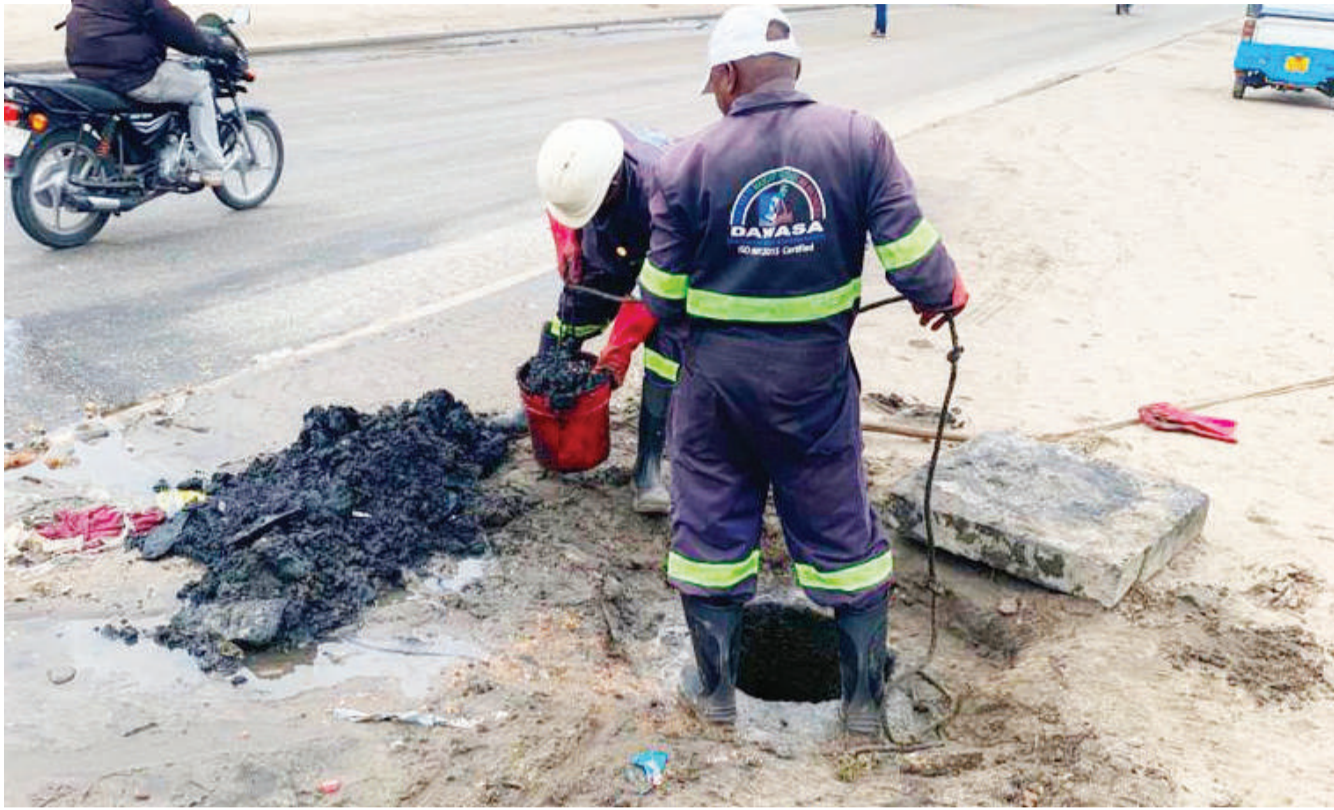
Watumishi wa Mamlaka ya Majisafi na Usafi wa Mazingira Dar es Salaam (DAWASA), wakisafisha miundombinu ya majitaka katika maeneo mbalimbali ya jijini humo jana, inayoziba kutokana na wananchi kutupa taka.