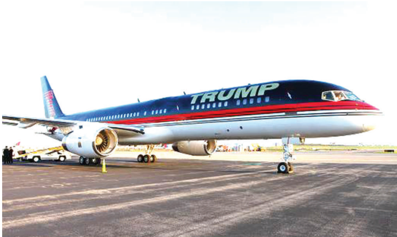
Ndege binafsi ya Rais wa zamani wa Marekani, Donald Trump