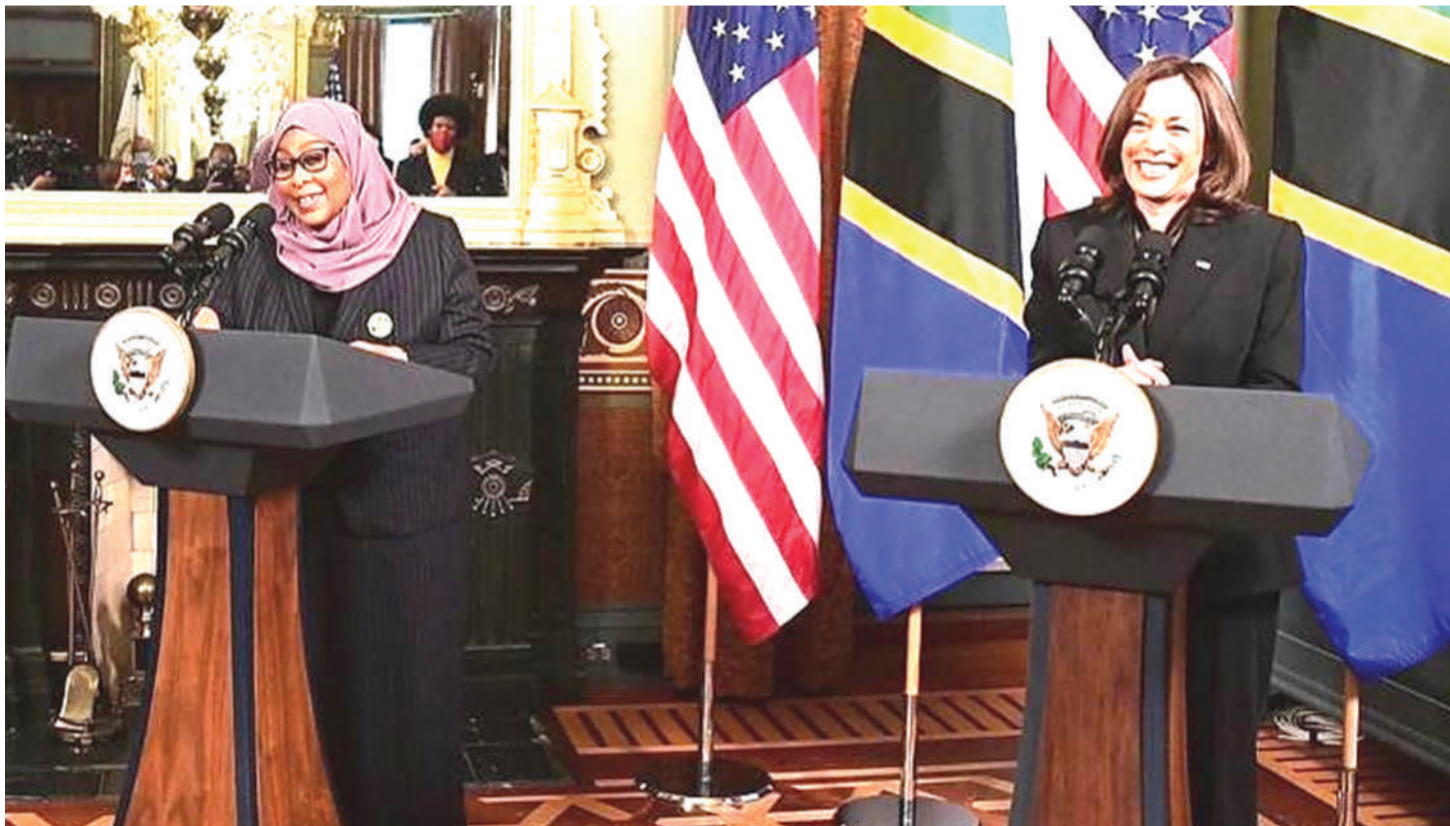
Rais Dk. Samia Suluhu Hassan, akiwa na mgeni wake Makamu wa Rais wa Marekani, Kamala Harris.

• Mwendelezo wa; Nyerere & John F. Kennedy