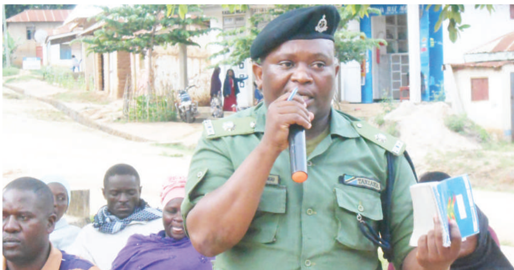
Ofisa wa Polisi Kata ya Songe, Wilaya ya Kilindi, Mkoa wa Tanga, Msaji Mwaswengu, akijibu hoja mbalimbali kutoka kwa wananchi wa kata hiyo mwishoni mwa wiki kwenye mkutano wa hadhara wa Kijiji cha Songe.

"Niombe viongozi wa serikali kuifungia baadhi ya mitandao ambayo imekuwa ikipotosha maadili kwa kuwa unakuta watoto wetu, wanapotea kwa kuangalia mitandao hii ambayo muda mwingi inaangazia habari za ushoga na maadili mengine ambayo hayafai katika nchi yetu," alisema. Licha ya kuzungumza hayo, aliitaka jamii kuwakumbuka na kuwasamea watoto wakiume kwa kuwa wanaopewa kipaumbe ni watoto wakike huku akisema kuwa watoto wakiume wamesahaulika na hawana wakuwasamea.