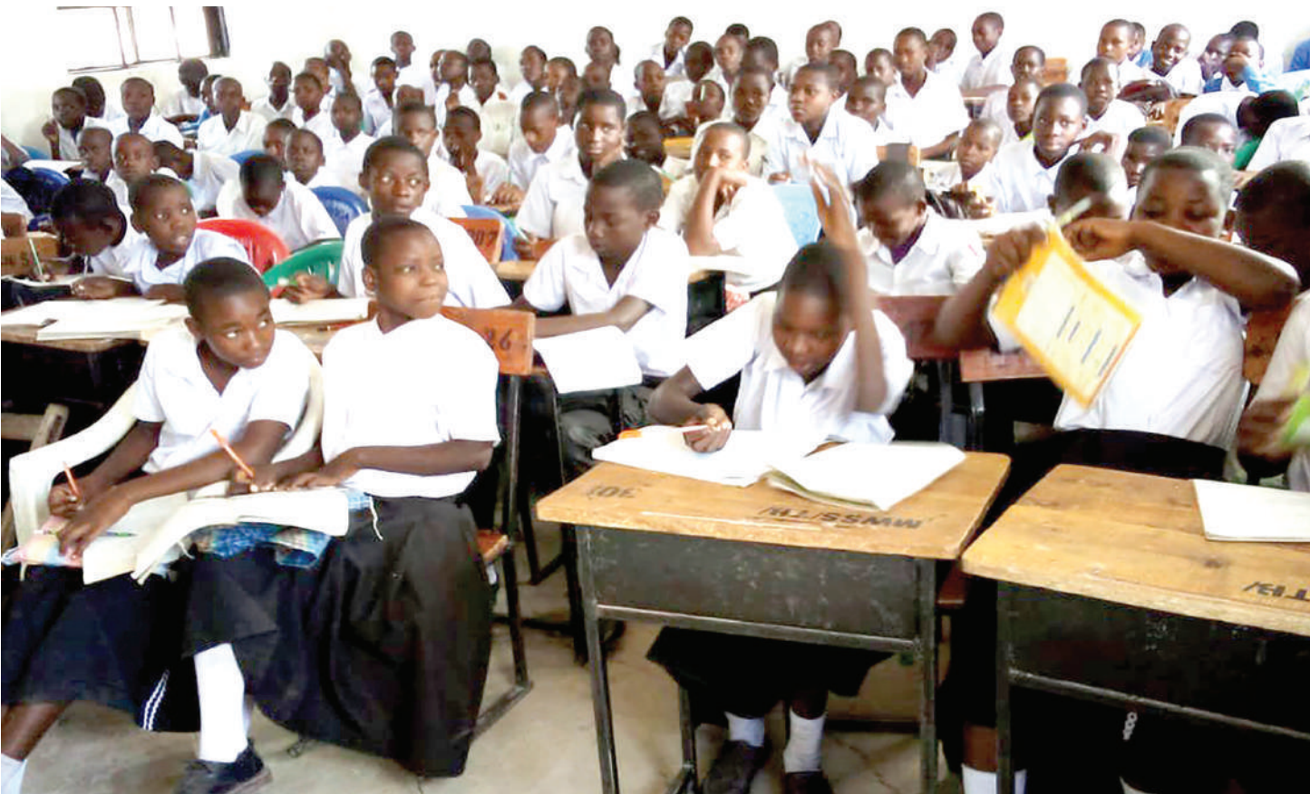
Wanafunzi wanahitaji kulindwa ili wasichana na wavulana wawe na haki sawa za kielimu.

T AZAMA maisha ya mabinti mkoani Shinyanga, mmoja ameachishwa shule ili aozwe wazazi au walezi wavune mali ambayo ni mahari inayohusisha mifugo na fedha. Yuko, anayelazimishwa kuandika majibu ya uongo kwenye mitihani ili asifaulu, ni mbinu ya kumwandaa kuozwa.