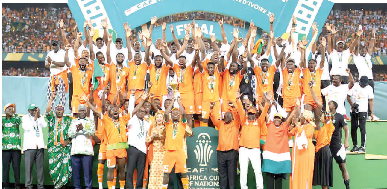
Mabingwa wa michuano ya Kombe la Mataifa ya Afrika (AFCON 2023), Ivory Coast baada ya kuwafunga Nigeria mabao 2-1 katika mechi ya fainali iliyochezwa kwenye Uwanja wa Olympique Alassane Ouattara jijini Abidjan, juzi usiku.