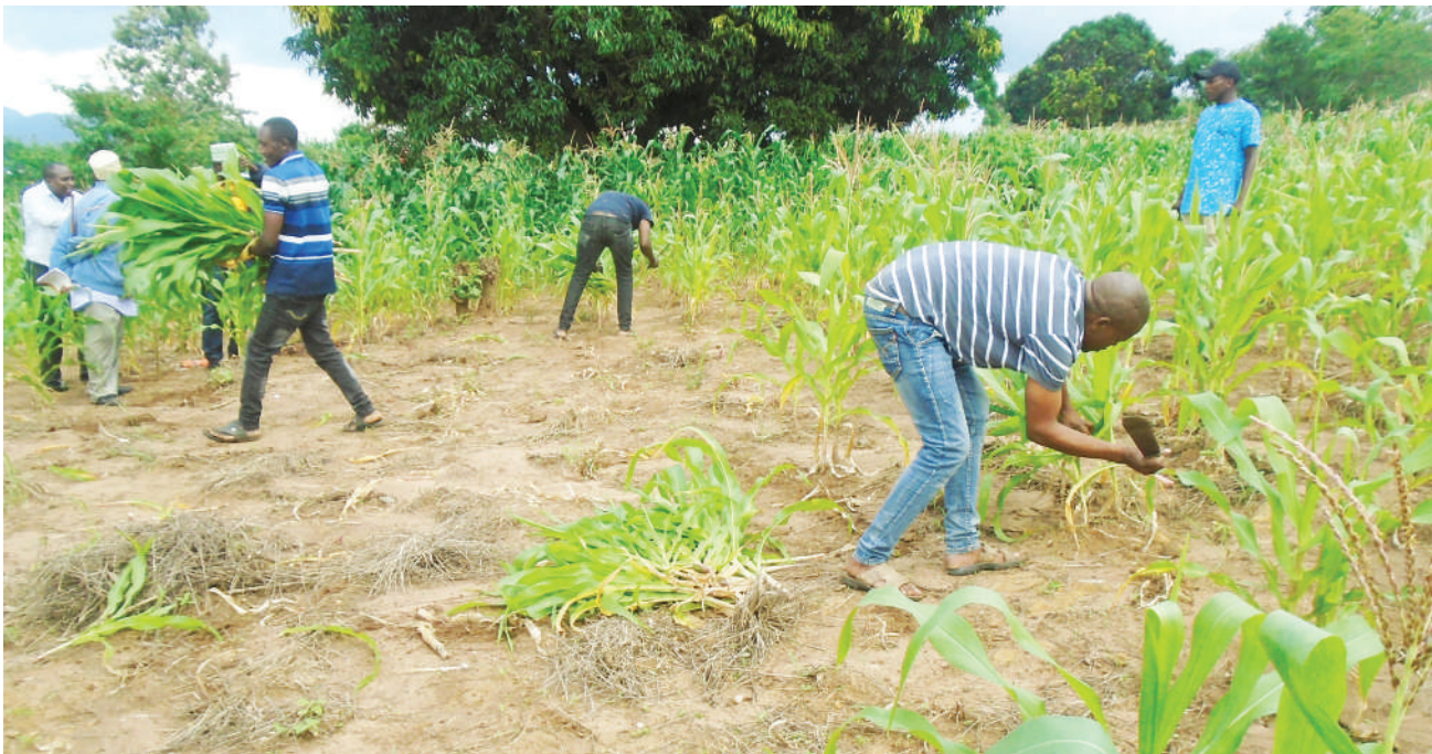
Wananchi wa Kata ya Songe, Wilaya ya Kilindi, Mkoa wa Tanga wakifika mahindi kwenye eneo lililotengwa kwa ajili ya ujenzi wa Shule ya Sekondari Seuta kidato cha tano na sita katika Kijiji cha Songe, serikali imetoa zaidi ya Sh. milioni 400.