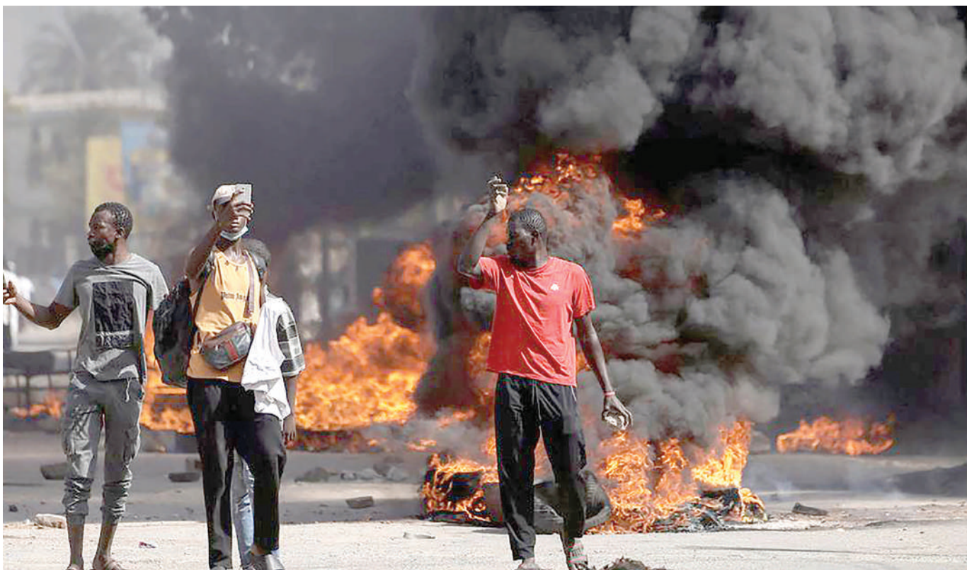
Maandamano ya Senegal katika mitaa ya Dakar. Mwandamanaji akionesha ishara huku wengine wakipiga picha wakati wa makabiliano na polisi wa kutuliza ghasia. PICHA: MTANDAO