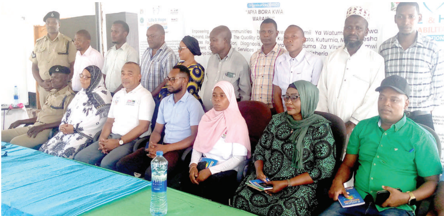
Baadhi ya wadau wanaoshiriki elimu ya kuwalinda waraibu.

K UTUMIA dawa za kulevya kunawageuza vijana kuzipenda na kuzitegemea zaidi hivyo kuwa waraibu. Lakini wanaojidunga wengi wanaambukizwa Virusi Vya Ukimwi (VVU) pamoja na homa ya ini hepatitis C.