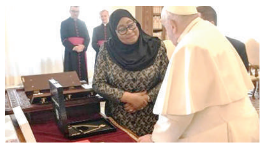
Rais Samia Suluhu Hassan akizungumza na Papa Francis Vatican jana.