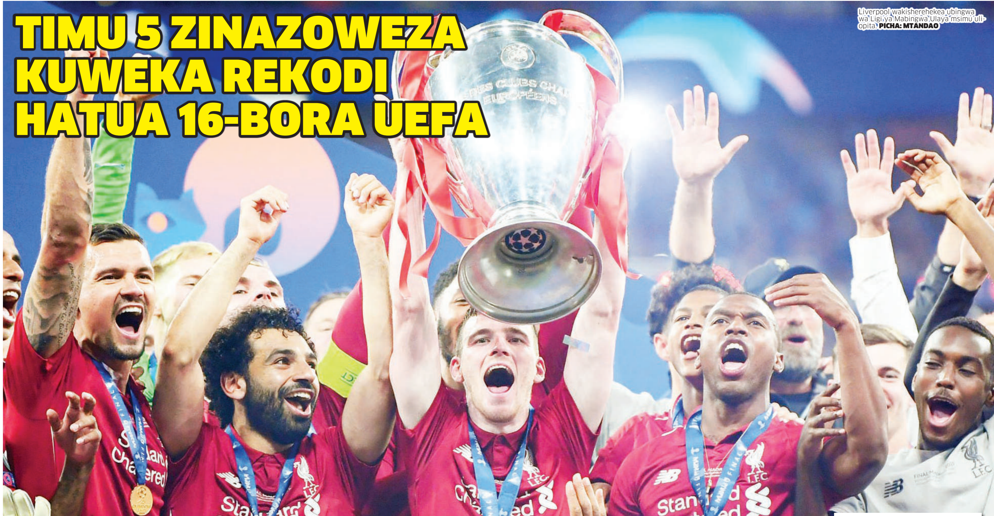
Liverpool wakishereheka ubingwa wa Ligi ya Mabingwa Ulaya msimu uliopita.