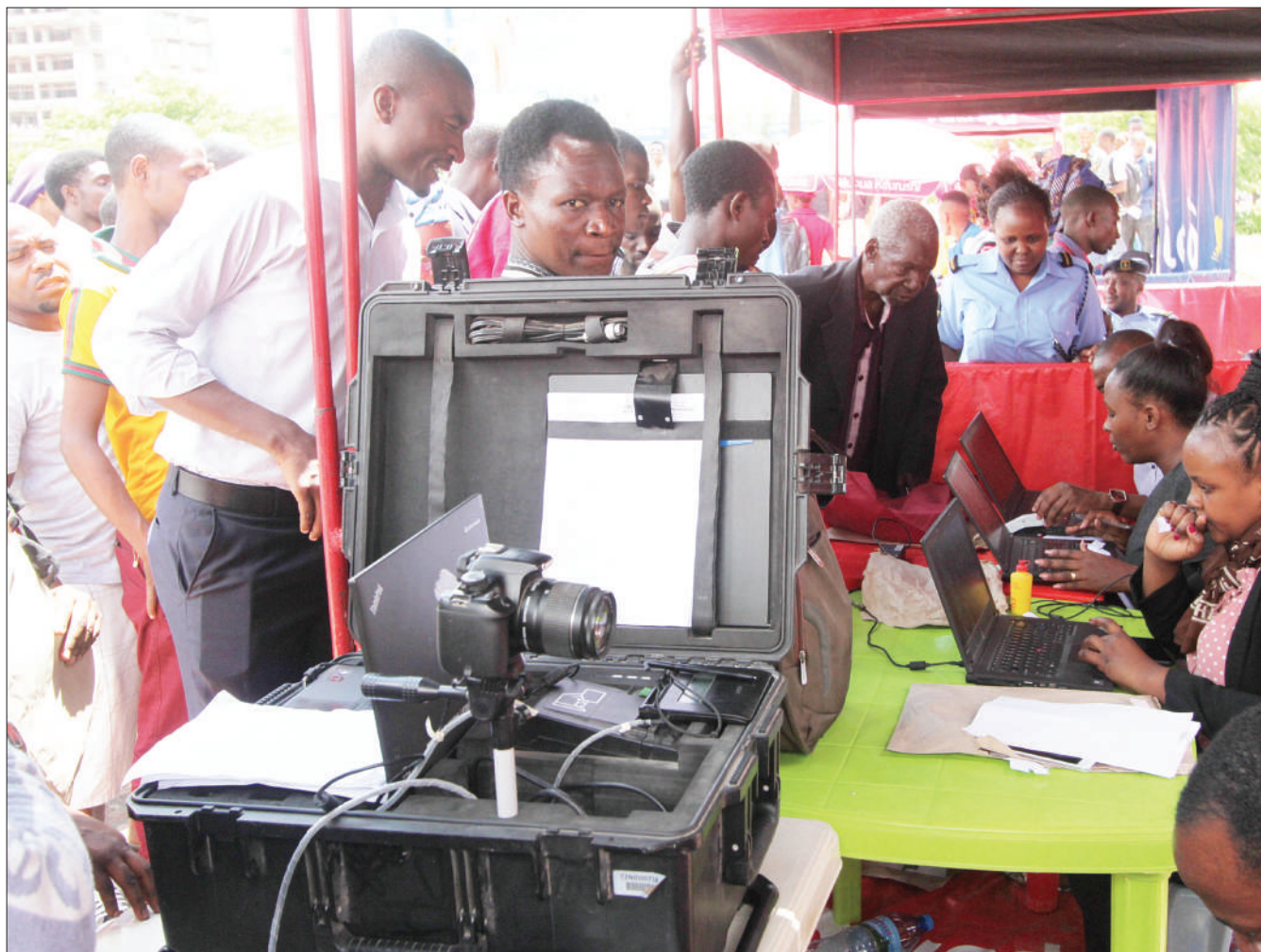
Wafanyakazi wa Mamlaka ya Vitambulisho vya Taifa (NIDA) Mkoa wa Dodoma, wakiendelea kuwahudumia wananchi, kutokana na idadi kubwa kuendelea kujitokeza kupata vitambulisho kabla ya kufungwa kwa zoezi la usajili wa laini za simu kwa njia ya vidole leo.