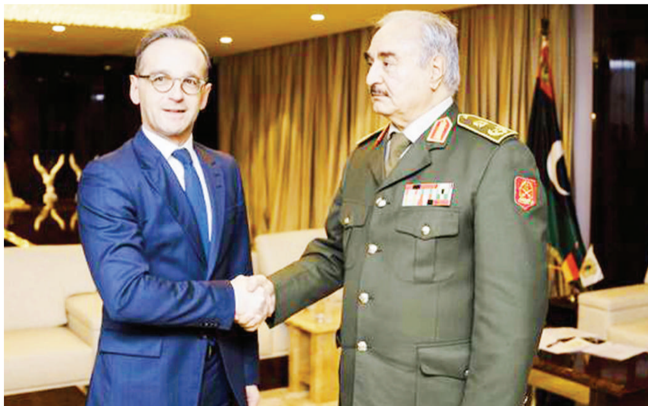
Waziri wa Mambo ya Nje wa Ujerumani, Heiko Maas (kushoto), alipokutana na Jenerali Marshal Khalifa Haftar.

Hata hivyo, Rais Trump amekana kufanya kosa lolote na ameutaja uchunguzi kuwa ni hila dhidi yake. BBC