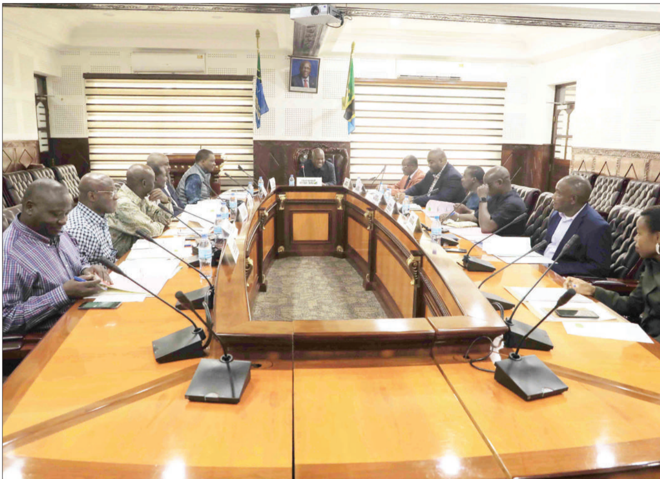
Spika wa Bunge, Job Ndugai, akizungumza kabla ya kikao cha Bodi ya Uwekezaji ya Chama cha Mabunge ya Jumuiya ya Madola Kanda ya Afrika (CPA), kilichofanyika jijini Dar es Salaam jana.

Aliwataka madiwani waji-tahidi kwenye usimamizi wa ukusanyaji mapato ya ndani ili watekelezewe miradi ya maendeleo, na kuwa mpaka sasa tangu mwaka ulivyoanza wamekusanya Sh. milioni 10 tu.