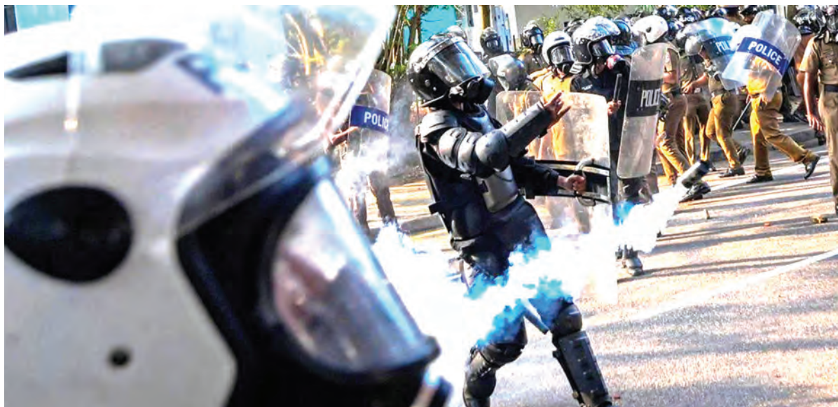
Polisi akirusha mabomu ya machozi kuwatawan-ya waandamanaji wanaoipinga serikali ya Sri Lanka wakati wa maandamano ya kutaka viongozi wa Shirikisho la Wanafunzi wa Vyuu Vikuu vya Inter waachiliwe.