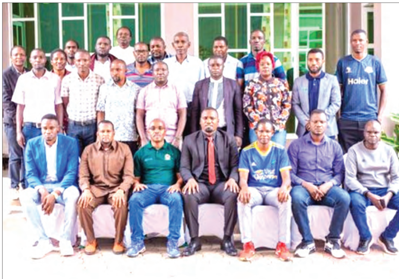
Wajumbe wa Chama cha Mpira wa Miguu cha Mkoa wa Simiyu (SIFA), wakiwa katika picha ya pamoja baada ya kumaliza mkutano mkuu wa kawaida wa chama hicho uliofanyika Jumapili iliyopita mkoani humo.

Alitoa wito kwa mashabiki na wapenzi wa riadha kujitokeza kwa wingi kushangilia kwa lengo la kuongeza molaru kwa vijana wanaoshiriki mashindano hayo.