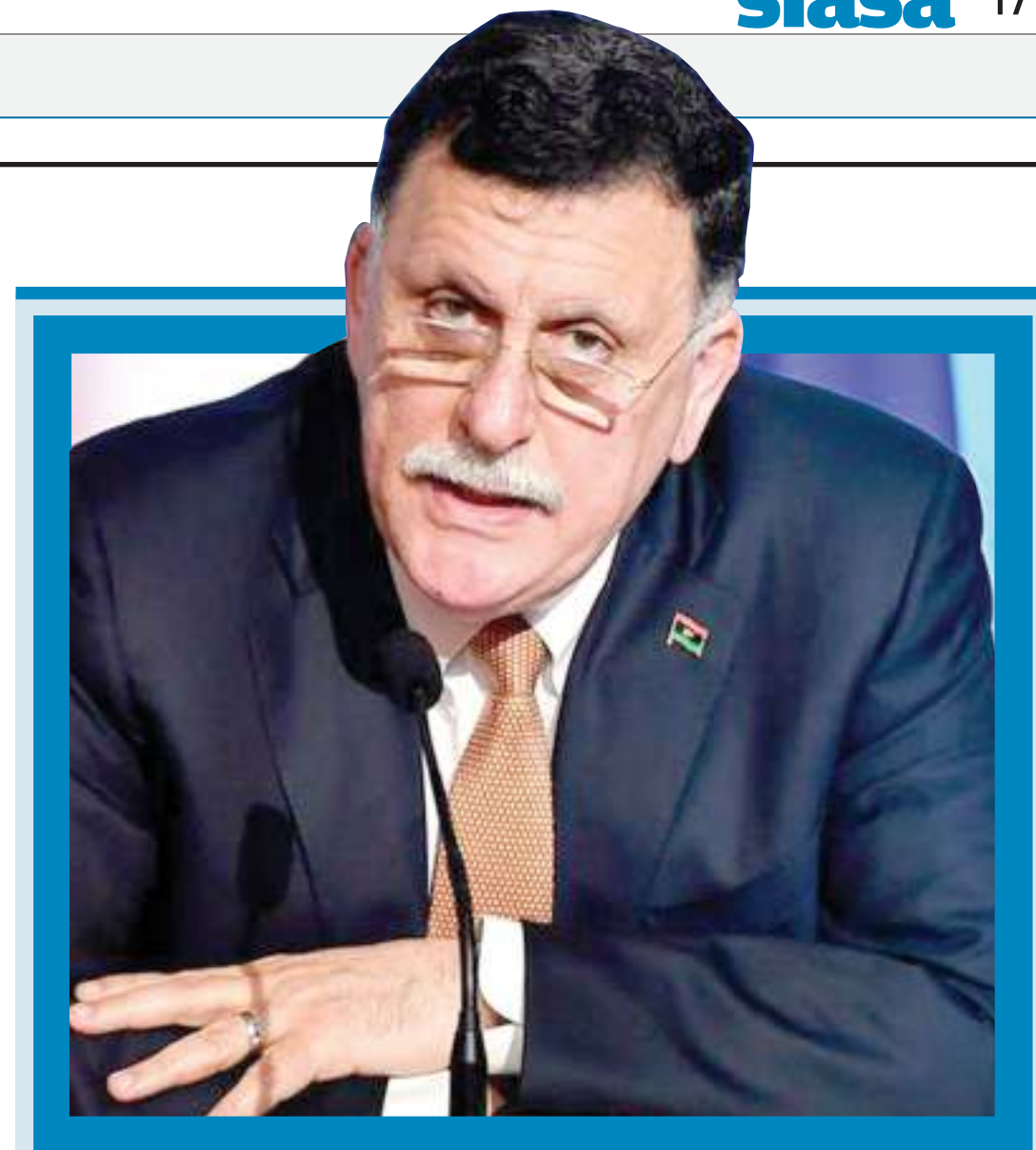
Fayez Sarraj Mkuu wa Serikali ya Libya, inayoungwa mkono na Umoja wa Mataifa.

Halikadhakika, Lowassa, mara tu baada ya kujingua kutoka CCM mwaka 2015, alijiunga na Chadema ambako aliteuliwa kuwa mgombea urais katika uchaguzi mkuu uliopita.