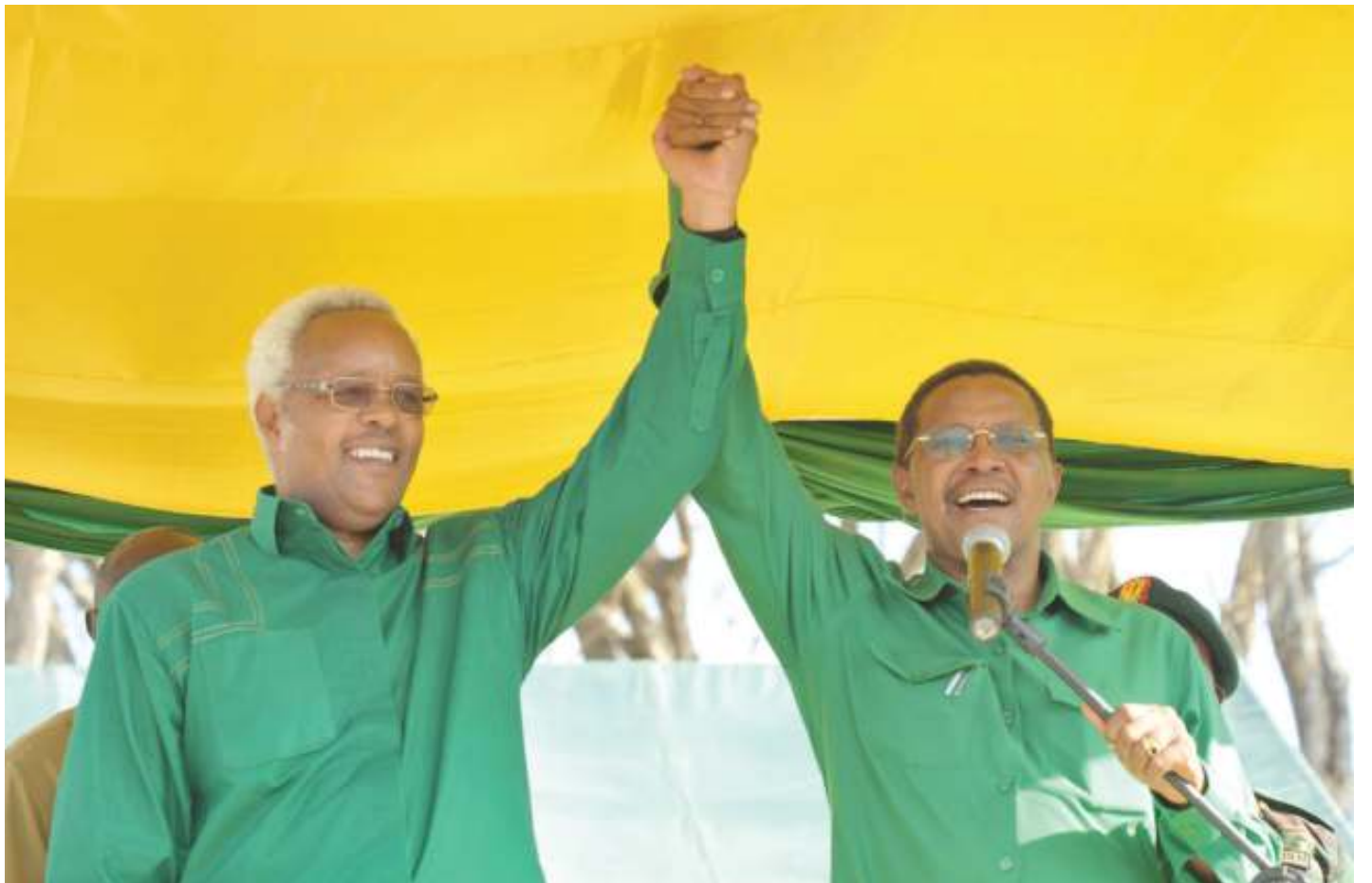
Lowassa katika maisha ya kisiasa.