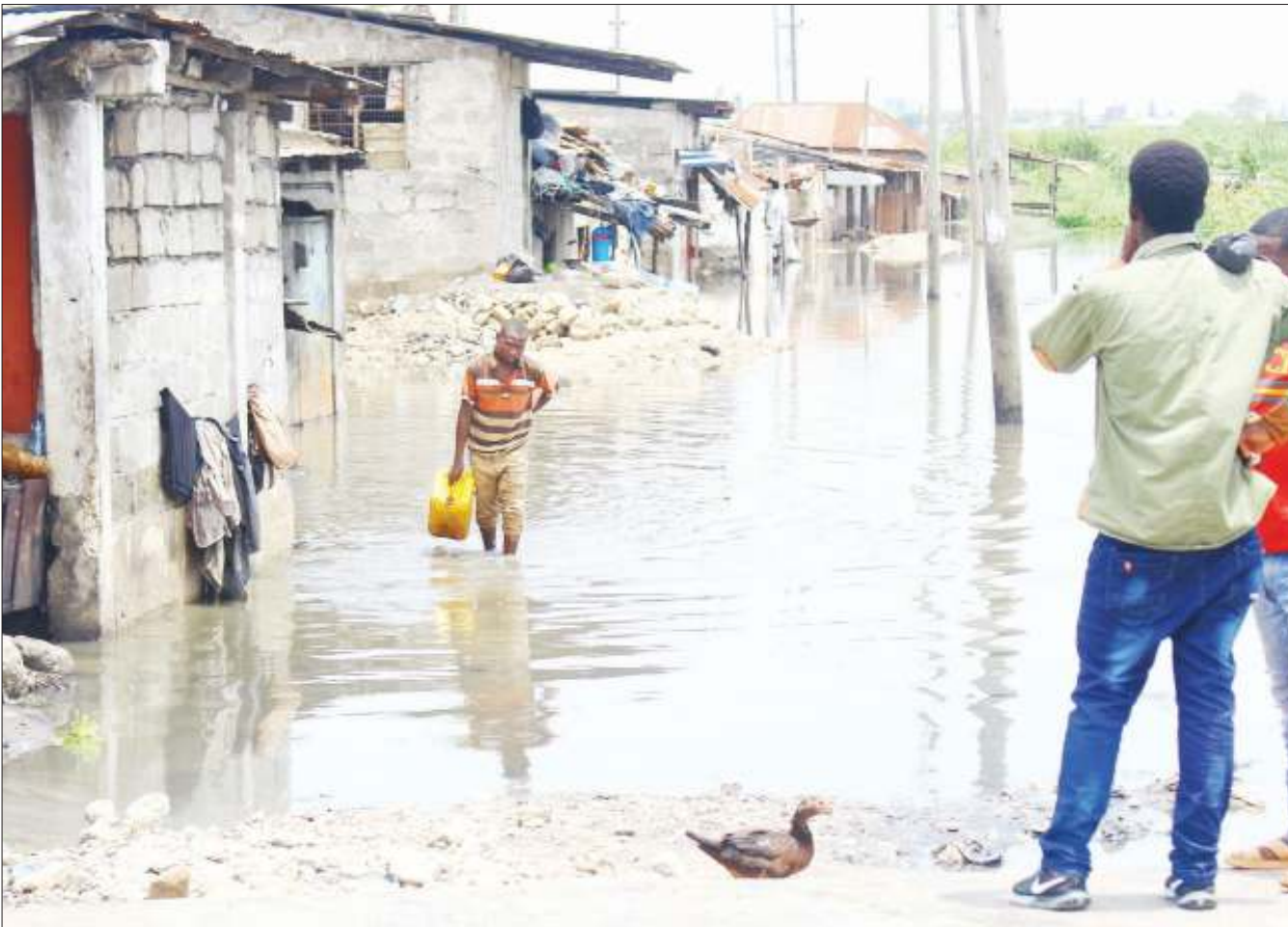
Mkazi wa eneo la Jangwani akivuka maji yaliyojaa kutokana na mvua zinazoendelea kunyesha nchini wakati akitokea katika makazi yake jijini Dar es Salaam juzi.

Mama wa familia hiyo (Nirenjigwa), amejaliwa kupata watoto wanane, lakini watano kati yao wana ulemavu wa mtindio wa ubongo na viungo.