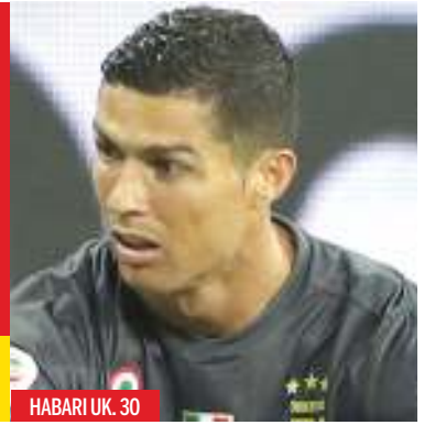
HABARI UK. 30