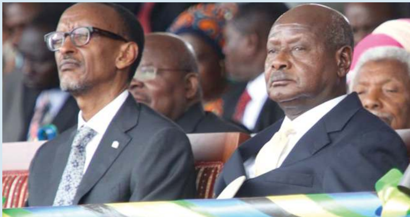
Washirika, Rais Museveni (kulia) na Kagame (kushoto) wa Uganda wakiwa pamoja kwenye majukwaa ya siasa. Wawili hao wametofautiana katika masuala mengi yanayoweza kusababisha uhasama mkubwa.

yamekwama kwenye mpaka wa Gutuna kwa wakati huo.