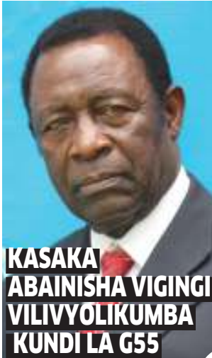
KASAKA ABAINISHA VIGINJI VILIVYOLIKUMBA KUNDI LA G55