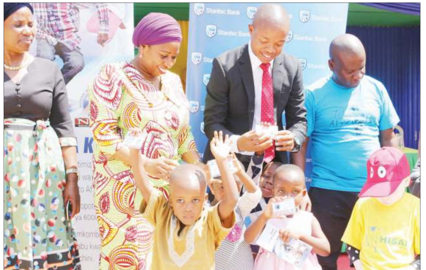
Waziri wa Afya, Maendeleo ya Jamii, Jinsia, Wazee na Watoto, Ummu Mwalimu, akiwa na watoto baada ya kukabidhi kadi za bima ya afya (NHIF) za Toto Afya zilizodhaminiwa na benki ya Stanbic Tanzania kwa watoto wa kituo cha Hisani jijini Mwanza. Msaada huo ulitolewa na benki hiyo kwa watoto 105 wanaoishi katika mazingira magumu mkoani hapo.

Alisema moja ya maeneo ya kipaumbele yanayotekezwa na wizara ni kuongeza tija katika uzalishaji kwa kuimarisha upatikanaji wa pembejeo, na kuimarisha huduma za ugani.