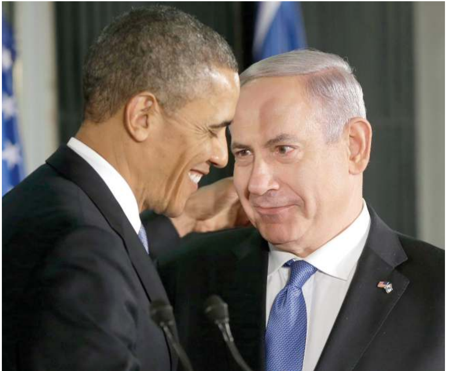
Mtuhumiwa wa rushwa, Benjamin Netanyahu, akiwa na mgeni wake Rais wa zamani wa Marekani, Obama, kwenye moja ya mikutano ya kutafuta ufumbuzi wa migogoro ya Mashariki ya Kati baina ya Wayahudi na Wapalestina.

Ni wazi kuwa kuingia Maasiyahu licha ya kuwa ni kitendawili, haitakuwa tukio la kushangaza.