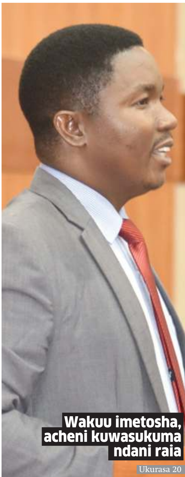
Wakuu imetosha, acheni kuwasukuma ndani raia