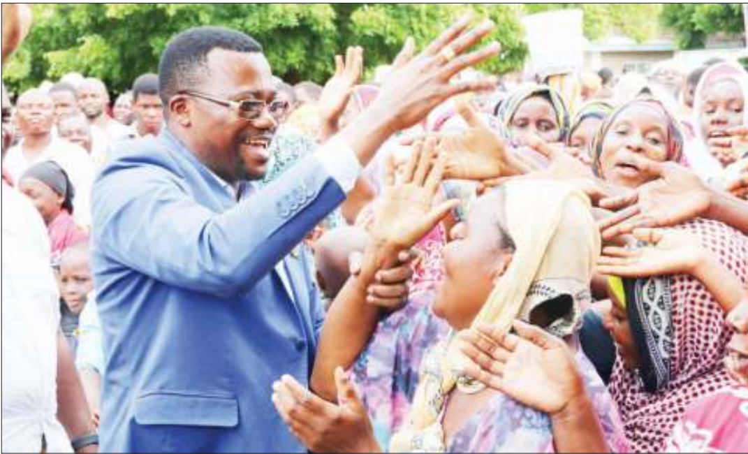
Waziri wa Mifugo na Uvuvi, Luhaga Mpina, akisalimiana na wananchi wa Kilwa Kivinje baada ya kuwasikiliza wavuvi wa eneo hilo jana na kutangaza kuundwa kwa kanda kuu ya ulinzi wa rasilimali za uvuvi Bahari ya Hindi.