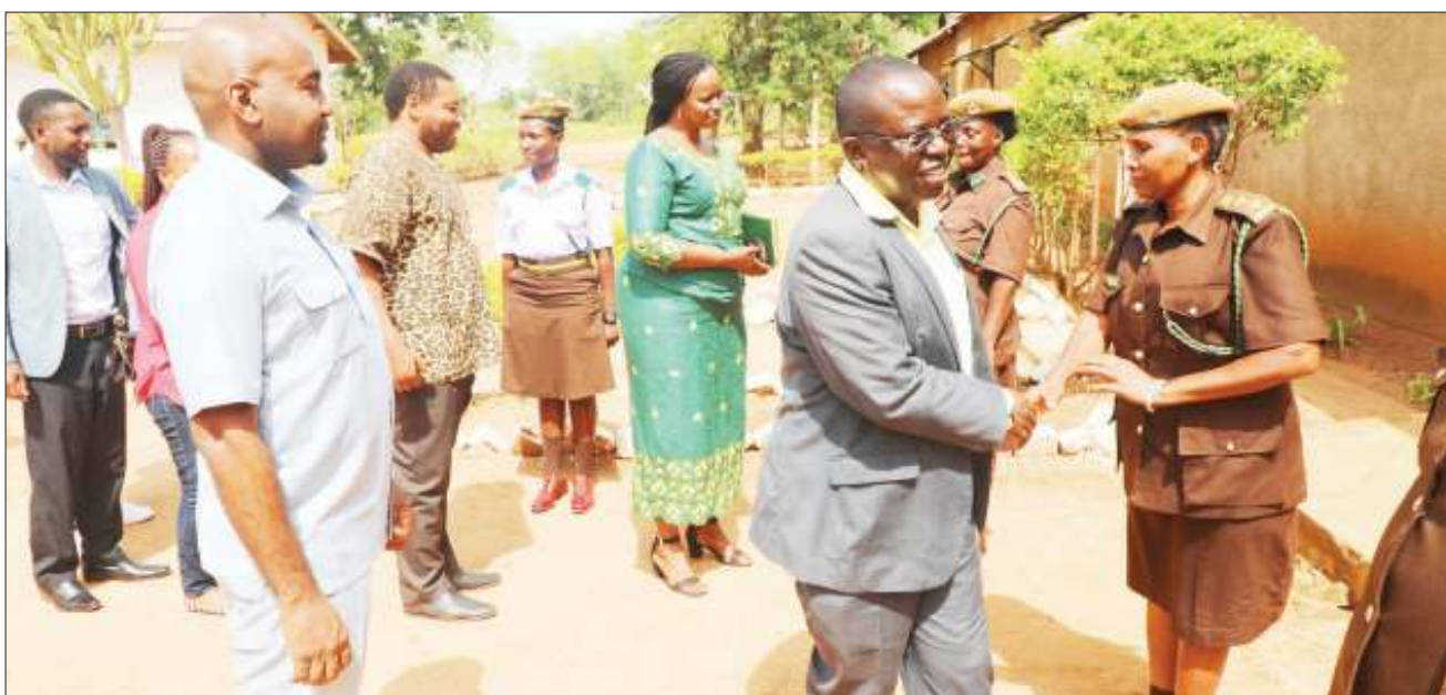
Naibu Waziri wa Mambo ya Ndani ya Nchi, Mhandisi Hamad Masauni (kushoto), akiwaongoza wajumbe wa Kamati ya Kudumu ya Bunge ya Masuala ya Ukimwi walipowasilika katika Gereza la Wanawake Kingolwira mkoani Morogoro, kuzungumza na wafungwa ikiwa ni ziara ya kufuatilia utekelezaji wa serikali.