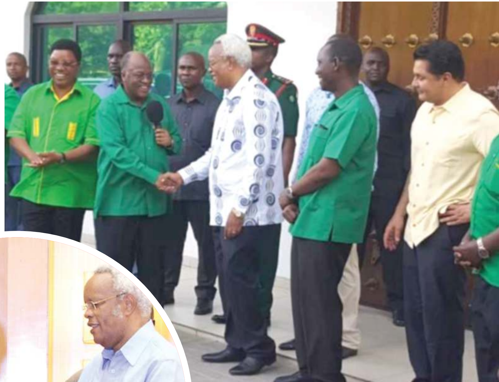
Edward Lowassa akisalimiana na Mwenyekiti wa CCM, Rais John Magfuli baada ya kuhamia CCM Ijumaa iliyopita. Wanaoshuhudia ni Waziri Mkuu, Kassim Majaliwa (kushoto), Katibu Mkuu wa CCM, Dk. Mashiru Ali (wa pili kulia) na mwana-CCM Rostam Aziz.

Tatizo linaloonekana sasa ni kwa vyama kuan- daa viongozi wenye msimamo fulani kwa wakati ukifika muda usiofahamika wanaondoka na kubadili msimamo yao."