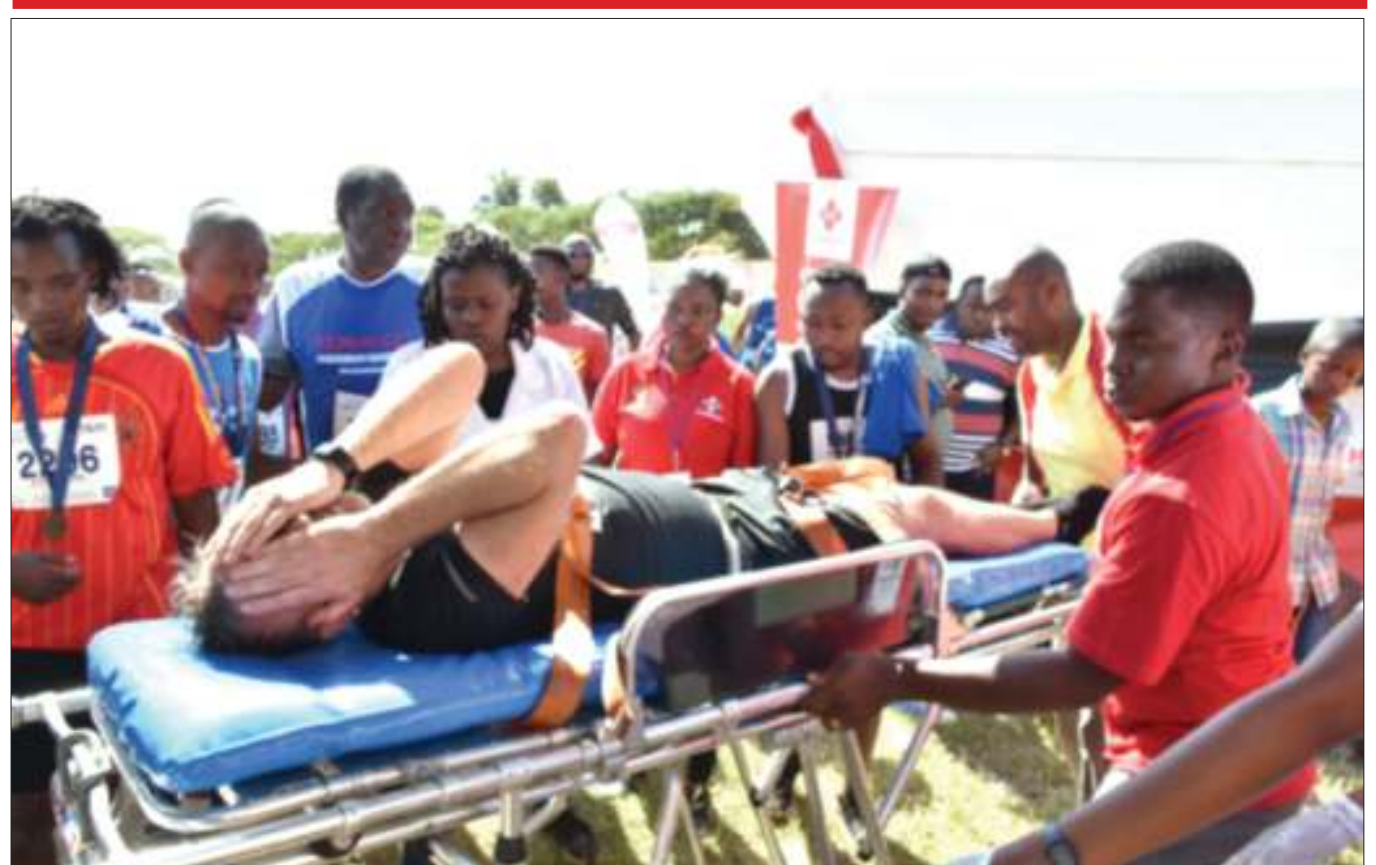
Mmoja kati ya washiriki wa mbio za Kili Marathon, akipatiwa huduma ya kwanza na AAR Healthcare wakati wa mbio hizo zilizofanyika Moshi mkoani Kilimanjaro mwishoni mwa wiki.

Katika mchezo huo wa Jumapili iliyopita kwenye Uwanja wa Kamarage, Stand ilikubali kipigo cha mabao 2-0 kutoka kwa Simba yote yakifungwa na nahodha John Bocco.