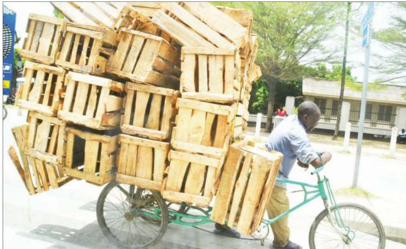
Mwendesha guta akiwa amelisheni mizigo katika Barabara ya Morogoro, eneo la Magomeni Mwembechai, jijini Dar es Salaam jana, kitendo ambacho ni hatari kwa usalama barabarani.

Aliwataka wadau wa kilimo kutoka ndani na nje ya nchi kujikita katika kutoa elimu na kuwasaidia wakulima kupata mbinu na teknolojia za kisasa za kuhifadhi mazao yao ili waweze kunufaika na jasho lao.