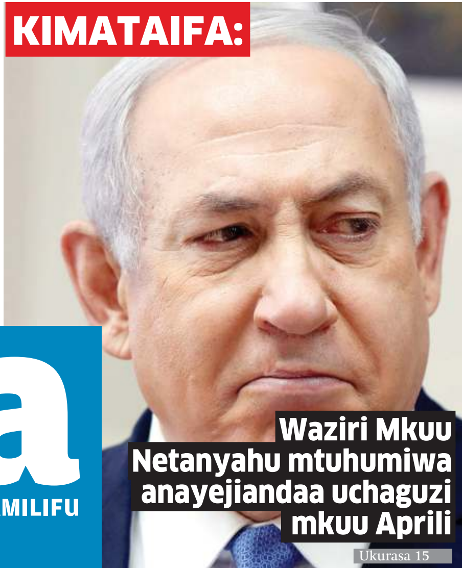
Waziri Mkuu Netanyahu mtuhumiwa anayejiandaa uchaguzi mkuu Aprili