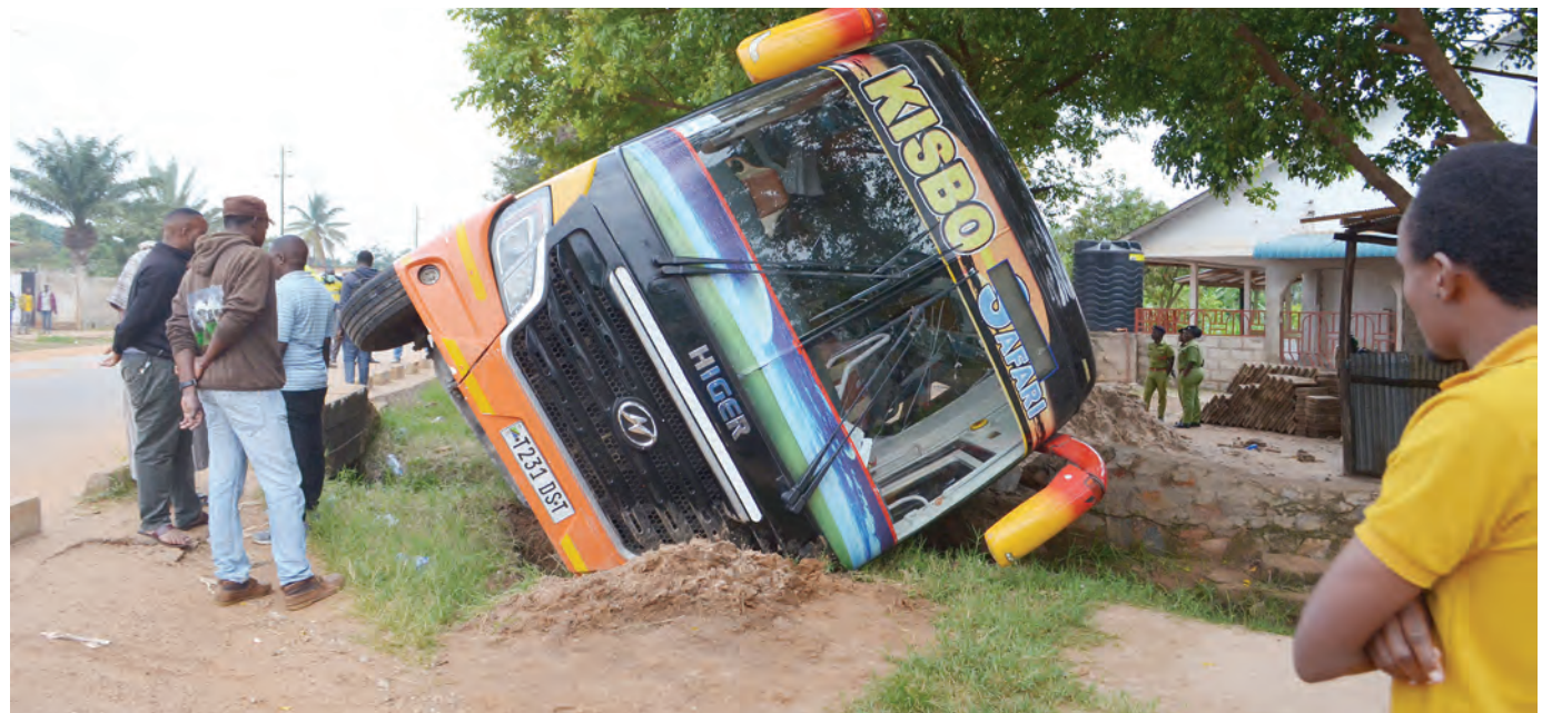
Wananchi wa Kata ya Nyasubias, wakiangali basi la kampuni ya Kisbo Safari lenye namba za usajili T.231 DST, likiwa limeanguka wakati dereva wake alipokuwa akijaribu kumkwepa bibi kizee aliyekuwa akivuka barabara ya Isaka, wakati likitokea kituo kikuu cha mabasi mjini Kahama, mkoani Shinyanga juu.

"Tunaendelea kuchunguza katika kipindi hiki cha robo ya kwanza ya mwaka, tumeendelea kufanya ufuatiliaji na uchunguzi na tumewaelekeza wahusika wa mikopo kufanya marejesho ili kufikia malengo ya mfuko huo kuwanufaisha wakulima kwani kama unakopa na unarejesha ni wazi kwamba unatoa fursa na wengine kuchukua mikopo hiyo," alisema Msuya.