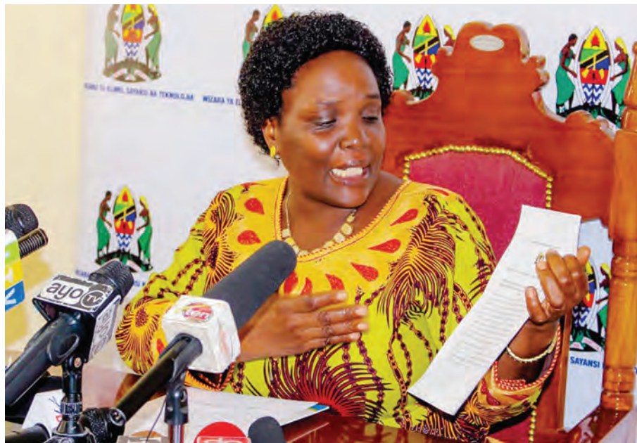
Waziri wa Elimu, Sayansi na Teknolojia Prof. Joyce Ndalichako.

Kwa kuzingatia mahudhurio shuleni ya siku tano kwa wiki, wanafunzi wamekaa darasani kwa siku 110, ambayo kila siku ya masomo walikuwa na saa mbili za ziada inayowapa jumla ya saa 220 wakati zililopotea kwa corona zilikuwa saa 78, hivyo kuna ziada isiyopungua saa 140, sawa na wiki 20.