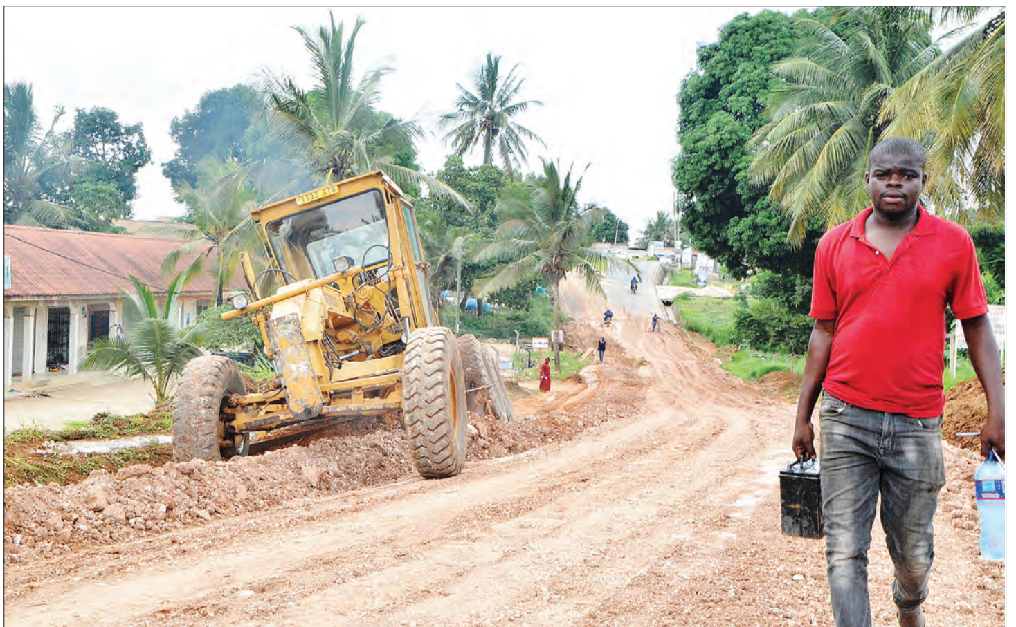
Mapfundi wakiendelea na ujenzi wa barabara inayounganisha eneo la Kimara na Goba, jijini Dar es Salaam jana, kwa kiwango cha changarawe.

Hata hivyo, Nombo alisema watuhumiwa wameahidi kuendelea kurejesha fedha hizo.