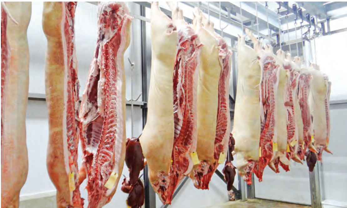
Nyama ya nguruwe ikiwa buchani.

• Unataka kula? Zingatia mambo haya hapa