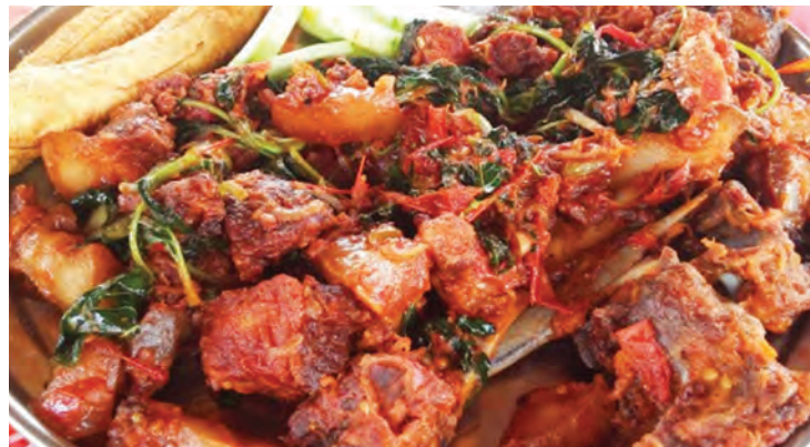
Nyama ya nguruwe tayari kwa kuliwa.

Virusi hivyo havina tiba wala chanjo. Njia pekee ni kupika nyama na kuhakikisha imeiva vizuri, pia ugonjwa unapolipuka, ni kupiga marufuku usafirishaji.