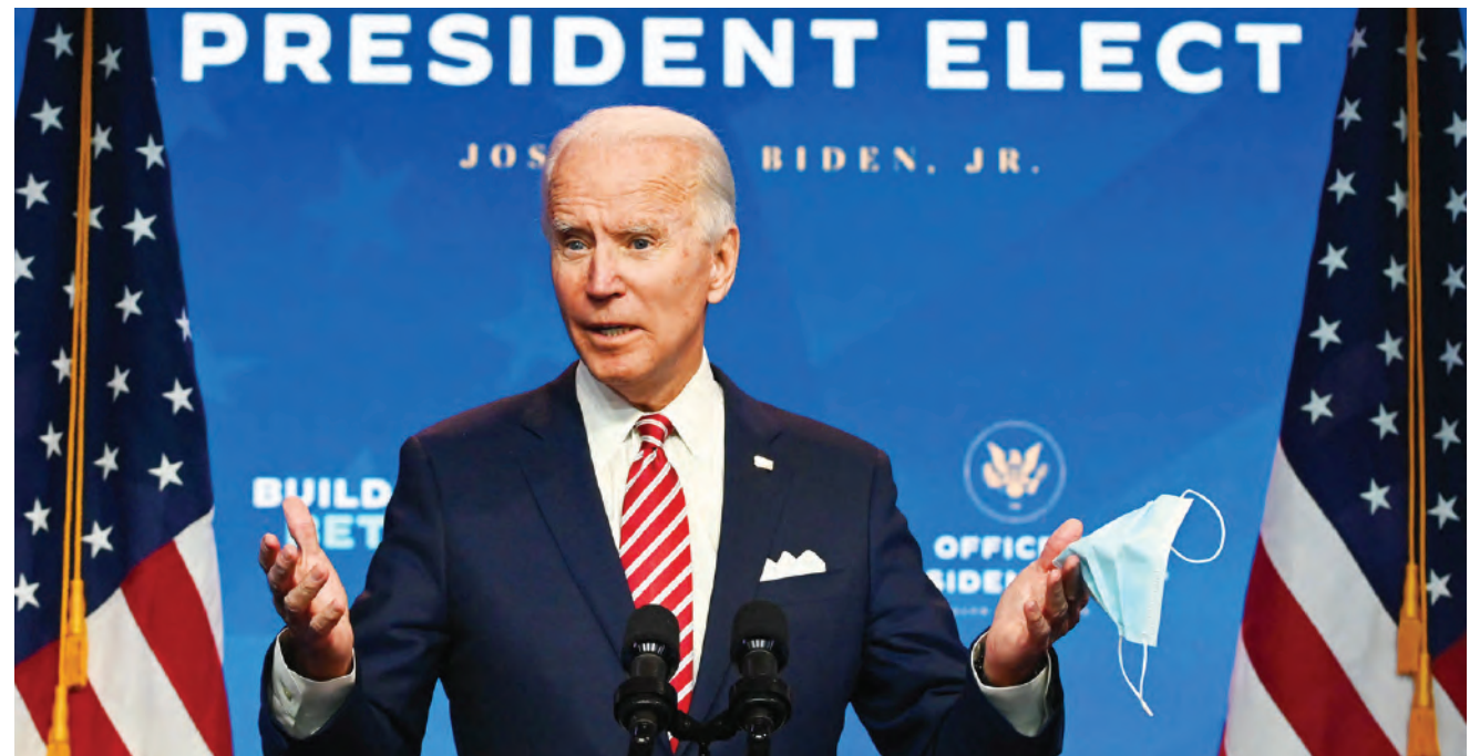
Rais mpya wa Marekani, Joe Biden, ambaye aliapishwa jana kuwa rais wa taifa hilo.

Saa chache kabla ya kuondoka, Rais Trump alitoa msamaha kwa wanamuziki, Lil Wayne na Kodak Black na aliyekuwa Meya wa mji wa Detroit, Kwame Kilpatrick, huku aliyewahi kuwa mshauri wake, Steve Bannon, akitarajiwa pia kusamehewa. DW