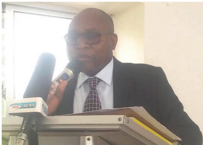
Waziri wa Maliasili na Utalii, Dk. Damas Ndumaro, akiwa katika mkutano ndani ya Pori Tengefu la Kilombero wiki hii.

Dk. Ndumbaro anasema, kinachoonekana kimatendo kwenye bonde hilo hadi kufikia uvamizi ni hujuma ya watu yenye athari kwa Mradi wa Umeme wa Mwalimu Nyerere, zikiwamo kuwapa wanavijiji mbegu za mazao zi-