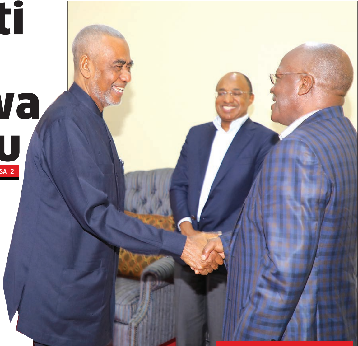
Rais John Magufuli akimkaribisha Makamu wa Kwanza wa Rais wa Zanzibar, Maalim Seif Shariff Hamad, alipowasili Ikulu ndogo ya Chato, mkoani Geita jana. Katikati ni Rais wa Zanzibar, Dk. Hussein Ali Mwinyi.