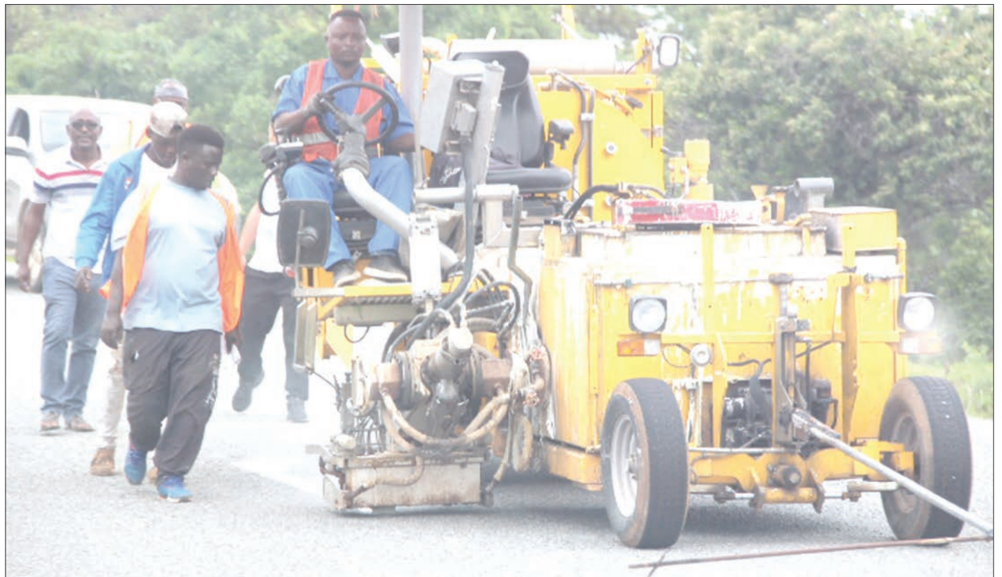
Mafundi wakiendelea na kazi ya kuweka alama za barabarani katika barabara kuu ya Chunya na Makongolosi, mkoani Mbeya jana.

Alisema sababu iliyochangia alizeti kuadimika kwa wakulima ni mvua za msimu uliopita kuwa nyingi hali iliyoharibu zaidi hilo na wakulima kuvuna mazao kidogo ambayo hayajakidhi mahitaji ya soko.