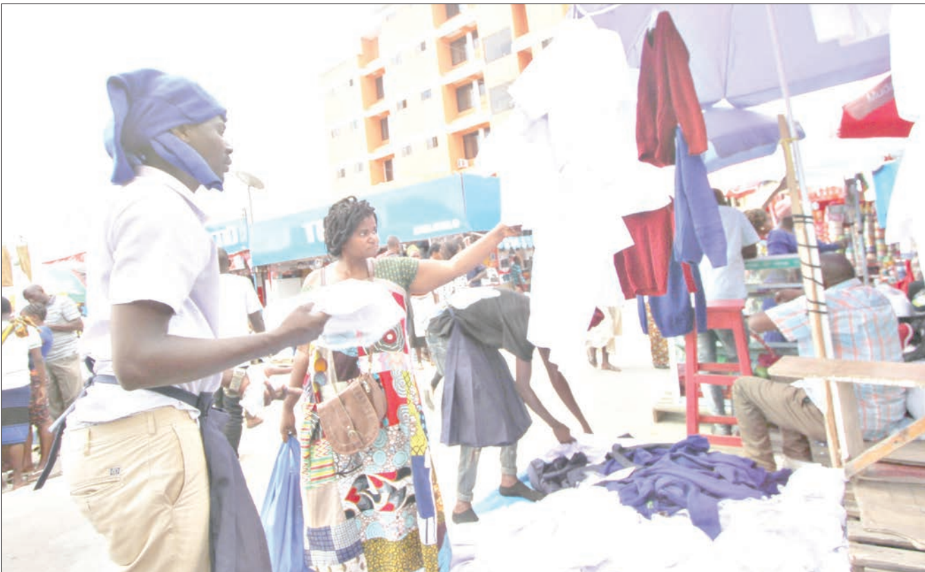
Mkazi wa Jiji la Dodoma (katikati), akichagua sare za shule kwa ajili ya mtoto wake, katika Mtaa wa Oneway, jijini humo jana.

Alisema wakifanya hivyo itawasaidia kwa kiasi kikubwa vijana wengi kujikwamua kiuchumi kupitia mikopo na fursa nyingine zinazotolewa na serikali.