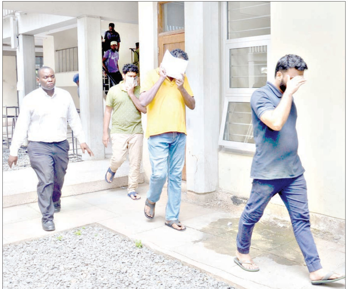
Watuhumiwa wa kesi ya kuongoza genge la uhalifu na kukutwa na madini bila ya kibali yenye thamani ya zaidi ya Sh. milioni 42, wakiwa chini ya ulinzi baada ya kusomewa mashtaka yao Mahakama ya Hakimu Mkazi Kisutu, jijini Dar es Salaam jana.

"Vyombo vyote vipo kazini, tutaendelea kuwakamata, tunazo taarifa wapo wengine, tutawakamata wote, niwaombe watu wote kwenye mgodi huo waache mara moja, hatutakuwa na mza-ha kwenye hili," alisema Kiswaga.