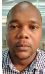
Na Halfani Chusi