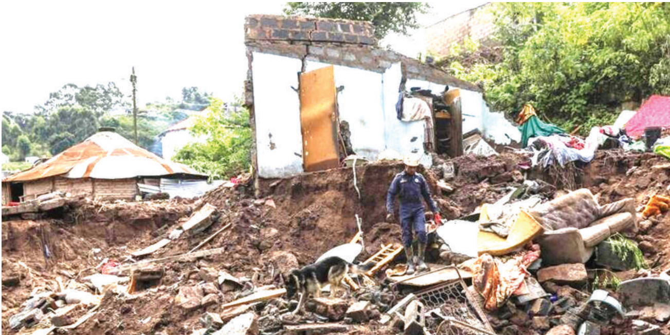
Ofisa wa uokoaji wa Jeshi la Polisi Afrika Kusini akiwatafuta watu waliopotea kwenye vifusi kutokana na mafuriko, jana.