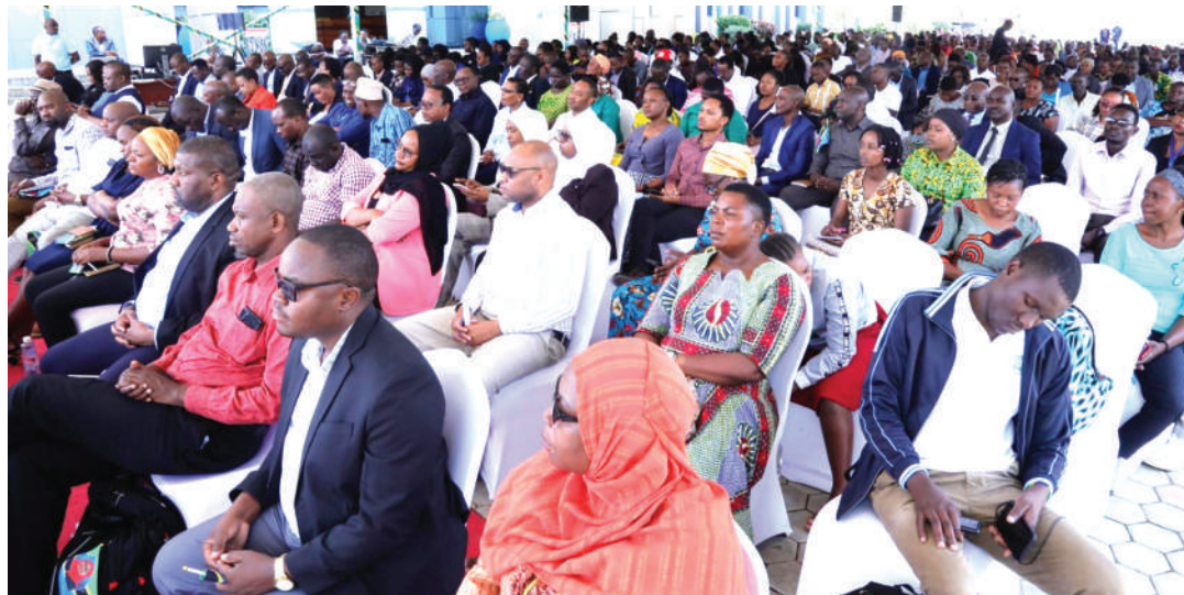
Baadhii ya wadau wa afya, katika mkutano unaozungumzia Ripoti ya Afya ya Watoto wenye umri chini ya miaka mitano.

Serikali nayo imekuwa ikihamasisha kila mtoto anayezaliwa, apelekwe kliniki kwa utaratibu uliowekwa, ili apate matibabu sahihi, ikiwamo kinga za chanjo.