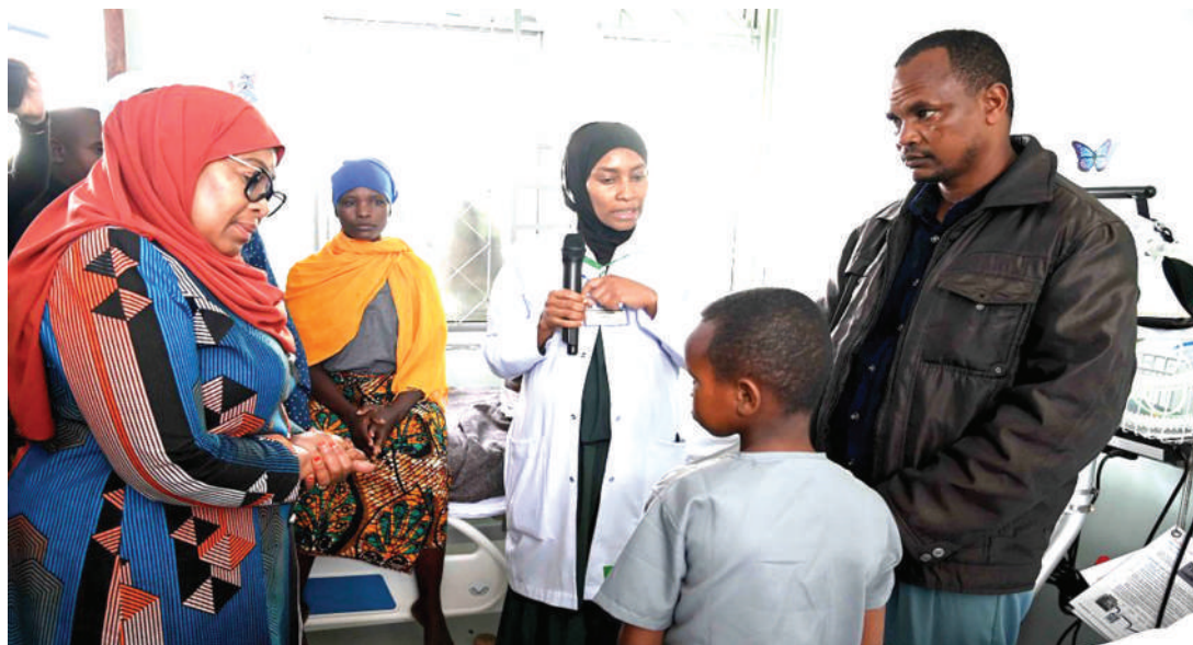
Rais Samia Suluhu Hassan, akiwajulia hali wagonjwa wanaopatiwa matibabu katika Hospitali ya Rufani Mkoa wa Manyara, iliyopo mjini Babati, Novemba mwaka jana.

Ni mazingira yanayotajwa kwamba, hata watumishi waliokuwapo hospitalini idadi yao walikuwa chini ya asilimia 32 ya hitaji halisi, hali kama hiyo ikitawala kwenye maabara na vifaa vya kitabibu.