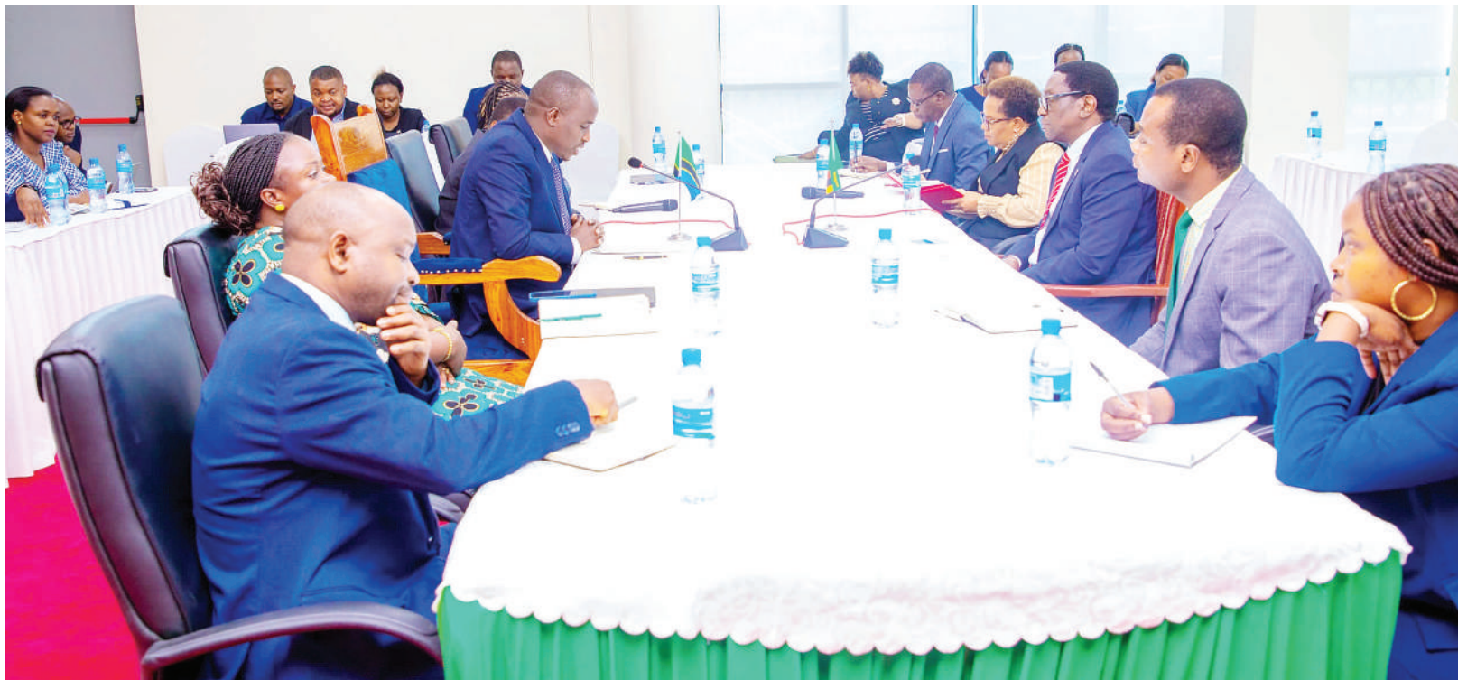
Naibu Waziri Mkuu na Waziri wa Nishati, Dk. Doto Biteko (wa tatu kushoto), akizungumza na Waziri wa Masuala ya Nishati wa Zambia, Peter Kapala na ujumbe wake (kulia) katika kikao kuhusiania ya Serikali ya Tanzania na Zambia kuanza ujenzi wa bomba la inchi 24 la kusafirisha mafuta safi kutoka Tanzania kwenda Zambia jana jijini Dodoma.