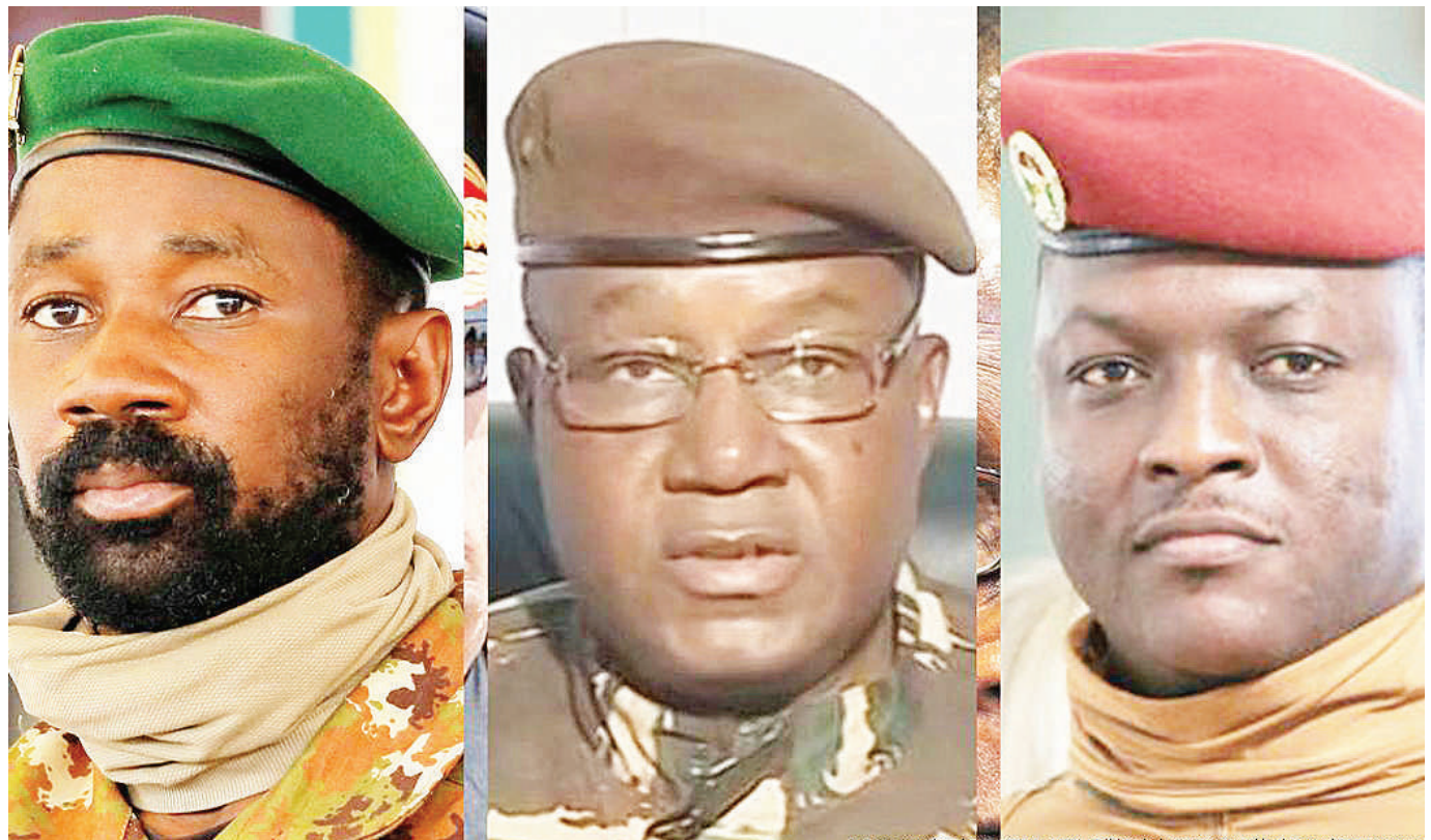
Watawala wa Kijeshi wa Mali, Assimi Goita (kushoto), Niger; Abdourahamane Tiani (katikati) na Burkina Faso, Ibrahim Traoré, ambao wametangaza kuyatoa mataifa yao kutoka ECOWAS.