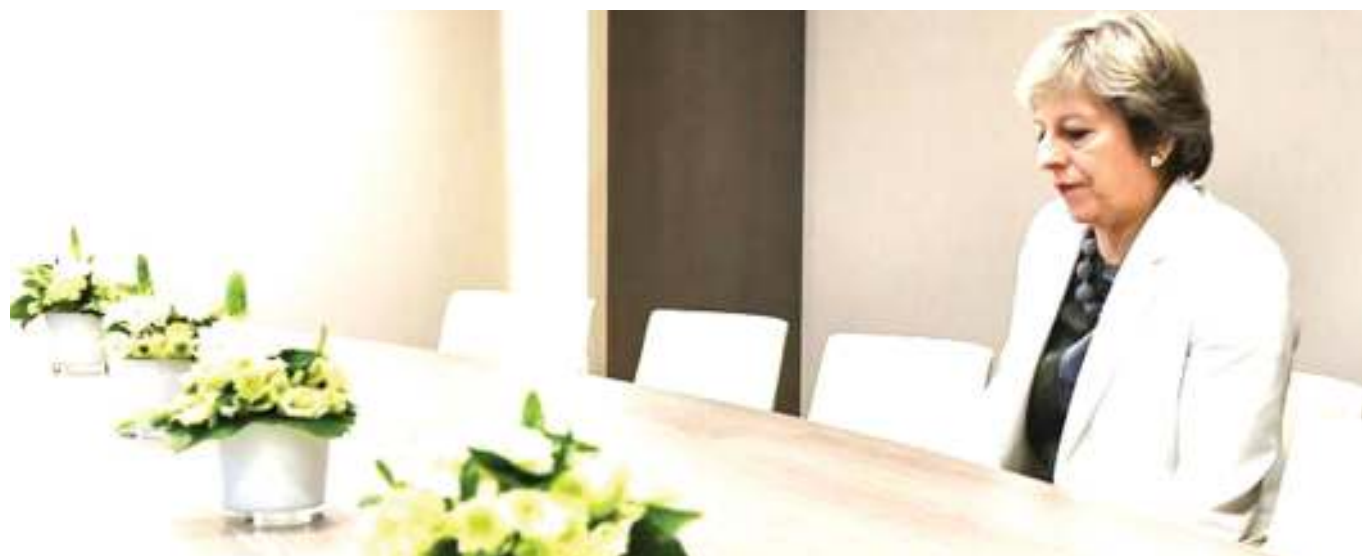
Waziri Mkuu wa Uingereza, Theresa May, ambaye amekiri mikakati ya serikali kuidhinisha mpango wake wa Brexit bungeni umefeli.