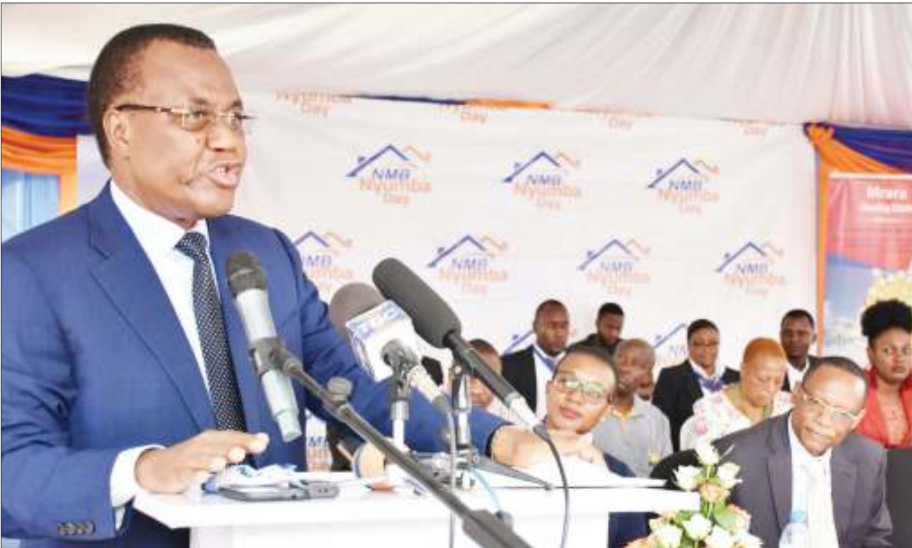
Waziri wa Ardhi, Nyumba na Maendeleo ya Makazi, William Lukuvi, akiongea kwenye uzinduzi rasmi wa Siku ya Nyumba ya NMB iliyofanyika jijini Arusha mwishoni mwa wiki. Siku ya Nyumba ya NMB ni maonyesho yenye lengo la kuwaleta pamoja wateja na kampuni za kuuza nyumba ili kuona miradi waliyonayo na gharama kabla ya kununua kupitia benki hiyo.

Katika nchi za Afrika ya Mashariki takwimu zinaonyesha kuwapa kwa duma 2,572 wanapatikana katika hifadhi za Serengeti na Ngorongoro pamoja na mbuga ya Maasai Mara na Tsavo nchini Kenya.