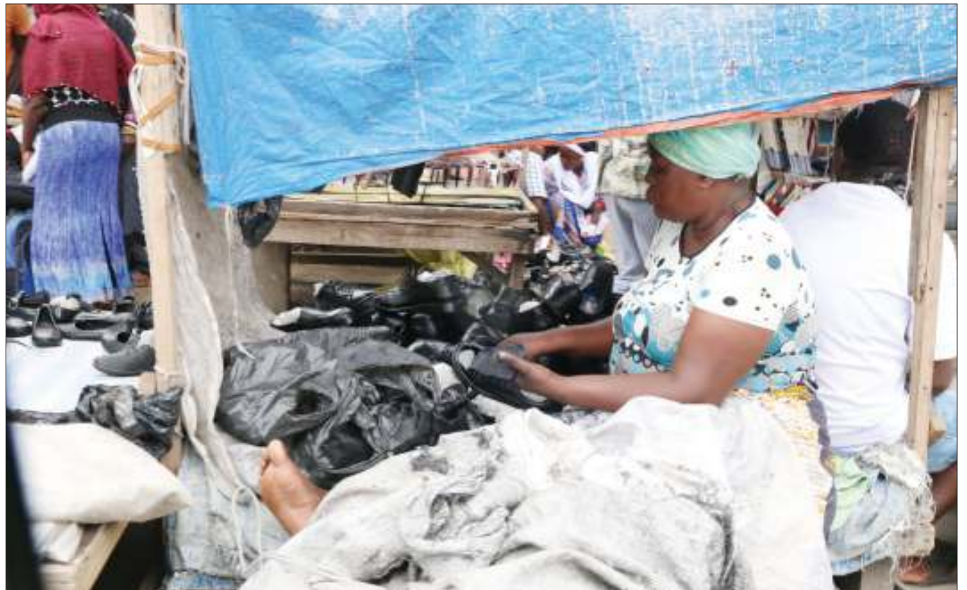
Mfanyabiashara wa viatu vya mitumba Soko la Ilala Mchikichini akivisafisha katika banda lake Barabara ya Uhuru jijini Dar es Salaam jana. Baadhi ya wanawake wamekuwa wakijishughulisha na biashara ya mitumba ili kuongeza pato la familia.

Alisema kupitia mradi huo wanategemea mambo makubwa ikiwamo kuzalisha ajira kwa wingi kupitia mradi huo kwa kuwa vijana watajijiri na kuajiriwa.