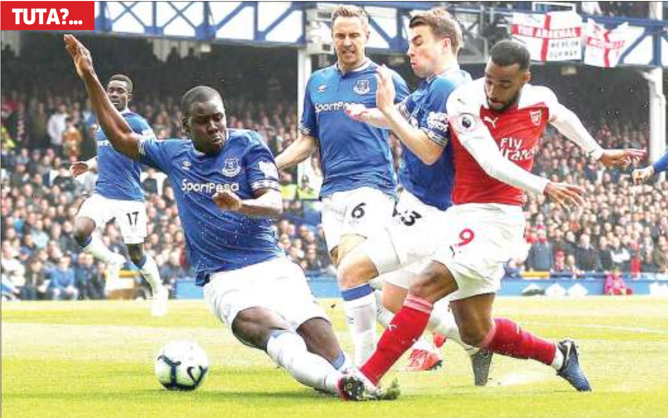
Beki wa Kati wa Everton, Kurt Zouma, akiepuka kusababisha penalti licha ya kumgusa kwenye kifundo cha mguu mshambuliaji wa Arsenal, Alexandre Lacazette, katika mechi ya Ligi Kuu England iliyopigwa Uwanja wa Goodison Park na wenyeji kushinda 1-0 kupitia kwa Phil Jagielka.