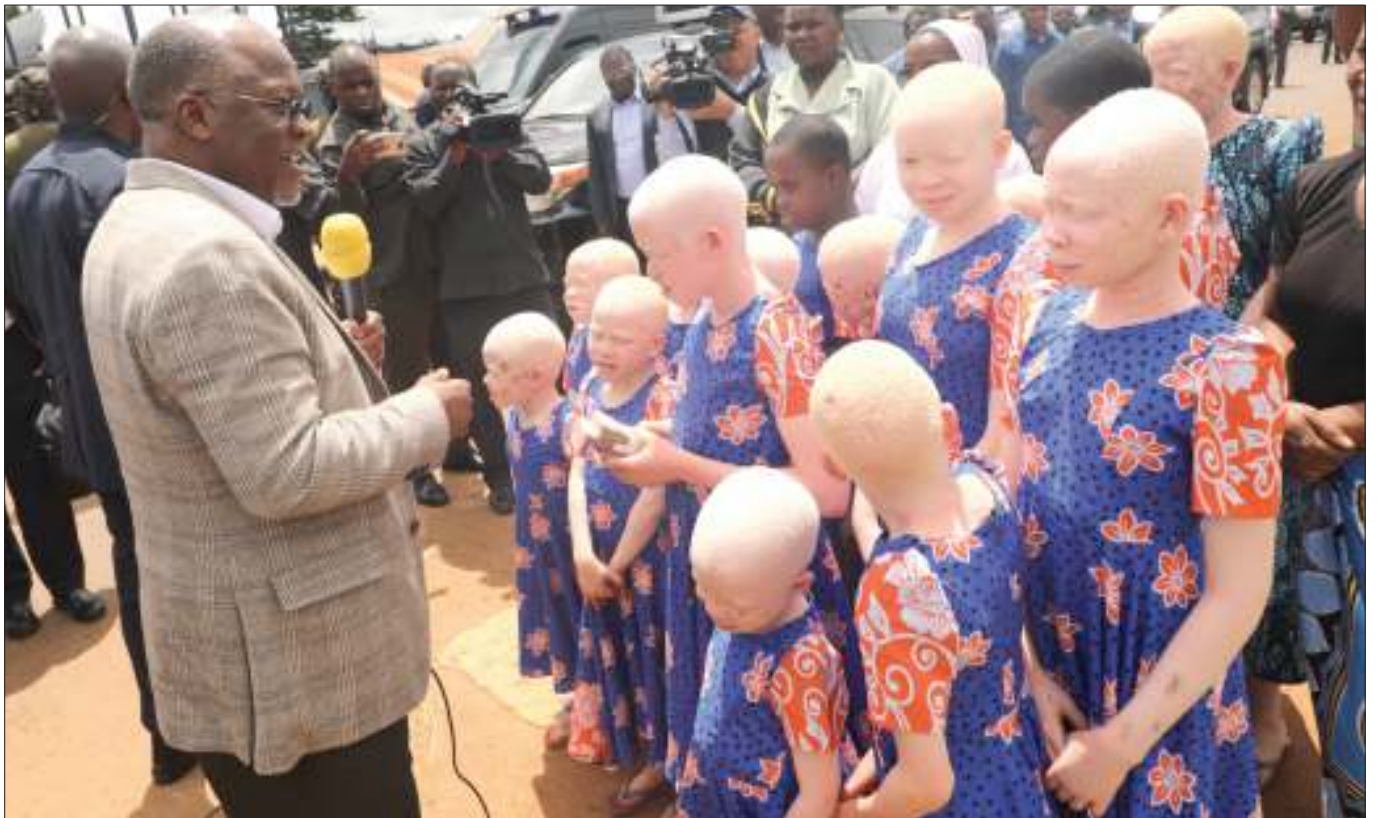
Rais John Magufuli akizungumza na wanafunzi wenye ulemavu wa ngozi wanaosoma katika Shule ya St. William iliyopo Mbinga mkoani Ruvuma. Rais amewachangia watoto hao kiasi cha shilingi milioni tatu.