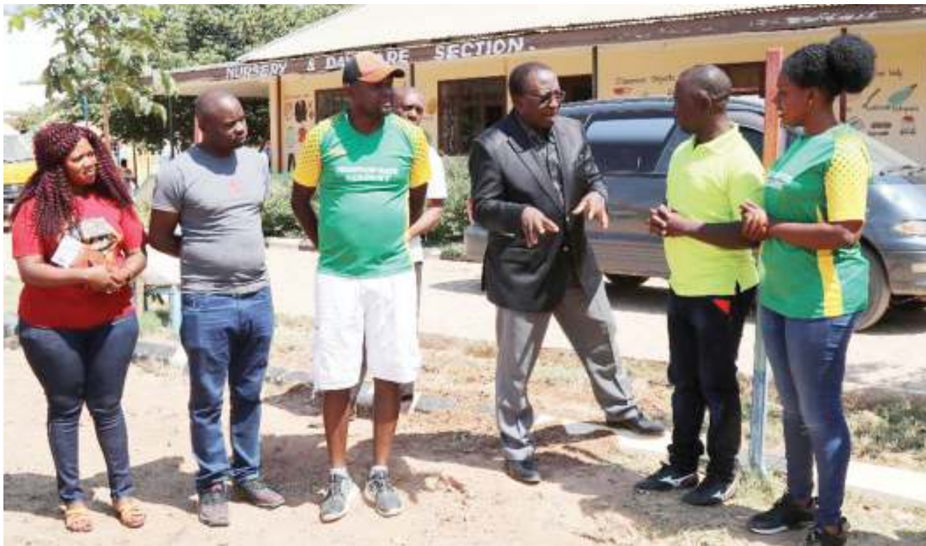
Waziri wa Habari, Utamaduni, Sanaa na Michezo, Dk. Harrison Mwakyembe (wa tatu kulia), akizungumza na walimu wa michezo wa Shule ya Fountain Gate Academy, wakati alipoitembelea katika uwanja wa shule hiyo, Miyuji Dodoma mwishoni mwa wiki.

"Mchezaji anapoumia anahitaji kutibiwa, na matibabu sahihi ndio yatamrejsha mchezaji katika kazi yake mapema, hiki ndio kinachofanyika kwa sasa," alisema kiongozi huyo.