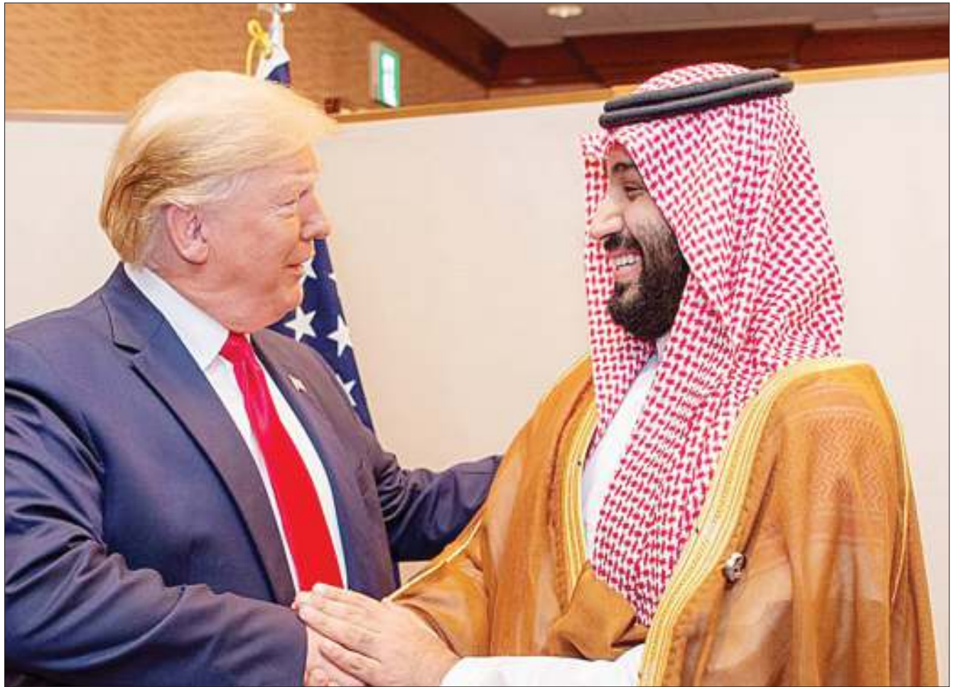
Rais wa Marekani, Donald Trump (kushoto), akiwa na Mwanamfalme wa Saudi Arabia, Mohammed bin Salman.