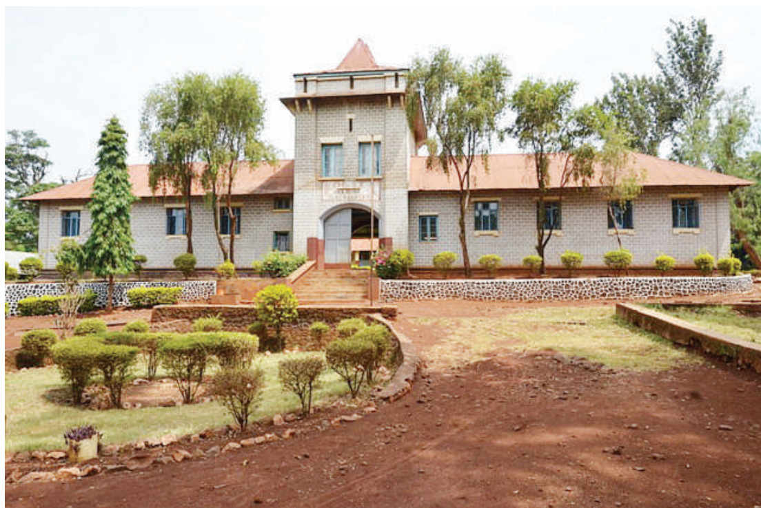
S ehemu ya majengo la Shule ya Sekondari Old Moshi, iliyopo mjini Moshi, tangu zama za ukoloni wa Kijerumani nchini.

Labda kutokana na mabadiliko ya wakati, kwa sasa hawatishi tena kama zamani, inawezekana ni kwa sababu wengi wao wanapenda kuongea kila kitu, kila wakati kiasi kwamba wanakosa mvuto, pia kwa sasa wengi wao hawana umri mkubwa sana kama wale wa zamani, hawana mbwembwe zile za 'kikoloni' hata mavazi yao wako 'simp'o' tu.