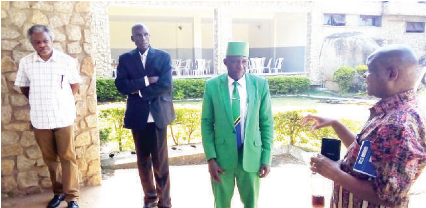
Sehemu ya haiba ya mavazi na utanashati waliouhusudu wakuu wa shule wa zamani.

katika mgawanyo huo wa walimu, jambo ambalo kila mwalimu kuanzia wanafunzi wa zamani wa zama hizo, huenda hata mpaka