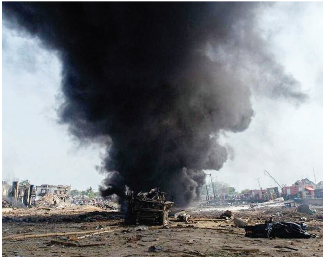
Moshi ukitanda eneo la migodi baada ya kutokea mlipuko na kusababisha vifo vya watu zaidi ya 17 katika kijiji cha Bugoso nchini Ghana jana.