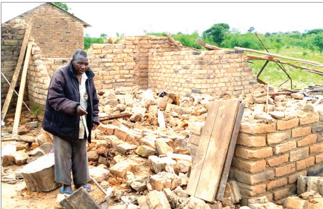
Moja kati ya nyumba 27 zilizoezuliwa na mvua iliyoambatana na upepo mkali huku watu wawili waki- jeruhiwa katika kijiji cha Banawanu, Kata ya Udonja, wilayani Wanging'ombe, mkoa wa Njombe juzi.

AMTUHUMU kutoa ujauzito wake, anaswa na polisi akiwa amejificha jirani na nyumbani... Endelea ukurasa 2