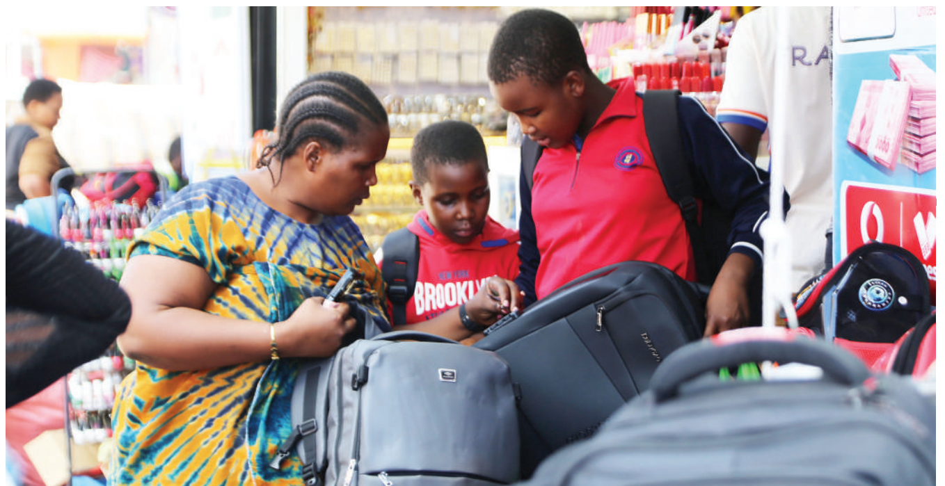
Mzazi ambaye jina lake halikupatikana akichagua mabegi ya shule pamoja na watoto wake kama alivyokutwa eneo la barabara ya sabasaba jijini Dodoma mwisho wa wiki.