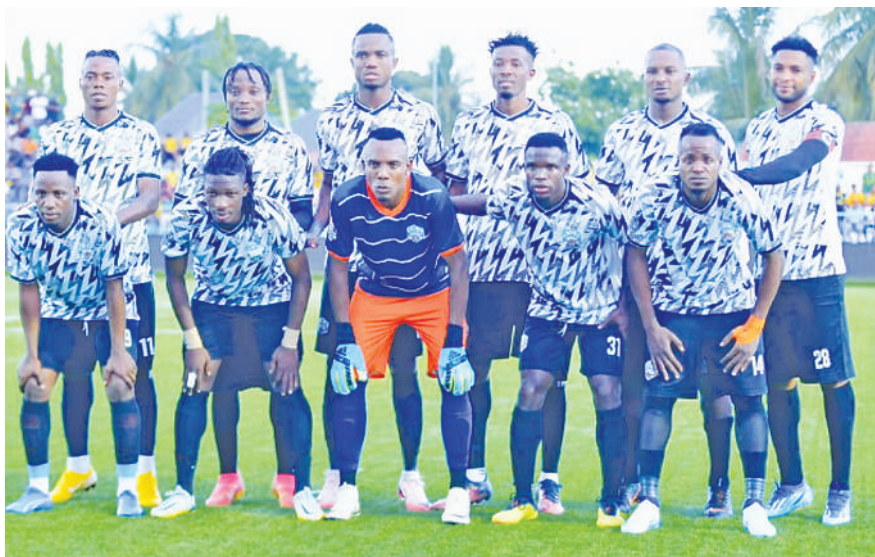
Kikosi cha Tabora United kabla ya kucheza mechi ya Ligi Kuu Tanzania Bara dhidi ya Yanga kwenye Uwanja wa Azam Complex, Chamazi, Dar es Salaam, Novemba 7, mwaka jana na kushinda mabao 3-1.

Ikaifunga pia, Azam mabao 2-1 katika mchezo uliochezwa, Desemba