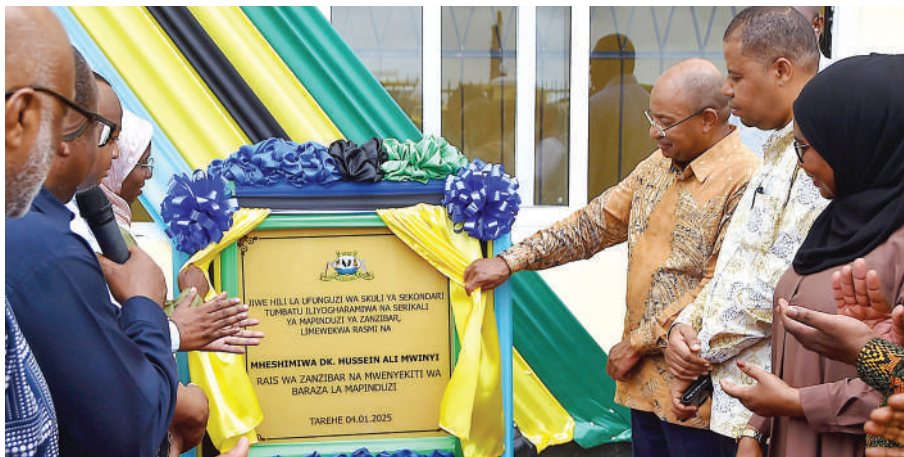
Rais wa Zanzibar, Dk Hussein Ali Mwinyi akiondoa pazia kuweka jiwe la Msingi la Ufunguzi wa Shule ya Sekondari Tumbatu Mkoa wa Kaskazini Unguja, ufunguzi huo ulifanyika juzi ikiwa ni shamrashamra za Maadhimisho ya Miaka 61 ya Mapinduzi ya Zanzibar.