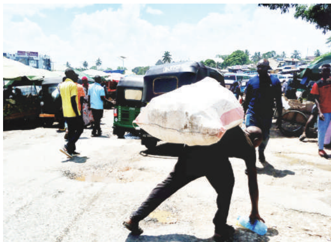
Muokota chupa tupu za plastiki akiwa kazini Mbezi Luis Dar es Salaam jana. Uwepo wa watu hawa umesaidia kukabiliana na uchafuzi wa mazingira unaotokana na utupaji ovyo chupa hizo.