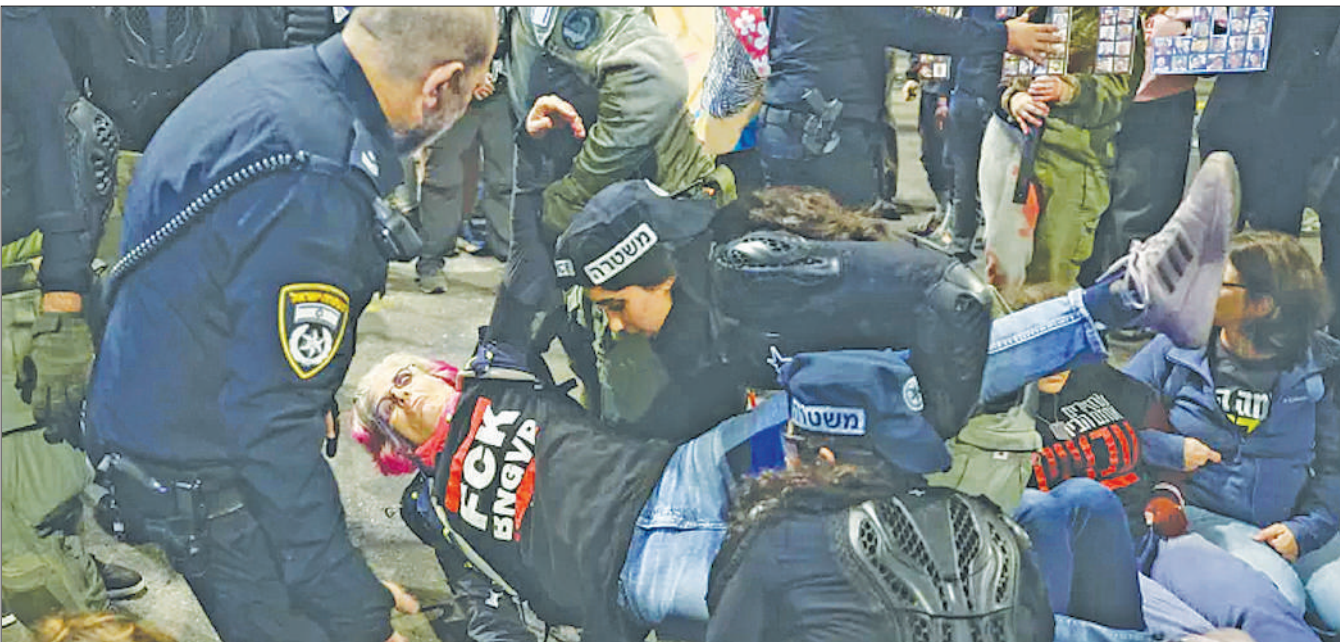
Polisi wa Israel wakimwondoa mwandamanaji wakati wa maandamano ya kutaka kuachiliwa kwa mateka waliotekwa huko Gaza, nje ya makao makuu ya Wizara ya Ulinzi Tel Aviv juzi.