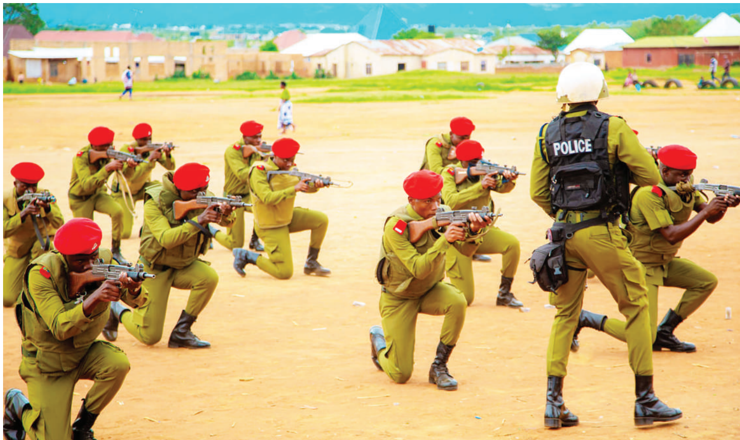
Askari wa Kikosi cha Kutuliza Ghasia (FFU) Mkoa wa Songwe wakiwa kwenye mazoezi wakati wa kutoa zawadi kwa askari waliofanya vizuri katika kazi za kipolisi mkoani humo mwishoni mwa wiki.