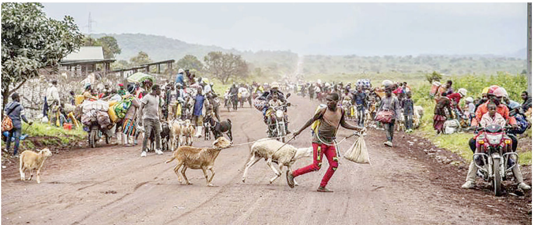
Wananchi wa maeneo ya Rushuru wakikimbia mapigano kati ya wanajeshi wa serikali ya Jamhuri ya Kidemokrasia ya Congo na waasi wa M23 Juzi. PICHA: AFP

"Tayari hauptiki, kwa sasa wanaendelea kushambulia daraja la mwisho la tatu. Kama ninavyoelewa, wana-taka kuukata mji huo ili kutowezesha uokozi wa watu kufanyika, au kuleta usaidizi," alisema Haidai. BBC