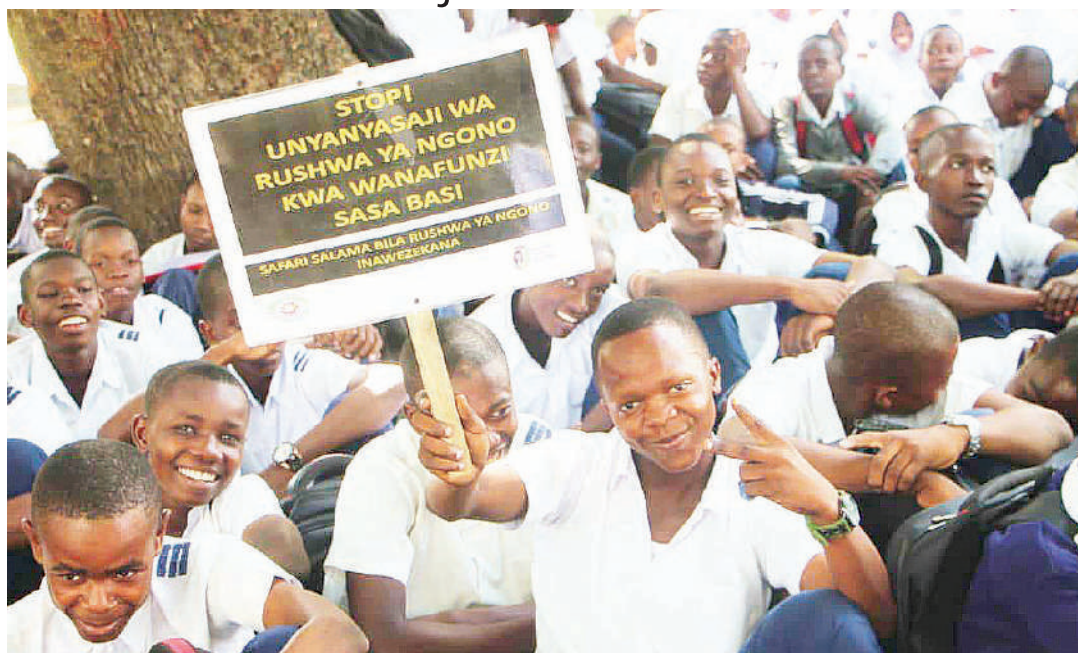
Wanafunzi katika shule za msingi na sekondari wilayani Temeke wakipata elimu kukabiliana na vishawishi vya ngono inayotolewa na WAJIKI.

Anayeongeza kuwa kurubuniwa kingono wanafunzi na wanawake