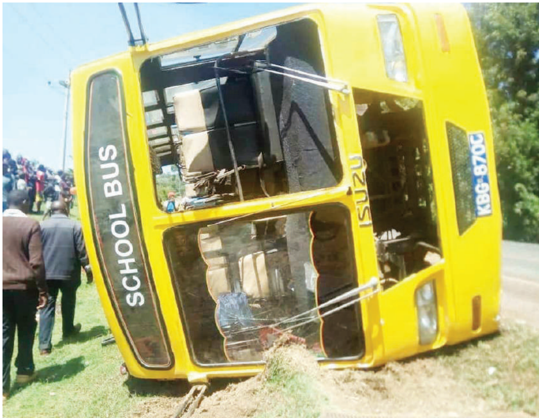
Usafiri wa kutumia mabasi ya shule wakati mwingine ni kero yanapoharibika na kukwama barabarani.

Kuharibika kunasababisha kuchelewa kufika vituoni, hivyo