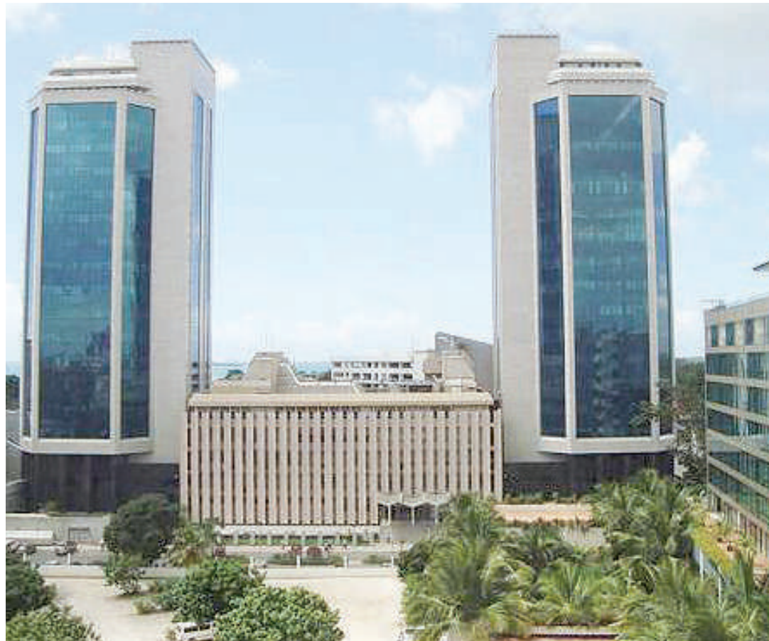
Majengo ya Benki Kuu ya Tanzania.

Aidha, BOT ikawa inafuatilia mwenendo mzima wa uchumi nchiNI na kutoa ushauri kwa serikali, kusimamia mifumo ya malipo ya Taifa, pia kusimamia