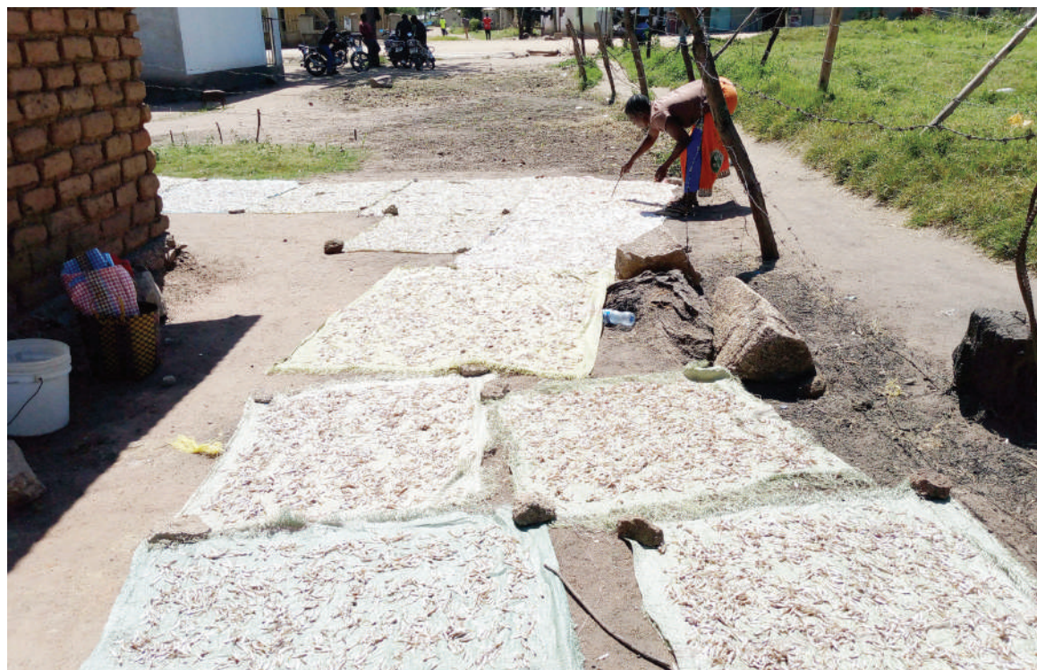
Mchuuzi wa samaki mjini Bunda mkoani Mara, akianika dagaa kwenye vipande vya mifuko ya viroba, mwishoni mwa wiki. Baadhi ya wachuuzi wamekuwa wakitumia njia hiyo ili kuepuka dagaa kuwa na mchanga.

Aliwataka wanahabari na wadau mbalimbali wa habari kushiriki katika kupigania haki za upatikanaji wa habari na kuhakikisha wanashiriki kwenye mabadiliko yoyote ya sheria.