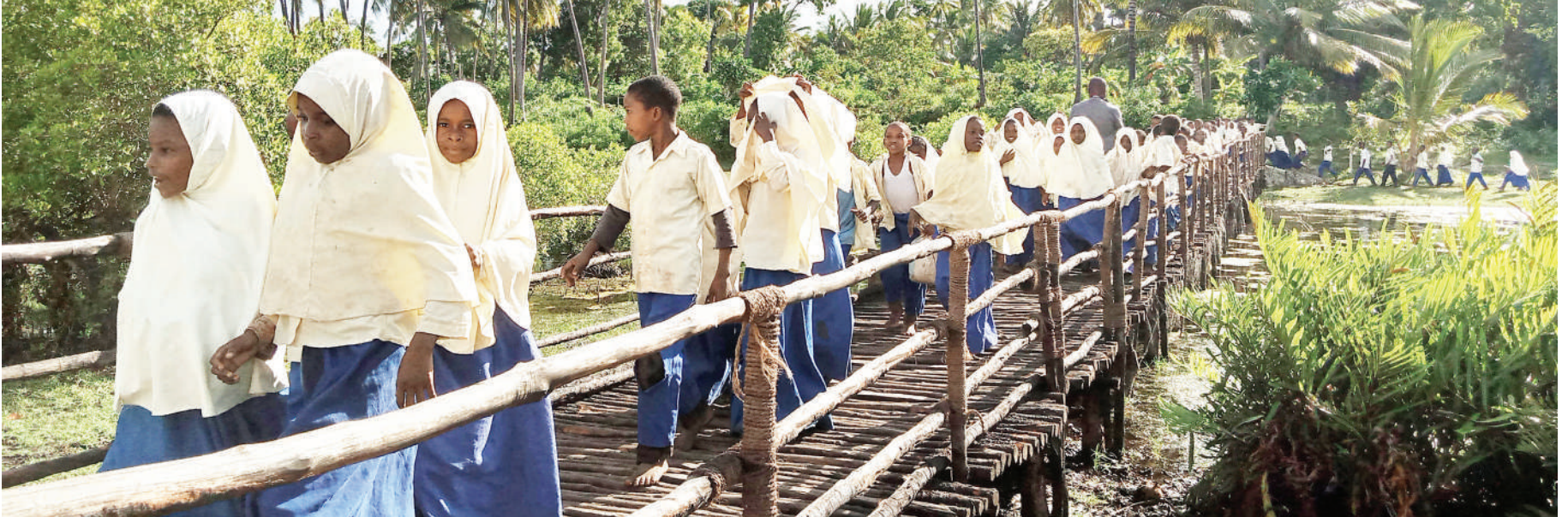
Baadhi ya wanafunzi wa Shule ya Msingi Mjini Wingwi wakivuka daraja kuelekea shule, kabla ya daraja hilo walishindwa kwenda shule.