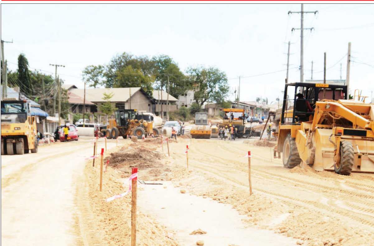
Mkandarasi akiendelea na kazi ya ukarabati mkubwa wa barabara ya Shekilango hadi Bamaga, Manispaa ya Kinondoni, jijini Dar es Salaam jana.

Alisema vyama vitano vyenye wagombea katika ngazi ya ubunge vimeshazindua kampeni zao isipokuwa DP ambacho nacho kitazindua wakati wowote.