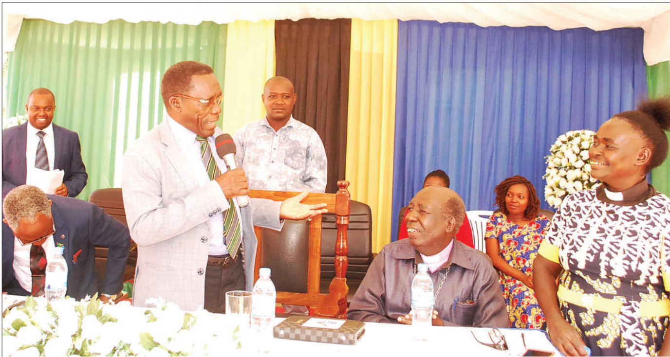
Waziri Mkuu mstaafu, Mizengo Pinda, akizungumza kwenye mkutano wa 16 wa wanachama wa Saccos ya Kanisa la Kiinjili la Kilutheri Tanzania (KKKT), jijini Dodoma jana.

Alieleza kuwa madhumuni ya kuanzishwa kwake ni kujiinua kiuchumi, ambapo kwa sasa wanatarajia kupanua huduma za kifedha na kujenga mtaji wa uhakika na kuendelea kujiinua kiuchumi.