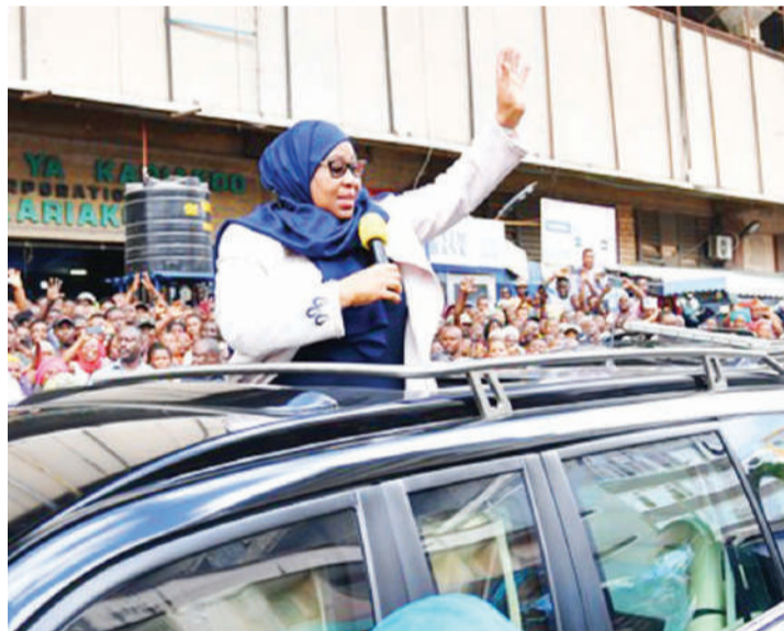
Rais Samia Suluhu Hassan, alipozungumza na wafanyabiashara wa Soko Kuu la Kariakoo, Dar es Salaam, baada ya kufanya ziara ya kushtukiza kusikia na kutatua kero zao.

Kwa kuwa, kulikuwapo njia nyingine ambazo zingetumika kuwasiliana na wafanyabiashara ndogondogo kwa uhamishaji salama. Nilimwagiza Waziri wa Nchi Ofisi ya Rais Tawala za Mikoa na Serikali za Mitaa kushughulikia hili.