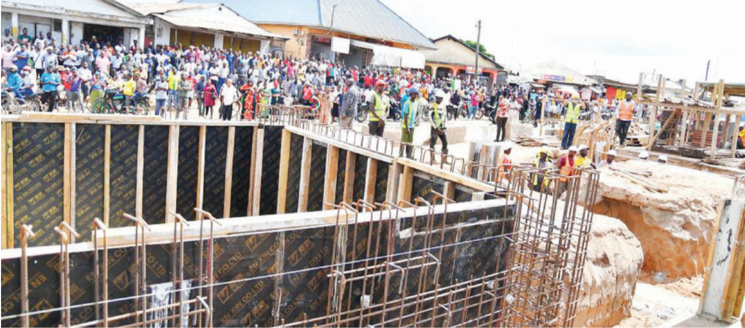
Wananchi wa Mtongani na Kwa Azizi Ali, Dar es Salaam, walipomsikiliza Rais Samia Suluhu Hassan, wakati akikagua ujenzi wa Mradi wa Mwendokasi, katika barabara ya Kilwa.

• Jicho, uamuzi wake uko ofisini, mitaani • Maudhui ya Magufuli yenye vionjo vipya