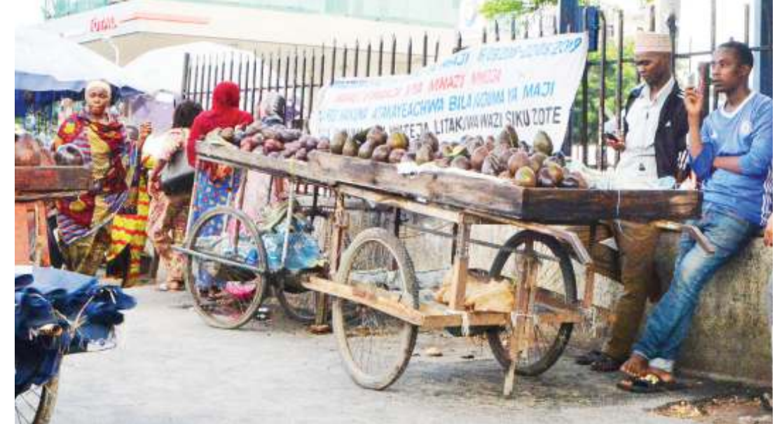
Wachuuzi wa maparachichi wakisubiri wateja kando ya Barabara ya Kawawa, eneo la Ilala Boma, jijini Dar es Salaam mapema wiki hii.