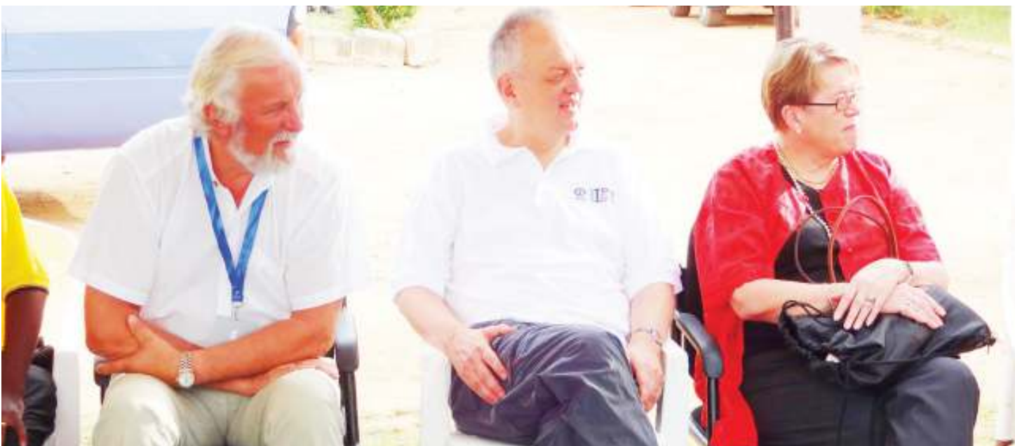
Mwenyekiti wa Plan International, Nigel Chapman, (katikati) akiwasikiliza wanufaika wake wa Kibaha (hawapo pichani).

• Yaondoka ikiwaacha wanavijiji wapya • Wafugaji kukeketa ‘no’;