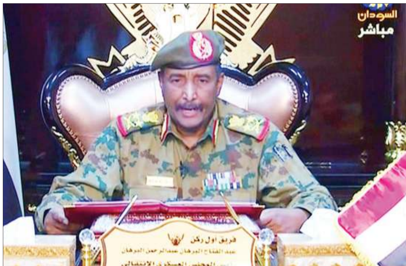
Kiongozi wa kijeshi nchini Sudan, Jenerali Abdel Fattah al-Burhan, akitangaza kuahirishwa mazungumzo kati ya Jeshi la wananchi jana, baada ya kutokea vurugu.

Hii ni kwa sababu dini ya Kiislamu hufuata kalenda inayotumia mzunguko wa mwezi, hivyo hubadilika tofauti na kalenda inayotumiwa na mataifa ya Magharibi inayofuata jua. BBC