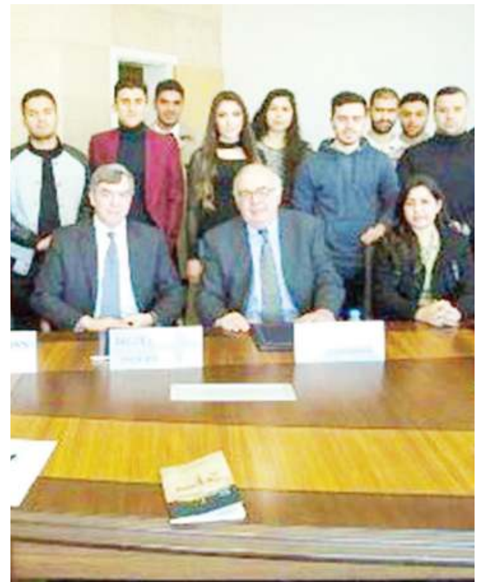
Watumishi Wamarekani, katika Chuo Kikuu cha Irak.

WIZARA ya Masuala ya Kigeni nchini Marekani, imeagiza kuondoka kwa watumishi wake wanaoelezwa ‘hawafanyi kazi za dharura’ nchini Irak, baada ya kutokea hali ya wasiwasi kati ya Marekani na Iran.