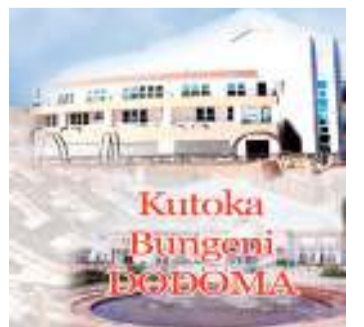
Habari zote na Augusta Njoji, DODOMA

Manyanya alisema lengo la sera ya maendeleo endelevu ya viwanda ni kuhamasisha ujenzi wa viwanda kwa kuweka mazingira wezeshi ya uwekezaji nchini.