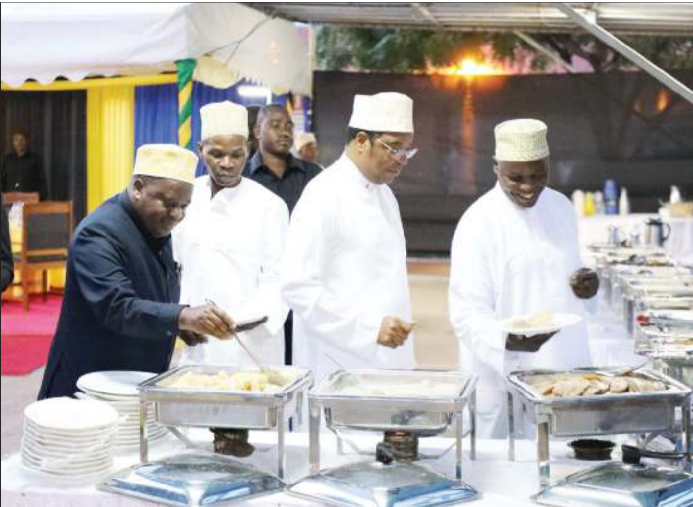
Waziri Mkuu Kassim Majaliwa na Spika wa Bunge, Job Ndugai (kushoto), wakiwaongoza wabunge kupata futari aliyowaandalia katika viwanja vya Bunge, jijini Dodoma juzi.