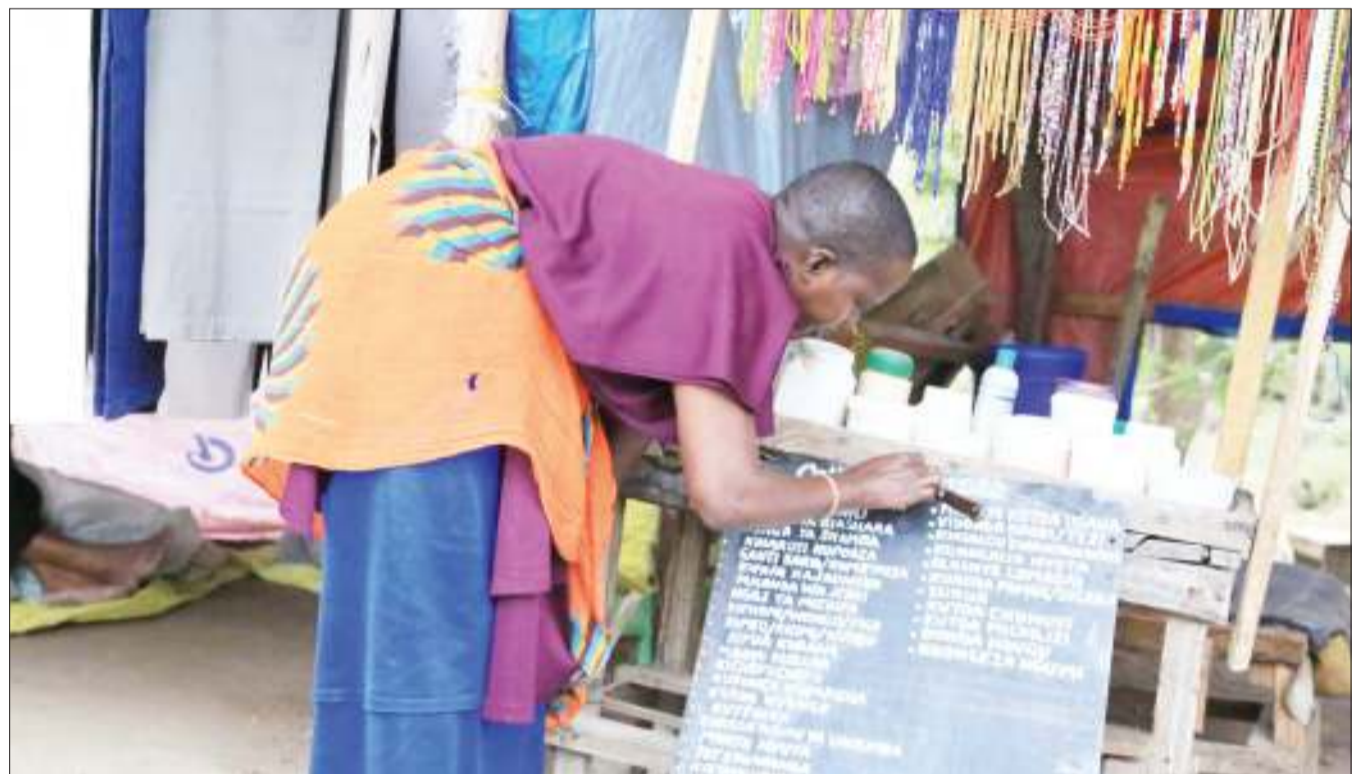
Mama wa Kimaasai muuza za dawa za tiba asilia akifanya mabadiliko ya bei za bidhaa zake kwenye ubao, nje ya soko la Sabasaba, jijini Dodoma jana.