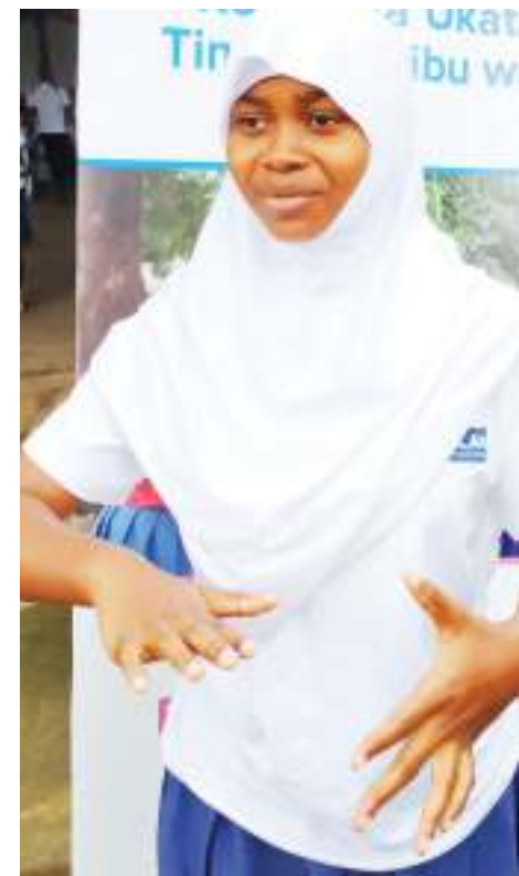
Wanafunzi wanufaika katika halfa ya kuliaga Shirika la Plan International Kibaha.

gine inayoweza kusaidia elimu wilayani humo, ni pamoja na ujenzi wa shule za awali kwa watoto wanaojiandaa kujiunga na shule ya msingi, ujenzi wa vituo sita ya elimu ya awali wa watoto chini ya umri wa miaka mitano na uwanja wa watoto katika Shule za Msingi Ruvu JKT na Msongola.