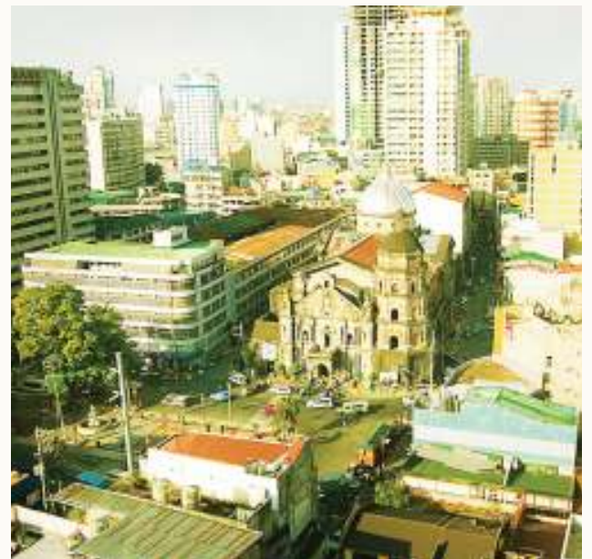
Mji Kisangani katika picha tofauti.

SEHEMU kubwa ya mji wa Kisangani, mji wa tatu kwa ukubwa DRC, haina umeme tangu Alhamisi iliopita.