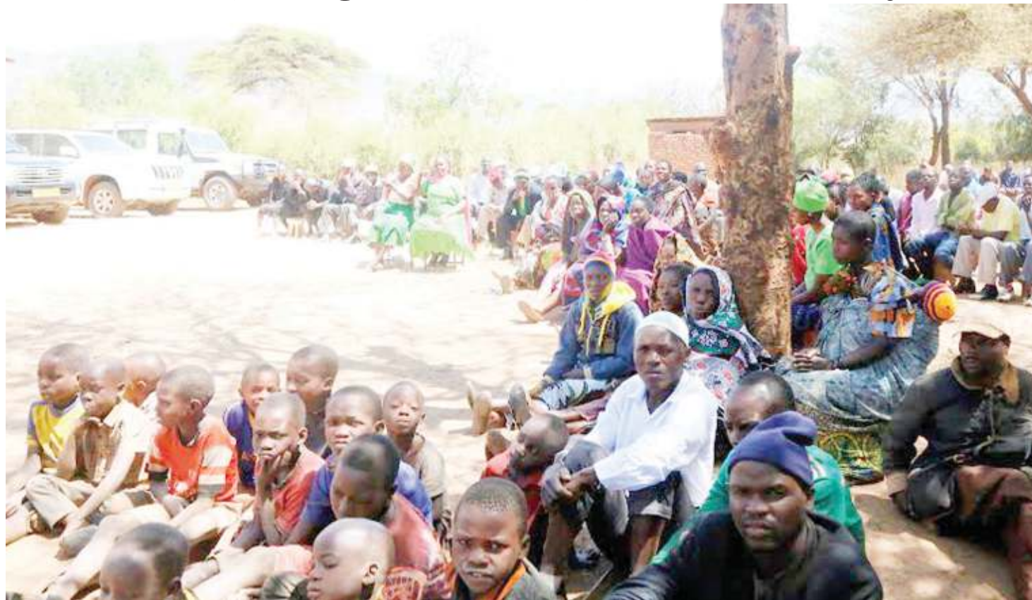
Wakazi wa Kongwa, katika moja ya tukio linalowahusu.