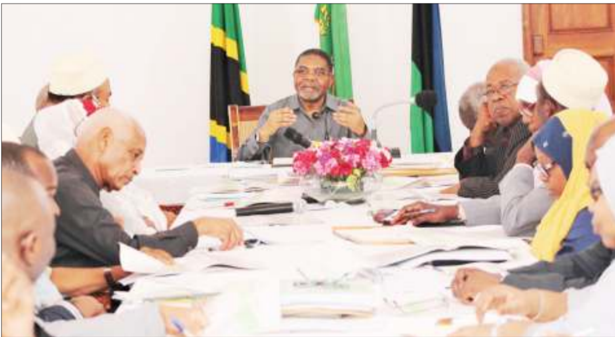
Rais wa Zanzibar na Mwenyekiti wa Baraza la Mapinduzi, Dk. Ali Mohamed Shein, akizungumza na uongozi wa Wizara ya Habari, Utalii na Mambo ya Kale Zanzibar, katika ukumbi wa Ikulu Ndogo Kibweni, jana, wakati wa mkutano wa Utekelezaji wa Mpango Kazi wa Wizara hiyo, kwa mwezi Julai 2018 hadi Machi 2019.

Kwa upande wake, Rais Magufuli alimshukuru Dk. Adesina kwa ushirikiano mkubwa ambao AfDB inautoa kwa Tanzania na amemhakikishia kuwa Tanzania itahakikishia fedha zinazotolewa na benki hiyo zinatekeleza miradi iliyokusudiwa kwa uhakika na inaleta matokeo yanayotarajiwa.