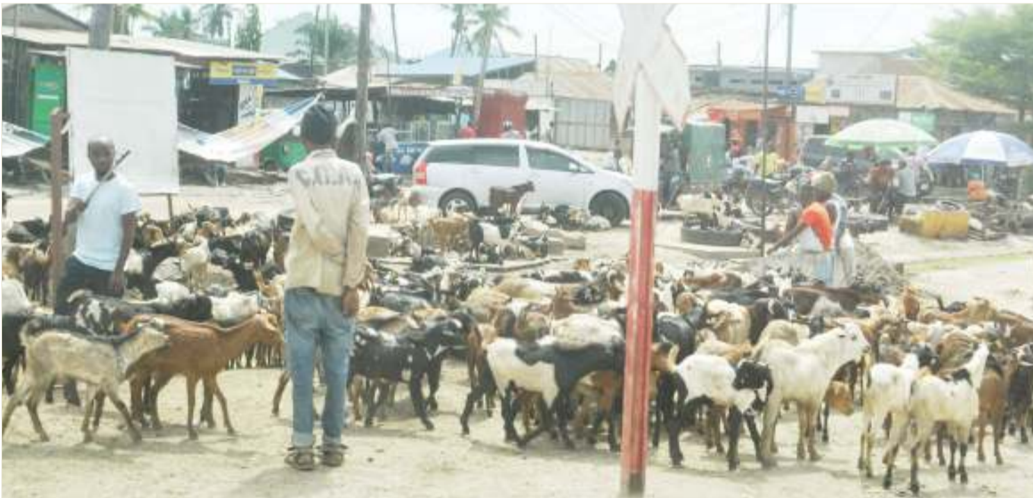
Wafanyabiashara wa mbuzi, wakisubiri wateja katika mnada wa Vingunguti, jijini Dar es Salaam jana. Mbuzi mmoja aliuzwa kwa bei ya 60,000/- hadi 150, 000/- kulingana na ukubwa wake.