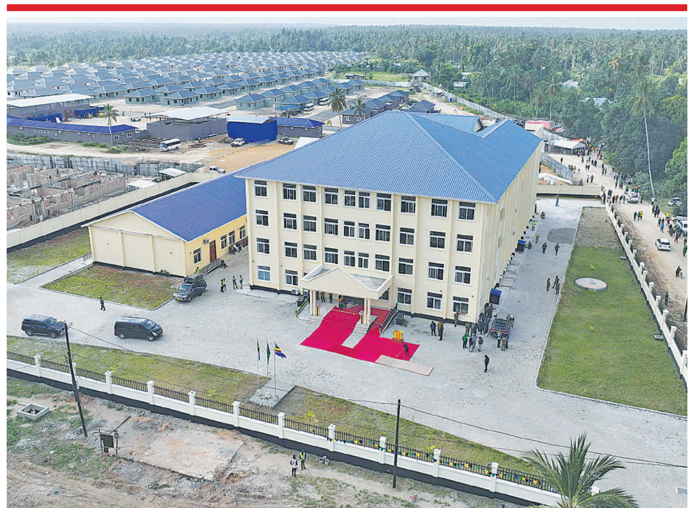
Mwonekano wa Shule ya Sekondari Misufini iliyoko Bumbwini, Zanzibar baada ya kufunguliwa na Rais Dk. Samia Suluhu Hassan jana.