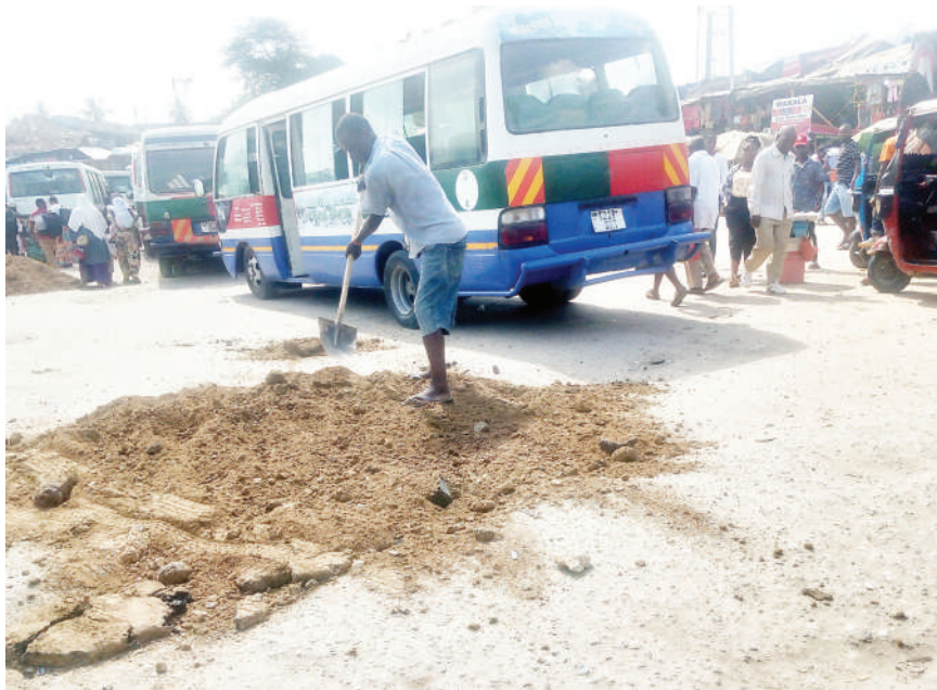
Mkazi wa jijini Dar es Salaam akisambaza udongo kwenye kituo cha daladala cha Mbezi Mwisho jana, ili kuziba mashimo yaliyopo kituoni hapo yanayosababisha usumbufu kwa madereva.