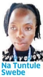
Na Tuntule Swebe