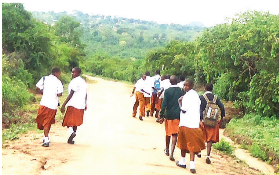
Sehemu ya mandhari ya Wilaya ya Handeni, iliyozingirwa na misitu ya asili.