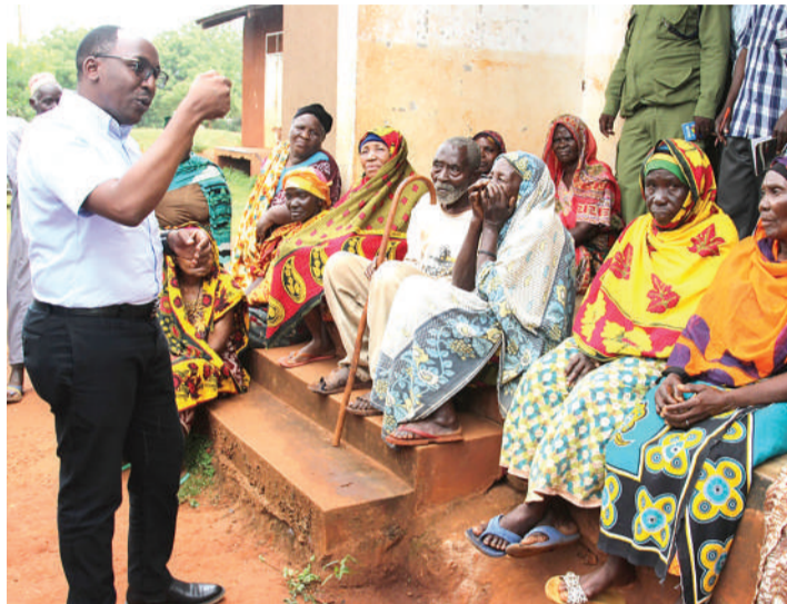
Picha tofauti za makundi mawili kijamii, yanaangukia vizazi tofauti kwa mujibu wa wataalamu.

kizazi cha nne wanakiita 'Baby Boomers', ambaoni ni watu waliozaliwa kati ya mwaka 1946 na 1964.