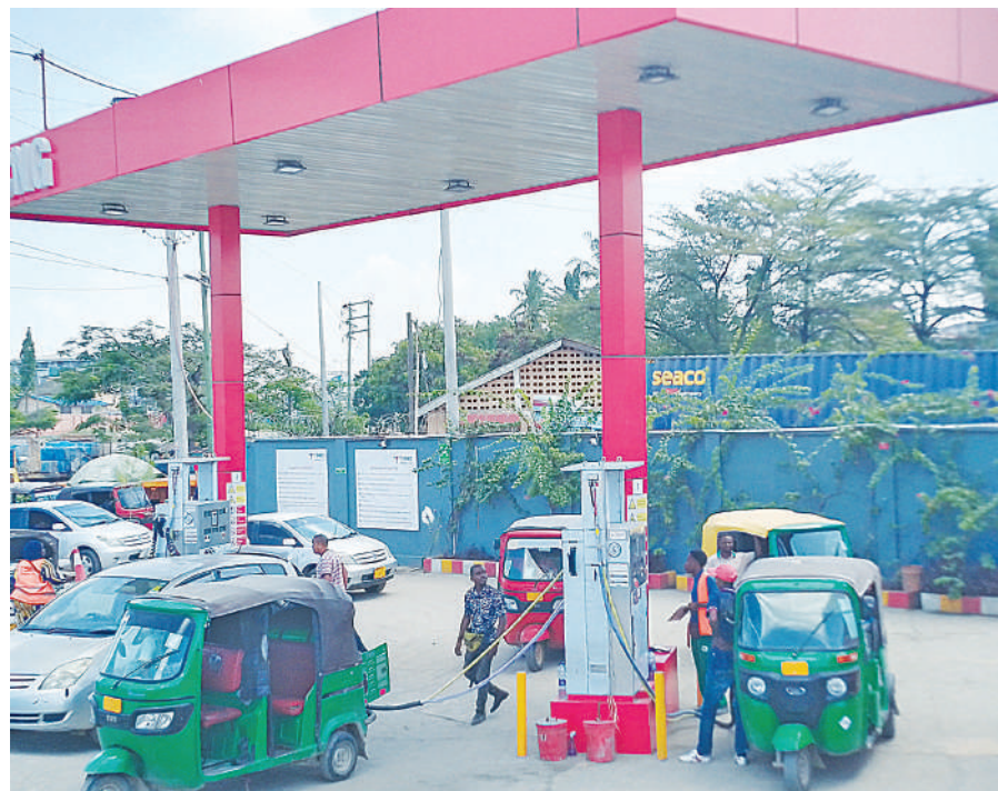
Mafundi wakiendelea na ujenzi wa Kituo Kikuu cha Kujazia Gesi Asilia (CNG Mother Station) katika Chuo Kikuu cha Dar es Salaam (UDSM)