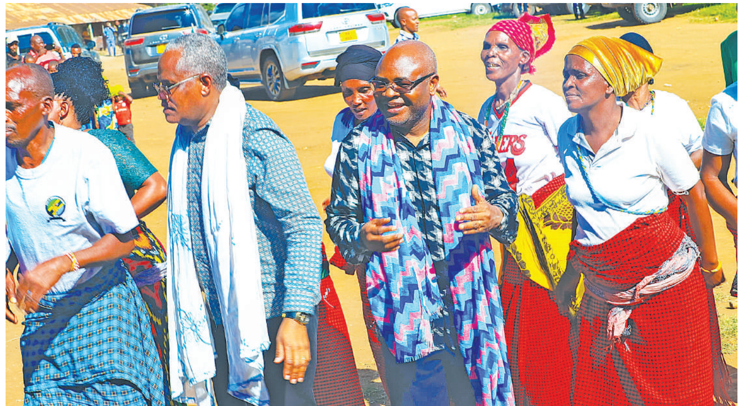
Waziri wa Nchi Ofisi ya Rais, Mipango na Uwekezaji, Prof. Kitila Mkumbo, akicheza ngoma wakati akiwa ziarani Kata ya Galapo wilayani Babati, mkoani Manyara juzi.