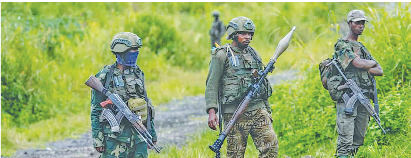
Waasi wa M23 wakiwa katika eneo la mapigano Mashariki mwa DRC hivi karibuni.