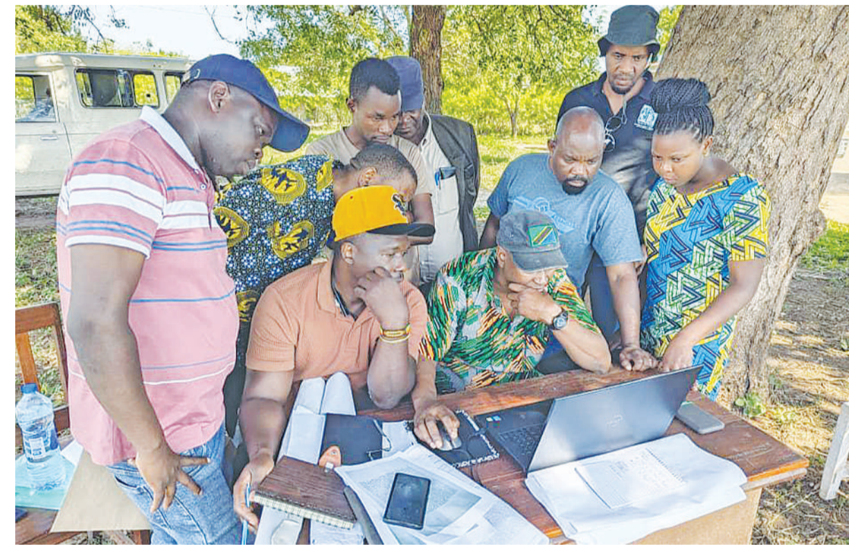
Wataalamu wa ardhi katika halmashauri za wilaya ya Handeni na Pangani, wakipitia matangazo ya serikali na miongozo, kabla ya kwenda kutafsiri kwa wananchi wake, ikiwa ni sehemu ya utatuzi wa migogoro yao.

"Kutokana na elimu tuliyopata, tumefanikiwa kutenga misitu wa hifadhi ya kijiji wenye ukubwa wa