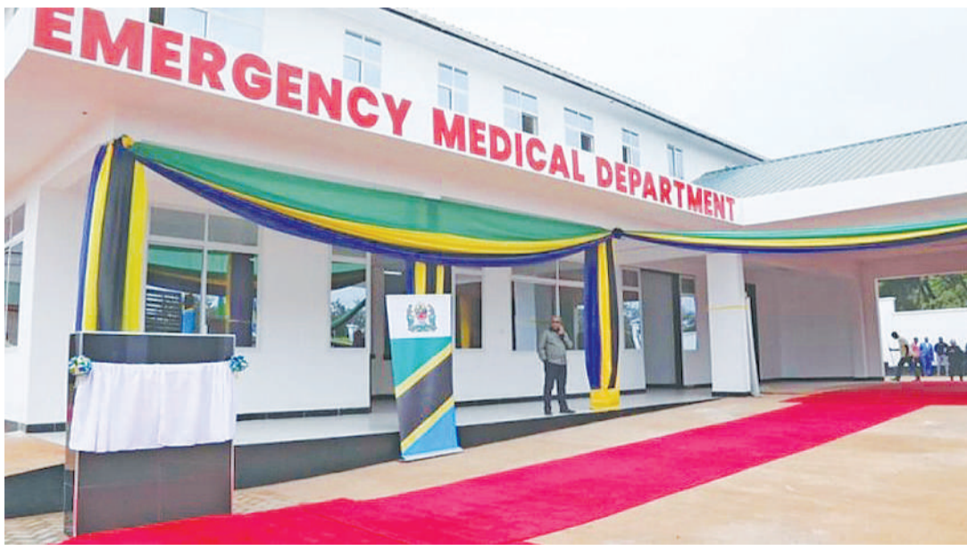
Jengo mojawapo la huduma ya dharura hospitalini, katika hatua za uzinduzi.