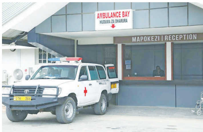
Huduma ya dharura katika Hospitali ya Mkoa Dodoma.

Ufafanuzi wa Wizara ya Afya, unagusa maeneo ya hospitali