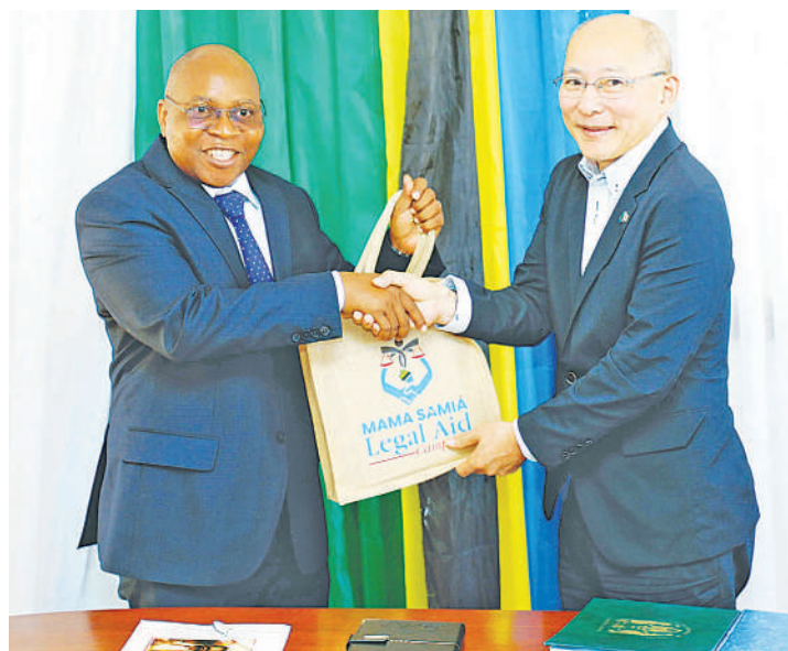
Waziri wa Katiba na Sheria, Dk. Damas Ndumbaro (kushoto), akimkabidhi zawadi Balozi wa Japan nchini, Yasushi Misawa, alipomtembelea ofisini kwake Mtumba jijini Dodoma jana, kwa lengo la kumuaga baada ya kumaliza muda wake nchini.