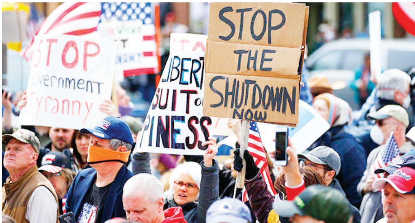
Wamarekani na maandamano dhidi ya corona.

Kwa mujibu wa utafiti huo, zilikuwa zinagusa asilimia 14 ya waliohojiwa, yaani wanajihisi ni wagonjwa kwa kukaa ndani tu. Sura nyingine ya ripoti ya utafiti, inabainisha watu waliopatwa na maambukizo ya juu ya corona au walioko katika kundi hatarishi kwa maambukizo au