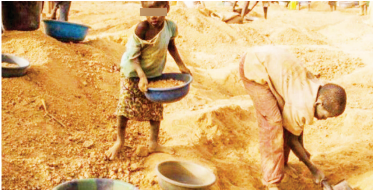
Watoto wanaofanyishwa kazi migodini.