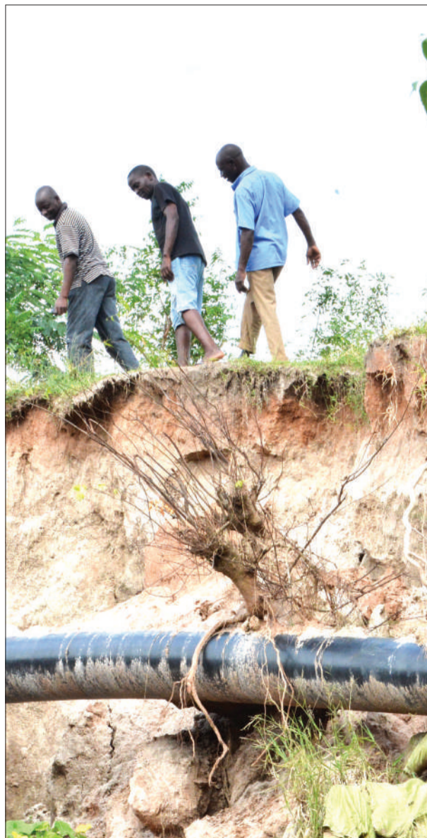
Wakazi wa Jiji la Dar es Salaam wakitazama bomba la gesi la Songas likiwa nje katika eneo la Mbezi Manyema, jijini humo jana, kutokana na mmomonyoko wa udongo uliosababishwa na mvua.

Kwa mujibu wa Wangwe, awamu ya kwanza walimu hao walilipwa Sh. 9,080,000 na awamu ya pili watalipwa Sh. 14,191,452.67.