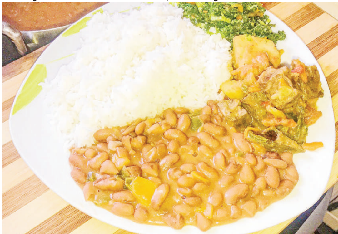
Maharagwe yakiwa sehemu ya mboga ya wali.

Lingine, ni chakula chenye utajiri wa protini ambayo mbali na kujenga mwili, ni wakala mzuri wa kupunguza sukari