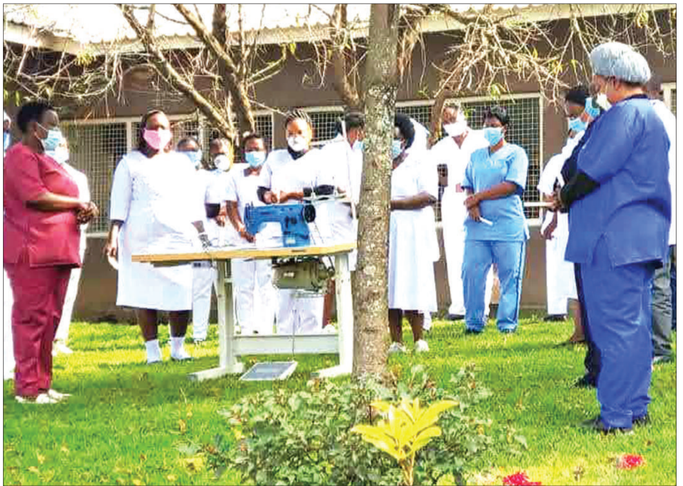
Wauguzi wa Hospitali ya Rufani Kanda ya Mbeya, wakiwa katika maadhimisho ya Siku ya Wauguzi Duniani, katika viwanja vya hospitali hiyo, jijini Mbeya jana.

Tangu kuibuka kwa janga la ugonjwa wa corona, serikali imetoka maelekezo kwa wananchi kuvaa barakoa, kunawa mikono kwa maji tiririka na sabuni au kutumia vitakasa mikono pamoja na kukaa umbali wa mita moja kutoka alipo mtu mwingine ili kujikinga na maambukizo ya virusi vya corona.