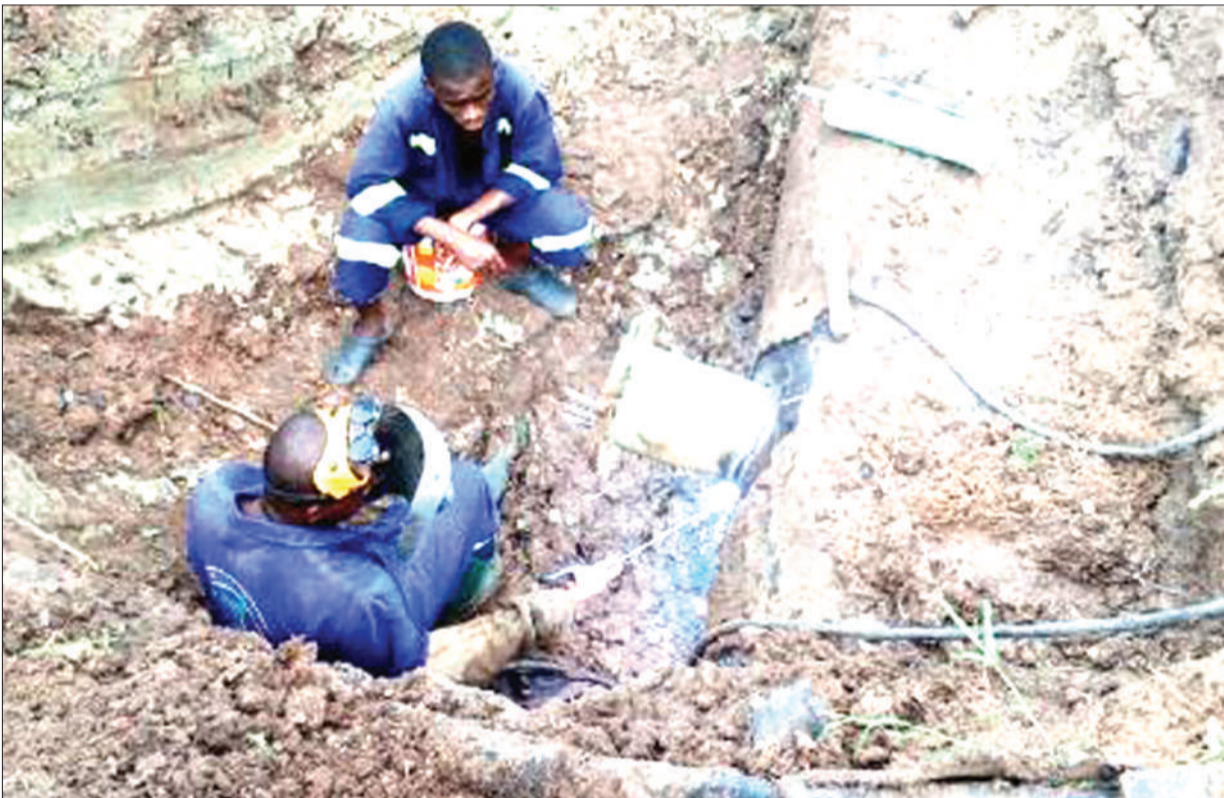
Mafundi wa Mamlaka ya Majisafi na Usafi wa Mazingira Dar es Salaam (DAWASA) mkoa kazi wa Ubungo, wakarabati bomba la inchi 8 lililopasuka na kusababisha upatikanaji hafifu wa maji kwa wateja wa Luguruni.

Kwa upande wa Bohari ya Dawa (MSD), waziri huyo alitaka iwe inanunua vifaa kinga vinavyozalishwa na viwanda vya ndani ambavyo vimekidhi viwango na vimesajiliwa na TMDA badala ya kuagiza nje ya nchi.