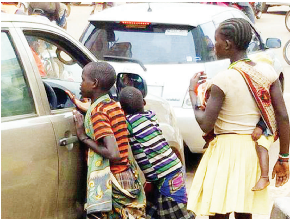
Hali halisi ya maisha ya watoto mtaani.