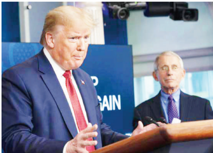
Rais Donald Trump; corona inamuumiza kichwa.

Utafiti unadokeza waliozuiwa walijikuta katika upweke wakitikisika kisaikolojia na kuugua kihisia, kutokana na kizuizi cha jumla kwa watu majumbani.