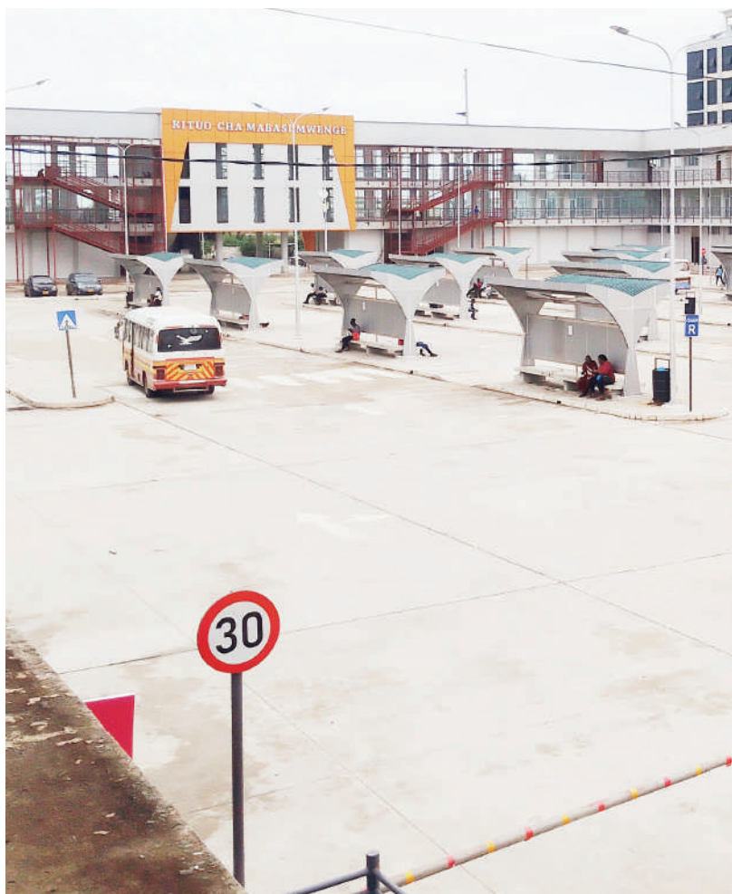
Kituo cha kisasa cha mabasi Mwenge, Manispaa ya Kinondoni, Dar es Salaam kikionekana kusuasua licha ya kukamilika kwa ujenzi wake uliogharimu mabilioni ya fedha za mapato ya ndani ya manispaa hiyo, kama ilivyonaswa na kamera yetu jana, ambapo abiria walionekana kukaa muda mrefu bila kupata huduma ya usafiri.