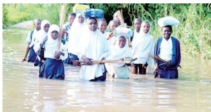
Wanafunzi wa Shule ya Msingi Rwelu, Halmashauri ya Manispaa ya Mtwara Mikindani, wakivuka barabara iliyojaa maji kutokana na mvua zinazoendelea kunyesha, wakati wakienda shuleni jana.

Alisema viwanda na biashara ndio msingi wa uchumi wa taifa na kwamba uwekezaji ambao uko juu kwa sasa nchini ni sekta za viwanda na biashara na ndizo zilizoajiri Watanzania wengi kuliko sekta zingine.