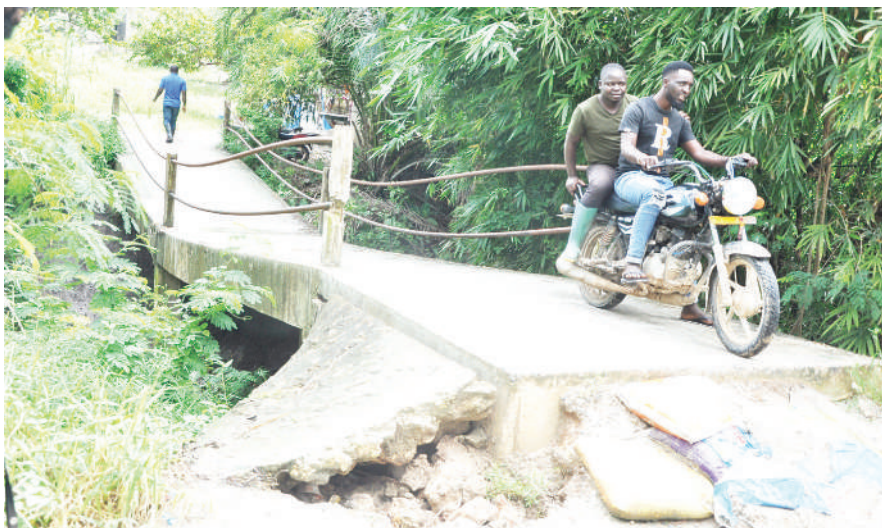
Wakazi wa Mtaa wa Upendo, Kata ya Saranga, Manispaa ya Ubungo Dar es Salaam, wakipita katika daraja la Moa jana, ambalo limeanza kutitia kutokana na mvua zinazoendelea kunyesha, kitendo kinachohatarisha usalama wa watumiaji wa daraja hilo.