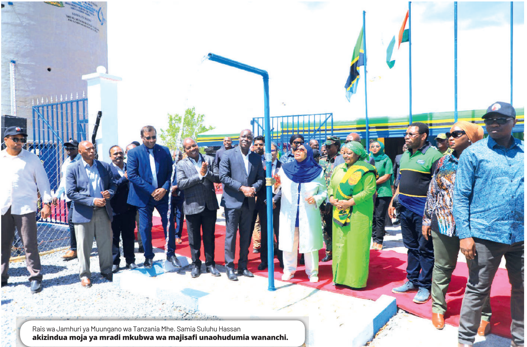
Rais wa Jamhuri ya Muungano wa Tanzania Mhe. Samia Suluhu Hassan akizindua moja ya mradi mkubwa wa majisafi unaohudumia wananchi.