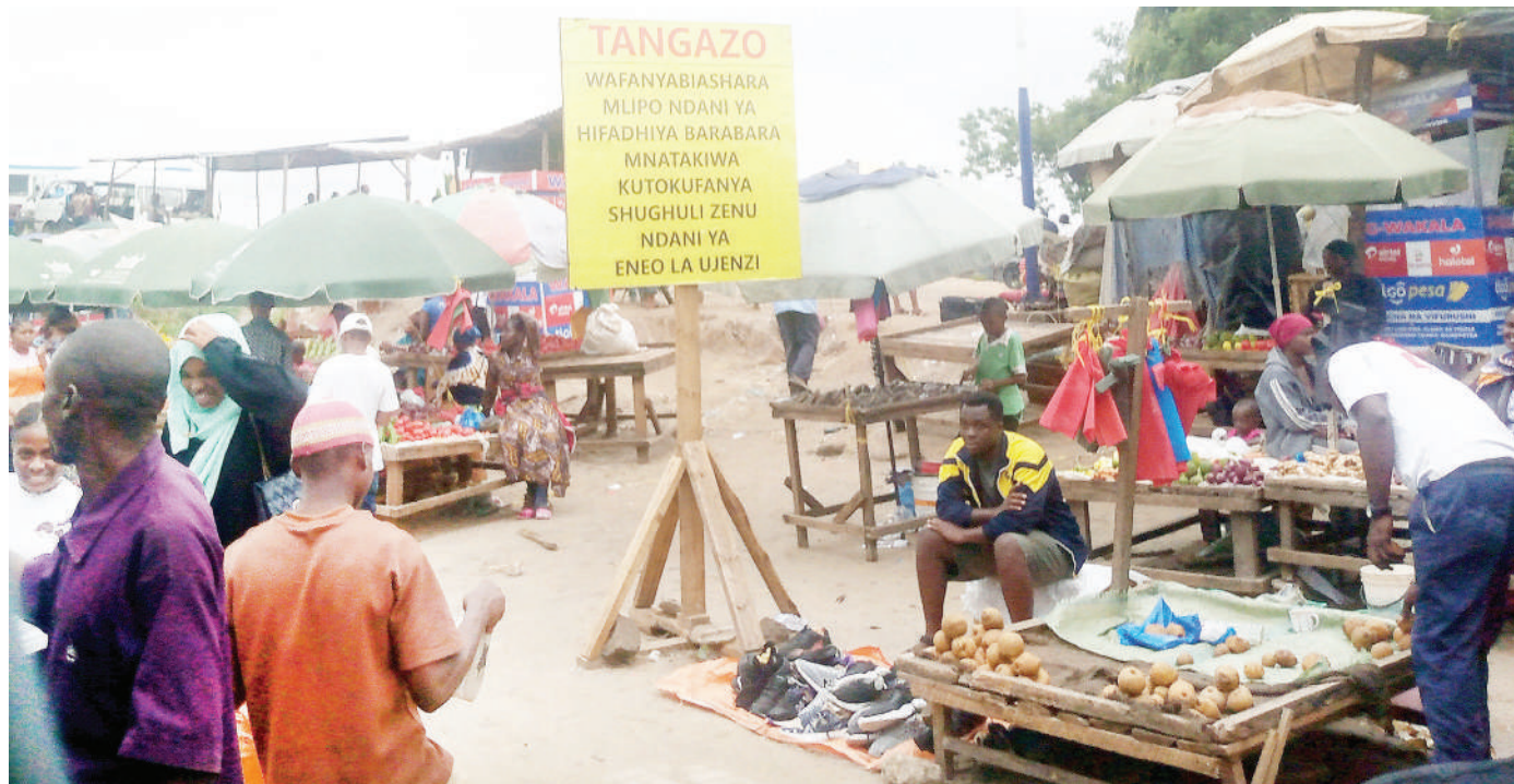
Wafanyabiashara wadogo maarufu Machinga wakifanya shughuli zao katika eneo la Kimara Mwisho, Dar es Salaam jana, licha ya kuwapo bango lenye ujumbe unaowazuia kufanya hivyo.

Natoa saa mbili taka hizi ziondolewe hapa, suala la kusema trekta halina mafuta mara bovu sitaki kusikia, hivi wananchi wanatuelewaje?