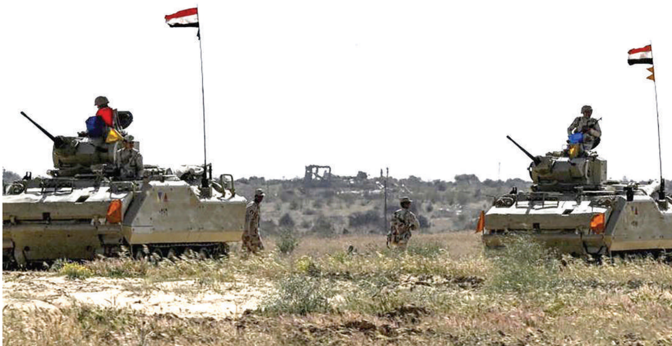
Vifaru vya wanajeshi wa Misri vikipiga kambi karibu na kivuko cha Rafah, baada ya kuwepo kwa mvutano kati ya Misri na Israel karibu na eneo la Philadelphia Corridor.