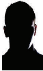
Na Halfani Chusi

KUNA jambo fulani hata rais mwenyewe aliomba, akiwataka viongozi walioko katika nafasi zao, wafike waliko wananchi kusikia kero zao na kuzifanyia kazi 'akiwapiga' na msamiati 'msijifungie ofisini.' Hiyo nilipenda!