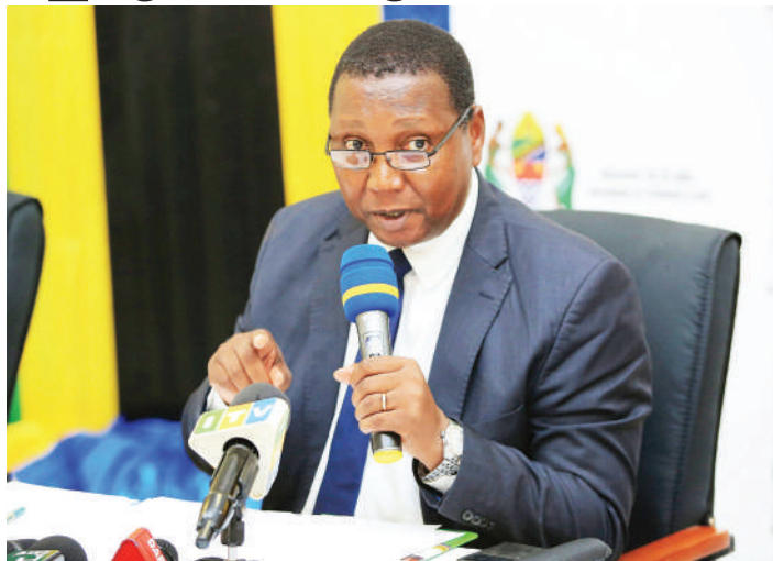
Waziri wa Elimu, Sayansi na Teknolojia, Prof. Adolf Mkenda.

Akijibu swali la Mbunge wa Viti Maalum (CCM), Nora Mzeru aliyehoji ni lini serikali itaajiri walimu wa kutosha kutokana na ongezeko kubwa la wanafunzi, Waziri wa Nchi Ofisi ya Rais Tawala za Mikoa na Serikali za Mitaa (TAMISEMI), Mohamed Mchengerwa, alisema inatarajia kuajiri walimu 12,000 kukidhi mahitaji hayo. Alisema pia serikali imekuwa