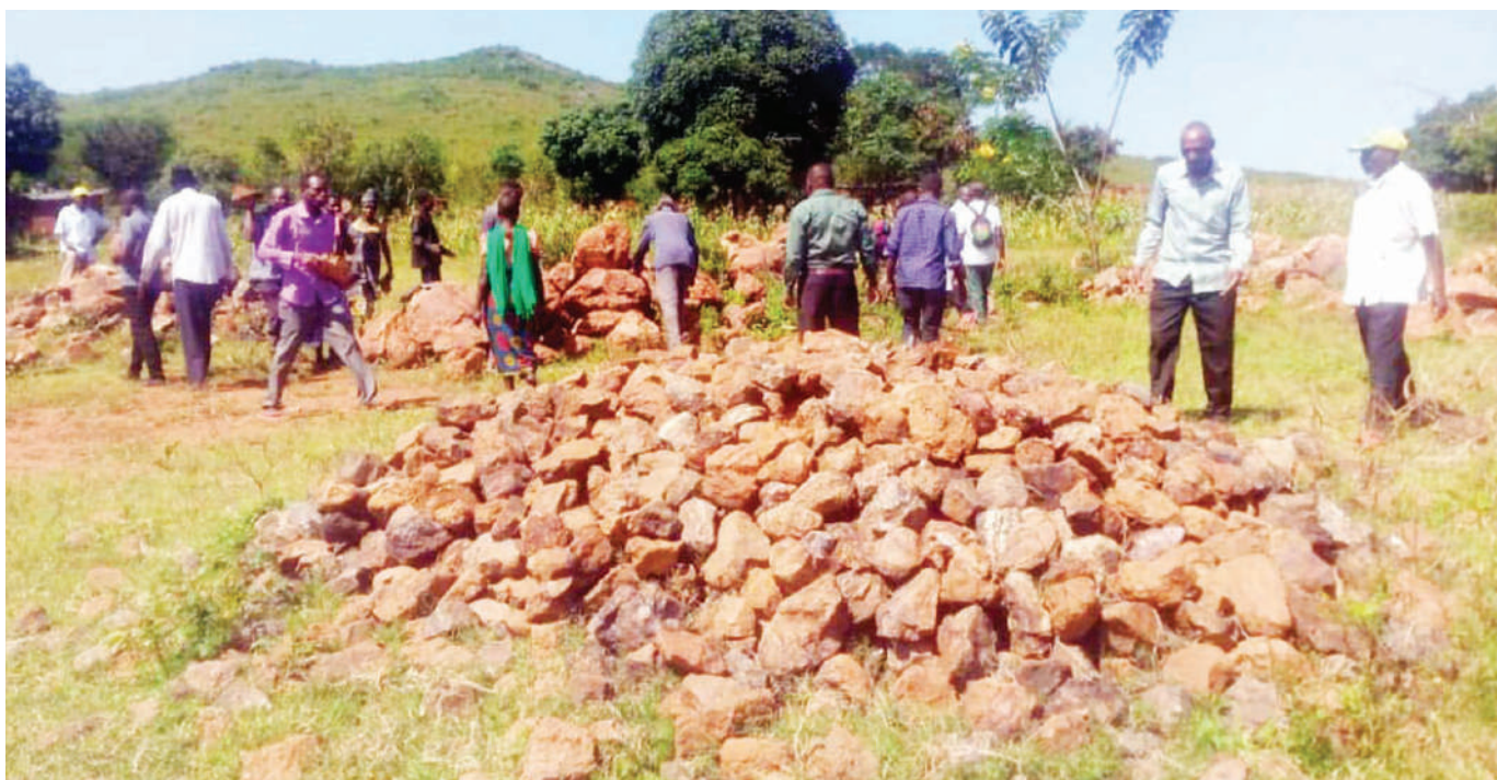
Baadhi ya wakazi wa Kijiji cha Nyabaengere, Kata ya Musanja, Wilaya Musoma mkoani Mara, wakisomba mawe juzi, kwa ajili ya ujenzi wa zahanati ya kijiji hicho ili kuwaondolea usumbufu wa kusafiri umbali mrefu kufuata huduma za afya. PICHA: MPIGAPICHA WETU

Kodi ya awali ilikuwa Sh.11, 000, lakini baada ya majadiliano ilishuka hadi Sh. 8,000, ingawa nayo inaelezwa kuwa kikwazo kwa baadhi ya wafanyabiashara kuendelea na biashara zao.