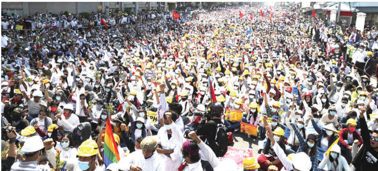
Waandamanaji wanaopinga mapinduzi wakiwa wameinua mikono kwa kukunja ngumi, wakati wa mkutano karibu na Kituo cha Reli cha Mandalay, Myanmar, jana, ikiwa ni wiki ya tatu mfululizo wa maandamano kwenye miji mikubwa nchini humo, tangu jeshi lichukue nchi.