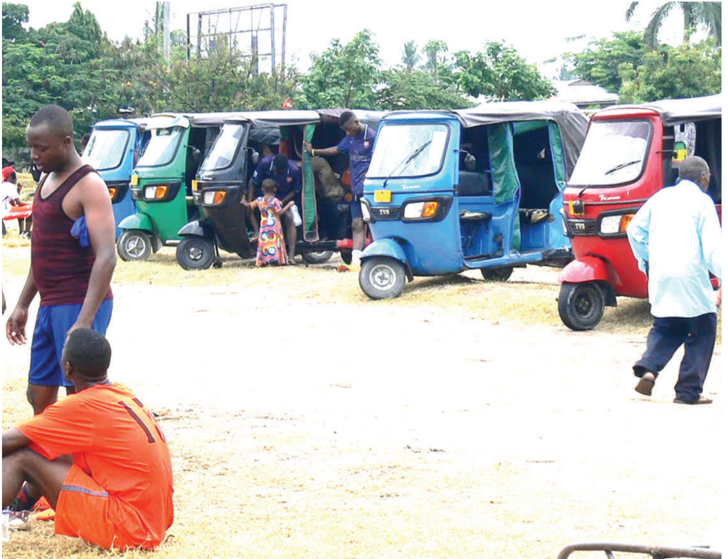
Bajaji na pikipiki ni usafiri muhimu lakini kama hautadhibitiwa unakuwa kero.

vile wanafahamu waathirika wakubwa wa kupigwa faini ni wale wanaoendesha magari.