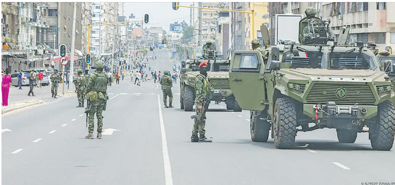
Maofisa wa usalama nchini Msumbiji wakiwa barabarani kufanya doria ya kuzuia maandamano jana.