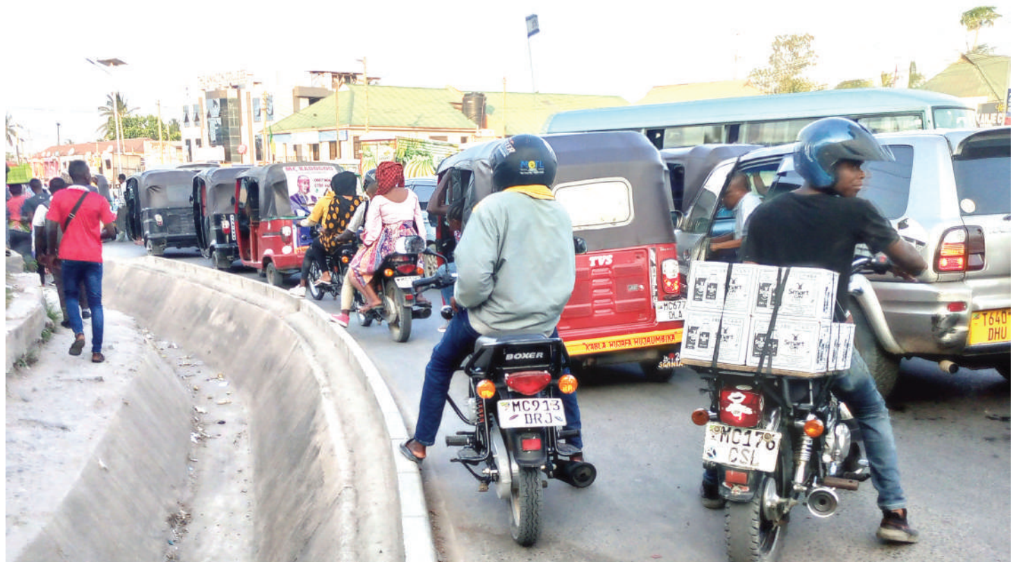
Fujo zinazotokana na vurugu za msongamano barabarani.

Polisi wanasema kitaifa Ilala ni mkoa unaongoza kijajali zikifikia 514,951, Kinondoni 259,707