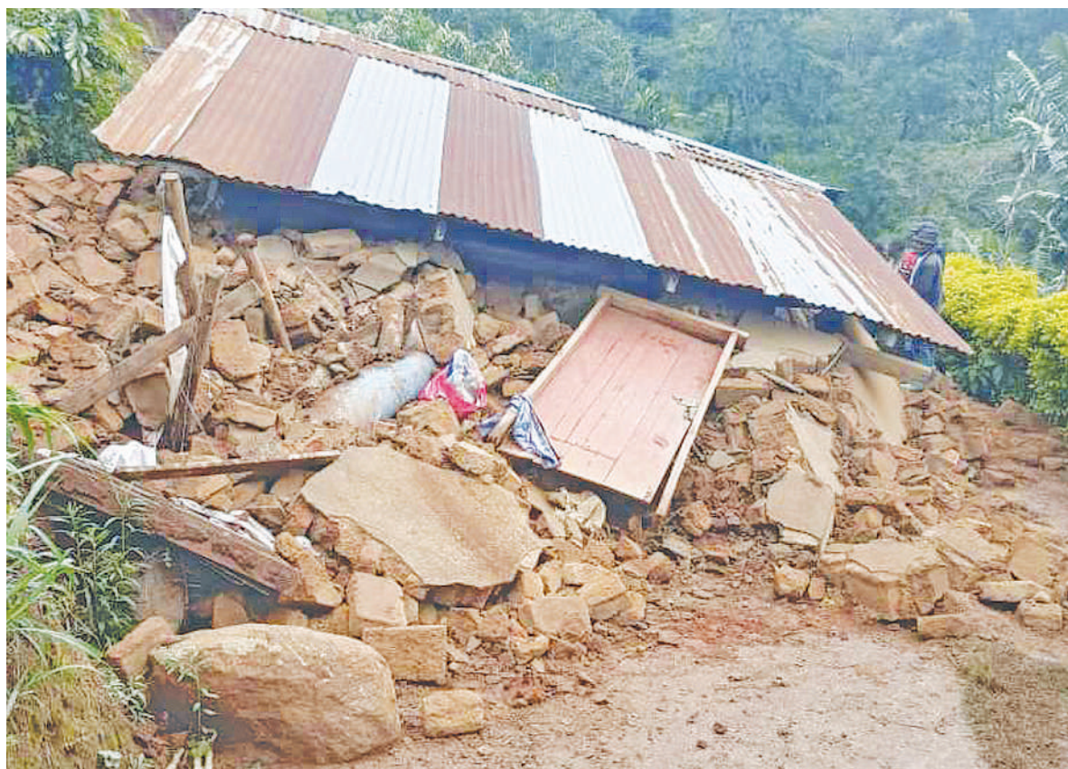
Moja ya nyumba 25 zilizobomoka kutokana na mvua inayoendelea kunyesha wilayani Same, mkoani Kilimanjaro. Watu sita wameripotiwa kufariki dunia.