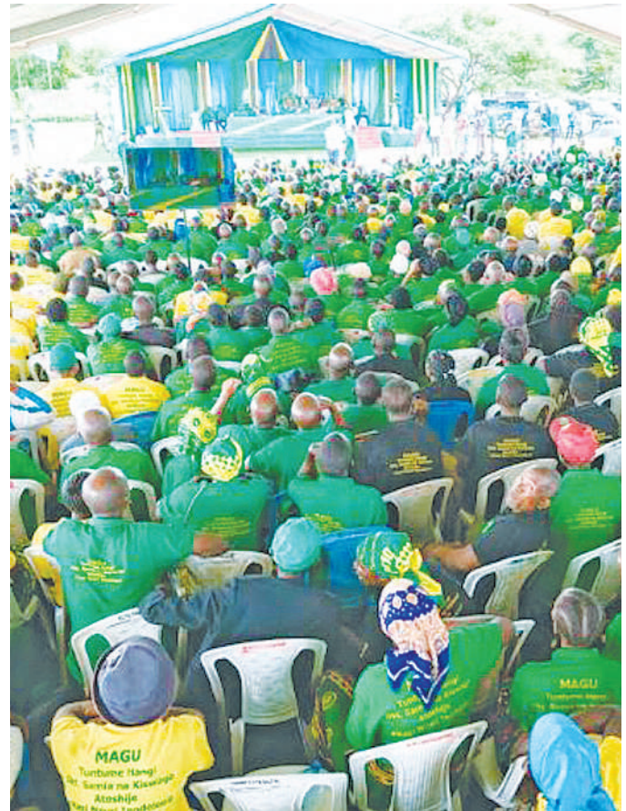
Wajumbe wa Mkutano Mkuu wa Jimbo la Magu wakisikiliza taarifa ya utekelezaji wa Ilani ya Chama Cha Mapinduzi (CCM) kwa kipindi cha mwaka 2020-2024 wilayani Magu, jana.

Alisema pamoja na kutumia taarifa za kiintelijensia wataendelea kutumia taarifa za wananchi katika kufanya msako ili kuhakikisha wakazi wa Dodoma wanakuwa salama wakati wote.