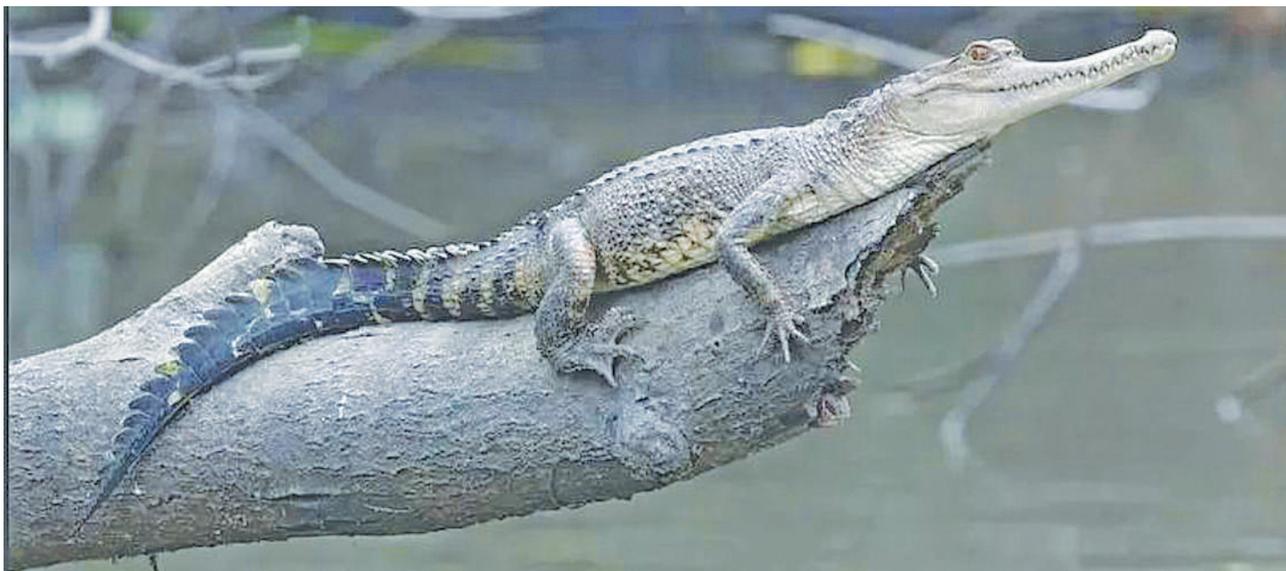
Mamba mdogo aliyegunduliwa ndani ya bonde la Mto Congo mwaka 2018.

B ONDE la Mto Congo maarufu 'mapafu ya Afrika' ikimaanisha kuwa limesheheni misitu minene inayofyonza hewa ya kabon na kuachilia oksijen, linaendelea kuwa makazi ya viumbe wanaofahamika na wapya wanaogundulika zama hizi.