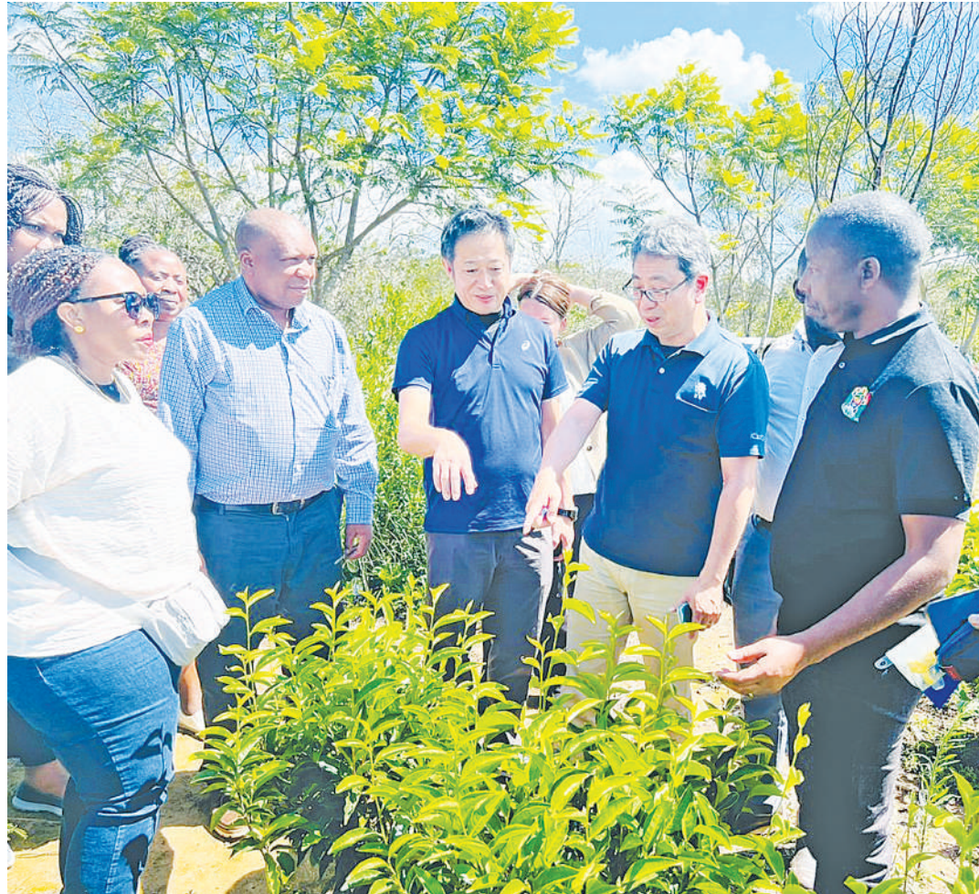
Wawekezaji kutoka Japan na baadhi ya viongozi wa TBT wakiwa katika ziara ya mashamba ya chai.

Wanasifu kuwa chai ya Tanzania ni bora na wameona yenye majani