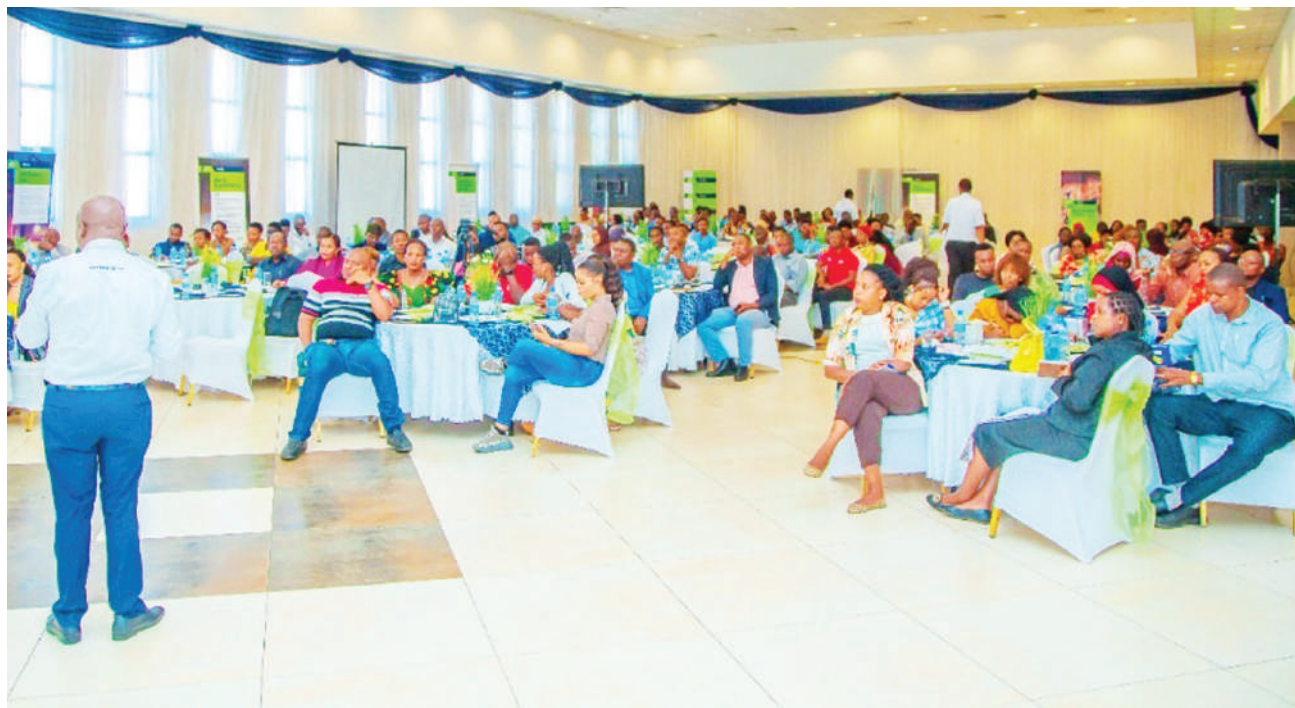
Wafanyabiashara wakiwa katika kongamano la kibiashara lililoandaliwa na Benki ya KCB Tanzania linalofahamika Biashara Club, jijini Mwanza, ambapo wafanyabiashara walipata semina elekezi kutoka kwa viongozi, wafanyakazi na wadau wa benki hiyo kuhusu njia na mbinu zinazoweza kuongeza ufanisi katika biashara zao. NA MPIGAPICHA WETU