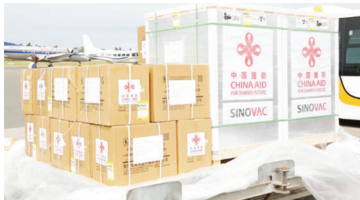
Msaada wa China wa Chanjo ya Sinovac ya COVID-19 na sindano ukiwasili kwenye Uwanja wa Ndege wa Kimataifa wa Abeid Amani Karume huko Zanzibar, Tanzania, Julai 31, 2021.

- China imejenga majukwaa ya ushirikiano wa maendeleo kati ya nchi zote. Imeshiriki kikamilifu katika ushirikiano wa maendeleo ya kimataifa chini ya mfumo wa UM. Mnamo mwaka