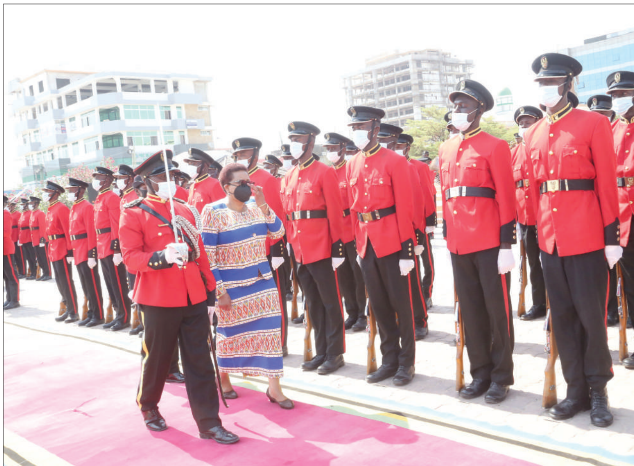
Waziri wa Ulinzi, Dk. Stergomena Tax, akikagua gwaride lililoandaliwa maalumu kwa ajili ya maadhimisho ya Siku ya Umoja wa Mataifa (UN), yaliyofanyika Viwanja vya Nyerere Square jijini Dodoma, mwisho wa wiki.