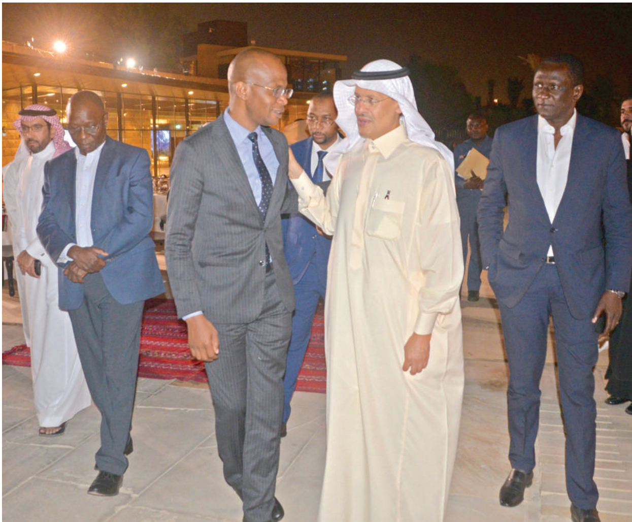
Waziri wa Nishati, January Makamba (kushoto), akiongozana na mwenyeji wake ambaye ni Waziri wa Nishati wa Saudi Arabia, Abdulaziz bin Salman Al Saud, baada ya kumaliza kikao chao kilicholenga kudumisha uhusiano katika sekta ya nishati na kuwasilisha ujumbe wa Rais Samia kwa Serikali ya Saudi Ara- bia.