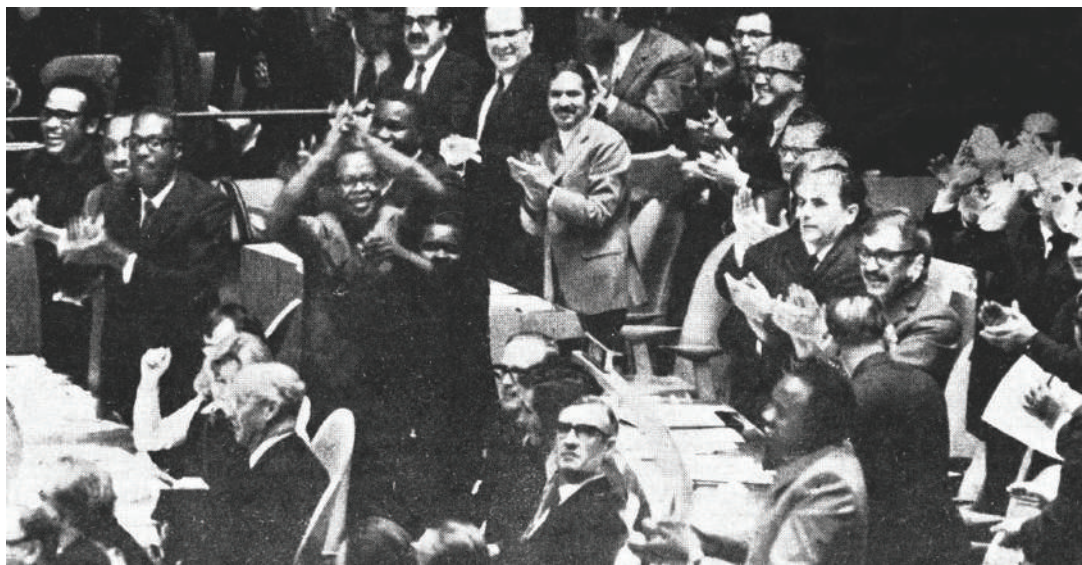
Wajumbe wa nchi nyingi wakipiga makofi wakati wa Mkutano Mkuu wa 26 wa Umoja wa Mataifa ukipitisha Azimio 2758 la kurejesha haki zote halali za Jamhuri ya Watu wa China katika Umoja wa Mataifa, New York, U.S., Oktoba 25, 1971.

China haitasahau kuwa ni idadi kubwa ya nchi zinazoendelea ambazo ziliwezesha kurejesha kiti halali katika UM. China inaahidi kufanya kazi pamoja na vikosi vyote vinavyoendelea ulimwenguni, milele kusimama na nchi zinazoendelea na kusimamia haki ya kimataifa kwa kura yake katika Umoja wa Mataifa. China iko tayari kuendelea kusaidiana na Tanzania na nchi zingine zote zinazoendelea juu ya maswala yanayohusu masilahi ya msingi ya mtu mwingine na shida kubwa, na kuimarisha mawasiliano juu ya mambo muhimu ya kimataifa na ya kikanda ili kutetea umoja wa kweli pamoja na kufuata haki zaidi na usawa wa kimataifa.