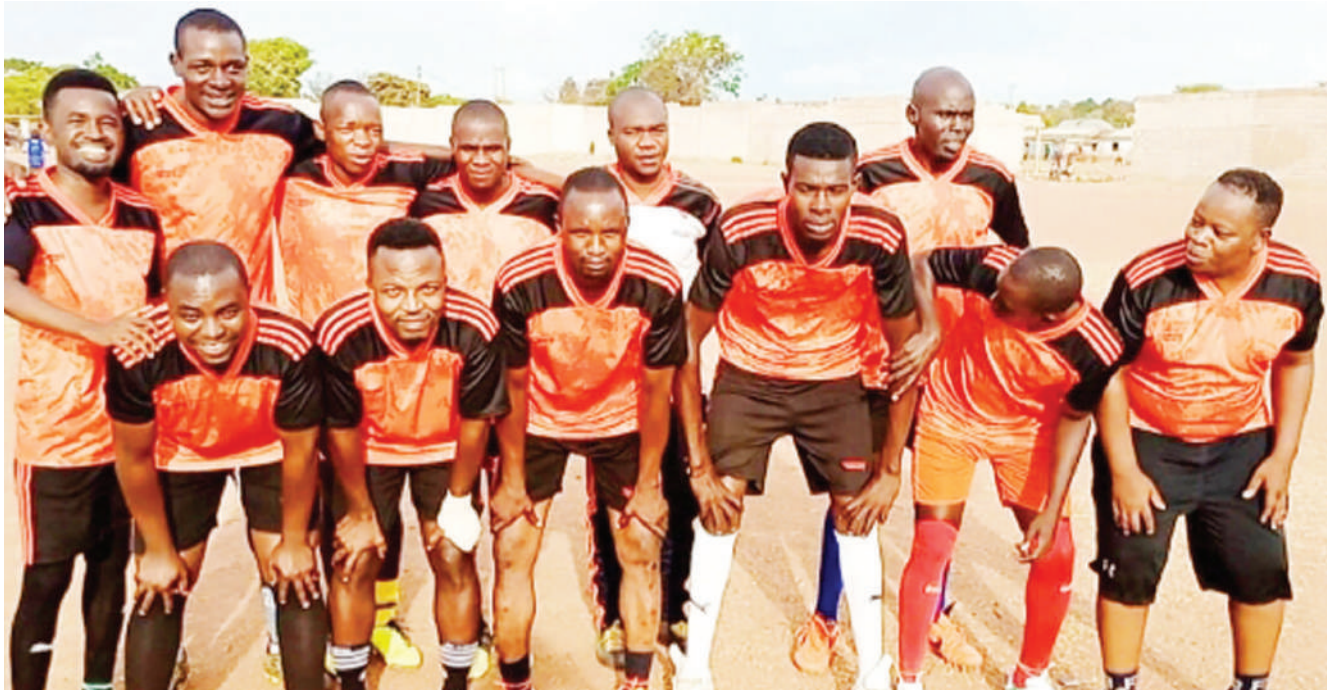
Kikosi cha mabingwa watetezi michuano ya Umoja Cup inayoendelea wilayani Rorya, Shirati Mji fc. NA MPIGACHA WETU

Wafanyakazi wa sekta ya ujenzi, leo wanacheza na wenzao wa Ofisi ya Katibu Tawala Mkoa wa Mara, kwenye mchezo wa pete, huku katika mchezo wa kuvuta kamba ukiwakutanisha wafanyakazi wa Wizara ya Mambo ya Nje dhidi ya wenzao wa Wizara ya Mambo ya Ndani.