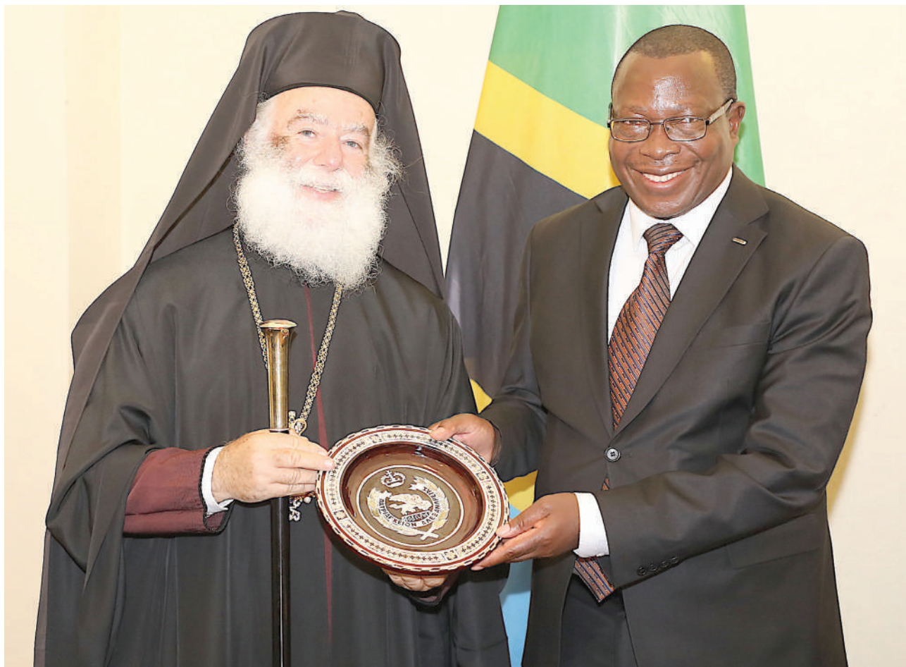
Makamu wa Rais, Dk. Philip Mpango, akipokea zawadi kutoka kwa Kiongozi Mkuu wa Kanisa la Greek Orthodox, Baba Mtakatifu Beatitude Theodoros, Ikulu jijini Dar es Salaam jana.