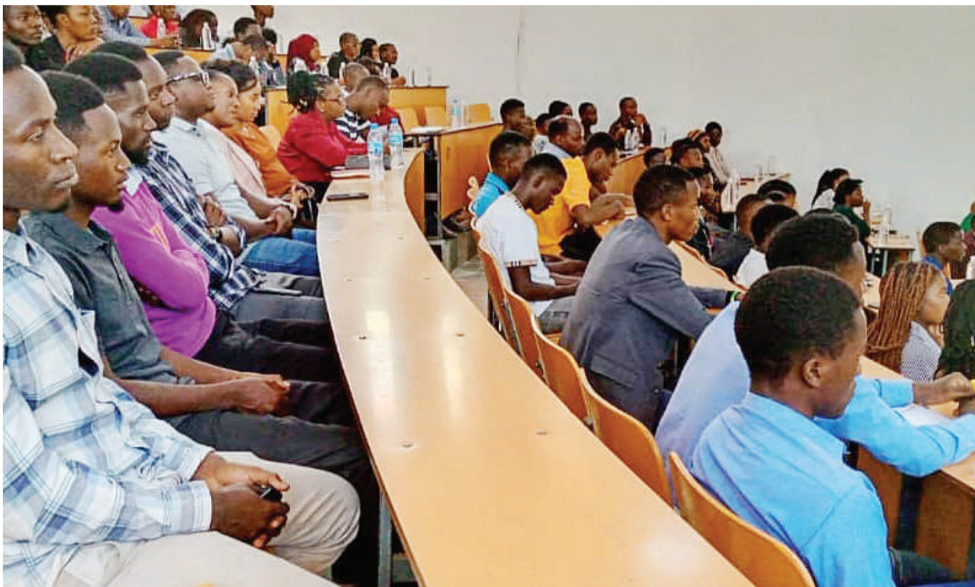
Baadhi ya vijana wa Mkoa wa Mbeya wakifuatilia mafunzo ya ujasiriamali yaliyoandaliwa na seneti ya vyuo na vyuo vikuu vya mkoa huo katika Chuo cha Mzumbe Kampasi ya Mbeya.