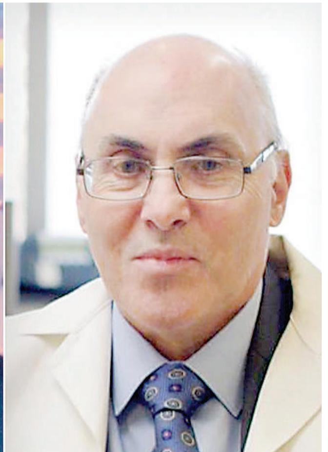
Wanasayansi Kataline Kariko na Drew Weissman.