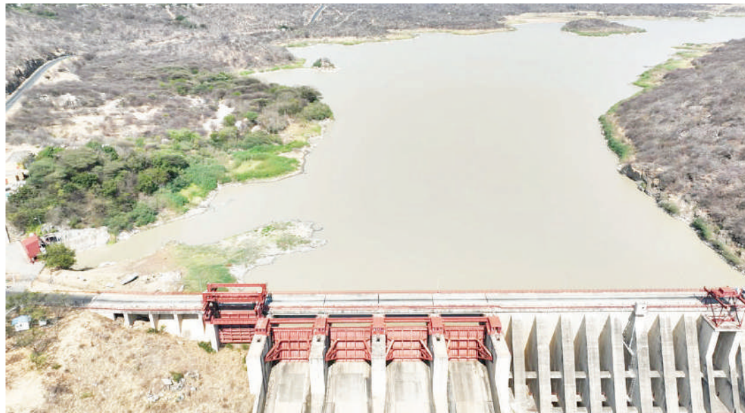
Bwawa la kufua umeme Mtera ni chanzo kinachotishiwa na ukame na kusababisha mgao.

Anataja faida za mradi wake kuwa ni kupata umeme wa uhakika wakati wote kwa bei nafuu na mahali popote na kwamba mtambo huo unaweza