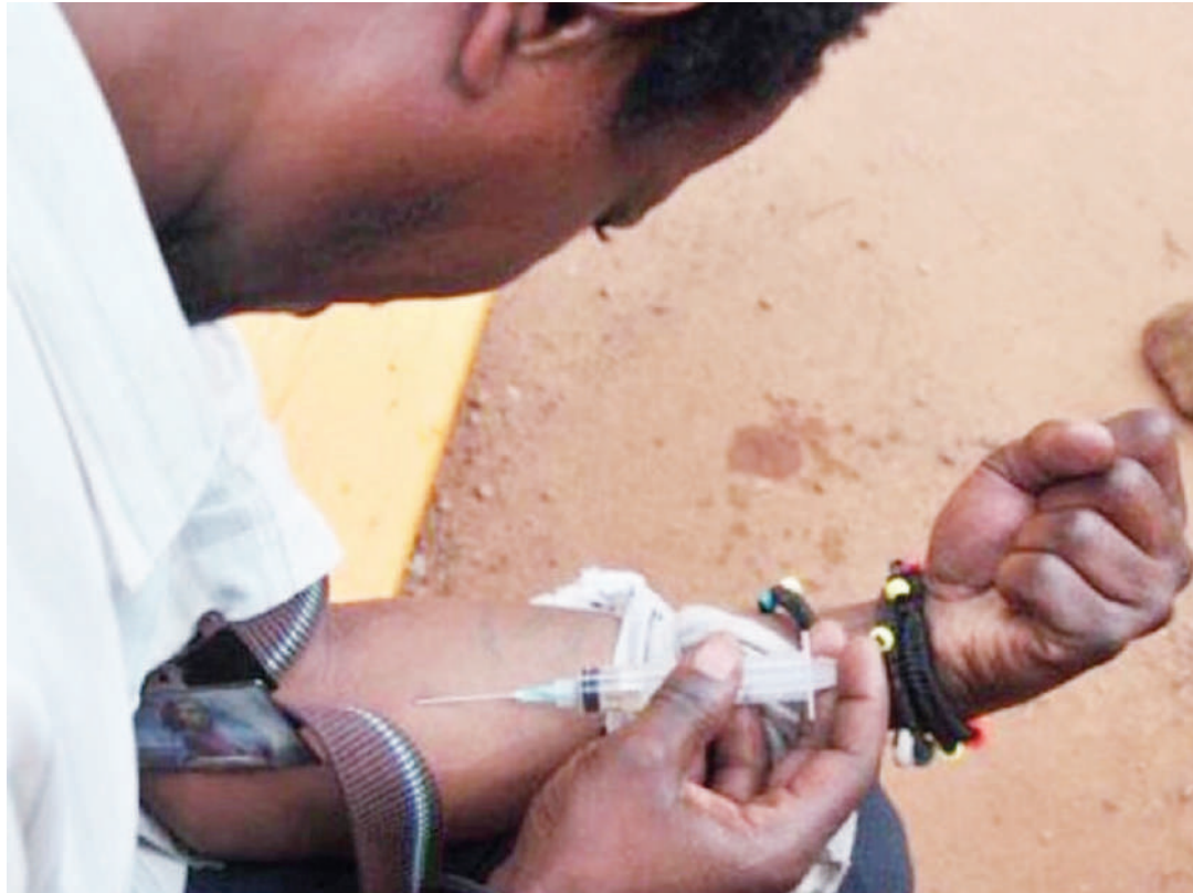
Sindano zinazotumiwa na waraibu wanaojidunga husambaza maradhi na taka mitaani.

Ripoti hiyo inaeleza kuwa wanaojidunga dawa za kulevya husababisha uchafuzi wa mazingira kwa kutupa sindano ambazo ni hatari pia vichochochoni, viwanja vya michezo, fukweni na vituo vya mabasi.