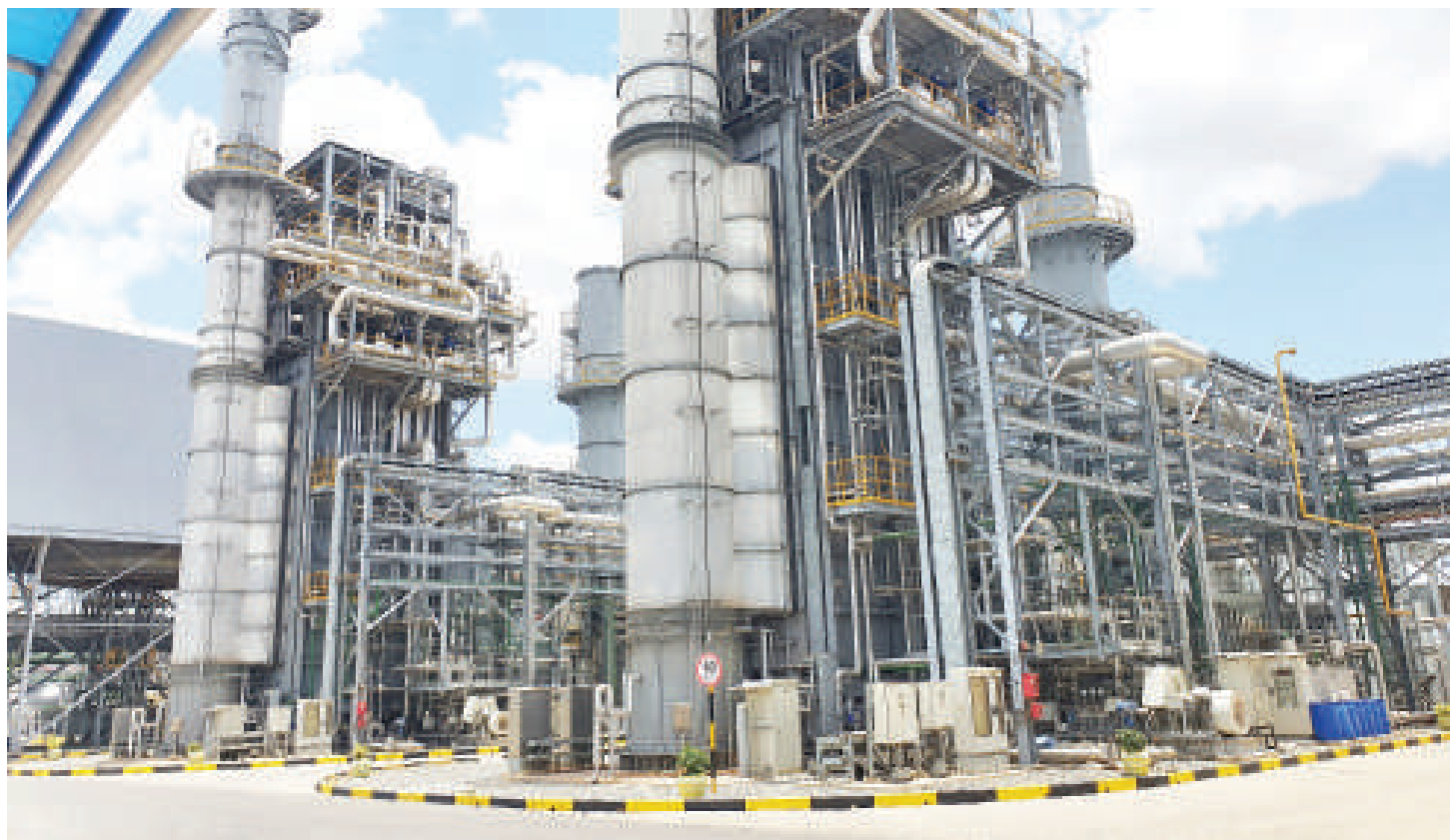
Kituo cha kufua umeme wa gesi cha Kinyerezi 11 jijini Dar es Salaam, gesi asilia inaelezwa kuwa chanzo cha ongezeko la joto duniani na mabadiliko ya tabianchi.

• Kuelekea mwisho wa enzi hakuna nishati salama