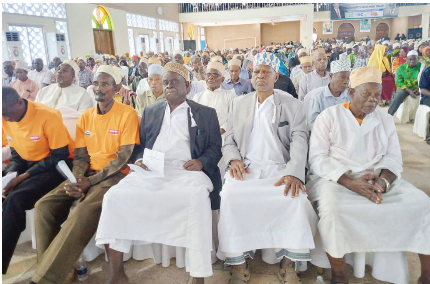
Baadhi ya wazee wakifuatilia hotuba katika Maadhimisho ya Siku ya Wazee Duniani yaliyofanyika katika ukumbi wa mikutano wa Chuo Kikuu cha Zanzibar (SUZA) jana.