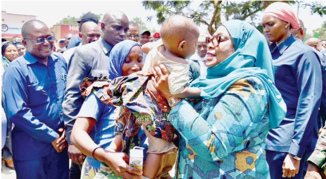
Rais Samia Suluhu Hassan akionyesha mapenzi kwa watoto.

Kuwadharau wasichana na watoto wa kike kumesabisha kuendelea hata leo mila na desturi zinazozimiza watoto wa kike kama mimba na ndoa za utotoni, uketaji na matendo ya ukatili dhidi