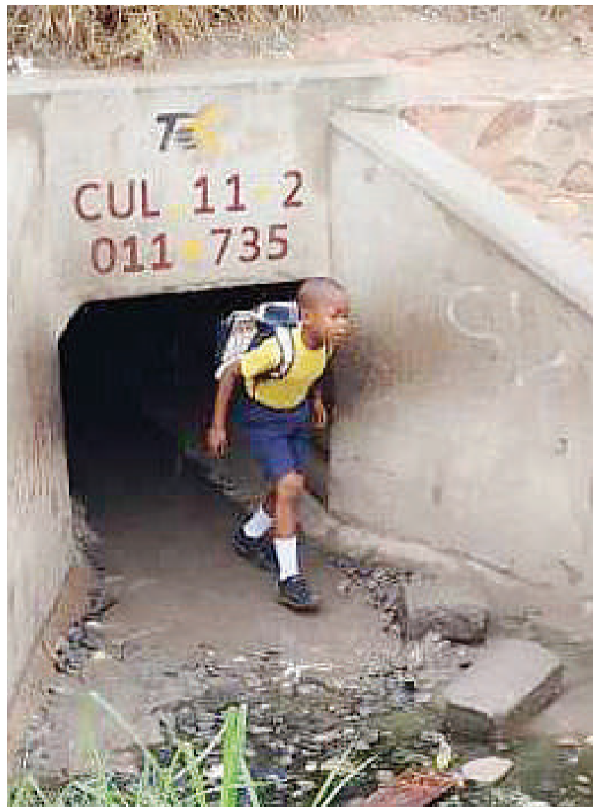
Mwanafunzi katika Mtaa wa Stakishari, Kata ya Ukonga Manispaa ya Ila-Ila, akipita chini ya karavati baada ya kivuko kujengwa eneo la mbali kutokana na ujenzi wa reli ya mwendokasi. Eneo hilo hutumiwa na wakazi wake kama njia ya kutokea upande wa pili.

Kamanda Masejo alisema hawawezi kutaja jina la marehemu na mtuhumiwa kwa sasa mpaka uchunguzi utakapokamilika.