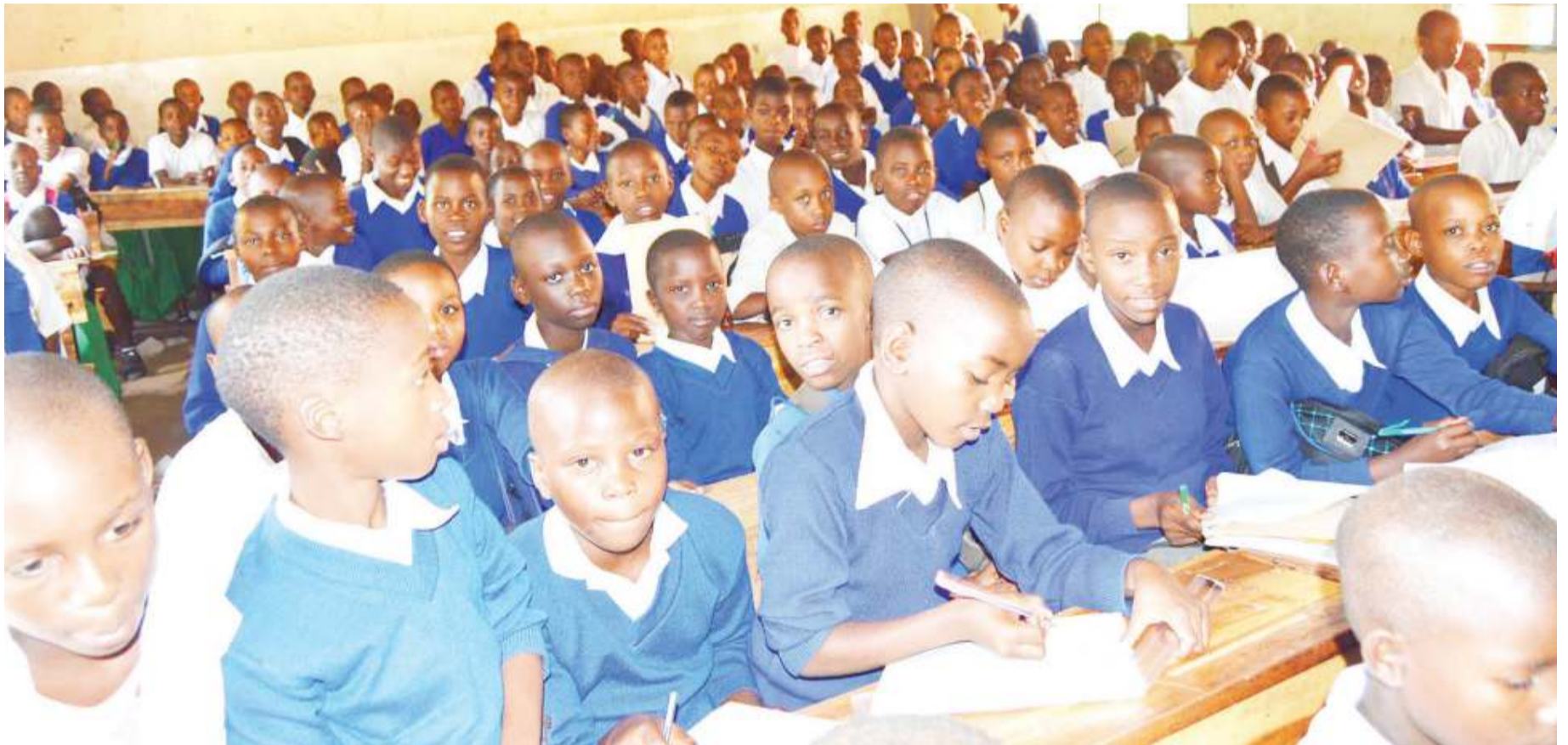
Watoto kama hawa wanastahili kupata haki yao ya elimu na si kuwaingiza kwenye ajira za utotoni.

A JIRA ni shughuli yeyote halali anayoifanya mtu ili kujiingizia kipato na hatimaye kuweza kumudu kuendesha maisha yake.