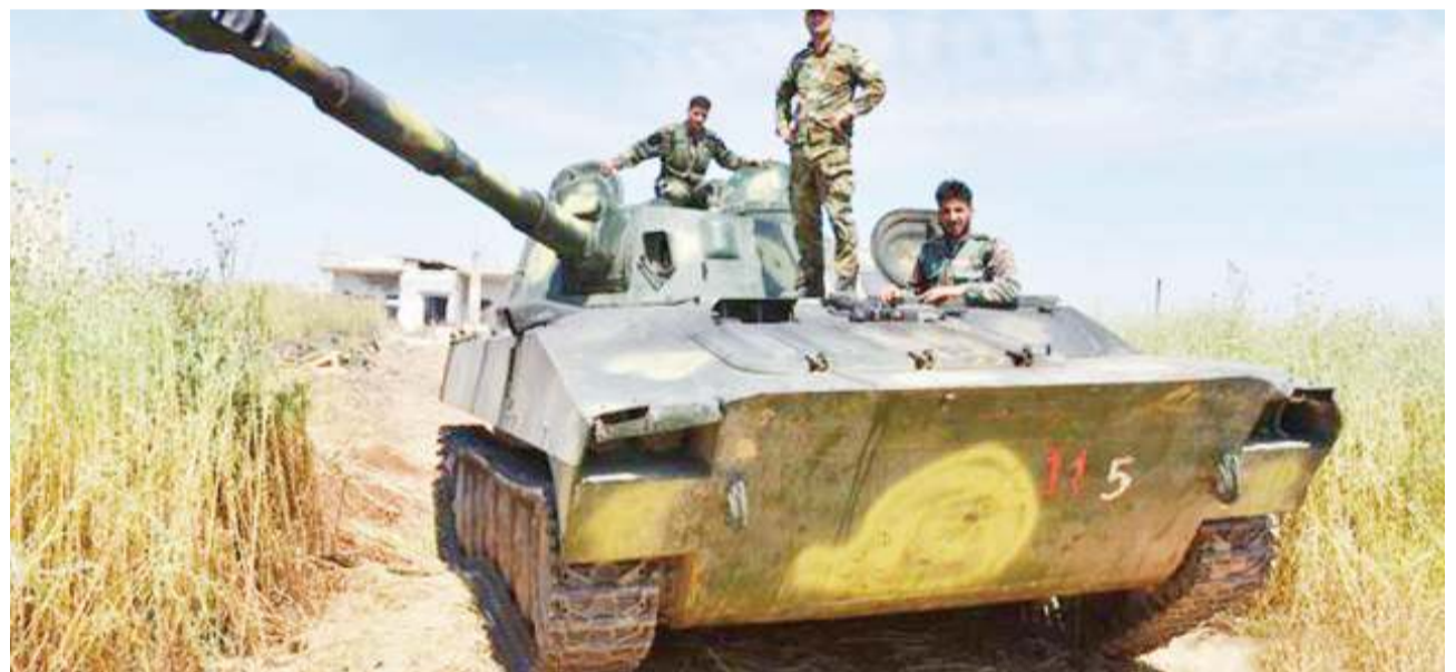
Wapiganaji wa jamii ya Wakurdi nchini Syria wakiwa wamejiandaa kukabiliana na vikosi vya majeshi ya Uturuki.

Abiria wote 189 na wahudumu wa ndege walifariki wakati ndege ya Boeing 737 Max ilipoanguka baharini dakika 13 tu baada ya kuondoka kutoka katika Mji Mkuu wa Indonesia Jakarta Oktoba 29, 2018. BBC