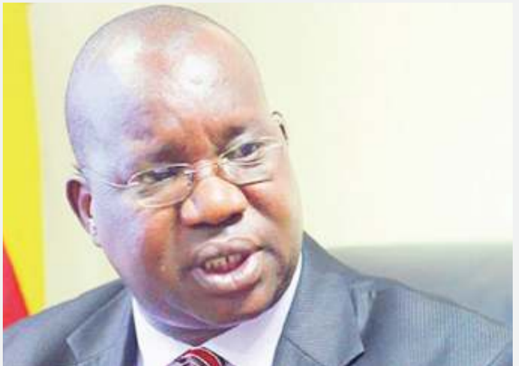
Waziri wa Maadili wa Uganda, Simon Lokodo.