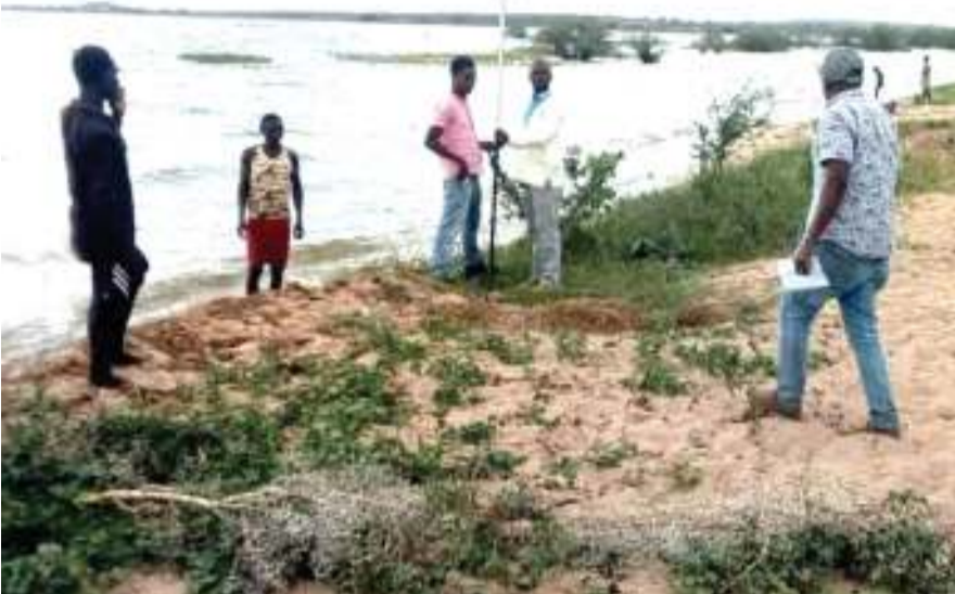
Baadhi ya wataalamu kutoka Wizara ya Maji na Umwagiliaji na Ofisi ya Wakala wa Maji Vijijini (RUWASA), Wilaya ya Musoma, wakipima eneo litakapowekwa bomba la maji kutoka Ziwa Victoria, mkoani Mara, na kusambazwa katika baadhi ya vijiji vya Musoma, kupitia mradi wa maji wa maziwa makuu ulioanza wiki iliyopita.

Alisema bajeti ya mwaka wa masomo 2018/19 ilikuwa Sh. bilioni 427.5 na iliwanufaisha wanafunzi 123,329.