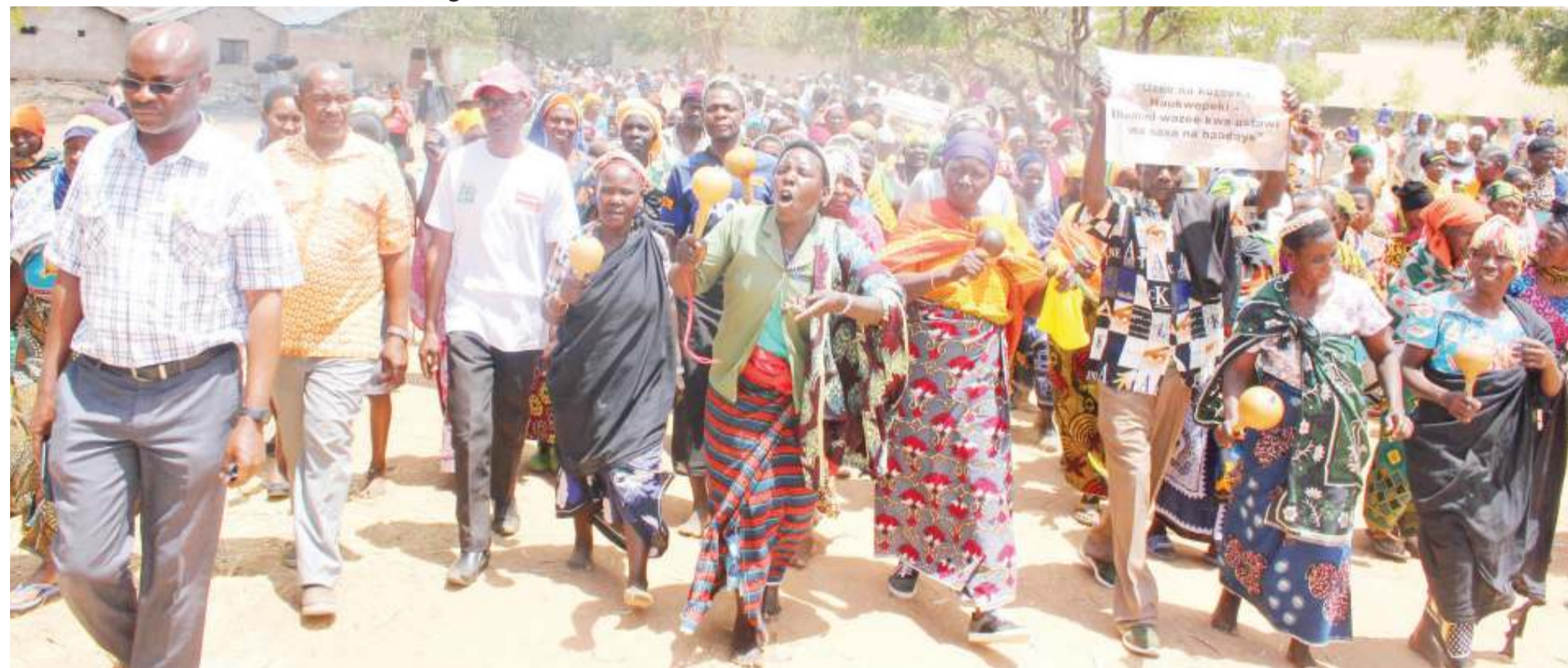
Wazee wa Wilaya ya Shinyanga wakiwa kwenye siku ya maadhimisho ya wazee duniani yaliyofanyika katika Kata ya Tinde Shinyanga vijijini.

• Ni kuhusu Sera ya Wazee • Wataka itekelezwe kwa vitendo