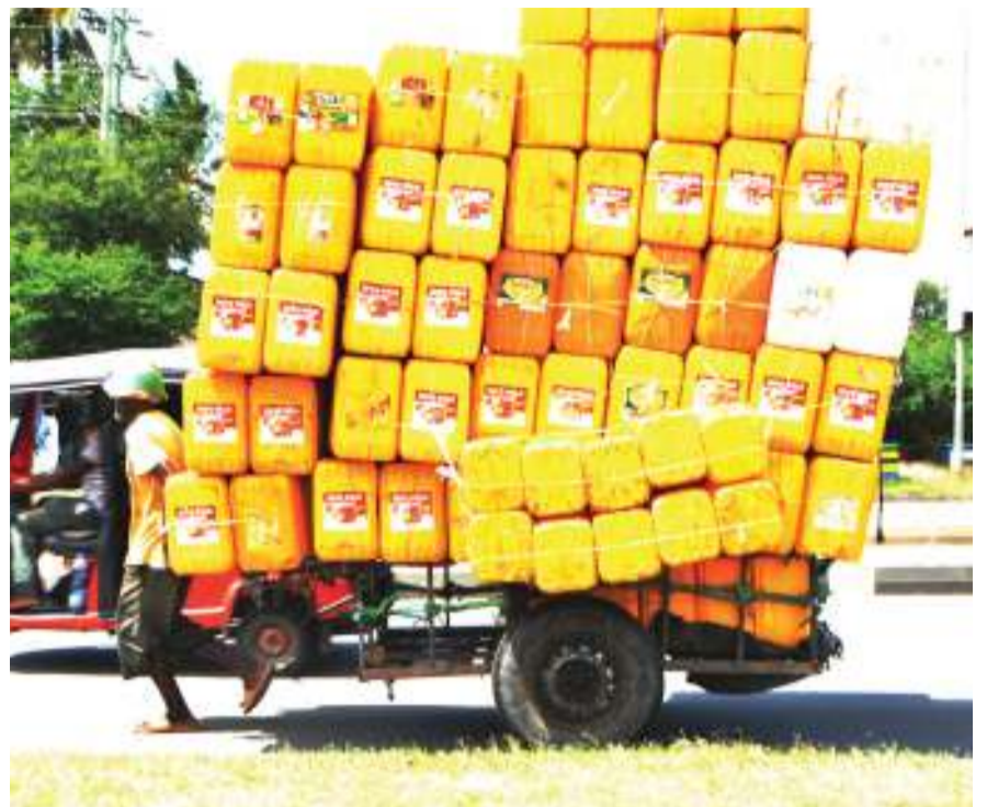
Mwendesha mkokoteni akiwa amesheheni madumu matupu ya plastiki katika eneo la Jangwani, jijini Dar es Salaam jana, kitendo ambacho ni hatari kwa usalama barabarani.

Alitoa mfano kuwa mwanafunzi anapofika darasa la saba na kutaka kusajiliwa kwa ajili ya mitihani, mwalimu mkuu anapaswa kuweka namba aliyotumia kujisajili alipokuwa darasa la nne kwa kuwa italeta jina sahihi alilojiandikisha nalo wakati huo.