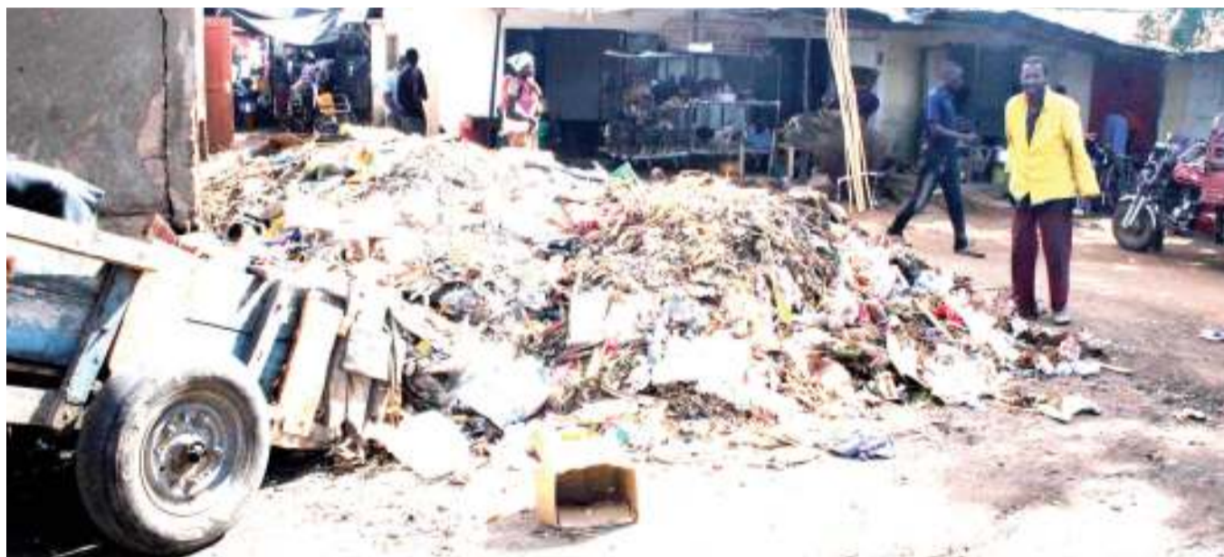
Rundo la takataka likiwa limetelekezwa bila kuzolewa katika Soko la Nguzo Nane, mjini Shinyanga jana, hivyo kuhatarisha afya za wateja na wafanyabiashara wa soko hilo.