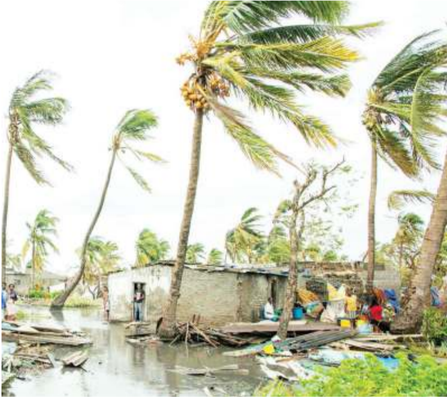
Moja kati ya maafa yaliyosababishwa na mvua.

M AAFA ni matokeo ya majanga au janga ambalo husababisha vifo, upotevu wa mali au mazingira ambapo jamii iliyoathirika haiwezi kukabili kwa uwezo na rasilimali zake bila ya msaada kutoka nje ya jamii hiyo. Janga au Majanga ni balaa au baa linaloweza kusababisha maafa. Ili maafa yatokee ni lazima liwepo janga na vitu vinavyoweza kuathiriwa na janga hilo mfano watu, Miundombinu au mazingira.