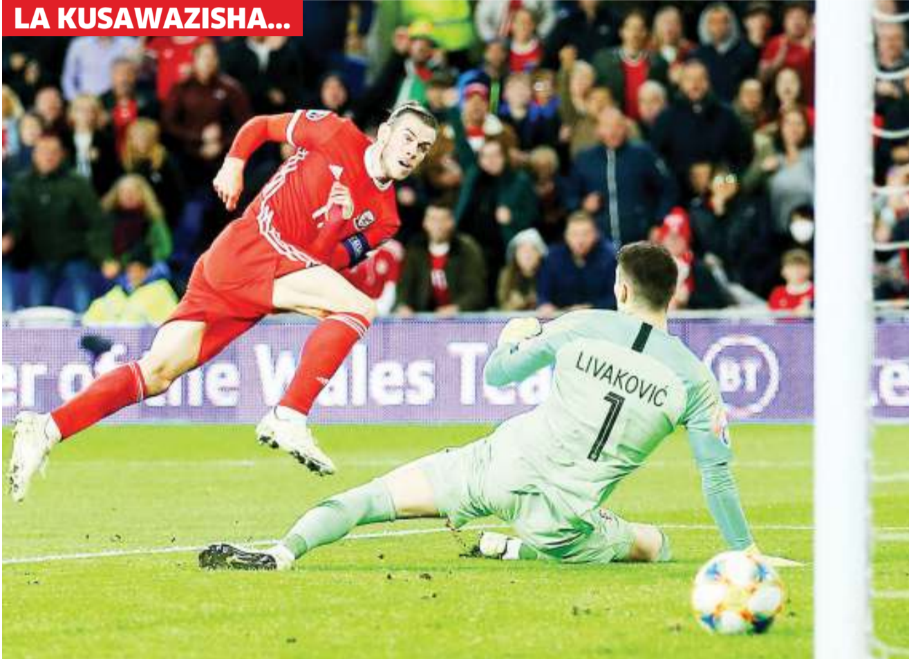
Gareth Bale akiifungia Wales bao la kusawazisha wakati wakitoka sare ya bao 1-1 dhidi ya Croatia kwenye mechi ya kuwania kufuzu Euro 2020 iliyopigwa Cardiff usiku wa kuamkia jana.