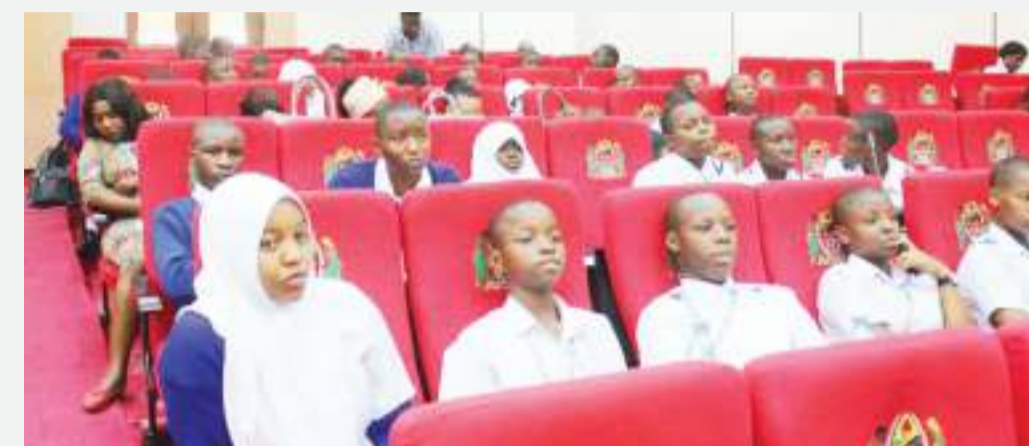
Baadhi ya wanafunzi kutoka vyuo vikuu na shule za sekondari, wakifuatilia mawasilisho ya mtoa mada wakati wa mjadala wa namna ya kupambana na rushwa nchini Tanzania, kongamano lililofanyika jijini Dodoma hivi karibuni.