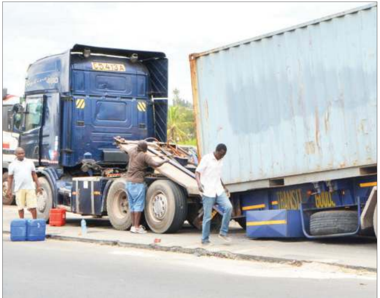
Gari lenye namba C 5413 A likiwa limekatika tela kutokana na kuwa chakavu katika eneo la Kwa Msunguri Mbezi, jijini Dar es Salaam jana.

“Niwaombe sana wananchi wajitokeze kujiandikisha na waachane na upotoshaji unaoendelea kufanywa chinichini na wasiopenda maendeleo ya nchi na endapo mtajiandikisha mtakuwa na uheru wa kuwachagua viongozi mnaowataka ambao watasaidia kukuza amani ya nchi,” alisema.