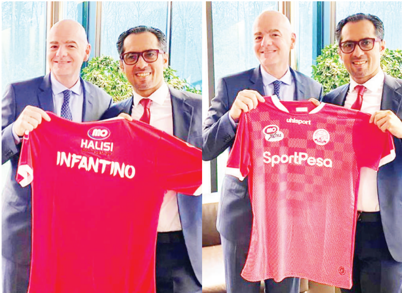
Mwenyekiti wa Bodi ya Wakurugenzi ya Kluba ya Simba, Mohamed 'Mo' Dewji, akimkabidhi jezi ya kluba hiyo, Rais wa Shirikisho la Soka Duniani (Fifa), Gianni Infantino, baada ya kufanya mazungumzo naye makao makuu ya shirikisho hilo, Zurich, Uswisi jana.