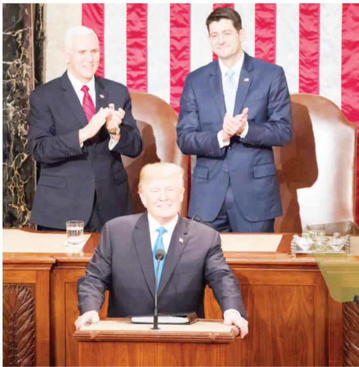
Rais Donald Trump, alipokuwa bungeni mwaka 2018.

“Iran ilishambulia kwa makombora kambi mbili za kijeshi za Marekani nchini Irak na ‘kupandisha utambi’ wa uwezekano wa kutokea mfarakano mpana zaidi ya hapo.