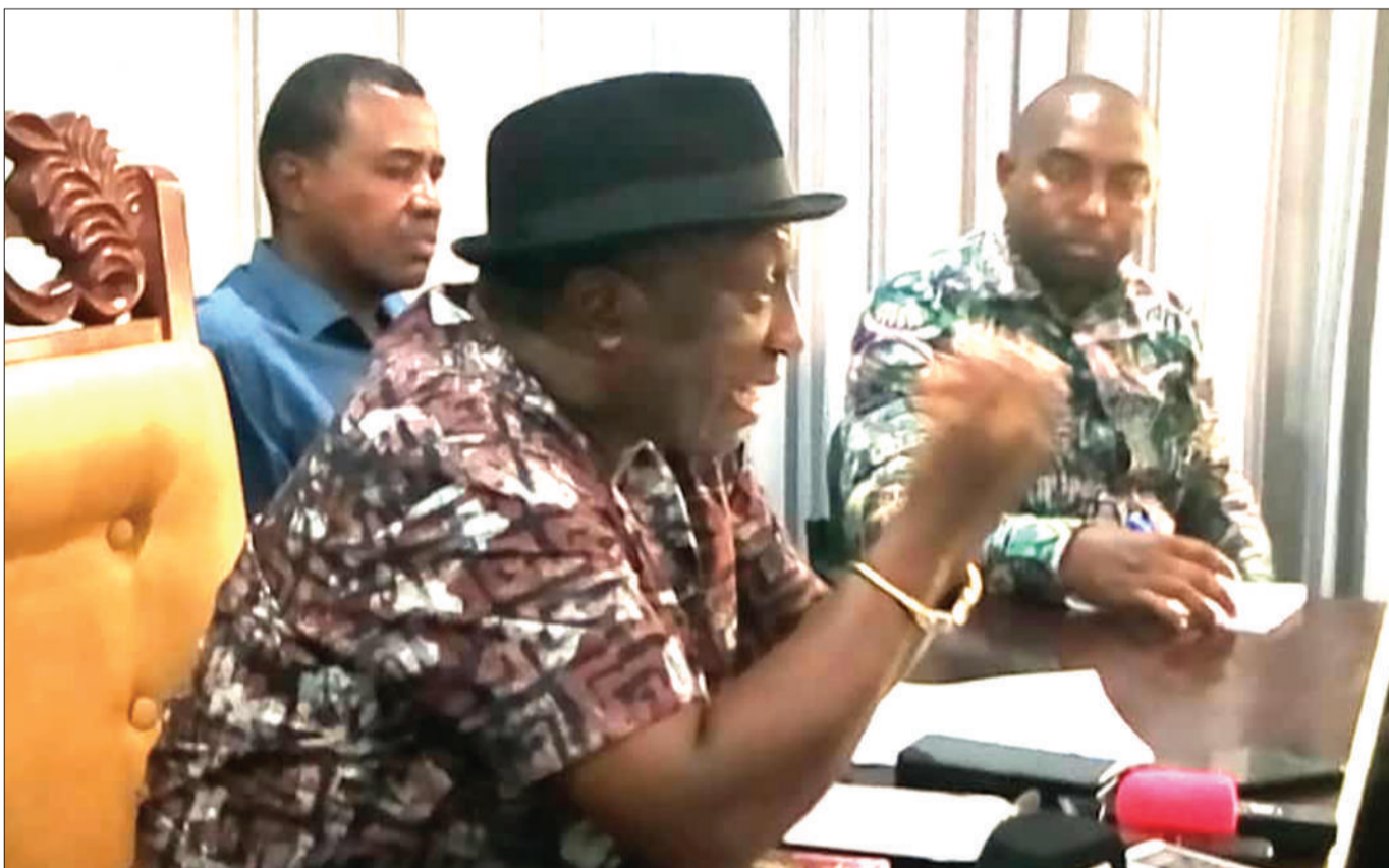
Waziri wa Habari, Utamaduni, Sanaa na Michezo, Dk. Harrison Mwakyembe, akizungumza na waandishi wa habari wa mkoa wa Kilimanjaro hivi karibuni, kuhusu namna ya kutatua changamoto zinawazowakabili wanataaluma hao.

Aina hiyo ya kuchochea utalii haitakuwa ya mara ya kwanza duniani, kwa vile magari ya kutumia nyaya au viberenge yapo nchini Sweden, Italy na Himalayas.