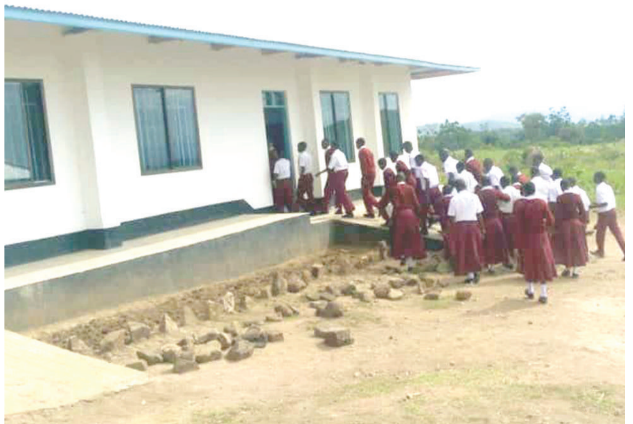
Wanafunzi wa kidato cha kwanza wa sekondari mpya ya Dan Mapigano Memorial ya Kata ya Bugoji, Musoma Vijijini, mkoani Mara, wakiingia darasani juzi, baada ya shule kuanza kupokea wanafunzi kuanzia Januari 16, mwaka huu.

Kesi hiyo imeahirishwa hadi Februari 7, 2020 mwaka huu, itakapoanza kusikilizwa. Kutokana na mwendesha mashtaka kueleza mahakama kuwa upelelezi wa shauri hilo umekamilika.