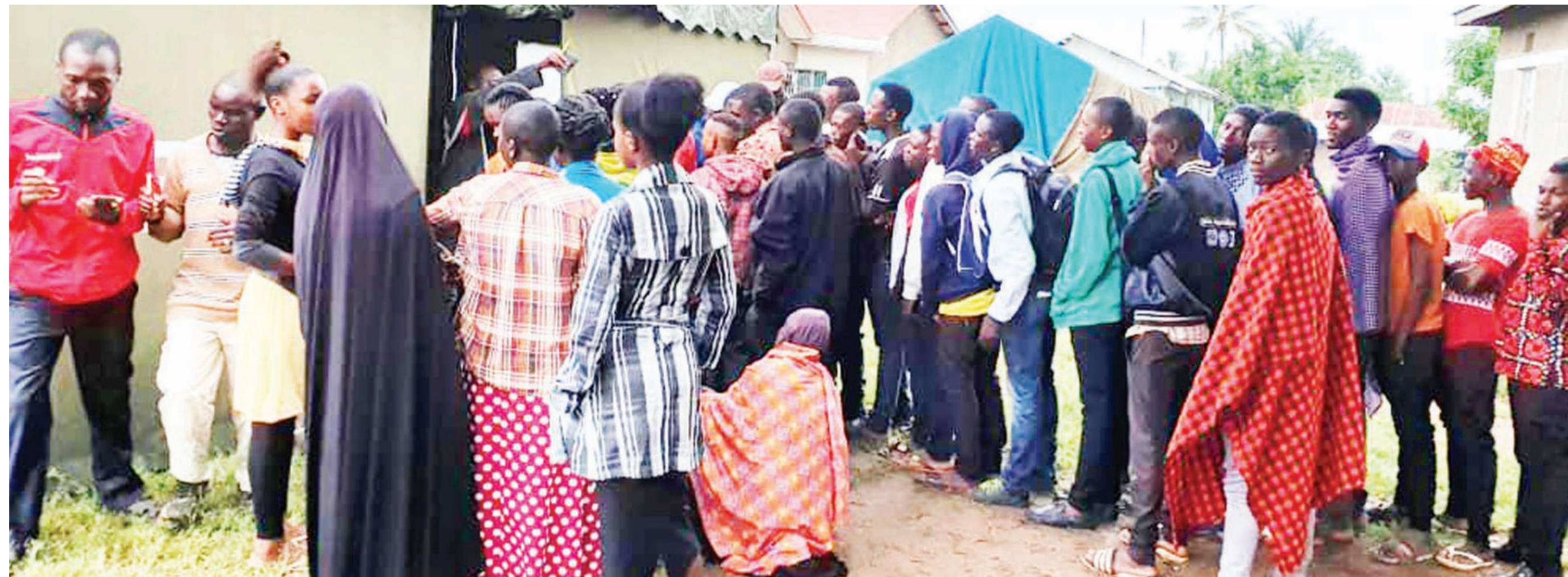
Wananchi wakiwa kwenye foleni katika kituo cha kuandikisha wapiga kura, wakisubiri zamu zao kuingia ndani wajandikishe au kuboresha taarifa zao katika maeneo tofauti nchini.