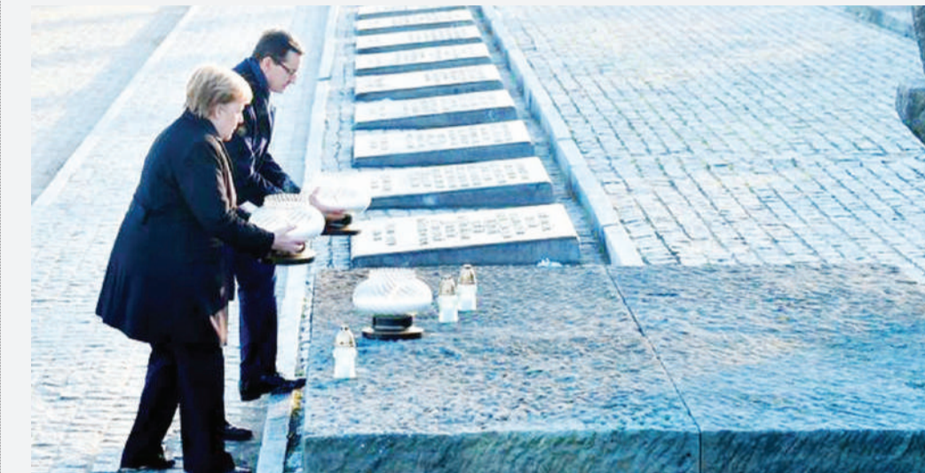
Wazee walioteswa katika kambi hiyo katika zama za utoto wao, wakiweka mashada ya maua kukumbuka wenzao waliokufa.

WATU walionusurika kifo kwenye kambi ya mateso ya Auschwitz, wameku- tana tena kwenye kambi hiyo nchini Poland tangu ilipokombolewa miaka 75 iliyopita.