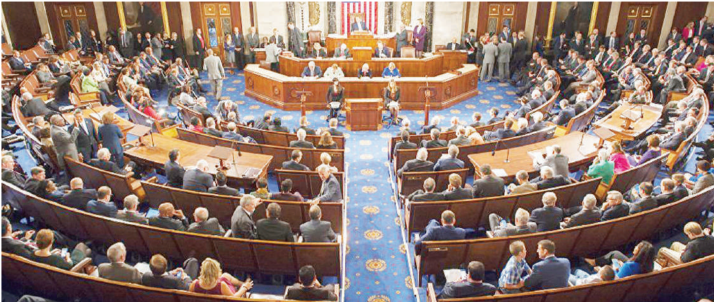
Kikao cha Bunge kikiendelea.