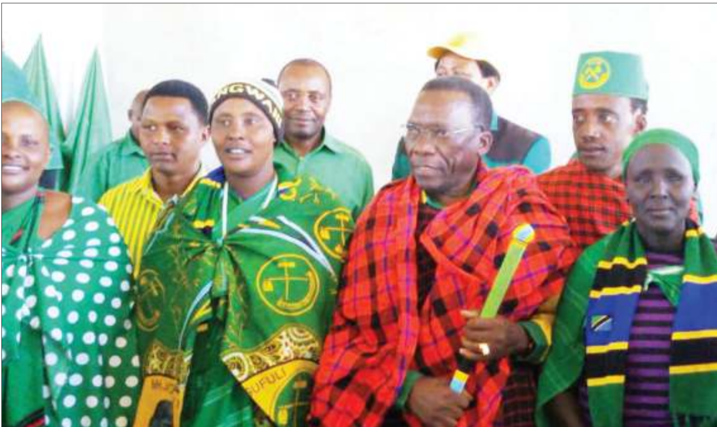
Waziri Mkuu mstaafu, Mizengo Pinda ambaye pia ni mlezi wa CCM Mkoa wa Manyara, akiwa na mavazi ya jadi aliyovishwa na wazee wa kimila wa Kimasai kwenye ziara yake wilayani Simanjiro jana.