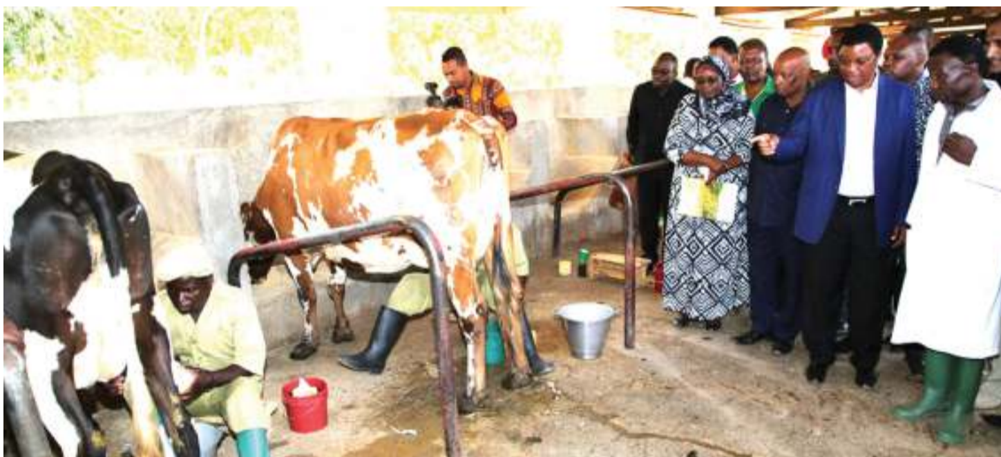
Waziri Mkuu, Kassim Majaliwa, akitazama ukamuaji ng'ombe wa maziwa katika shamba la ng'ombe la Asas, nje kidogo ya Mji wa Iringa, mwaka juji.