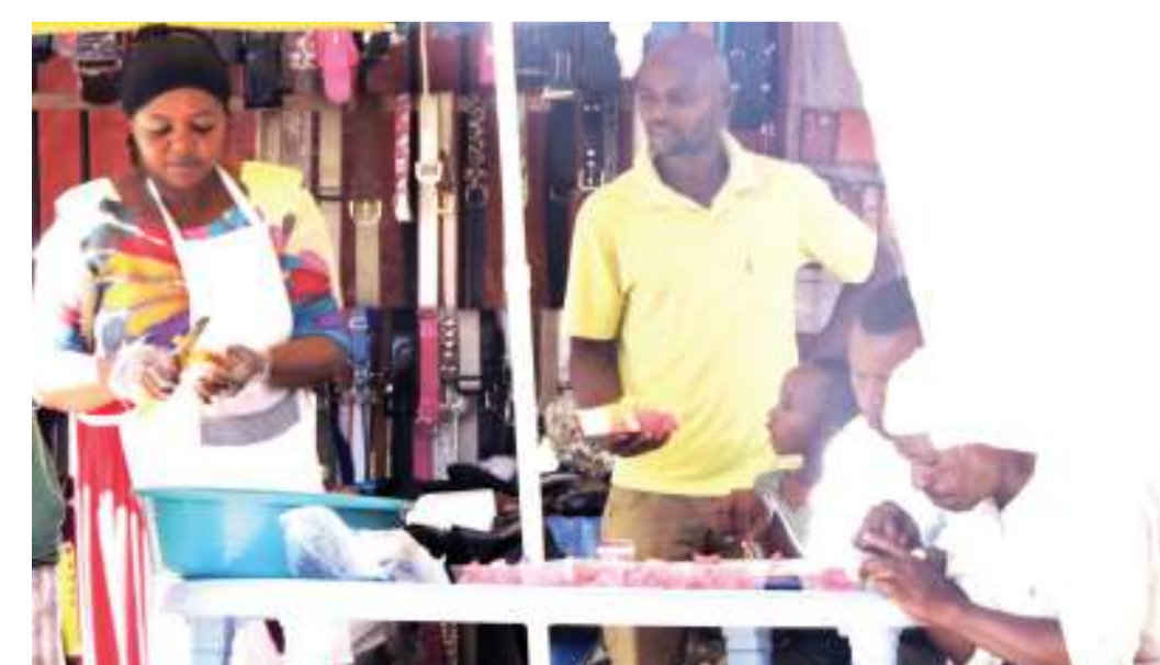
Mchuzi wa matunda akiwahudumia wateja katika Barabara ya Uhuru, eneo la Kariakoo, jijini Dar es Salaam jana. Bakuli moja la matunda aliuza kwa bei ya 1,000/-.