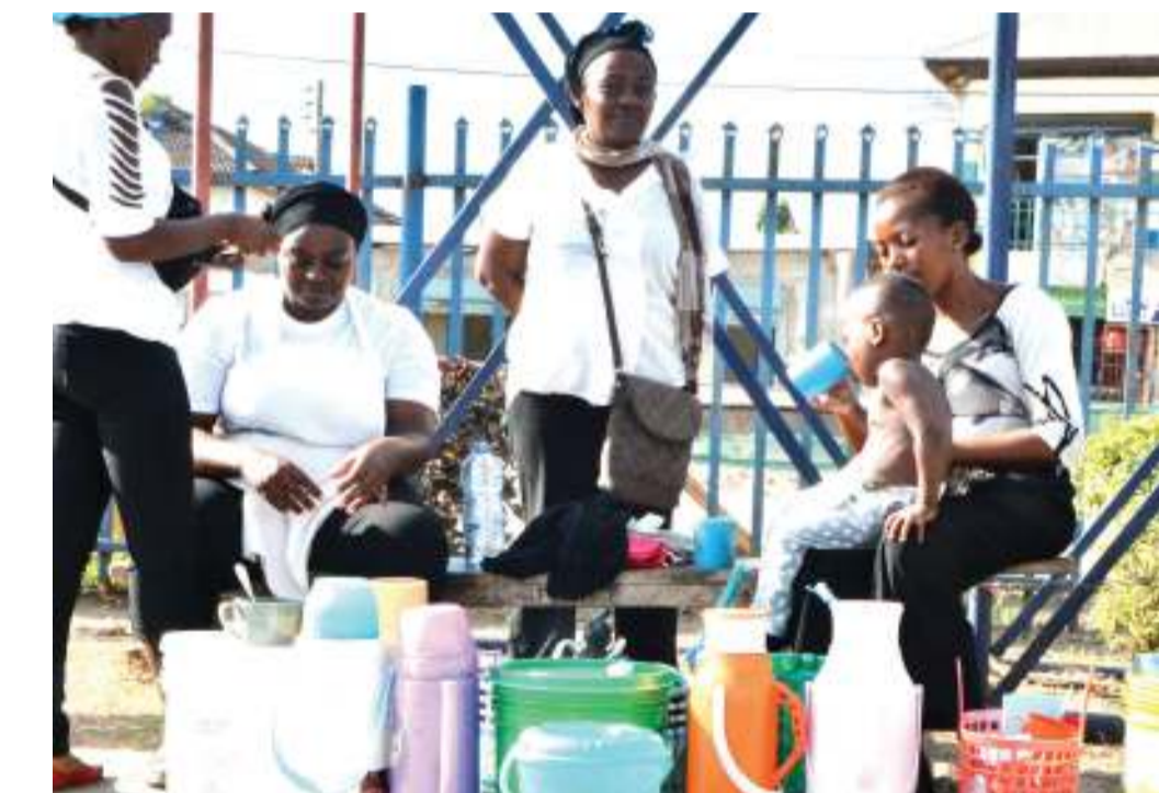
Kinamama wakisubiri wateja wa uji na chai katika stedi ya mabasi ya Mawasiliano jijini, Dares Salaam jana.