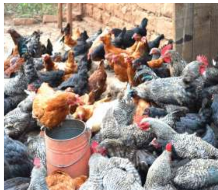
Kuku wa kienyeji, aina ya mradi unaoendeshwa na kikundi cha Bosi Kuku.