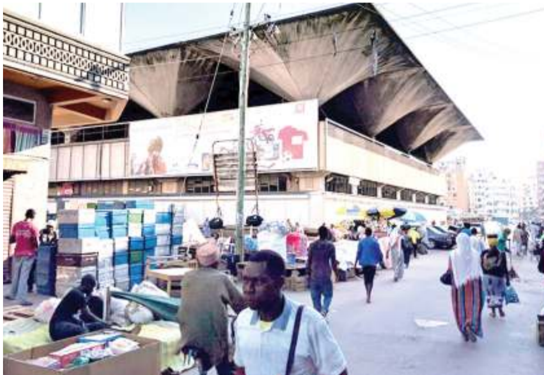
Eneo la Kariakoo katikati ya Dar es Salaam, ambako ni kitovu cha biashara.