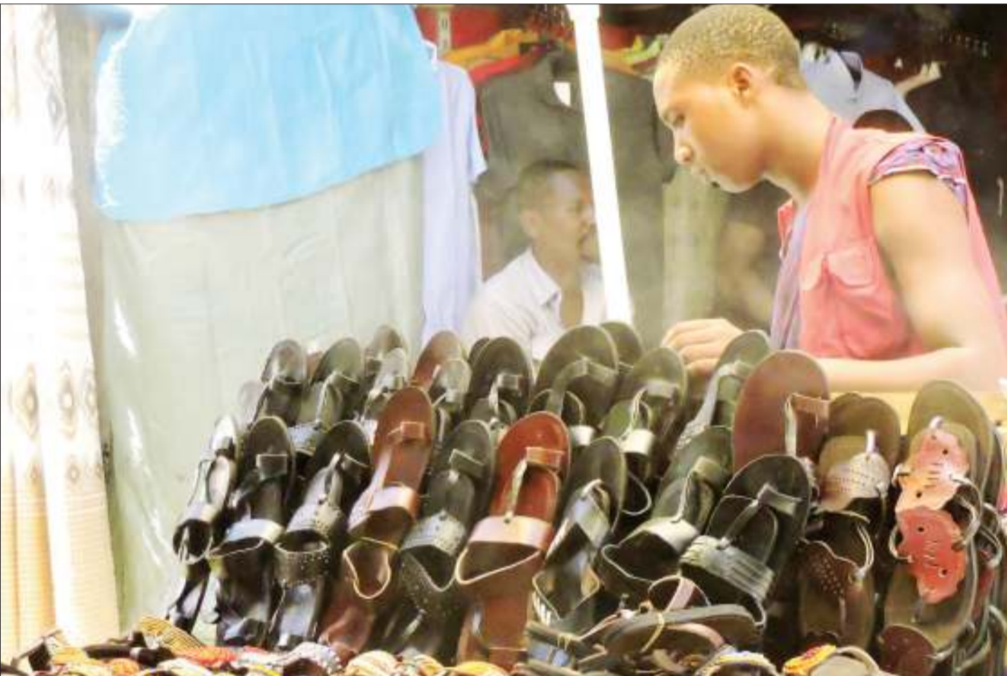
Mchuzi wa viatu akiweka bidhaa zake vizuri katika Mtaa wa Narung'ombe Kariakoo jijini Dar es Salaam jana.