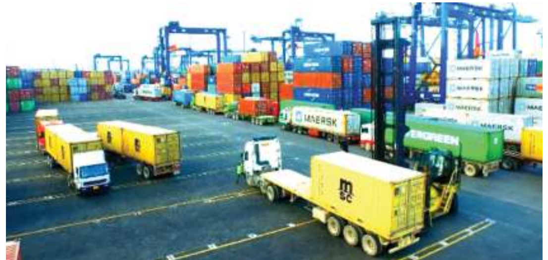
Makontena yakipakuliwa katika Bandari ya Dar es Salaam.

“Tofauti na biashara nyingine za kawaida ambazo zinahitaji mtaji mkubwa, rasilimali na hata uzoefu, biashara ya mauzo ya moja kwa moja inatoa fursa hii ya biashara...”