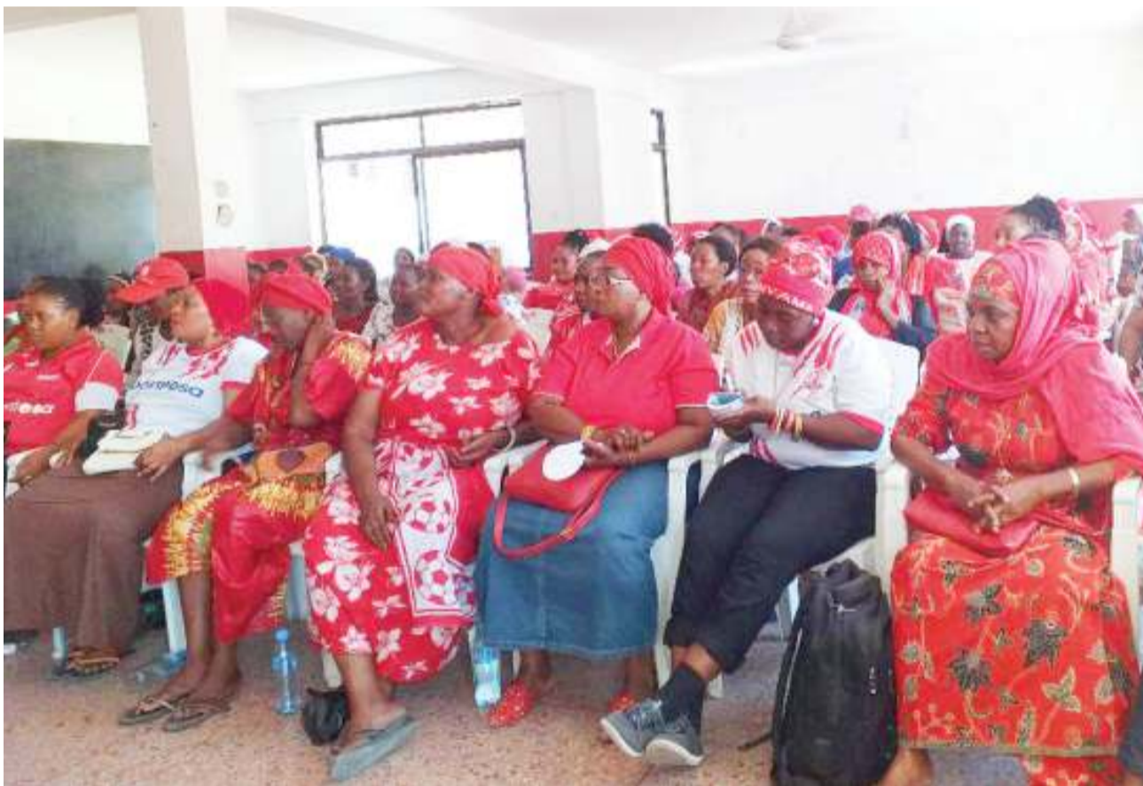
Wanachama wanawake wa Simba wakimsikiliza Mjumbe wa Bodi ya Wakurugenzi wa timu hiyo, Asha Baraka (hayuko pichani) katika mkutano maalumu uliofanyika kwenye makao makuu ya klabu hiyo jijini Dar es Salaam jana.

Simba imetinga hatua hiyo baada ya kushika nafasi ya pili kwenye kundi lao, wakati hatua ya makundi ikichomoza nyuma ya Al Ahly ambao wamepangiwa kucheza na Mamelodi ya Afrika Kusini.