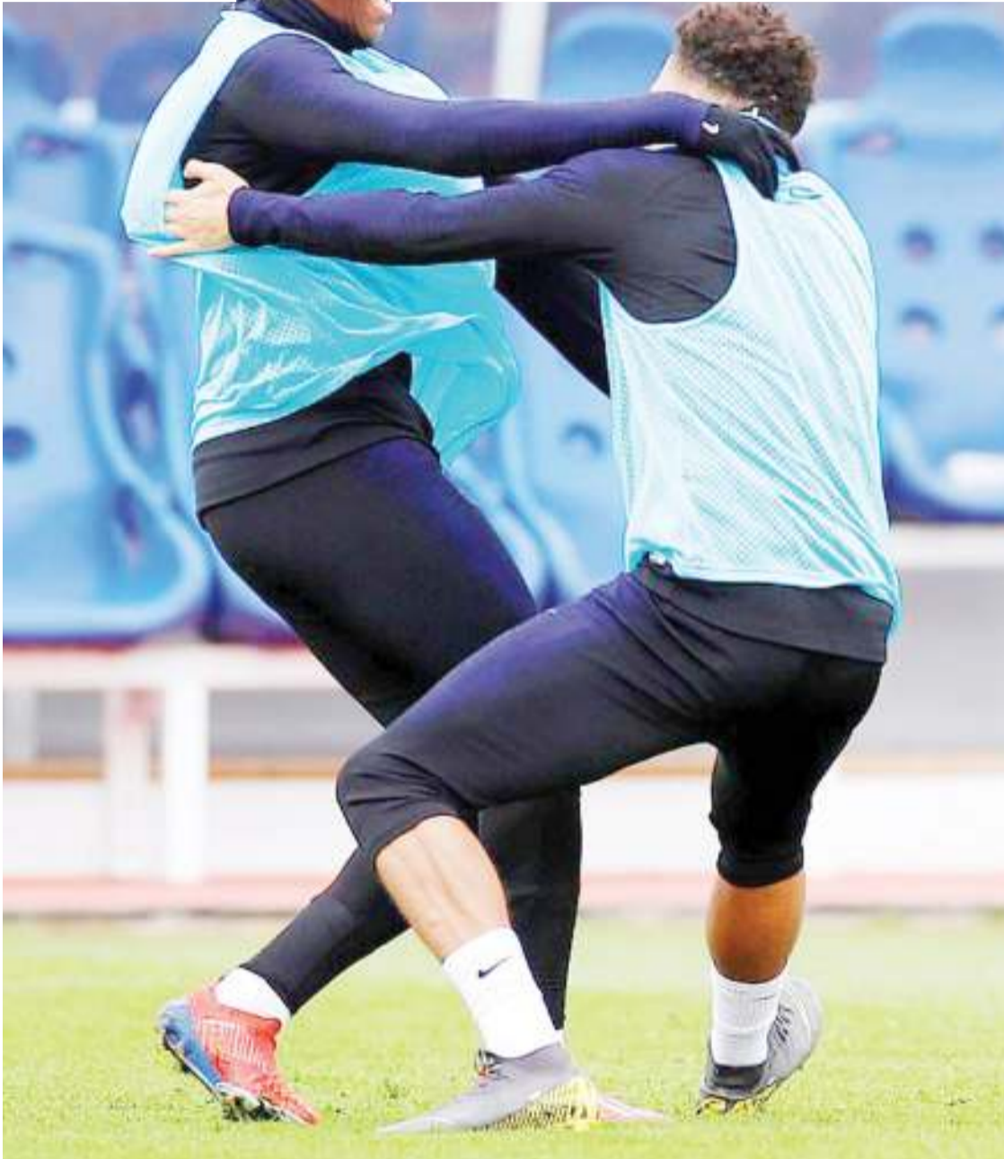
Wachezaji wa Timu ya Taifa ya England, Callum Hudson-Odoi (kushoto) na Jadon Sancho wakiwa katika mazoezi ya timu hiyo inayojiandaa kuivaa Jamhuri ya Czech katika mchezo wa kuwania tiketi ya kucheza Fainali za Euro 2020 utakaochezwa leo.