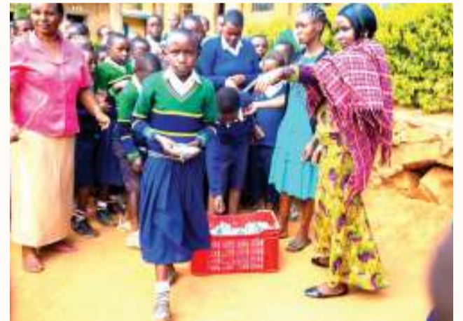
Wanafunzi wa mjini Iringa, wakiwa katika Wiki ya Unywaji Maziwa.