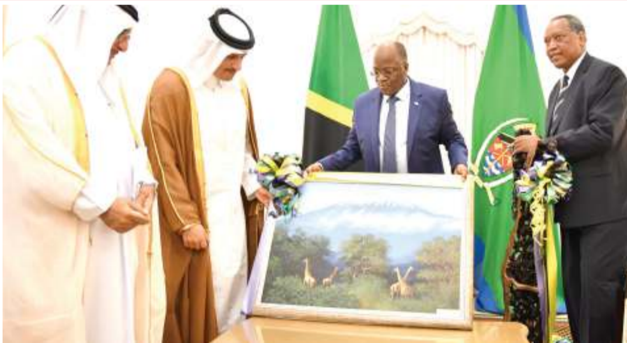
Rais John Magufuli, akimkabidhi zawadi ya picha ya Mlima Kilimanjaro mgeni wake Naibu Waziri Mkuu na Waziri wa Mambo ya Nje wa Qatar, Sheikh Mohammed bin Abdulrahman al Than, baada ya kuwasili Ikulu jijini Dar es Salaam jana.

Rais Magufuli alimpongeza Merkel kwa uongozi wake wa zaidi ya miaka 13 akiwa Kansela wa Ujerumani na amemhakikishia kuwa Tanzania itadumisha na kukuza zaidi ushirikiano huo kwa manufaa ya pande zote mbili.