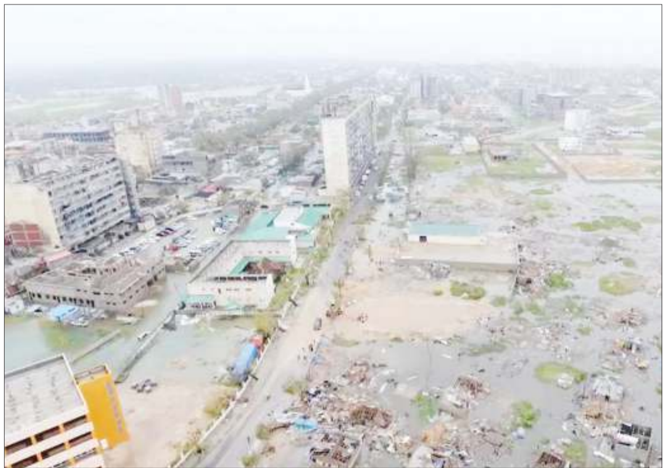
Mji wa Maputo nchini Msumbiji unavyoonekana kwa sasa baada ya kukumbwa na kimbunga Idai kilichosababisha mafuriko.

Baada ya kutokea kwa tukio hilo, serikali iliwapadilisha maofisa waliokuwapo ikiwamo wa polisi na wakuu wa ujasusi, wanajeshi na wa serikali. Shambulio hilo linaweza kuorodheshwa miongoni mwa mashtaka ya uhalifu wa kivita. BBC