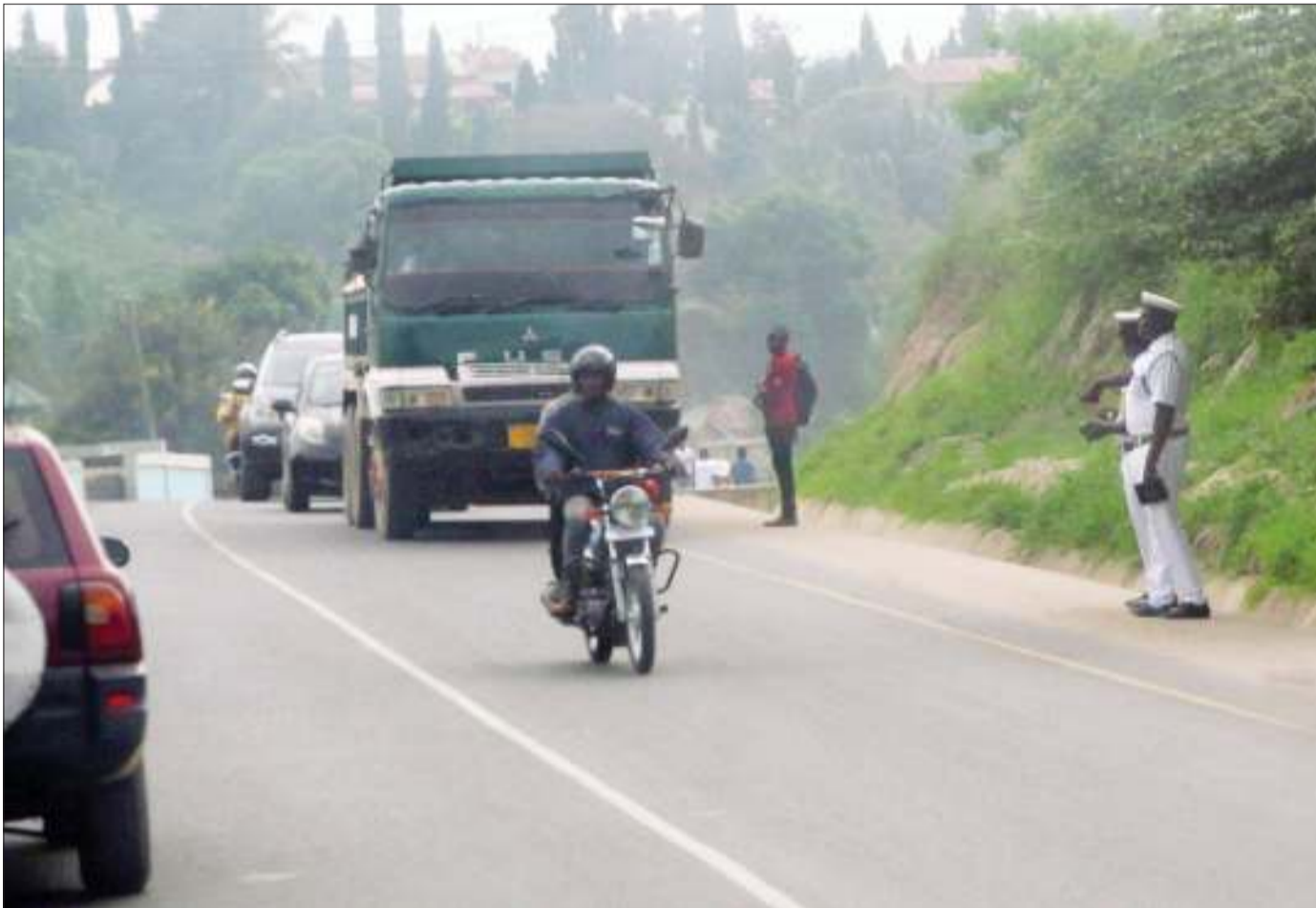
Trafiki wakiwa kazini maeneo ya Mbezi Mwisho, jijini Dar es Salaam jana, ili kuhakikisha madereva wanazingatia Sheria za Usalama Barabarani.