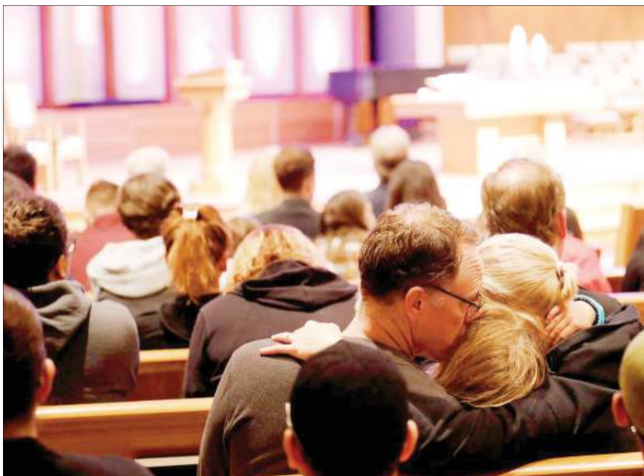
Mishumaa ikiwa imewashwa katika moja ya Kanisa la Presbyterian, kuomboleza kifo na majeruhi wa shambulio la risasi lililotokea katika Sinagogi Kaskazini mwa mji wa San Diego.

Washiriki hao ni pamoja na marais kutoka Ufilipino, Kenya na Misri, Waziri Mkuu wa Italia, Ugiriki na Pakistan pamoja na maafisa wengine wa serikali kutoka Indonesia, Ujerumani na nchi nyingine. DW