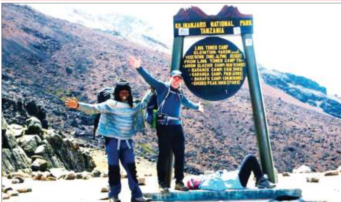
Mmoja ya watalii kutoka Kampuni ya Kilitwende Tours, akiwa amejilaza katika kibao cha Lava Tower Camp kutokana na uchovu wakati wa safari yake ya kupanda Mlima Kilimanjaro hadi kilele cha juu kabisa cha Uhuru Peak chenye urefu wa mita 5,895 kutoka usawa wa bahari.