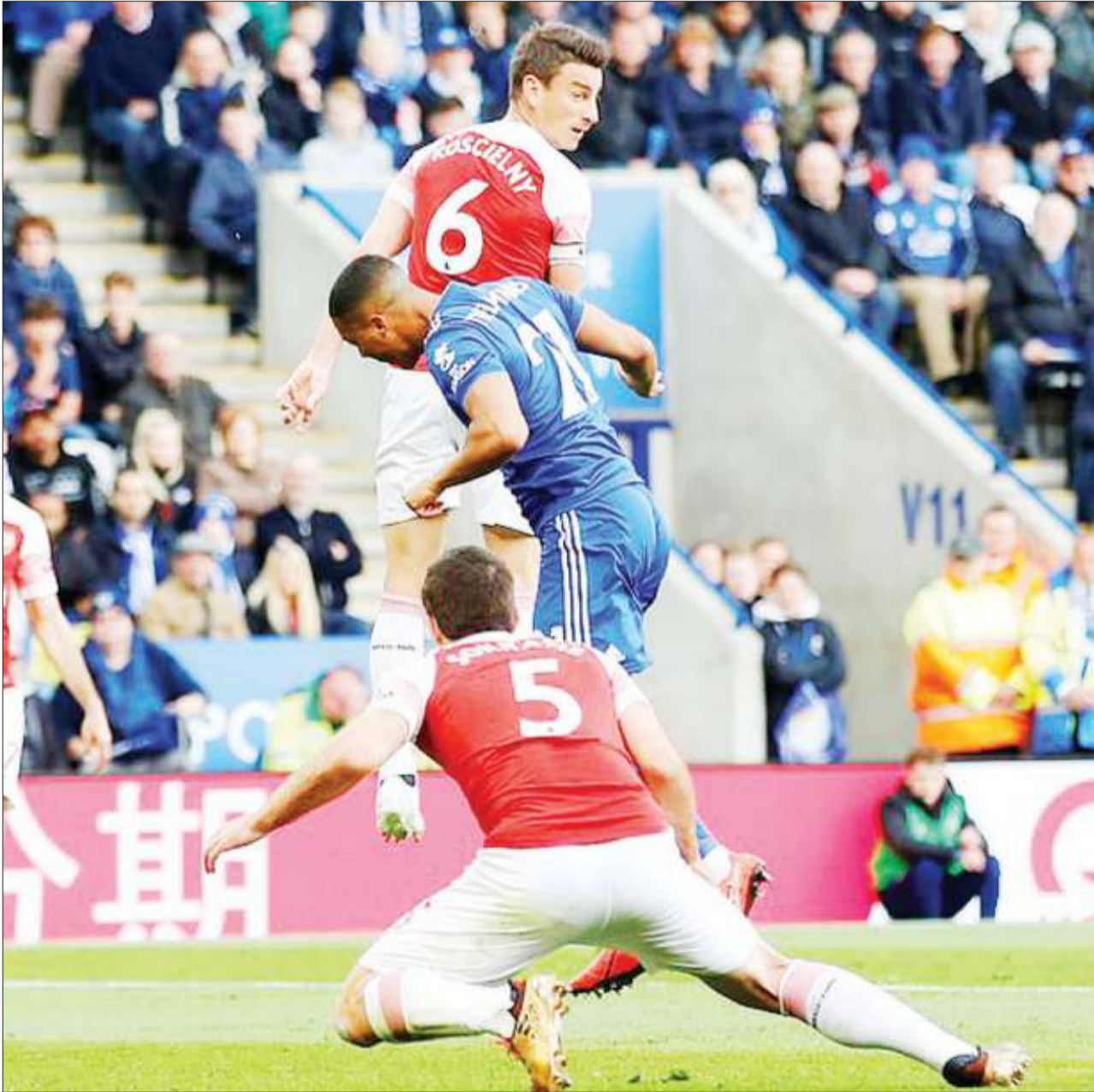
Youri Tielemans (kulia jezi ya bluu), akiunganisha nyavuni kwa kichwa krosi ya James Maddison na kuipa Leicester bao la kuongoza wakati ikiibuka na ushindi wa mabao 3-0, katika mechi ya Ligi Kuu England dhidi ya Arsenal iliyopigwa Uwanja wa King Power jana. HABARI UK. 29