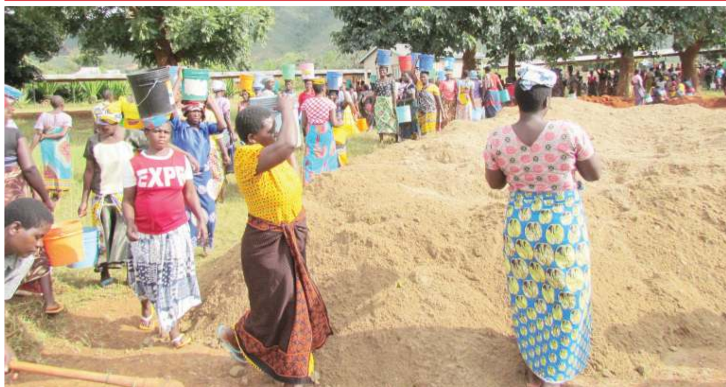
Wanawake wa Wilaya ya Illeje mkoani Mbeya, wakisherehekea Siku ya Muungano kwa kusomba mchanga katika upanuzi wa hospitali ya Wilaya.