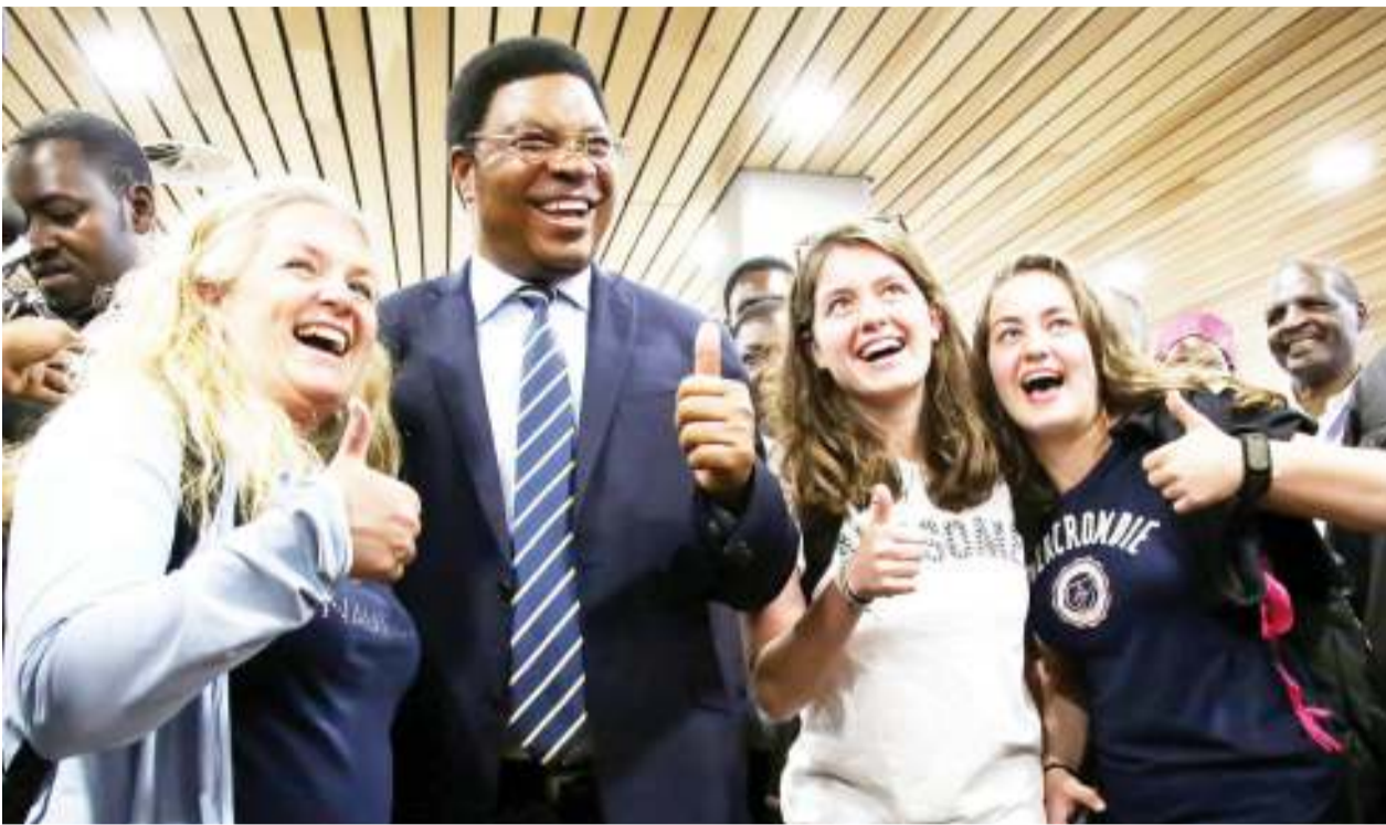
Waziri Mkuu, Kassim Majaliwa, akifurahia jambo na watalii kutoka Israel, kwenye Uwanja wa Ndege wa Kimataifa wa KIA. Kushoto ni Naomi Moscovich, akiwa na binti zake, Dana Moscovich (kulia) na Lihi Moscovich (katikati).