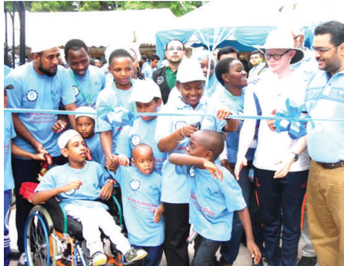
Watoto wenye usonji, wakiwa katika mjumuiko unaowahusu. Picha zote: MTANDAO.

Dk. Kombo anasema, mtoto mwenye usonji anapochelewa kupeleka hospitalini, anakosa matibabu yanayomsaidia kukabiliana na changamoto zake, hivyo inakuwa ngumu kuchangamana na jamii