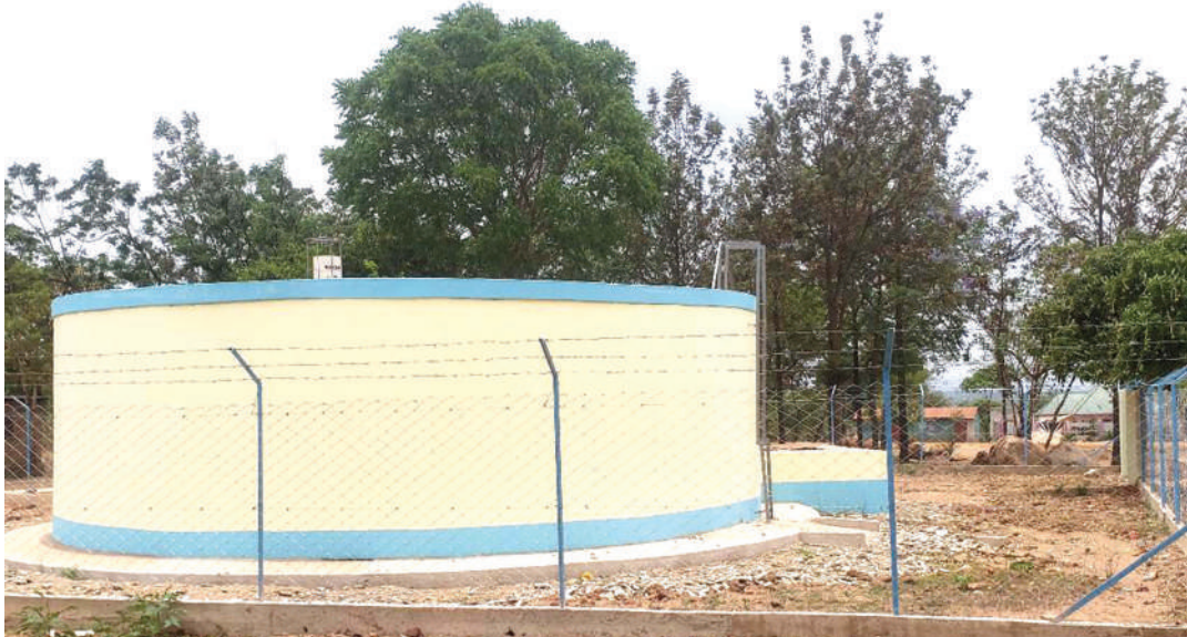
Tenki la maji kijijini Ilogi likiwa limekamili tayari kwa kusambaza maji kwenye vijiji vingine katika Halmashauri ya Wilaya ya Msalala.

Pia, anafafanua uhimizaji wa Maji na Usafi wa Mazingira Vijijini (RUWASA), kwamba umesaidia maeneo mengi ya vijijini kufikiwa na huduma ya maji tofauti na kabla ya kuanzishwa mamlaka hiyo.