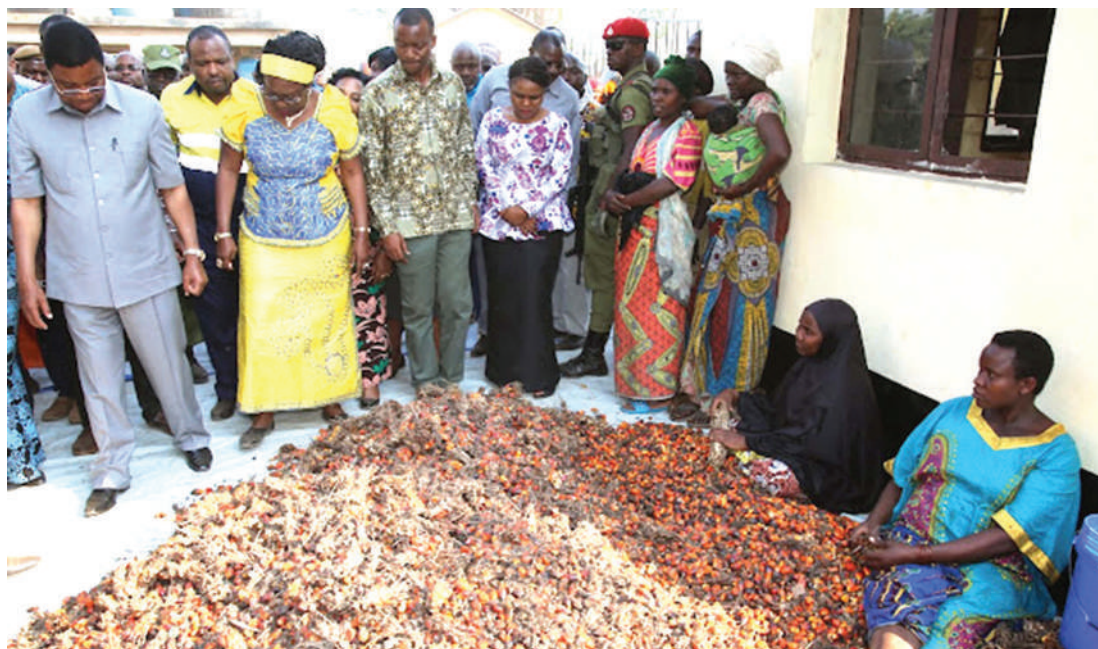
Michikichi ambayo imevunwa, iko katika hatua ya kubangua mbegu na maganda yanayobaki huwa yanatumika, hasa katika mikoa inayotumia michikichi, ikiwemo kuwa kuni.

Anakiri, ni tatizo ambalo wananchi katika upande wa kuwatibu, sehemu mojawapo ni gharama kubwa, mfano kwa mgonjwa