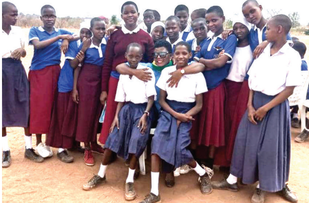
Baadhi ya wanafunzi wa Shule za Msingi Manage, Sekondari ya Mela na Melela wakiwa pamoja wakisubiri kupewa elimu ya ukatili wa kijinsia kwenye Uwanja wa Bodaboda, wilayani Mvomero, mkoani Morogoro.