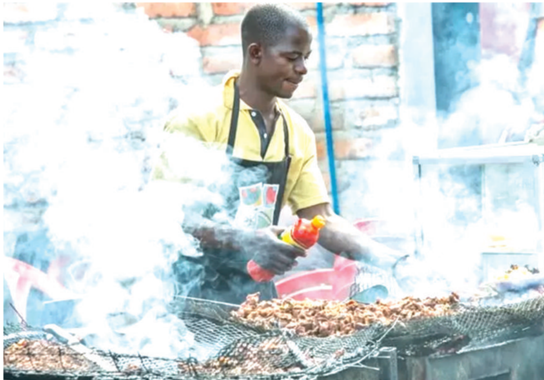
Mazingira yanayochangia mtumiaji kudhurika kiasya na moshi.

guni watu wanakuwa na shida, mtu anaishi kwa muda mrefu na matatizo na haya magonjwa yapo katika vifungo tofauti. Kuna haya magonjwa ya papo kwa hapo na yale ambayo yanakaa kwa muda mrefu," anasema