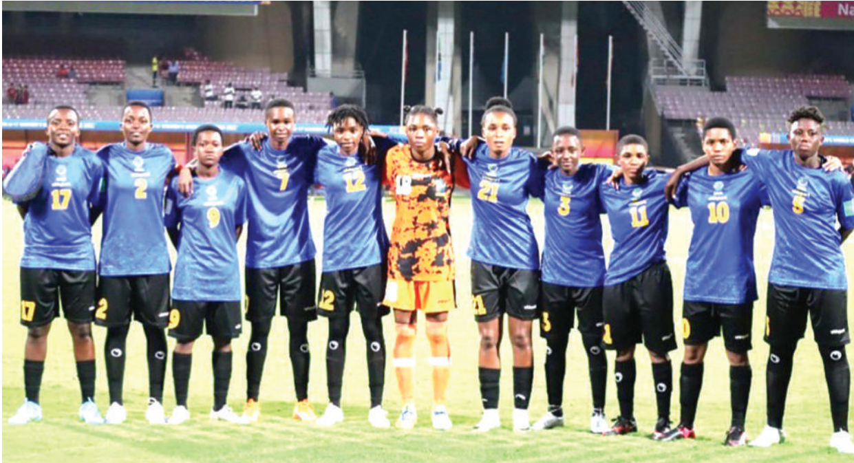
Kikosi cha Serengeti Girls kilichoanza katika mechi ya Kundi D ya Fainali za Kombe la Dunia (U-17), dhidi ya Canada iliyochezwa juzi jioni nchini India. Timu hizo zilitoka sare ya bao 1-1 na matokeo hayo yaliipeleka hatua ya robo fainali Serengeti Girls.