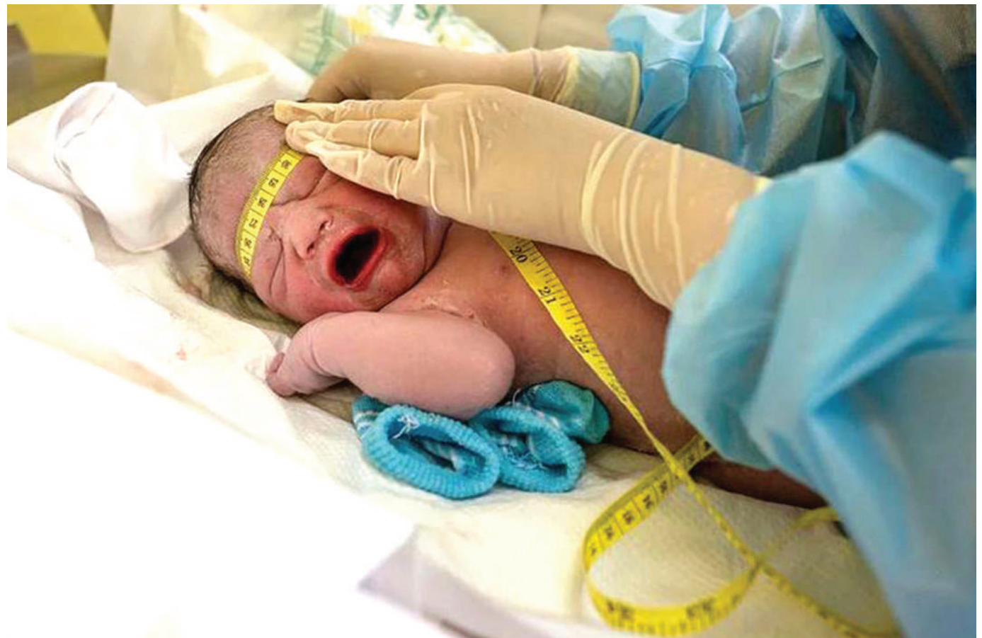
Wahudumu wa afya wa Ukraine wanamtunza mtoto ambaye alizaliwa na mama aliyeathirika na mabomu katika hospitali kuu ya Kyiv.