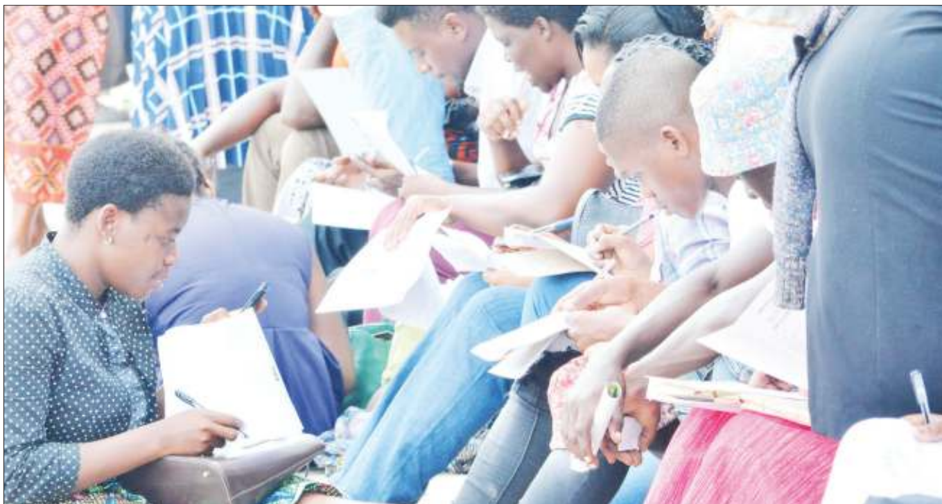
Wananchi wakijaza fomu za kuomba vyeti vya kuzaliwa kwa Wakala wa Usajili Ufilisi na Udhhamini (RITA), katika Maonyesho ya 43 ya Biashara ya Kimataifa ya jijini Dar es Salaam juzi.

Alisema mkakati huo unalenga kufahamu hitaji la soko na washindani waliopo pamoja na kushauri wafanyabiashara kutafuta masoko.