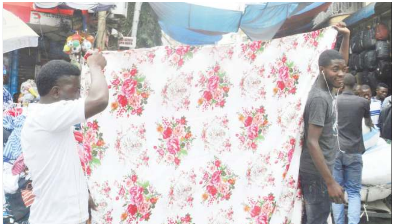
Machinga wakinadi shuka kwa staili yao, wakati wakisubiri wateja kando ya Barabara ya Msimbazi, eneo la Kariakoo, jijini Dar es Salaam jana. Shuka moja liliuzwa kwa Sh. 8,000/- hadi Sh. 10,000/-.

Rais Magufuli aliteuliwa kuwa Makamu Mwenyekiti wa jumuiya hiyo