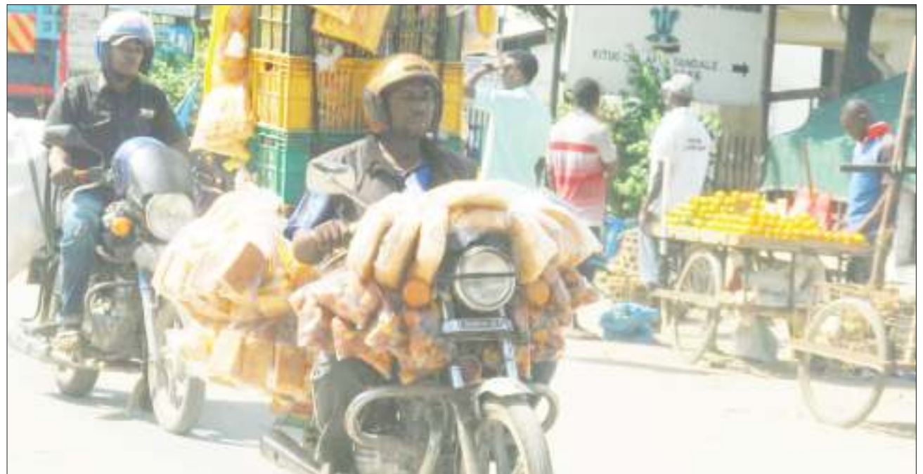
Mchuzi wa mikate akiwa ameisheheni kwenye pikipiki yake, wakati akisaka wateja katika eneo la Tandale, jijini Dar es Salaam jana.

Ilidaiwa baada ya kumtorosha, majira ya saa 11:20 alfajiri, mshtakiwa huyo anadaiwa alimuingilia kimwili ilhali akijua kuwa sio mke wake, kitendo ambacho ni kosa chini ya vifungu vya 108 (1) (2) (e) na 109 (1) vya sheria namba 6 ya 2018 sheriaza Zanzibar.