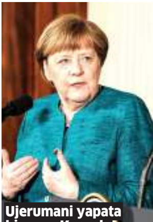
Ujerumani yapata kiwewe Kansela Merkel kutetemeka mara mbili