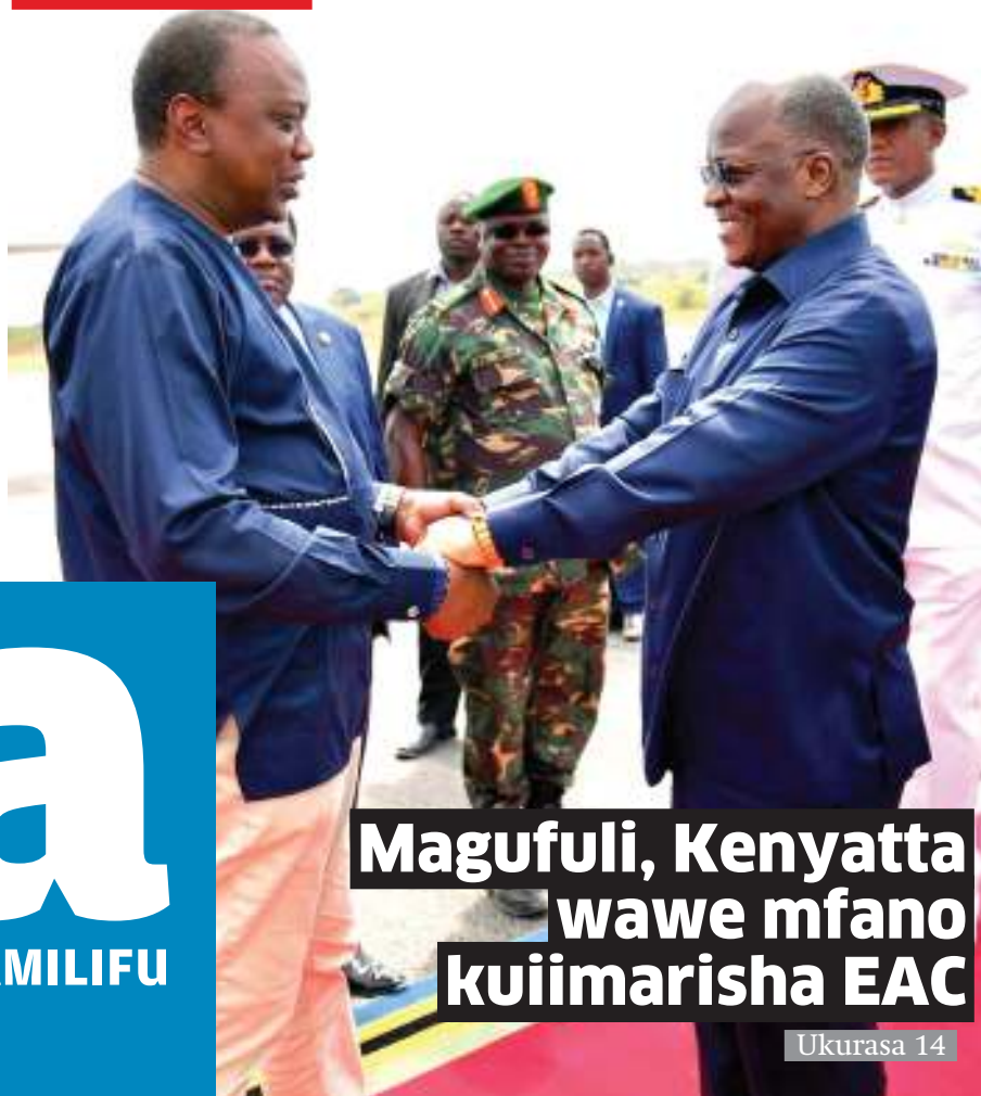
Magufuli, Kenyatta wawe mfano kuiimarisha EAC