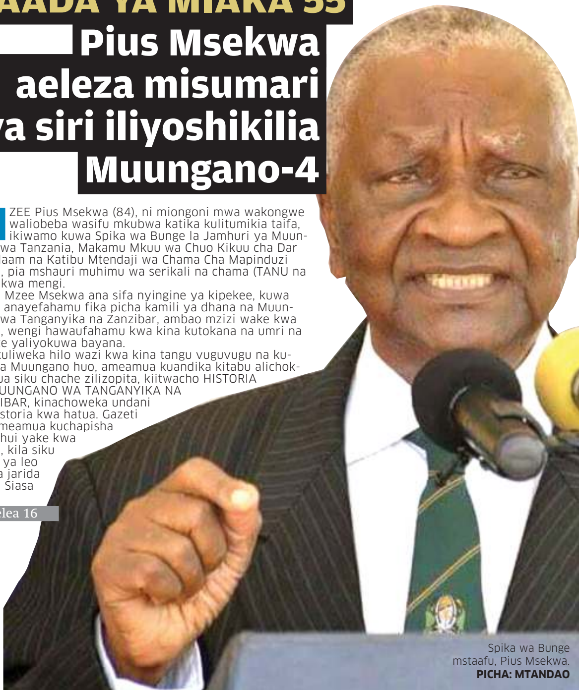
Spika wa Bunge mstaafu, Pius Msekwa.