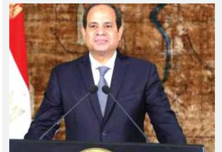
Rais wa Misri, Abdel Fattah al-Sisi.