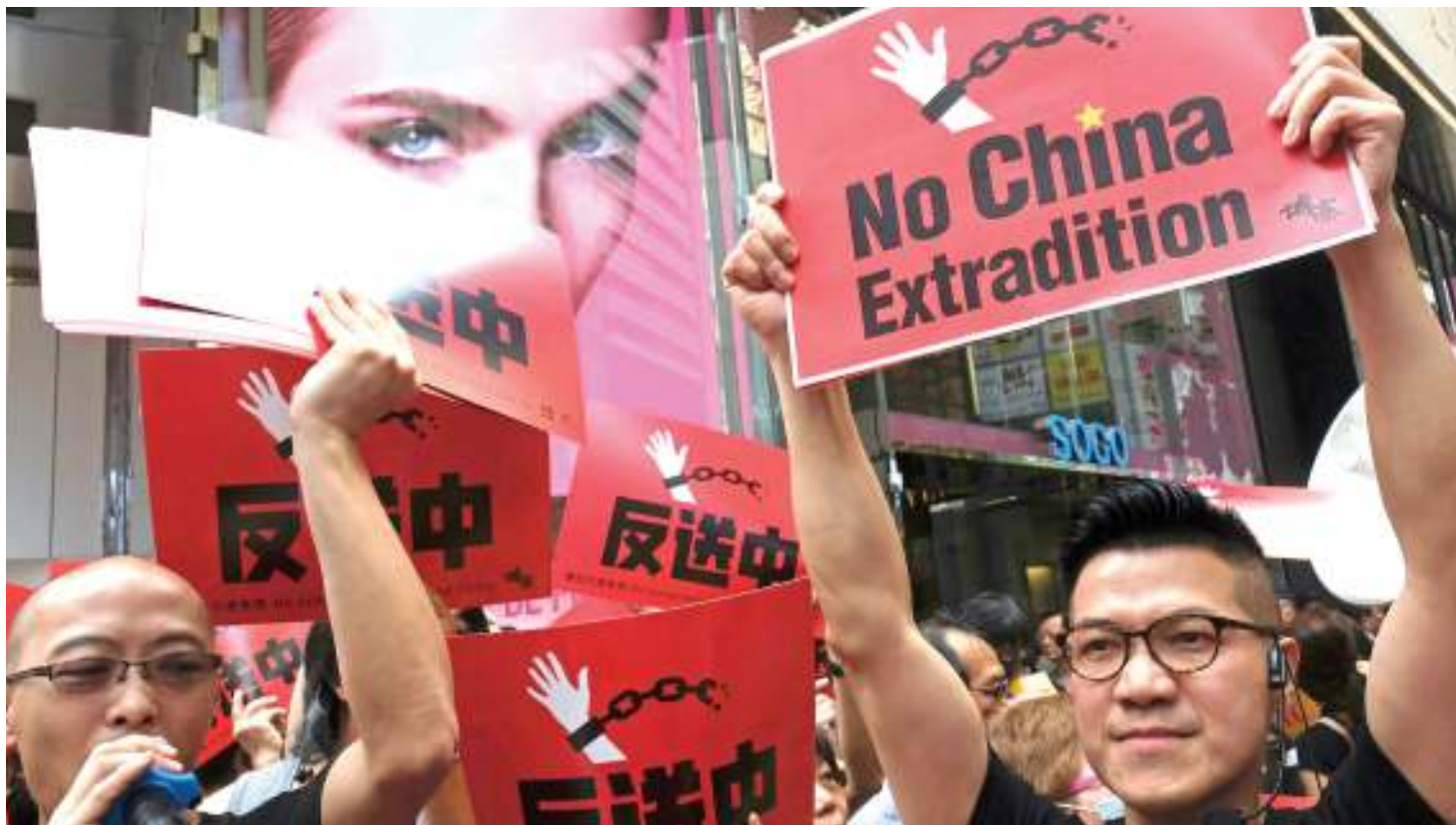
Maandamano dhidi ya sheria Hongkong yaliyosababisha majibizano kati ya Uingereza na China.

Ila kinachoonekana pia ni hali ya mkwamo wa matarajio ya China kuwa kadri muda unavyokwenda ndivyo Hong Kong itakuwa sehemu ya China kwa hatua kadhaa, na hapa na pale itabidi kulazimisha.