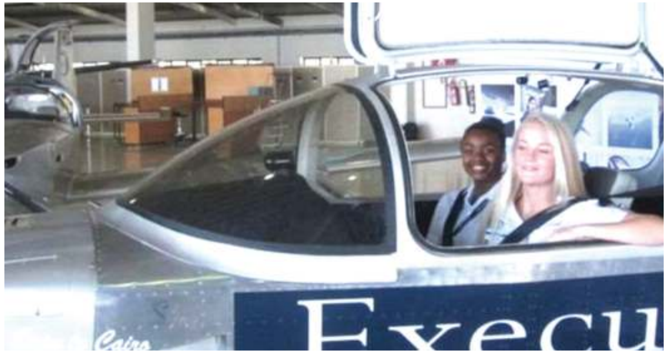
Ndege aina ya Sling 4 iliyotengenezwa na wanafunzi 20 Afrika Kusini. Ndege hiyo inadaiwa kutua salama jijini Cairo nchini Misri wiki sita baada ya kuondoka.