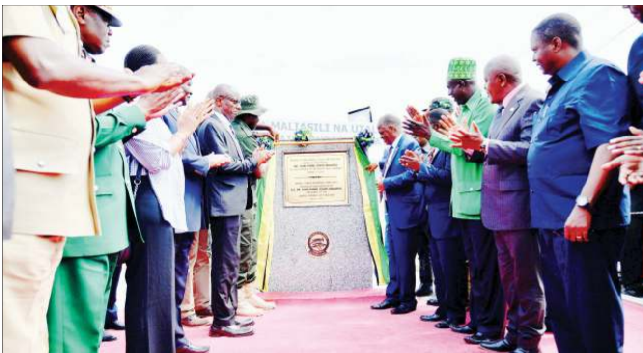
Rais John Magufuli akiwa na Waziri wa Maliasili na Utalii, Dk. Hamisi Kigwangalla, wakivuta utepe kuashiria uzinduzi wa Hifadhi ya Taifa ya Burigi, iliyopo Chato, mkoani Geita jana. Wanaoshuhudia ni viongozi mbalimbali wa serikali na chama tawala.

Pia amewataka watumishi hao kufanya kazi kwa kufuata misingi ya utawala bora na kwamba Halmashauri ya Mbozi pekee Takukuru imeko kiasi cha Sh. 51,814,100.