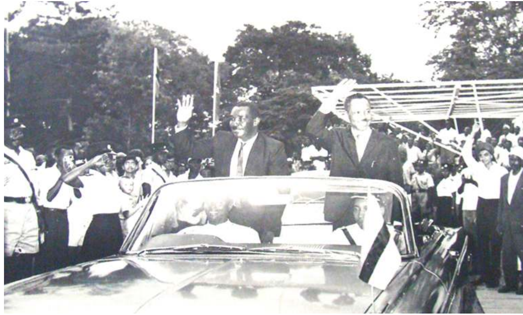
Mwalimu Julius Nyerere (kushoto) akiwa na Abeid Karume.

"Mzee Karume alikuwa ni mtu jasiri sana. Hakuwa na woga. Ukitaka kugawanya sifa baina yake na mimi katika juhudi za kuleta Muungano huu, Mzee Karume anastahili kupewa sehemu kubwa zaidi ya sifa hizo. Katika kujibu swali la nini maoni yake kuhusu muundo wa Muungano, Mzee Karume alitamka bila kusita kwamba, maoni yake yeye ni Muungano wa nchi moja na Serikali moja. Mwalimu wewe utakuwa Rais na mimi Makamu wako."