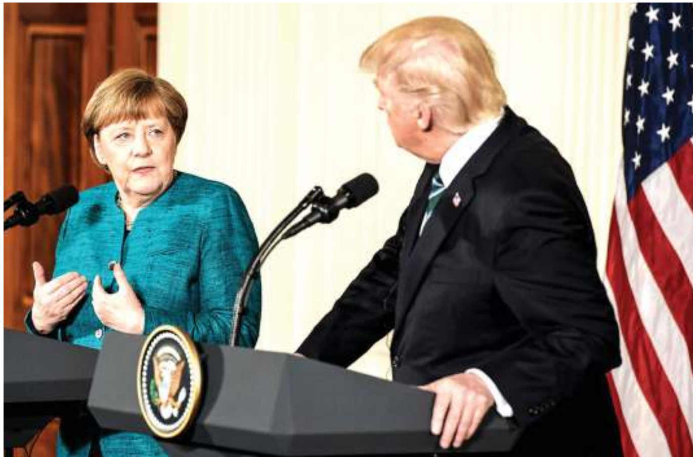
Kansela Angela Merkel wa Ujerumani (kushoto), akiwa na Rais Donald Trump wa Marekani.

wa Ujerumani mara ya mwisho alionekana kuwa dhaifu hadharani miaka mitano iliyopita, na kwa maana hiyo afya yake imekuwa nzuri kwa muda mrefu, na haiteti wasiwasi wowote.