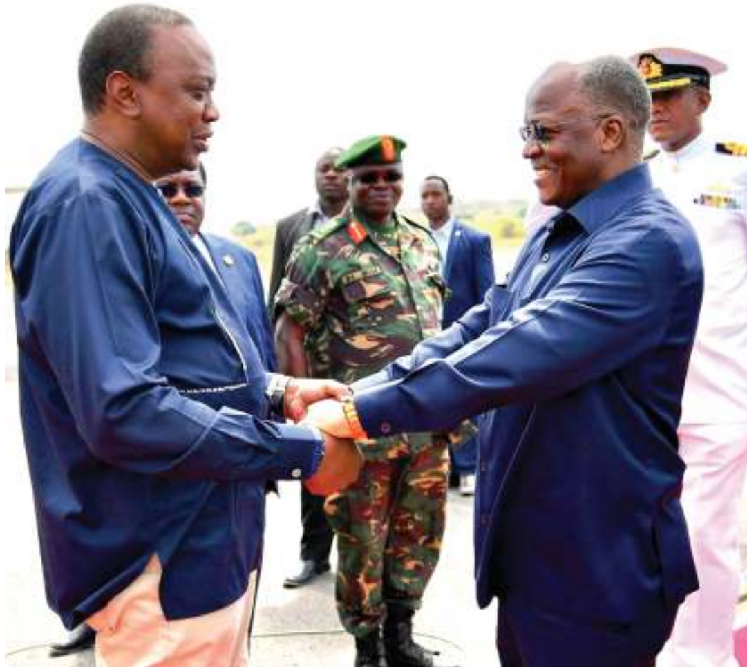
Rais John Magufuli (kulia), akiagana na mgeni wake Rais Uhuru Kenyatta wa Kenya.