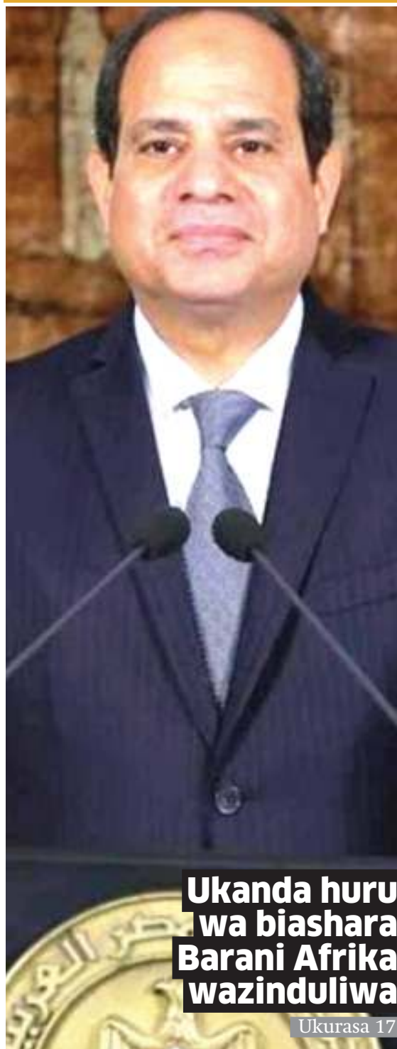
Ukanda huru wa biashara Barani Afrika wazinduliwa