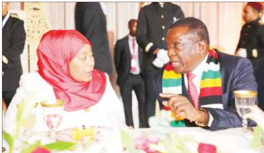
Makamu wa Rais, Samia Suluhu Hassan, akibadilishana mawazo na Rais Emmason Mnangagwa wa Zimbabwe, walipokuta katika chakula cha jioni kilichoandaliwa na Rais Mahamadou Issoufou wa Niger, kwenye mkutano wa 12 wa Wakuu wa Nchi na Serikali wa Umoja wa Afrika (AU), uliojadili kuhusu Eneo Huru la Biashara Afrika (AFCFTA) mjini Niamey, Niger, juzi.

Aidha, Waziri Mpango aliipongeza benki hiyo kwa kukubali kutekeleza miradi ya ujenzi wa barabara ya mzunguko Dodoma (km110.2) kwa kiwango cha lami pamoja na ujenzi wa Uwanja wa Ndege wa Dodoma (Msalato) na kubainisha kuwa uamuzi huo ni mzuri kwani licha ya Dodoma kuwa ni Makao Makuu ya nchi, lakini pia miundombinu hii itaunganisha na kuchochea ukuaji wa uchumi na biashara katika mikoa mingi nchini pamoja na nchi jirani.