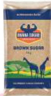
Kilombero Brown Sugar 1kg