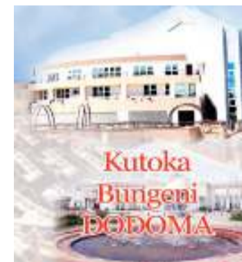
Habari zote na Augusta Njoji, DODOMA

"Baada ya kazi hiyo, TPA iliainisha bandari ambazo zinafaa kurasimishwa," alisema.