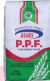
Azam Pure Wheat Flour 2kg