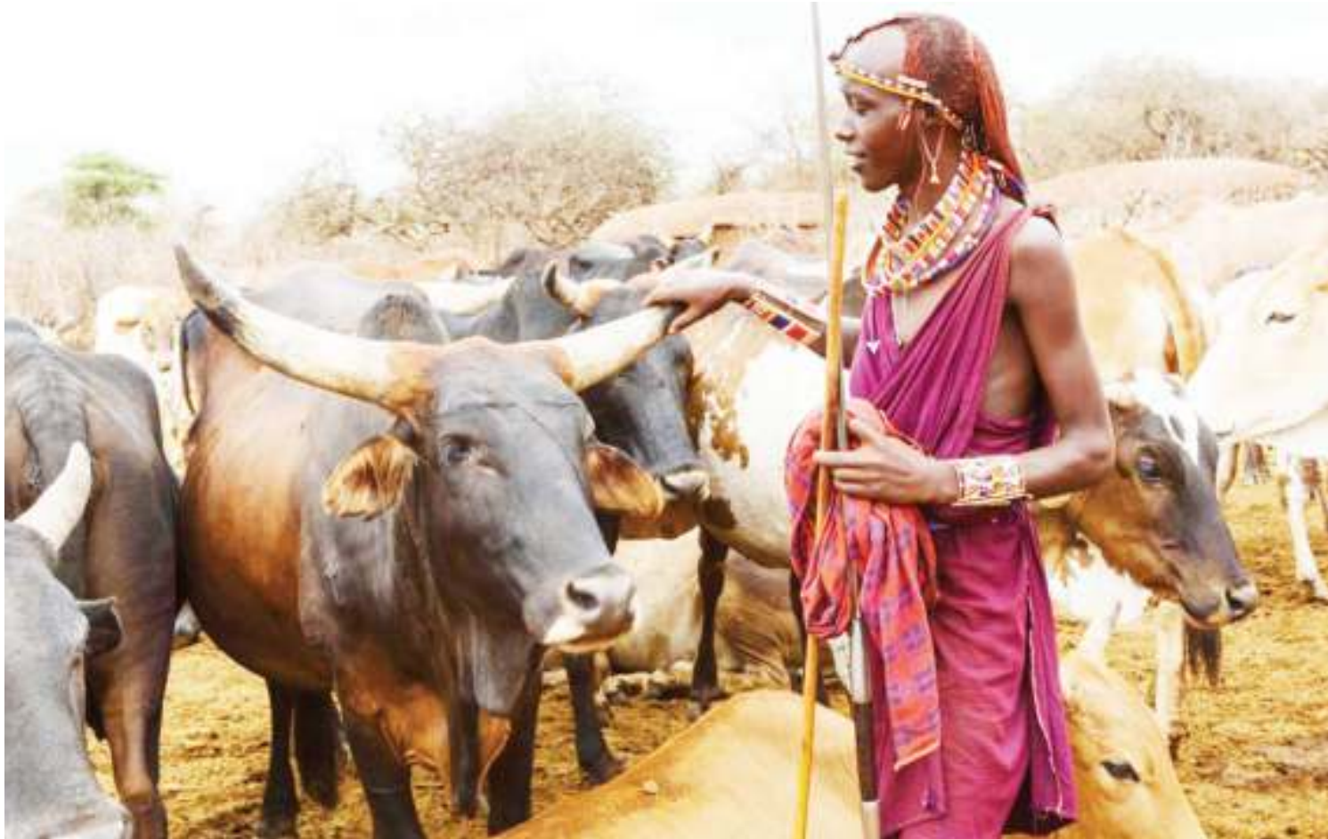
Mfugaji ng'ombe akiwa katika nyendo zake.