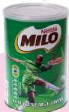
Nestle MILO Can 500g