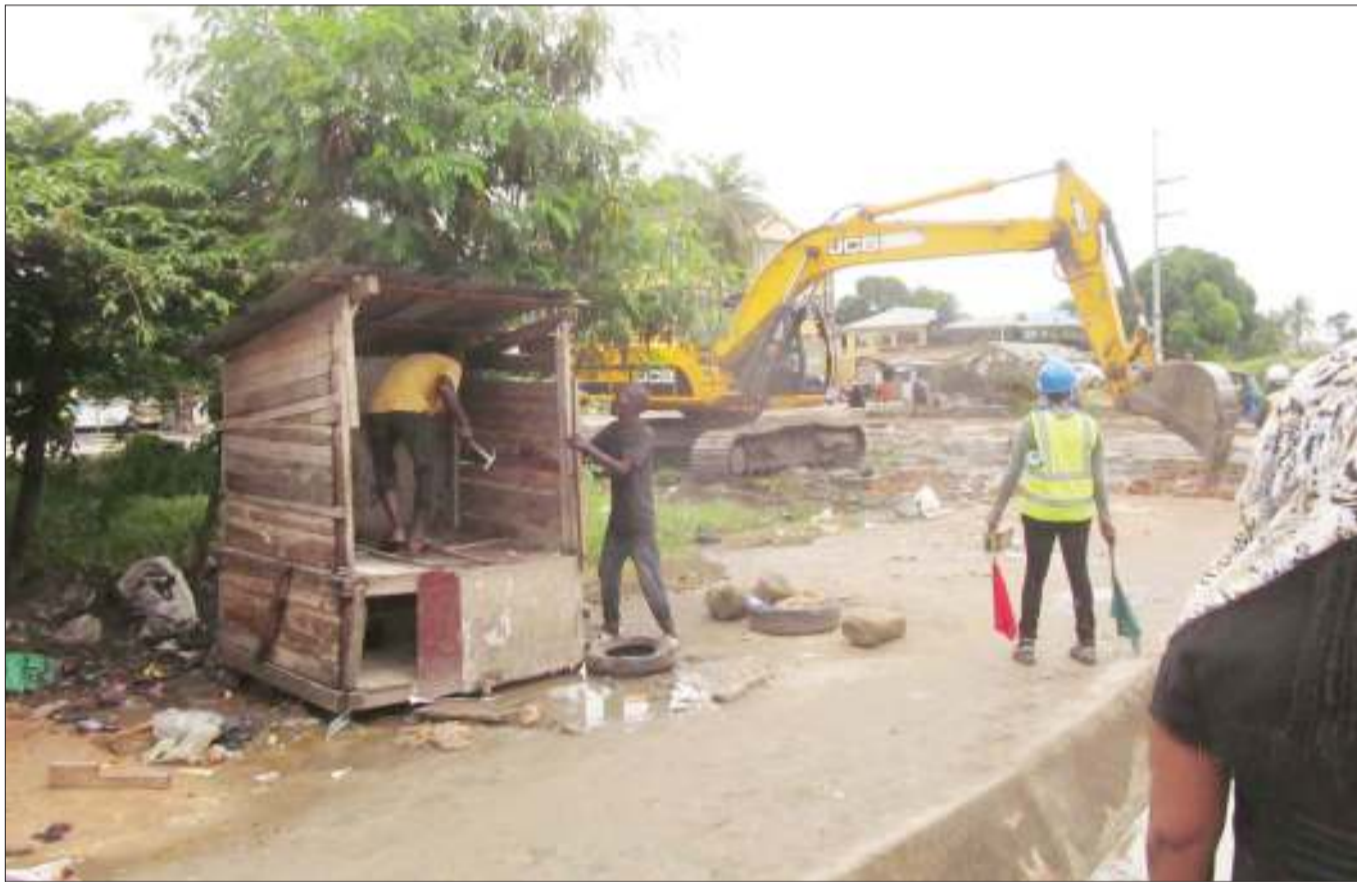
Wamachinga wakijiandaa kuhamisha kibanda chao kando ya barabara ya Bagamoyo, karibu na kituo cha daladala cha ITV, jijini Dar es Salaam juzi, ili kupisha katapila lililokuwa likisafisha eneo hilo, yakiwa maandalizi ya upanuzi wa barabara hiyo.

Alisema hatua zinazochukuliwa na serikali ni kutoa chanjo kwa watoto wadogo, kwa watu walio katika hatari ya kupata maambukizi na kwamba wameanza kutoa chanjo hizo kwenye vituo vya afya nchini.