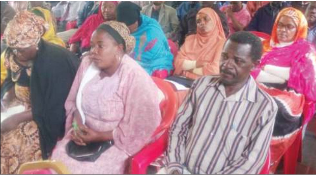
Wamiliki wa migodi ya madini ya Tanzania wa mji mdogo wa Mirerani wilayani Simanziro, wakiwa kwenye kikao cha kusikiliza changamoto na mafanikio yao kilichoandaliwa na Chama cha Wachimbaji Madini Mkoa wa Manyara (Marema), tawi la Mirerani jana.