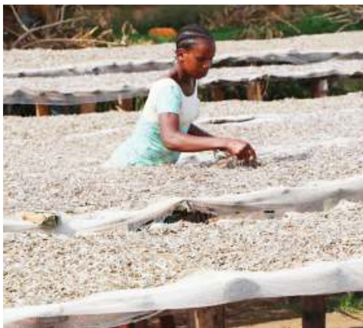
Bidhaa za uvuvi zikiandaliwa.

walio tembelewa ni pamoja na viwanda vya kusindika samaki, nyama, ngozi, maziwa, kuku pamoja na wafugaji wa samaki katika vizimba na mabwawa.