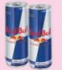
Red Bull Energy Drink - 250ml

Excessive alcohol consumption is harmful to your health, do not drive or operate machinery Alcohol Not for Sale to Persons Under the Age of 18.