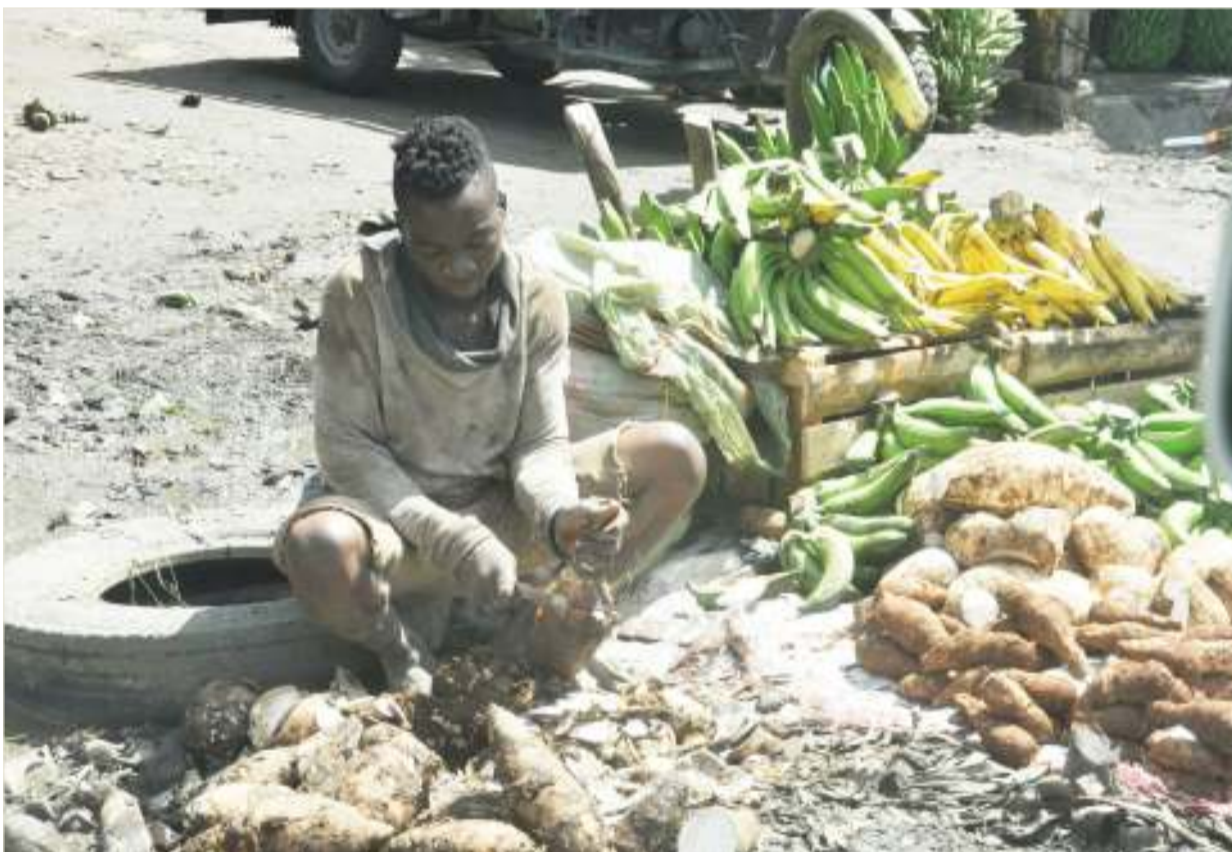
Mchuzi wa magimbi akiyatoa matope kabla ya kuwauzia wateja wake, kando ya barabara jirani na Soko la Mabibo maarufu kama Mahakama ya Ndizi, jijini Dar es Salaam jana.