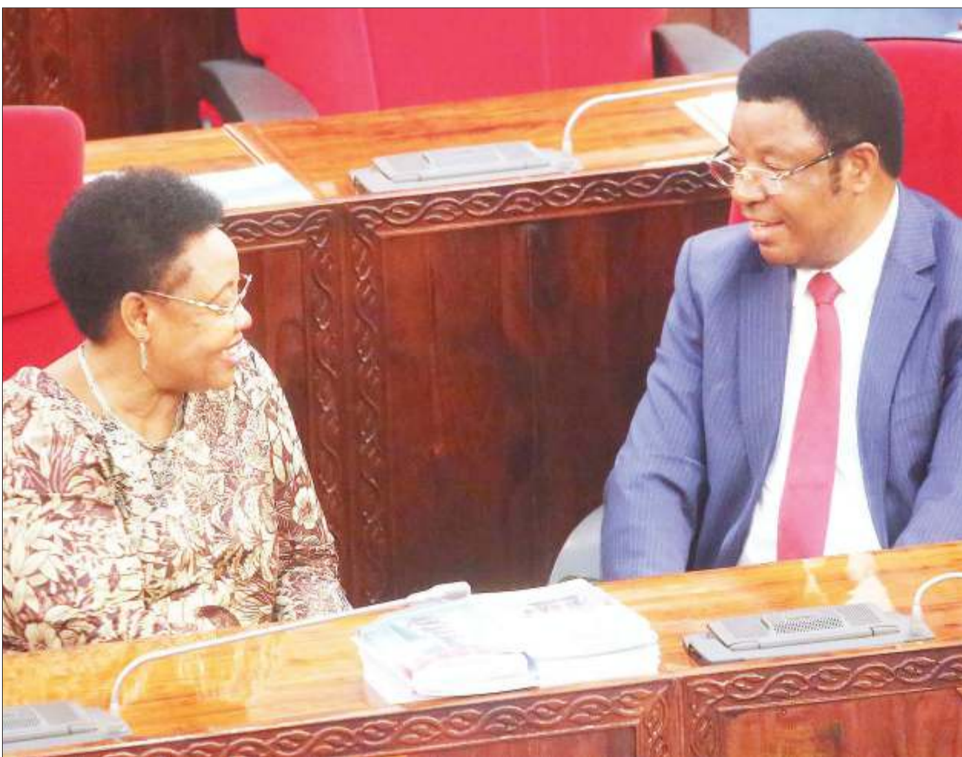
Waziri Mkuu Kassim Majaliwa, akizungumza na Mbunge wa Hanang, DK. Mary Nagu, bungeni jijini Dodoma juu.

Vile vile, alisema kupitia utaratibu huo wananchi wanashirikiana na wizara na halmashauri kupanda miti kwenye maeneo ya wazi.