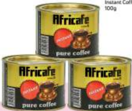
Africafe Instant Coffee 100g