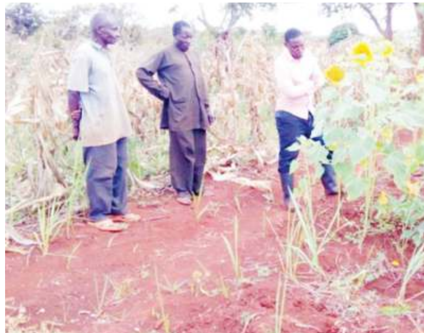
Wakulima wa alizeti wakiwa shambani.

Ushauri wake kwa serikali ni kwamba irejeshe hali ya mazao nchini ili kuwiana mwongozo wa kufikia hatma ya Uchumi wa