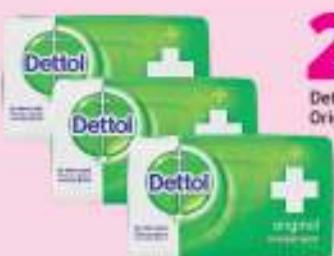
Dettol Soap Original 175g