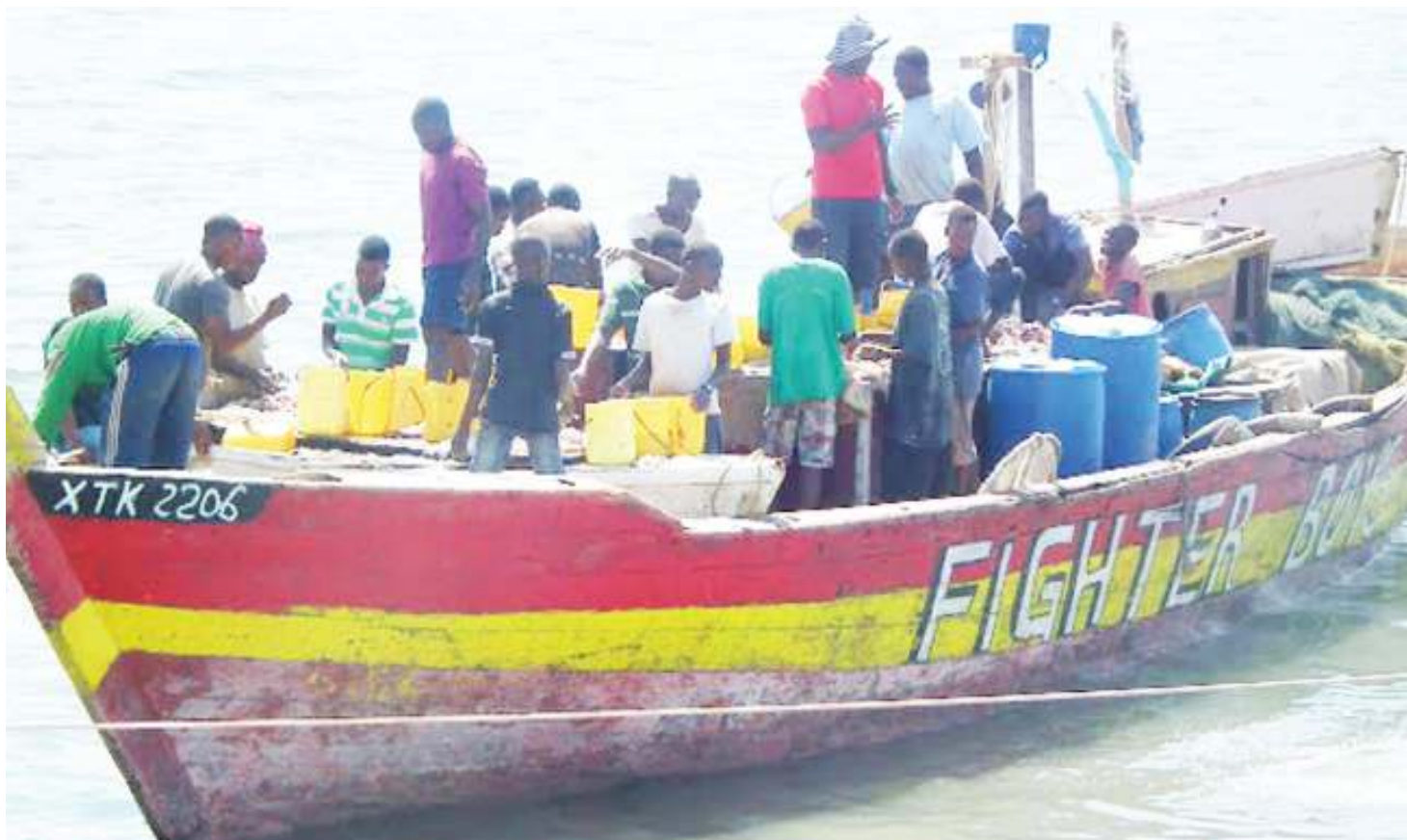
Shughuli za uvuvi zikiendelea.

Inalazwa pia, dawati limetembelea na kukutana na wadau 213 wa Sekta za Mifugo na Uvuvi kuwapa ushauri wa kitaalam. Wadau