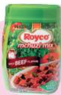
Royco Kora Mchuzi Mix 200g