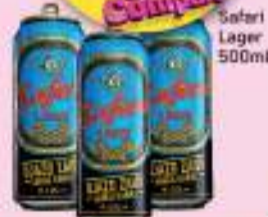
Safari Lager 500ml