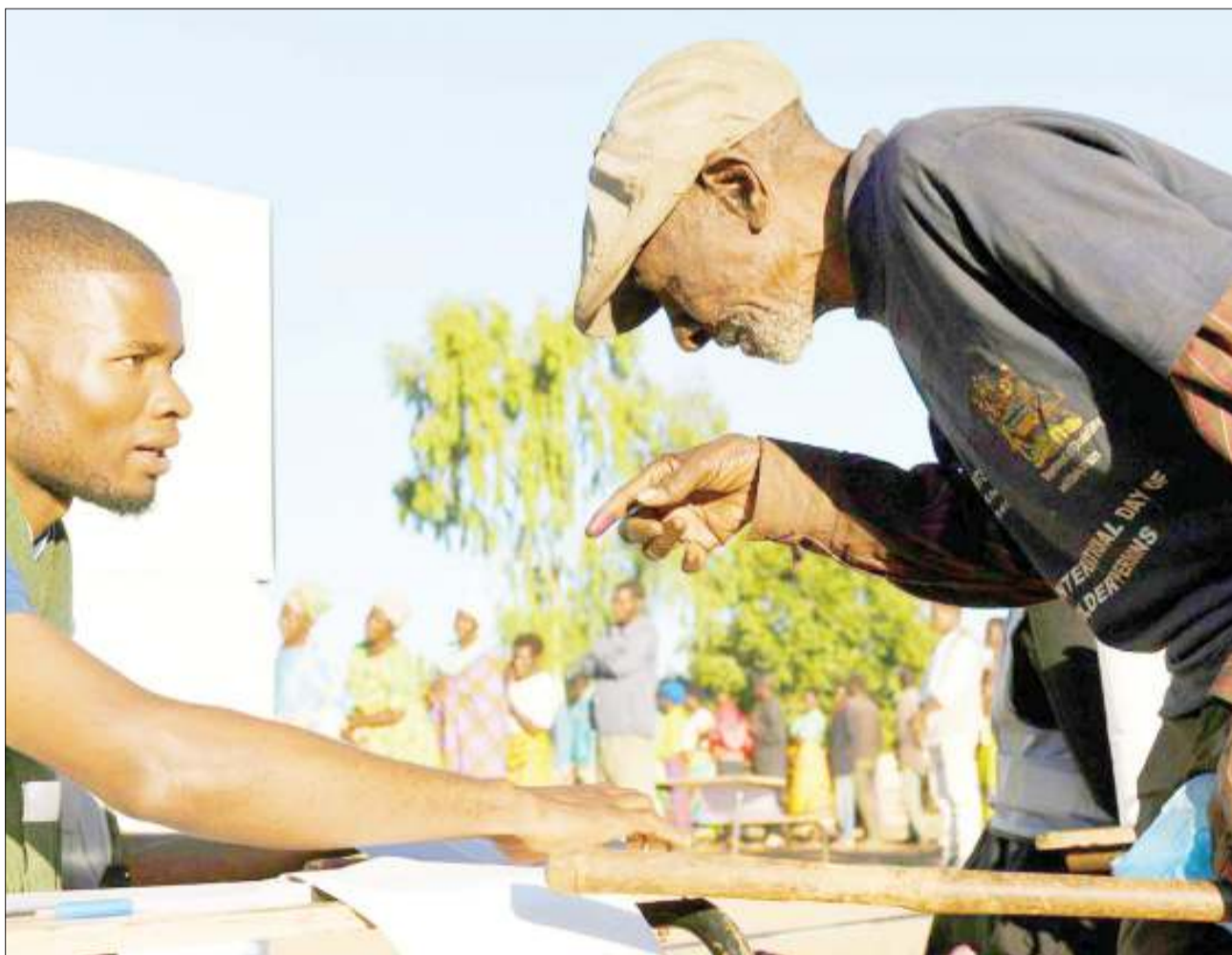
Mzee katika mji wa Blantyre nchini Malawi, akipiga kura kumchagua rais mpya wa nchi hiyo.

Watu wa Sudan lazima watoke kama walivyofanya Aprili 6 ili kuweka shinikizo zaidi kwa baraza la kijeshi ili kutupatia sisi mamlaka kamili.