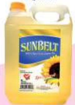
Sunbelt Sunflower Oil Jelly Can 5l