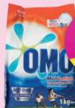
Omo Hand Washing Powder 1kg

Game is committed to offer you the best service with the lowest price. In the unlikely event that you find the same product advertised by a competitor at a lower price, we guarantee to beat that price! T's & C's apply.