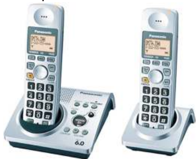
Simu Panasonic. Picha ndogo ni simu ya Huawei.

KAMPUNI ya vifaa vya elektroniki ya Panasonic ya nchini Japan, imetangaza kusitisha biashara na kampuni ya Huawei, ikiwa sehemu ya kukidhi matakwa ya masharti ya nchi, katika biashara yake na Marekani.