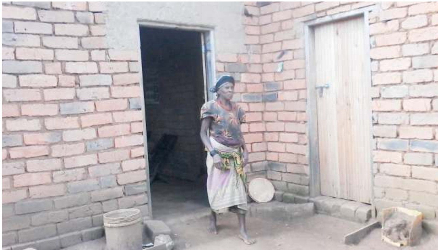
Mnufaika wa Tasaf wilayani Wanging'ombe, akiwa katika nyumba yake mpya.