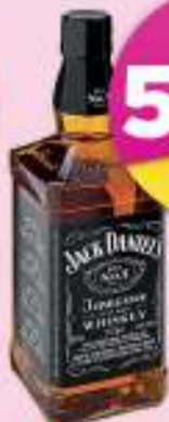
Jack Daniels Whisky 750ml