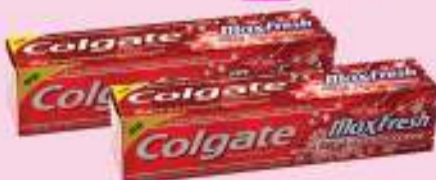
Colgate Maxifresh Spicy Fresh 100ml