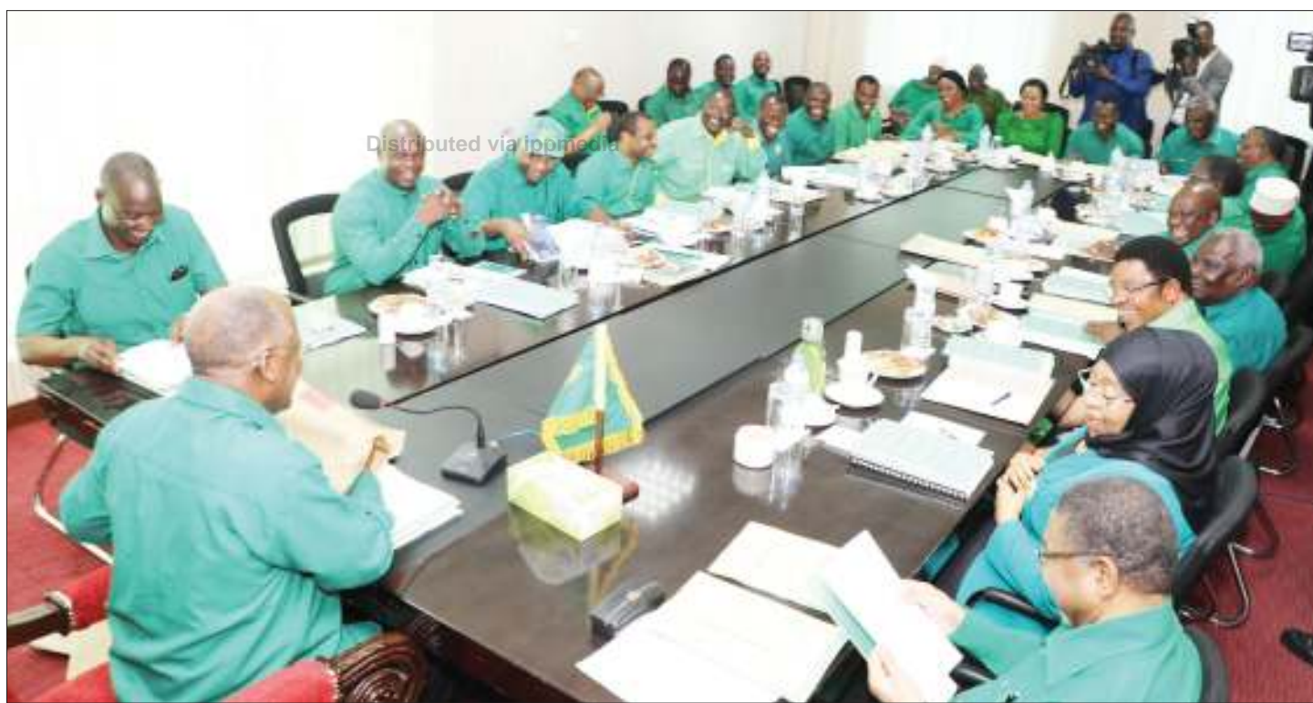
Mwenyekiti wa Chama Cha Mapinduzi (CCM), Rais Dk. John Pombe Magufuli, akiongoza Kikao cha Kamati Kuu ya Halmashauri Kuu ya CCM, katika Ofisi ndogo za chama hicho, Mtaa wa Lumumba, jijini Dar es Salaam jana.

Mtoto huyo aliokolewa na mkazi wa Kijiji cha Kamagambo, Kata ya Kiruruma, wilayani Karagwe, baada ya kutelekezwa na wagazi wake