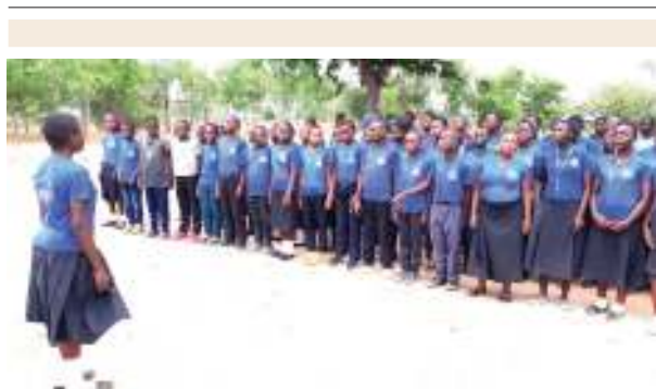
Elimu na sheria zawekwa kapu moja kunyoosha wazazi Msalala