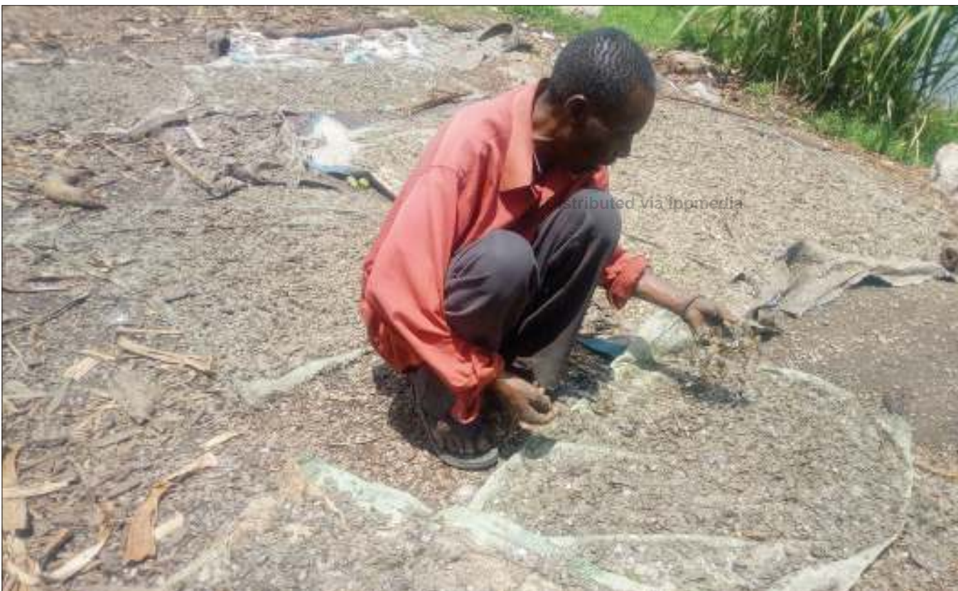
Mfanyabiashara wa magamba ya samaki akiyatandaza ili kuyakausha na jua, katika eneo la Kamanga, jijini Mwanza jana. Gunia moja la magamba hayo, linauzwa kwa bei ya 15,000/-.

Amesema kuwa kelele za kupindukia ni siyo tu kwamba ni kero kwa wananchi, bali zina madhara ya kiafya kwa watu.