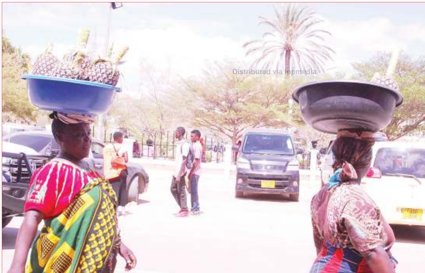
Kinamama wachuuzi wa mananasi wakisaka wateja, katika Mtaa wa Uhindini, jijini Dodoma jana.

Alisema serikali imejipanga kuhakikisha mradi huo wa barabara unajengwa kwa kiwango cha juu.