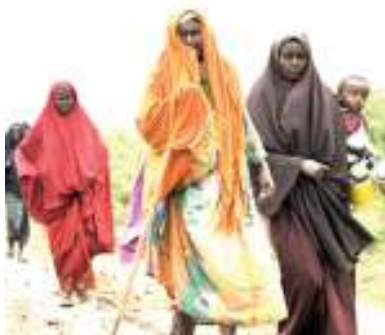
Wananchi walioathirika na matatizo ya hali ya hewa wakihama.