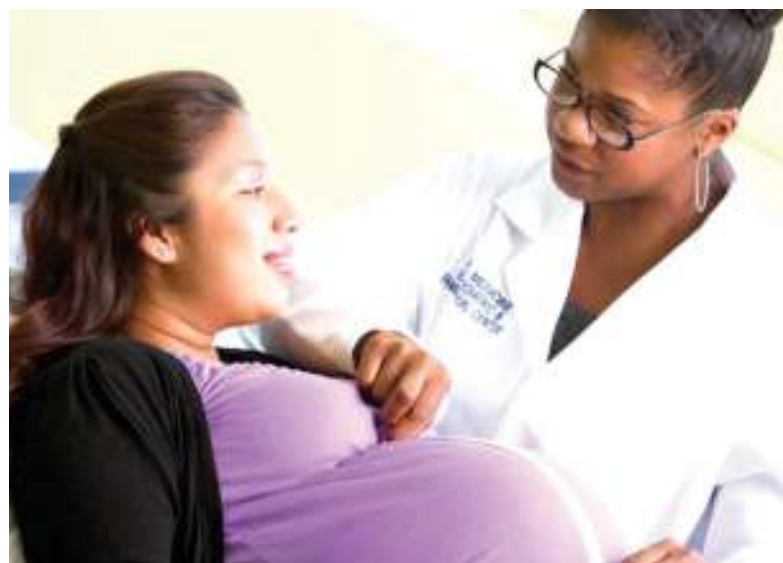
Mjamzito akihudumiwa nchini Ureno.

Mama huyo anaeleza hadi sasa mtoto ana umri wa miaka minane, ameshafanyiwa upasuaji