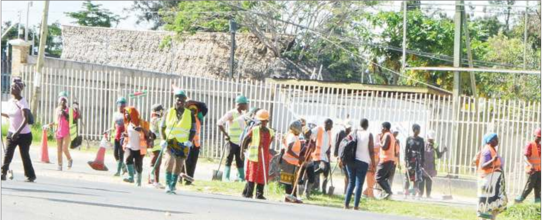
Wafanyausafi wakijipanga kuanza kazi katika eneo la Namanga Msasani, jijiji Dar es Salaama jana.