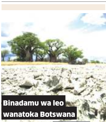
Binadamu wa leo wanatoka Botswana