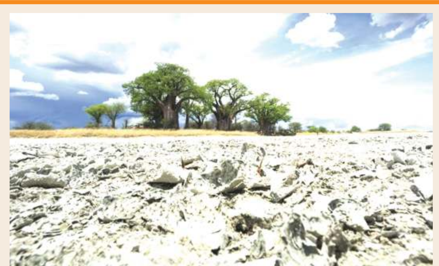
Kusini mwa Mto Zambezi, Botswana ambako maji yamekauka na kumejaa chumvi, kunatajwa ndiko binadamu wanakotokea.

Macha: “Endapo mfumo utasumbua, hakikisheni mnao taarifa kwa Ofisa Tehama wa Halmashauri,