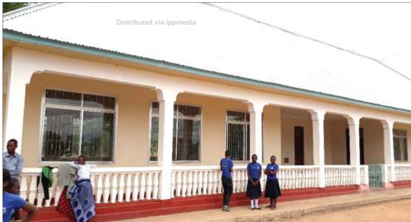
Moja ya majengo waliyopewa na Kanisa la Kikatoliki, jimbo la Segese, kwa ajili ya kufundisha masomo ya ziada, wanafunzi waliomaliza elimu ya msingi na sekondari.

“Lakini wanaoendelea na masomo unakuta ni wanafunzi 30 tu, huku wengine wakiwa wameshaozeshwa na kubebeshwa ujauzito.”