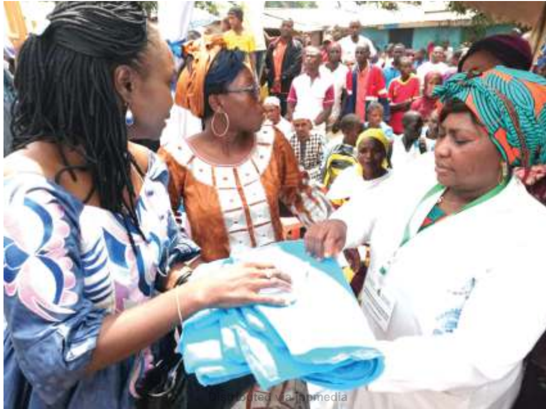
Kampeni ya ugawaji dawa za mbu. Picha ya chini, mbu anayesumbua.

wa kupatikana vielelezo mahali dawa zinashindwa kufanya kazi, inapotokea jamii inakuwa dhaifu kiyafya na wanaugua kirahisi.