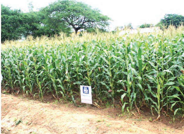
Shamba darasa ambalo mbolea inatumika mkoani Iringa.

Anasema utoaji ruzuku za mbolea, ni matokeo ya maono ya Rais Samia Suluhu Hassan katika umuhimu wa kuwawezesha wakulima wafikie tija na uhakika wa mavuno ya chakula na kibi-