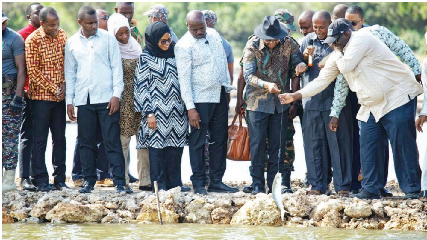
Rais wa Zanzibar, Dk. Hussein Ali Mwinyi, akivua samaki katika bwawa la ufugaji samaki wa ushirika wa wafugaji wa kijiji cha Pujini, mkoa wa Kusini Pemba jana.

Alisema kwenda kinyume na ushauri wa wataalamu kutaongeza athari zaidi kwa mgonjwa wa maradhi hayo.