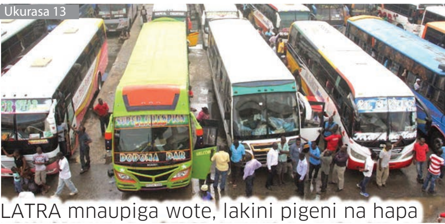
LATRA mnaupiga wote, lakini pigeni na hapa