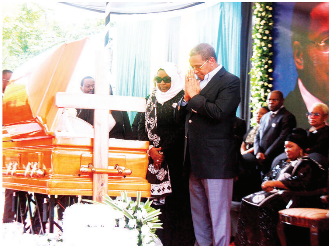
Rais mstaafu, Jakaya Kikwete, akitoa heshima zake za mwisho kwa aliyekuwa Waziri wa Mambo ya Nje na Ushirikiano wa Kimataifa, marehemu Bernard Membe, katika viunga vya Karimjee jijini Dar es Salaam jana.

kwanza kwa sifa hiyo mwaka 2005 alipokuwa anapambana kwa ajili ya kupata mgombea atakayemrithi Rais wa Awamu ya Tatu, Benjamin Mkapa.