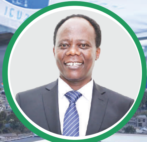
Dkt. Godwin Mollel (Mb) Naibu Waziri