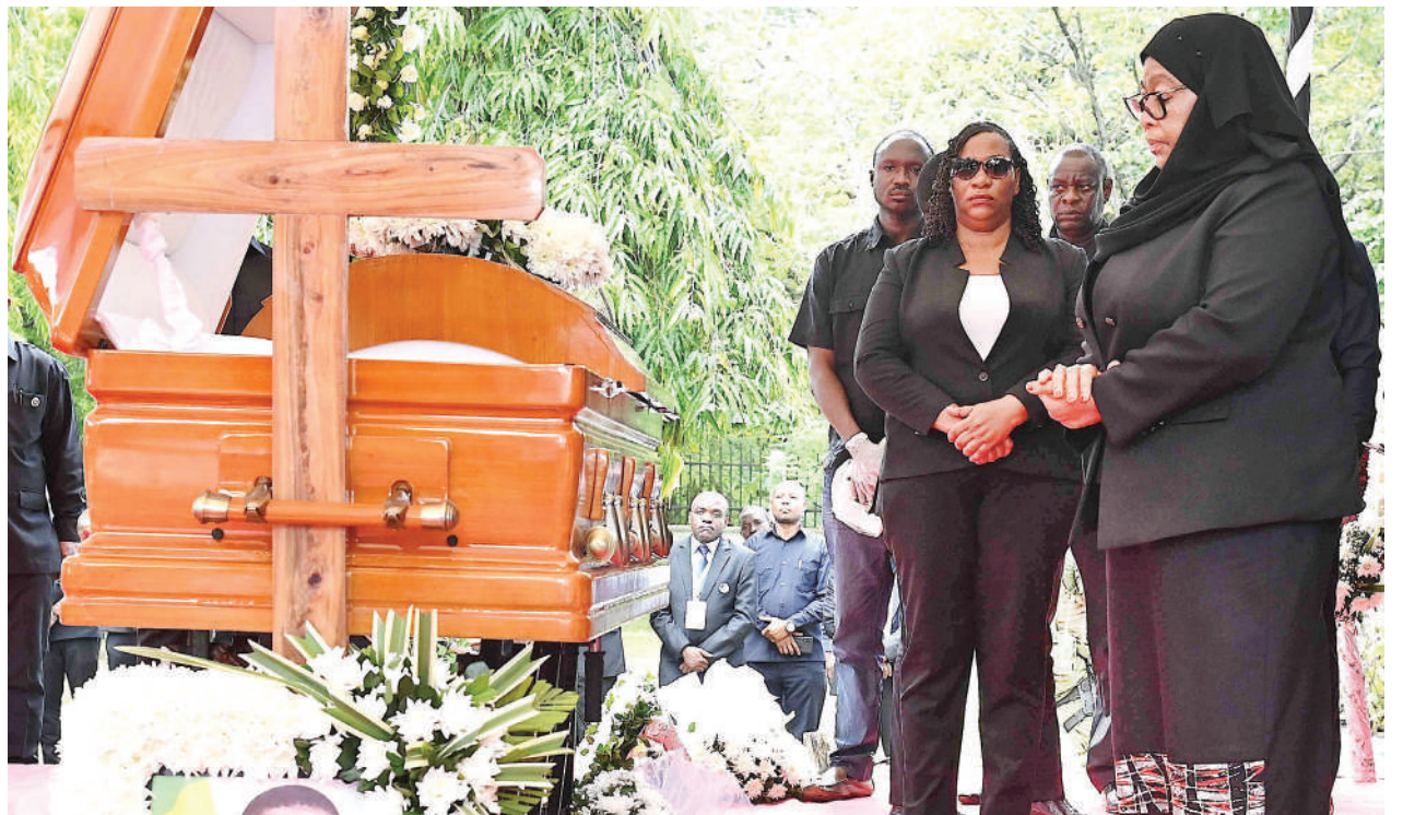
Rais Samia Suluhu Hassan akiaga mwili wa aliyewahi kuwa Waziri wa Mambo ya Nje, Bernard Membe, katika Viwanja vya Karimjee Dar es Salaam jana.

KAMPUNI ya Tembo Nickel, imeingia Mkataba wa Makubaliano (MoU) wa zaidi ya Shilingi bilioni moja na Jeshi la Polisi Tanzania, kudumisha ulinzi