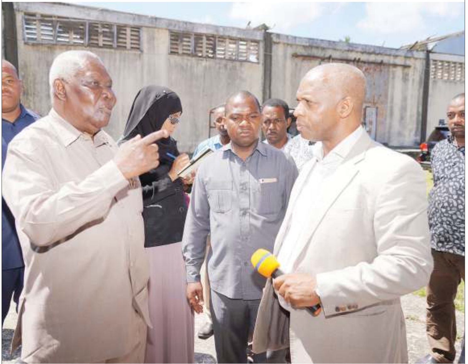
Makamu wa Pili wa Rais wa Zanzibar, Balozi Seif Ali Iddi, akipata maelekezo alipotembelea Kiwanda cha nguo cha Cotex, ambacho kinatarajiwa kufufuliwa baada ya kutofanya kazi kwa muda mrefu huko Chumbuni Zanzibar juji.

"Kwa sasa, tupo vizuri kwani ile hali ya usumbufu katika ukaguzi itapungua kwa kiasi kikubwa," alisema.