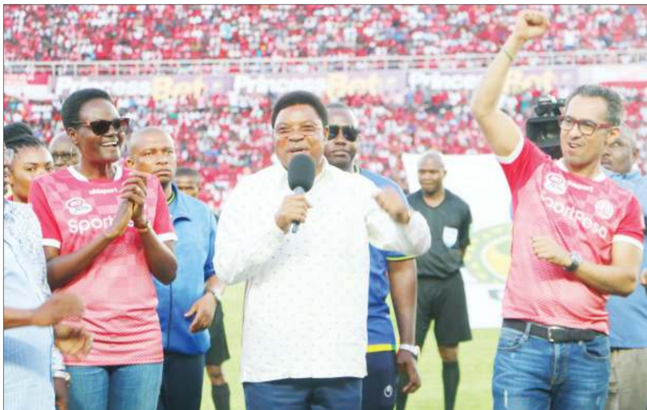
Waziri Mkuu wa Serikali ya Jamhuri ya Muungano wa Tanzania, Kassim Majaliwa (katikati), akiwapongeza mashabiki wa Simba kwa kujaza Uwanja wa Taifa, pamoja na mwekezaji wa klabu hiyo, Mohamed 'Mo' Dewji (kulia) kwa kuamua kuwekeza katika soka. Pongezi hizo alizitoa wakati alipokuwa mgeni rasmi katika tamasha la Simba Day juzi. Kushoto ni Naibu Spika wa Bunge, Dk. Tulia Ackson.