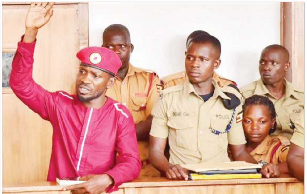
Mwanamuziki na Mbunge wa Upinzani nchini Uganda, Bobi Wine (aliyenyoosha mkono), akiwa mbele ya mahakama Aprili mwaka huu.

Kazi yetu kama polisi inaishia mpakani... sipo katika nafasi ya kuelezea hatima ya madaktari wa Cuba waliotekwa lakini maofisa wangu wanashughulikia.