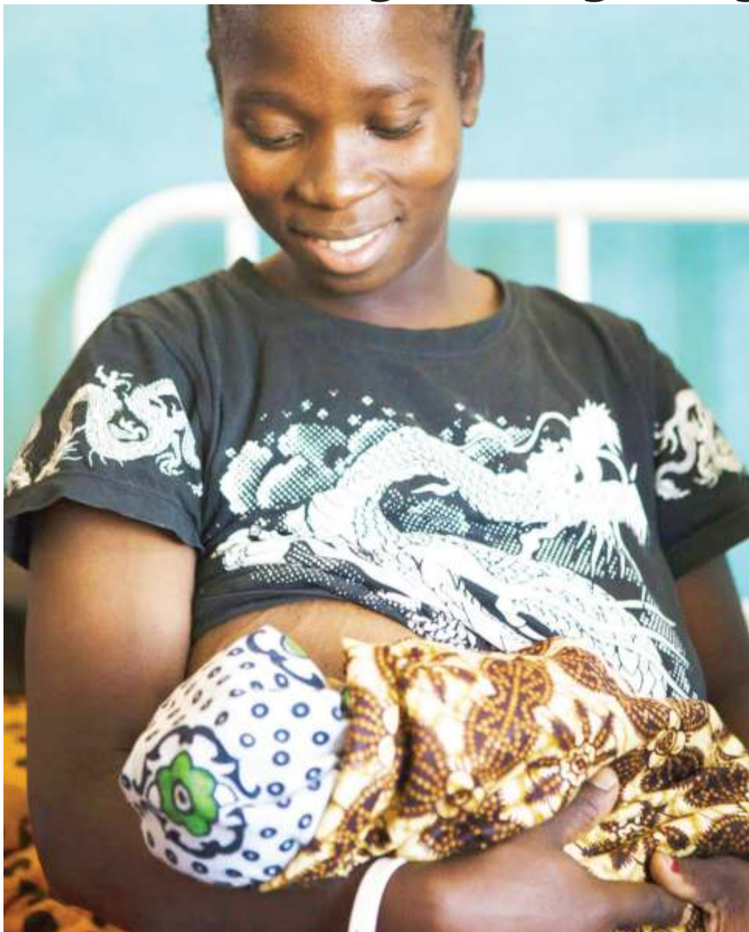
Jukumu la unyonyeshaji likiendelea.

"Jambo hili linahitaji juhudi za makusudi za uelimishaji jamii, kuwajengea wanawake hali ya ku-