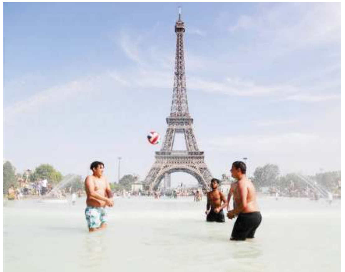
Wakazi wa jiji la Paris, Ufaransa wakitafuta nafuu kutokana na joto kali, Julai 23 iliyopita.

Tuko katika mfululizo wa miaka mitano yenye joto lililopitiliza kutoka mwaka 2015 hadi 2019. Kama hatutachukua hatua katika mabadiliko ya hali ya hewa.