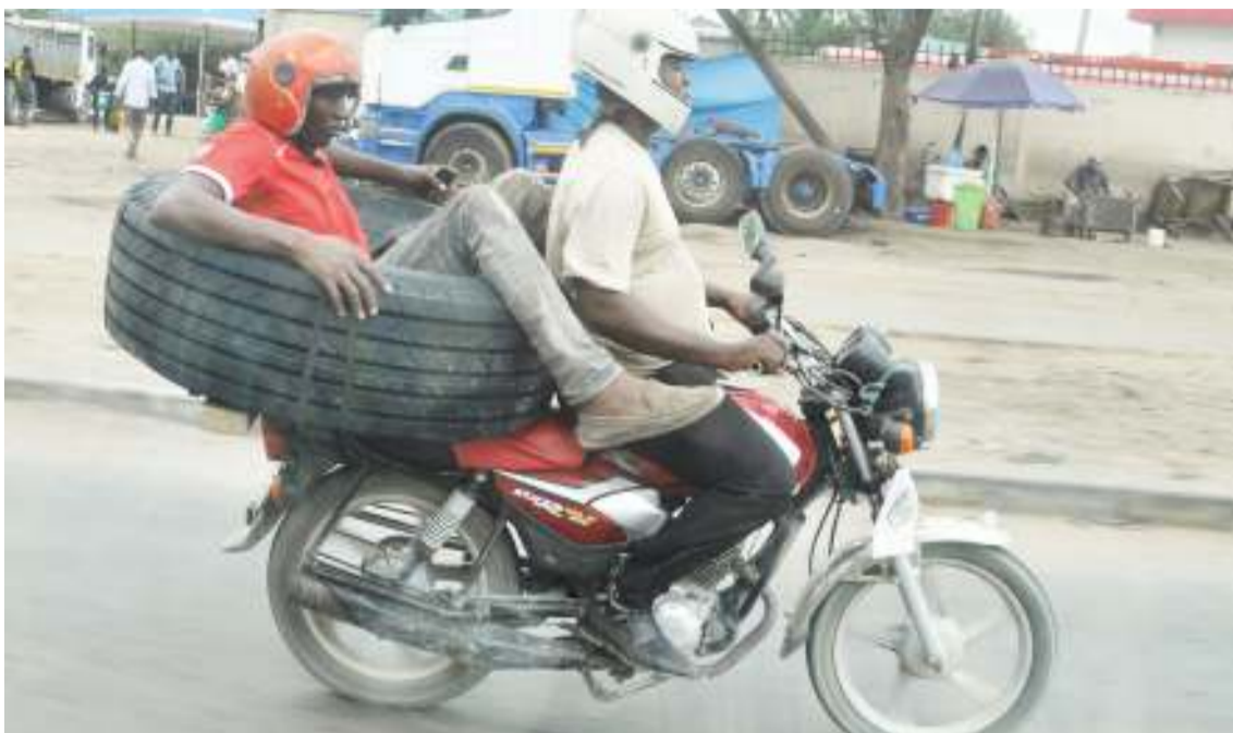
Mwendesha bodaboda akiwa amepakia tairi na abiria juu, katika barabara ya Mandela, eneo la Tabata, jijini Dar es Salaam jana, kitendo ambacho ni hatari kwa usalama barabarani.