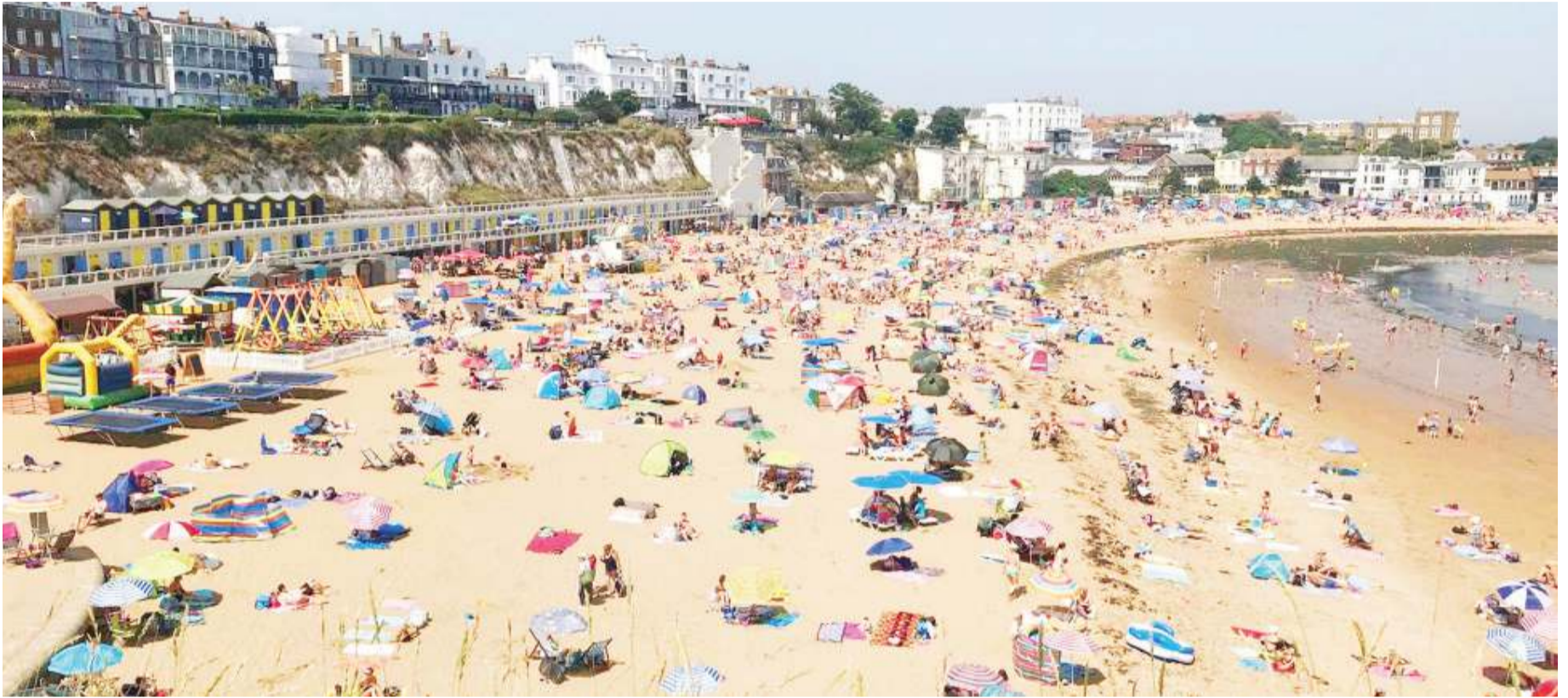
Wakazi wa Uingereza waliofurika ufukweni, kutokana na joto kali, Julai 25.

Mataifa, António Guterres, alitamka Alhamisi iliyopita, kwamba inapiku rekodi ya Julai 2016, akirejea mfano wa joto la bahari ya Pacific, lenye kawaida ya kuathiri hali ya hewa Kusini mwa Bara Amerika.