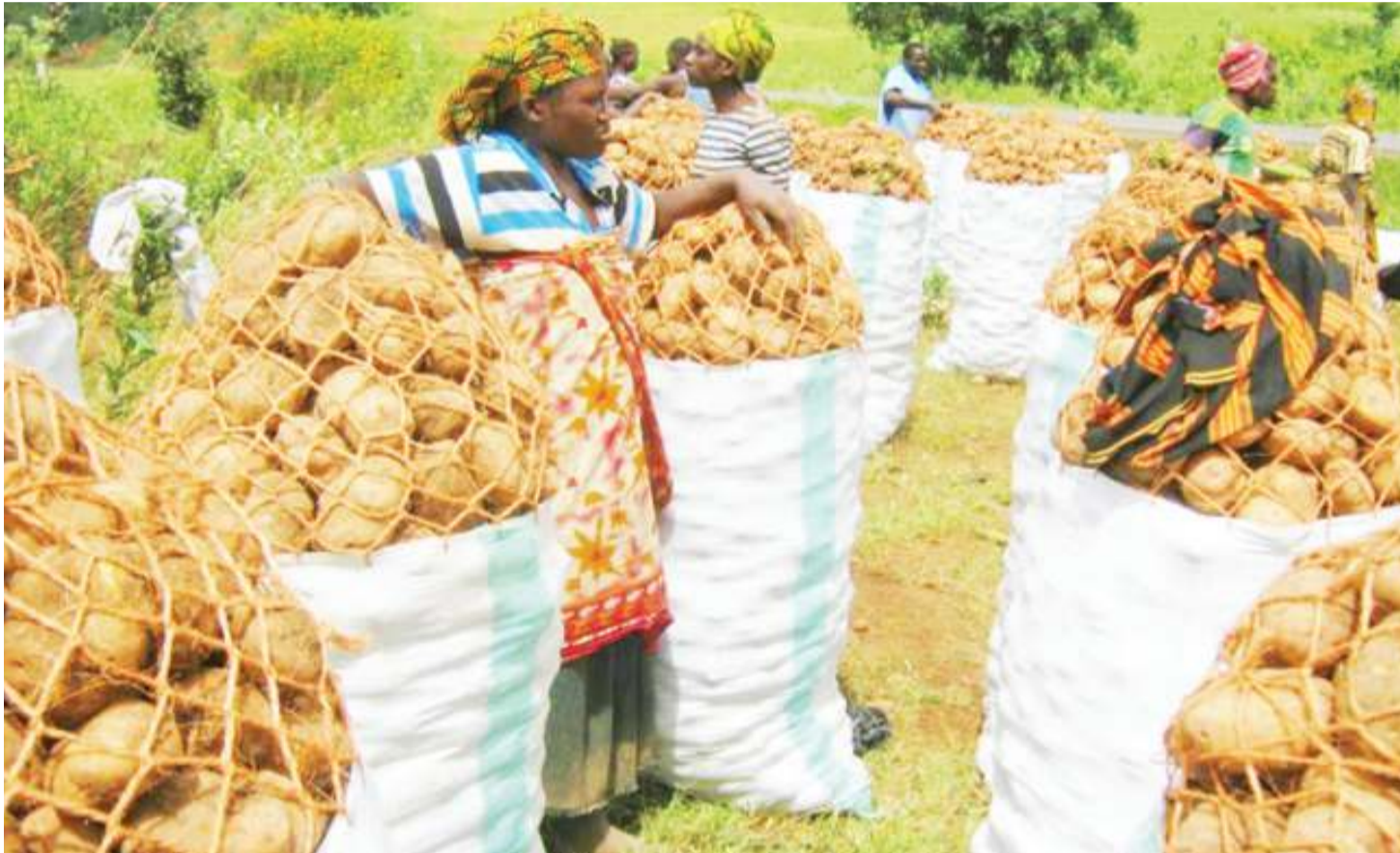
Sehemu ya bidhaa za mizizi, viazi na karoti zinazotajwa kuathiri mazingira.

R IPOTIYA “Matarajio ya Idadi ya Watu duniani 2019” iliyotolewa na Kitengo cha Masuala ya Idadi ya Watu katika Idara ya Masuala ya Uchumi na Jamii (DESA) ya Umoja wa Mataifa, inasema idadi ya watu duniani inatarajiwa kuongezeka kutoka bilioni 7.7 ya sasa, hadi bilioni 9.7 mwaka 2050.