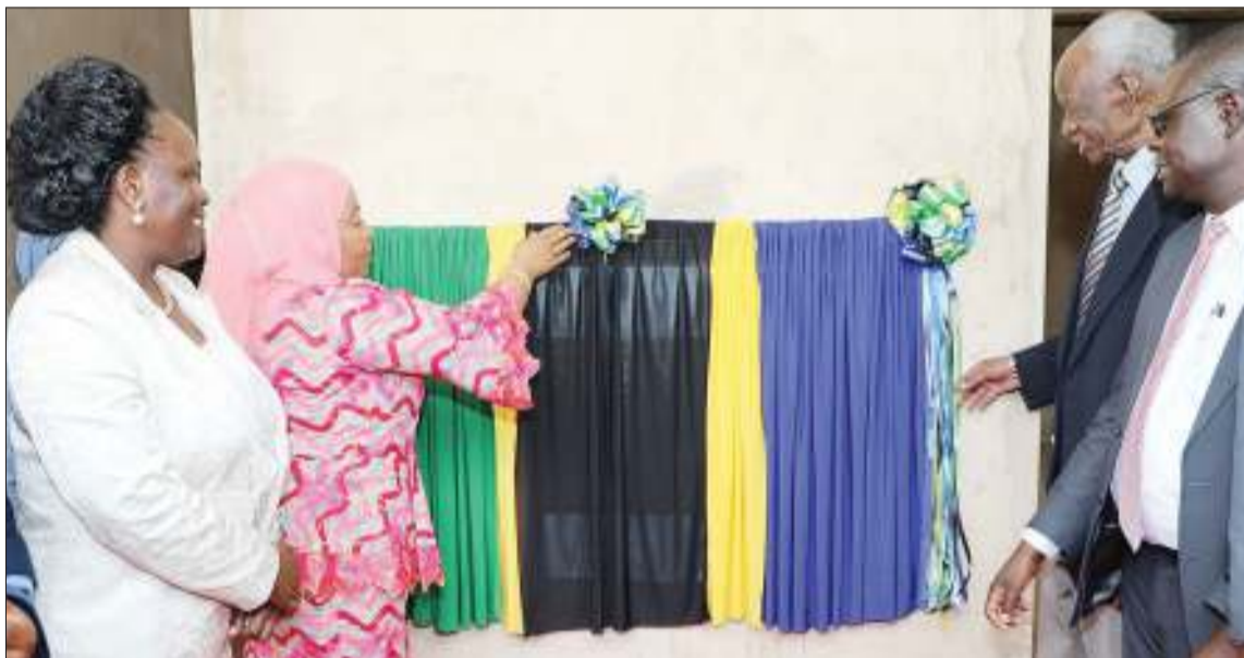
Makamu wa Rais, Samia Suluhu Hassan, akiweka jiwe la msingi la ujenzi wa maabara kubwa kwa Afrika ya Sayansi, katika Chuo Kikuu cha Kilimo (SUA), mkoani Morogoro jana. Makamu wa Rais yupo mkoani humo kwa ziara ya kikazi ya siku tatu. Wanaoshuhudia ni Waziri Mkuu mstaafu, Jaji Joseph Warioba na Waziri wa Elimu, Sayansi na Teknolojia, Prof. Joyce Ndalicha-ko.