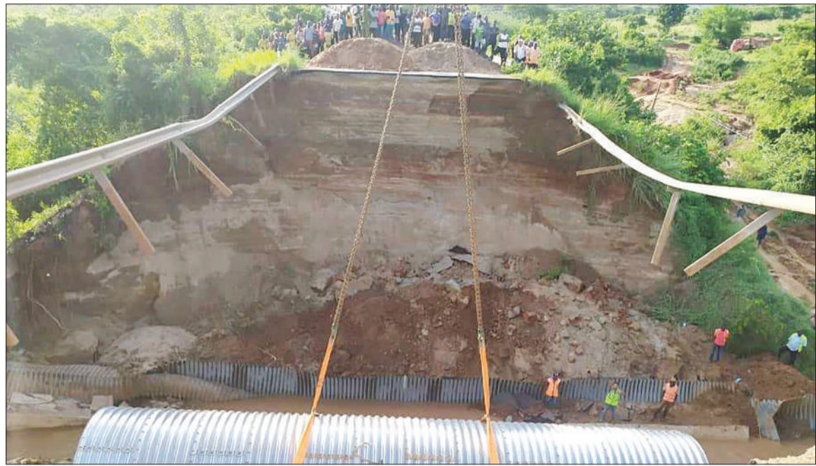
Mafundi wakiendelea na kazi ya ukarabati wa daraja la Mto Kiegeya maarufu daraja la Mkange, ambalo lilizolewa na maji na kusababisha kuka-tika kwa mawasiliano ya Barabara ya Morogoro-Dodoma, wilayani Gairo, mkoani Morogoro juzi.

Kwa mujibu wa Waziri Mkuu, barabara hiyo ni ya kimataifa na mara kwa mara wanapokea simu kutoka kwa viongozi wa nchi jirani kuhusu watu wao kukwama katika eneo hilo.