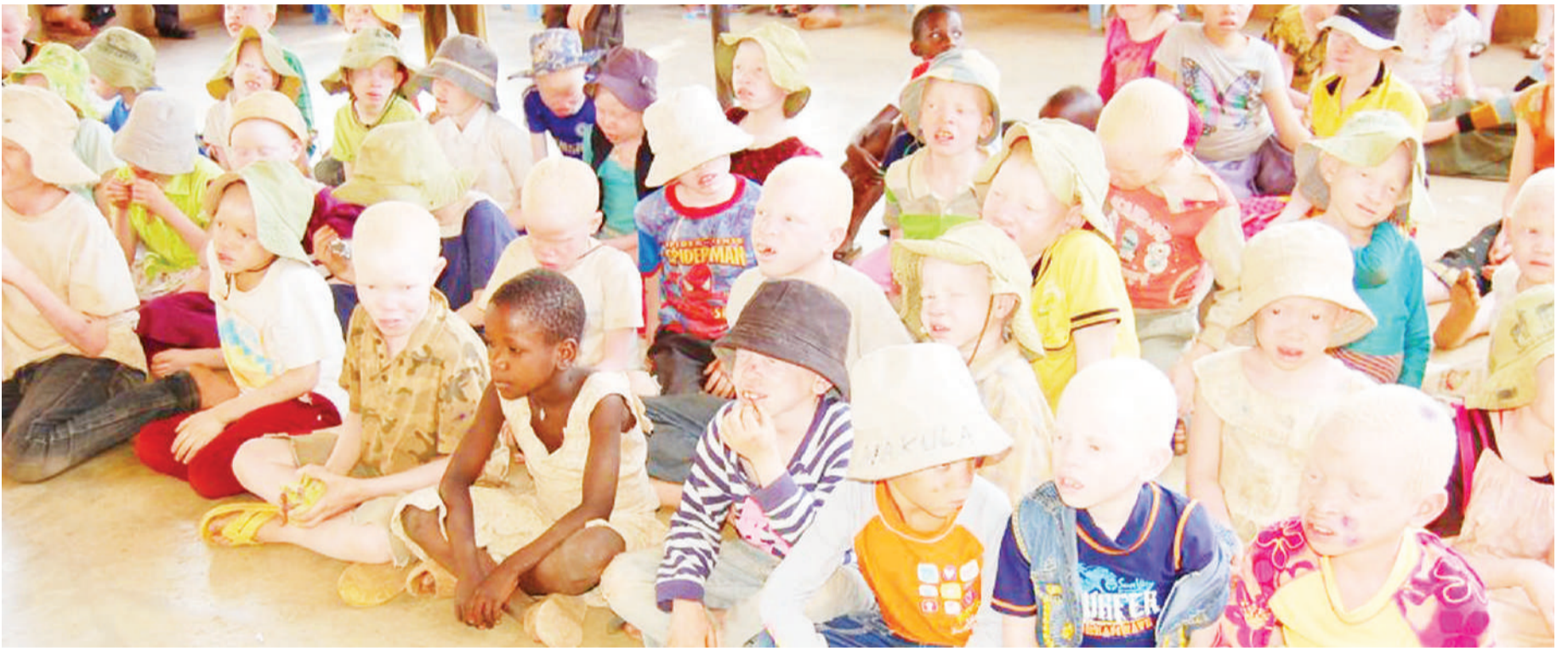
Watoto wenye ualbino wakiwa katika mikusanyiko tofauti, yenye huduma na harakati za kupigania haki zao.

• Toka zama za kulia, hadi kicheko • Ubia wao na Under the Same Sun