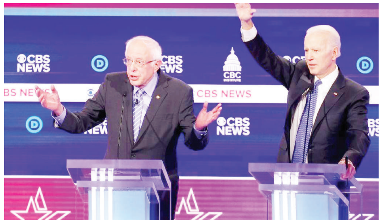
Bernie Sanders (kushoto) na Joe Biden wakati wa mjadala kati ya wagombea wa urais katika kura za mchujo katika chama cha Democratic huko Charleston, South Carolina.

Mlipuko wa virusi vya corona umeua watu wapatao 77 nchini Iran katika kipindi cha wiki mbili. BBC