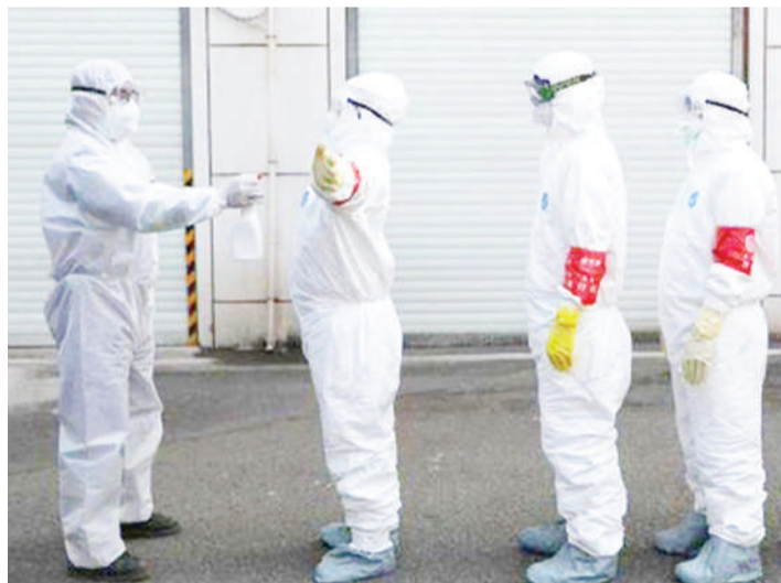
Ukaguzi dhidi ya corona nchini Algeria.

Kila mahali zikiwepo hizo halafu zisaidiane na zile za kutibu ugonjwa husika (yaani mafua na homa kali, zaidi 'antibiotics'), kinga inaweza kujengwa.