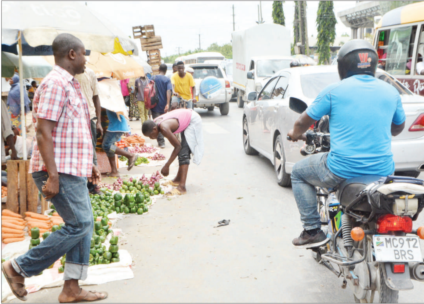
Wachuuzi wakiwa wamepanga bidhaa zao pembeni ya barabara katika eneo la Ilala Boma, jijini Dar es Salaam jana na kusababisha usumbufu kwa waenda kwa miguu.