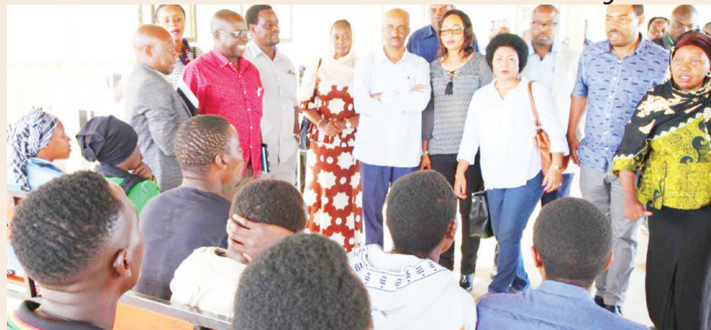
Wajumbe wa Kamati ya Kudumu ya Bunge ya Masuala ya Ukimwi na Dawa ya Kulevyo, walipowasilikiza waraibu wa dawa ya kulevyo katika kituo cha matibabu yao, cha Itega, Jijini Dodoma.