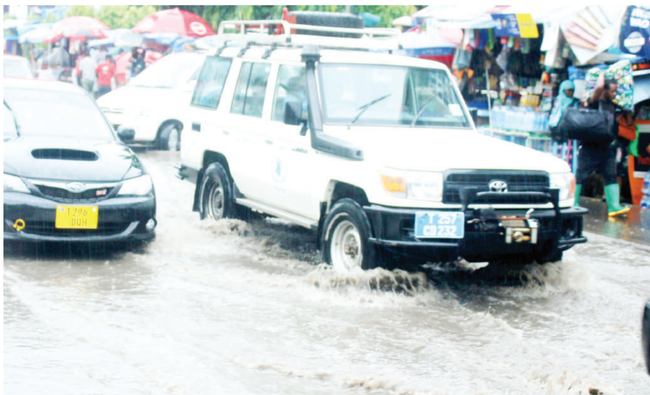
Magari yakipita kwa tabu kwenye maji yaliyotumama katika eneo la Akiba, kutokana na mvua kubwa iliyonyesha, jijini Dar es Salaam jana.

Viongozi wa dini wanapaswa kutumia nyumba za ibada kwa ajili ya kuliombea taifa ili Mwenyezi Mungu alinusuru na ugonjwa huo.