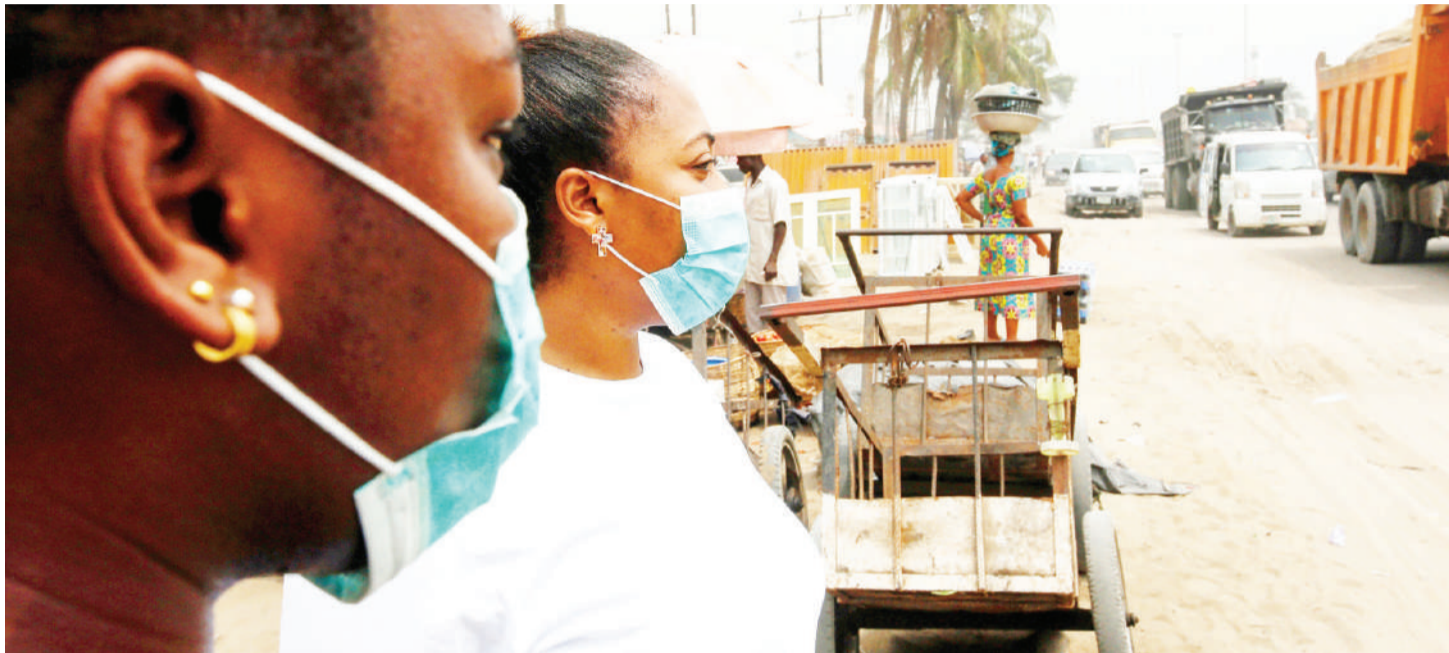
Kujihami na corona nchini Nigeria.