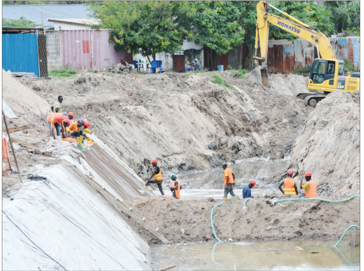
Mkandarasi akiendelea na ujenzi wa kuta za ukingo wa Mto Ng'ombe, eneo la Kijitonyama Ali Maua, jijini Dar es Salaam, jana.

Alisema, mafunzo waliyopatiwa kabla ya kupatiwa mizinga hiyo, yatawaongoza katika uvunaji wa asali unaofuata kanuni na taratibu ambao utawawezesha asali yao kuwa na soko ndani na nje ya nchi.