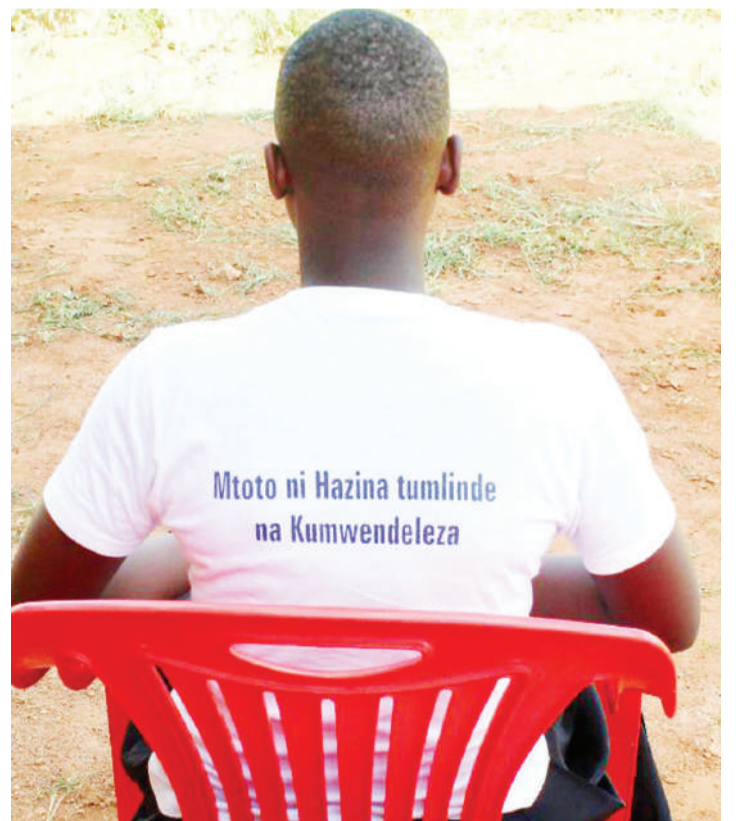
Mwathirika wa mimba ya utotoni, akielezea simulizi anayodai udhalilishaji uliomkuta kutoka kwa mwalimu wake, akaangukia ujauzito na hatimaye kufukuzwa shule.

"Pia, tunafanya mawasiliano na kampuni za simu za mkononi, ili kuwa zinatuma jumbe mfupi (sms) kwa wakazi wa Mkoa wa Shinyanga, zinazopinga matukio ya ukatili dhidi ya wanawake na watoto, ambapo 'sms' hizo moja ya kampuni za simu zimeshaanza kutuma," anaeleza.