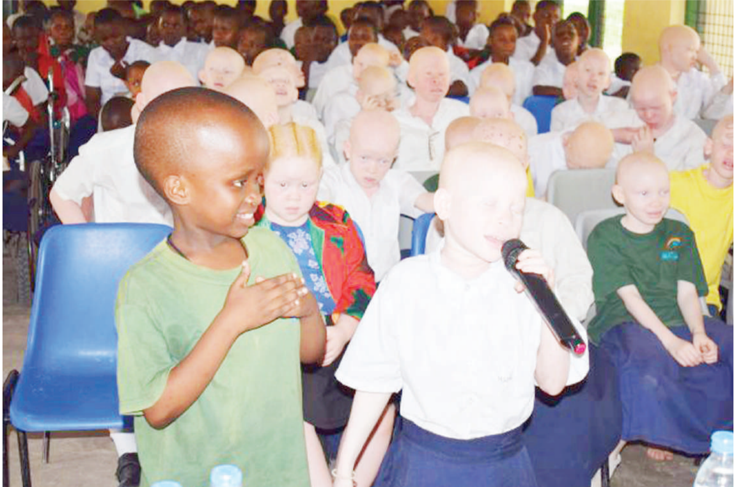
Watoto wenye ualbino wakiwa katika harakati za kupigania haki zao.

“Tunaamini uchaguzi huu utai- sha bila ya kusikia tukio lolote la mtu mwenye ualbino kuzuriwa ama kuuawa. Tunajua uelewa upo wa hali ya juu na wananchi tayari wameelimika,” anasema.