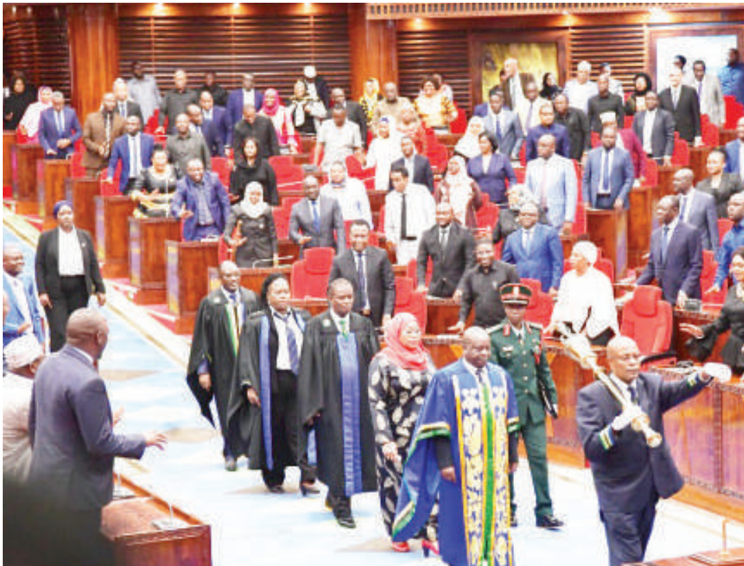
Rais Samia Suluhu Hassan, akiongozwa na aliyekuwa Spika wa Bunge, Job Ndugai, wakiingia ndani ya ukumbi wa Bunge, kwa ajili ya kulihutubia tarehe 22 Aprili, 2021 Jijini Dodoma.

• Ilianza kwa kunadiwa, kisha sasa inatekelezwa