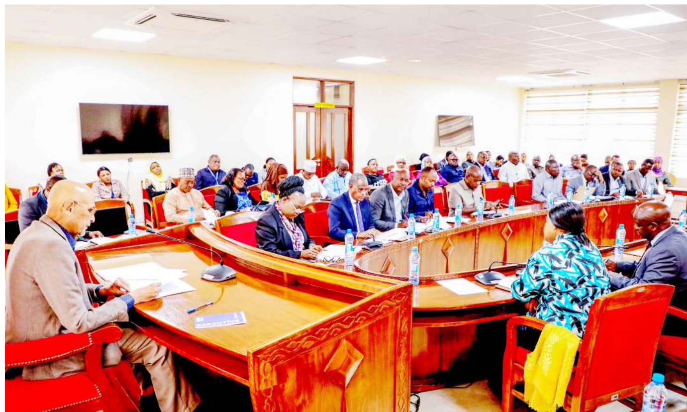
Naibu Spika wa Bunge, Mussa Azzan 'Zungu' kwa niaba ya Spika wa Bunge, akiongoza kikao cha Kamati ya Uongozi na Bajeti katika mashauriano kuhusu mambo ya muhimu yaliyojitokeza kwenye kamati za Kisekta wakati wa kujadili utekelezaji wa Bajeti za Wizara kwa Mwaka wa Fedha 2023/2024 na Makadirio ya matumizi ya Serikali kwa Mwaka wa Fedha 2024/2025, Bungeni jijini Dodoma jana.