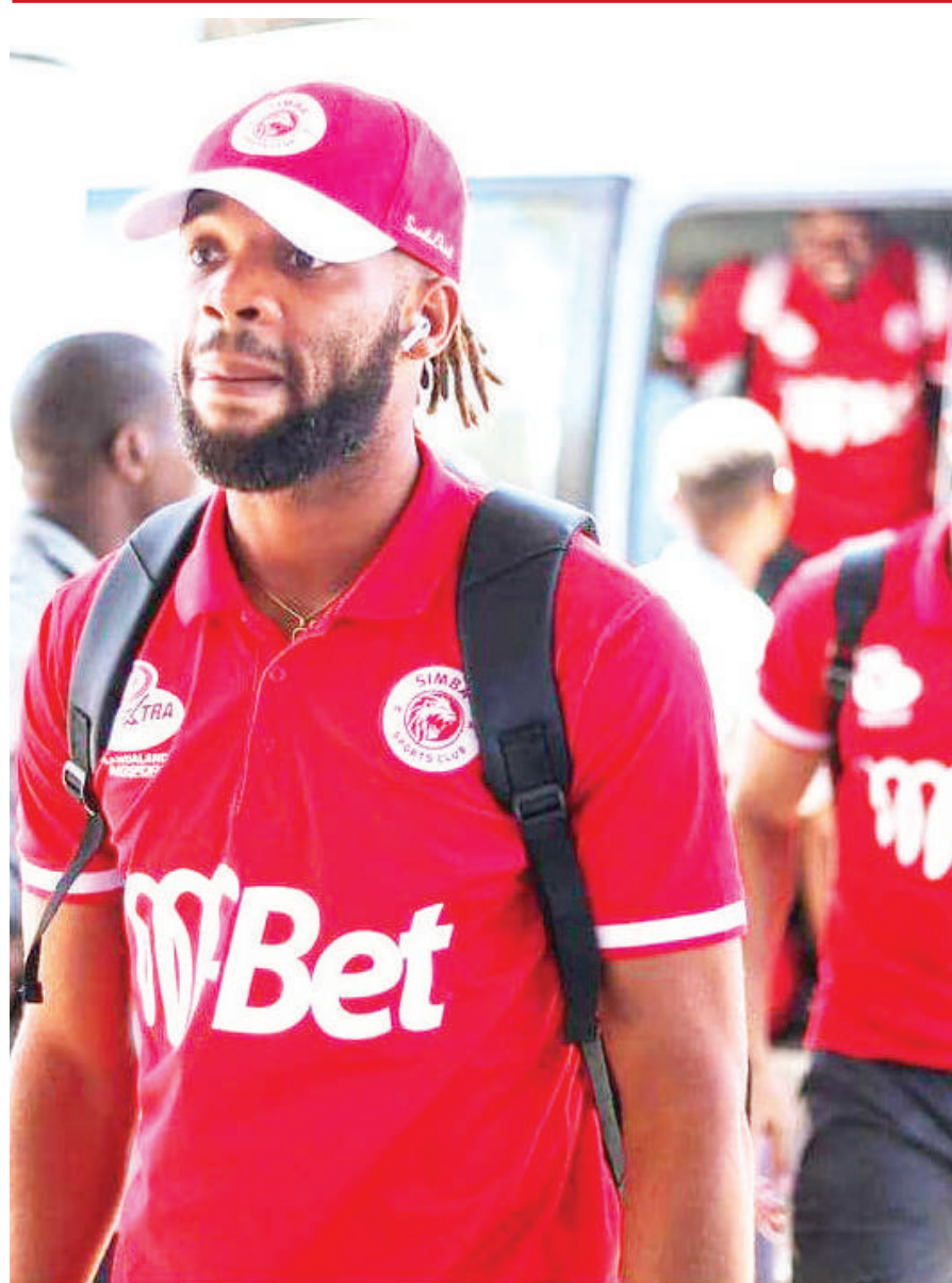
Wachezaji wa Simba wakirejea jijini Dar es Salaam wakitokea kambini Zan-zibar, tayari kwa mechi ya robo fainali ya Ligi ya Mabingwa Afrika dhidi ya Al Ahly ya Misri, itakayopigwa Ijumaa wiki hii katika Uwanja wa Benjamin Mkapa Dar es Salaam.

"Ni mapema sana kuwazungumzia hao wachezaji hawana muda mrefu ndani ya timu, katika usajili hasa nyota wa kigeni kuna mambo mengi sana, kwanza ni mazingira ya kuyazoea, lakini na aina ya wenzake alikutana nao katika timu husika, mfano ukimchukuwa Lionel Messi akija hapa atakuwa na ubora huo?," alisema mshambuliaji huyo wa zamani wa Simba anayeshikilia rekodi ya kufunga 'hat-trick' kwenye dabi dhidi ya Yanga.