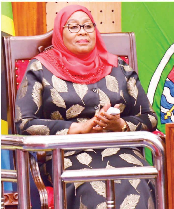
Mwenyekiti wa CCM, Rais Dk. Samia Suluhu.

Ni kauli inayobeba ujumbe wa kunyoosha kidole, akisisitiza kuwa kazi za kuwaletea wana- nchi maendeleo ndizo zitawa- beba wagombea wa CCM katika uchaguzi mkuu ujao na si njia nyingine na kwamba wajiandae