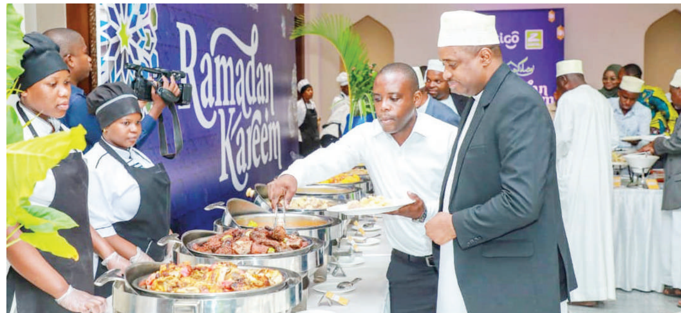
Makamu wa Pili wa Rais Zanzibar, Hemed Suleiman Abdullah akishiriki futari iliyoandaliwa na kampuni ya Tigo Zantel, jijini Zanzibar juzi.

Aidha, alisema kampuni hiyo imewekeza katika kuboresha miundombinu ya teknolojia ya mtandao huo na imekuwa kampuni ya kwanza ya mawasiliano Tanzania kwa kuweka kasi ya mawasiliano ya 5G visiwani Zanzibar.