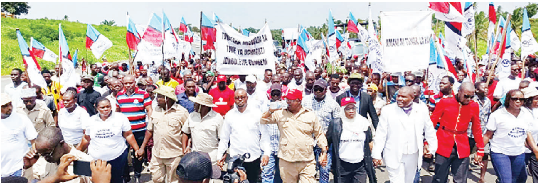
Maandamano ya chama cha siasa, CHADEMA, baada ya kufunguliwa ulingo wa demokrasia ya vyama nchini.