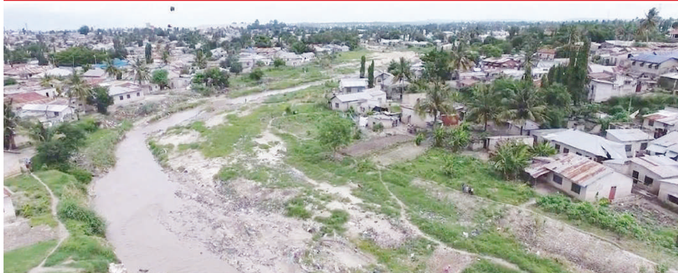
Sehemu ya Bonde la Msimbazi, jijini Dar es Salaam.