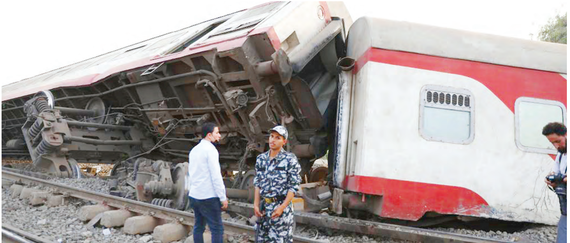
Picha ikionyesha treni iliyopata ajali na kusababisha vifo vya watu 11 na kujeruhi takribani 100, iliyotoka jiji la Delta, mji mkuu Cairo, Misri, juzi.