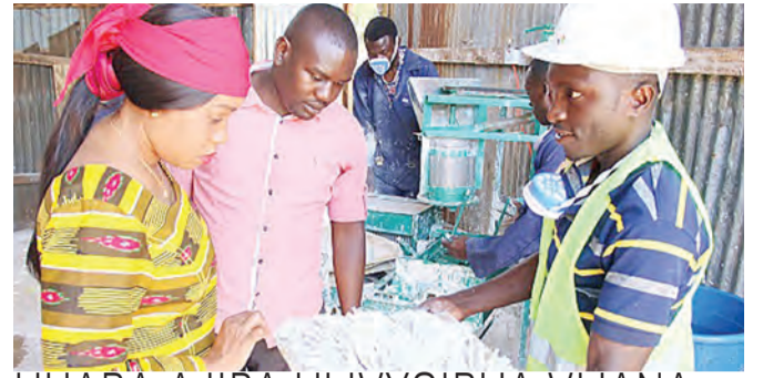
UHABA AJIRA ULIVYOIBUA VIJANA