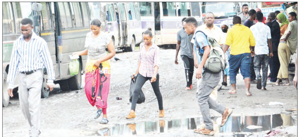
Abiria wakitembea kwa tahadhari kutokana na matope katika stedi ya Kawe Manispaa ya Kinondoni jijini Dar es Salaam.