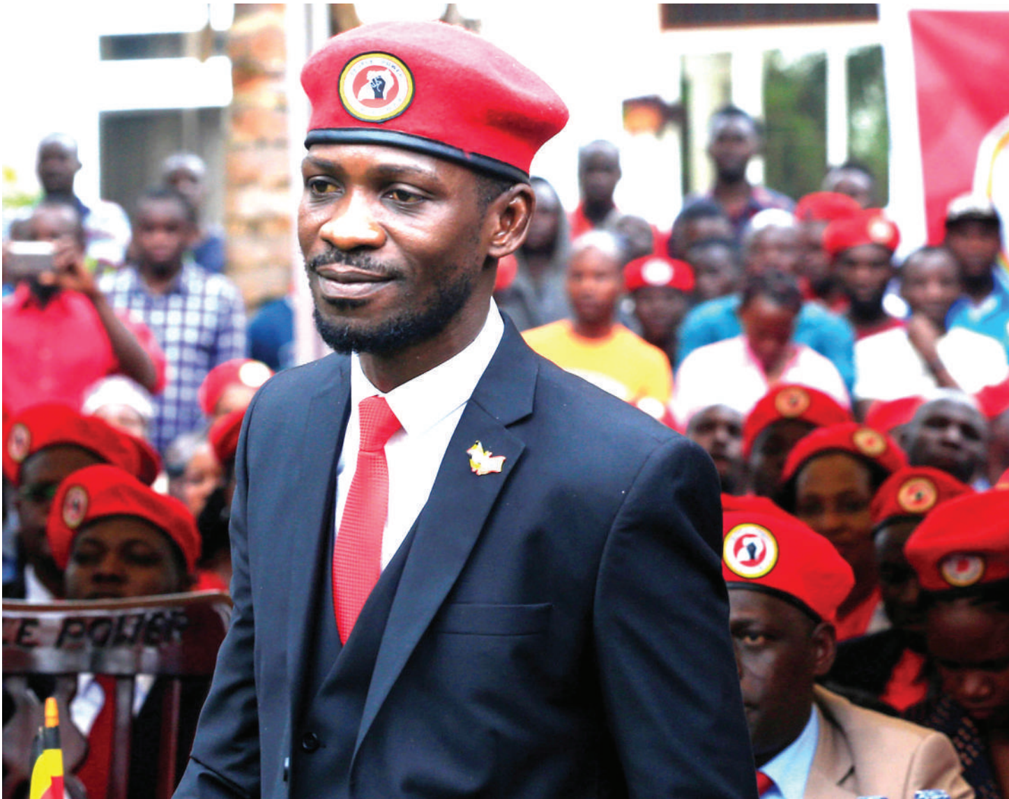
Robert Kyagulanyi au Bobi Wine, mgombea urais wa Uganda mwenye mvuto kwa vijana.