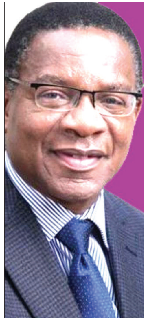
Bernard Membe, aliyegombea urais kwa tiketi ya ACT-Wazalendo.