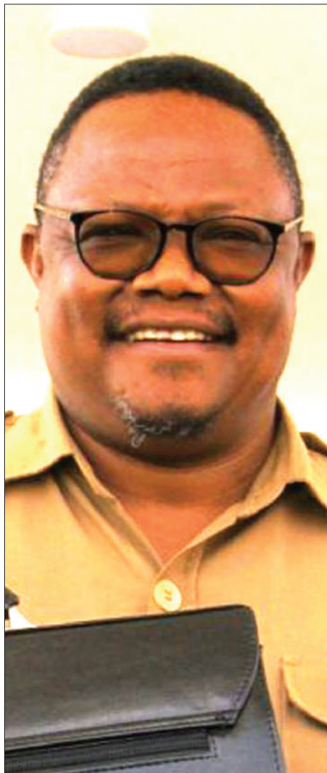
Mgombea urais wa CHADEMA 2020, Tundu Lissu.