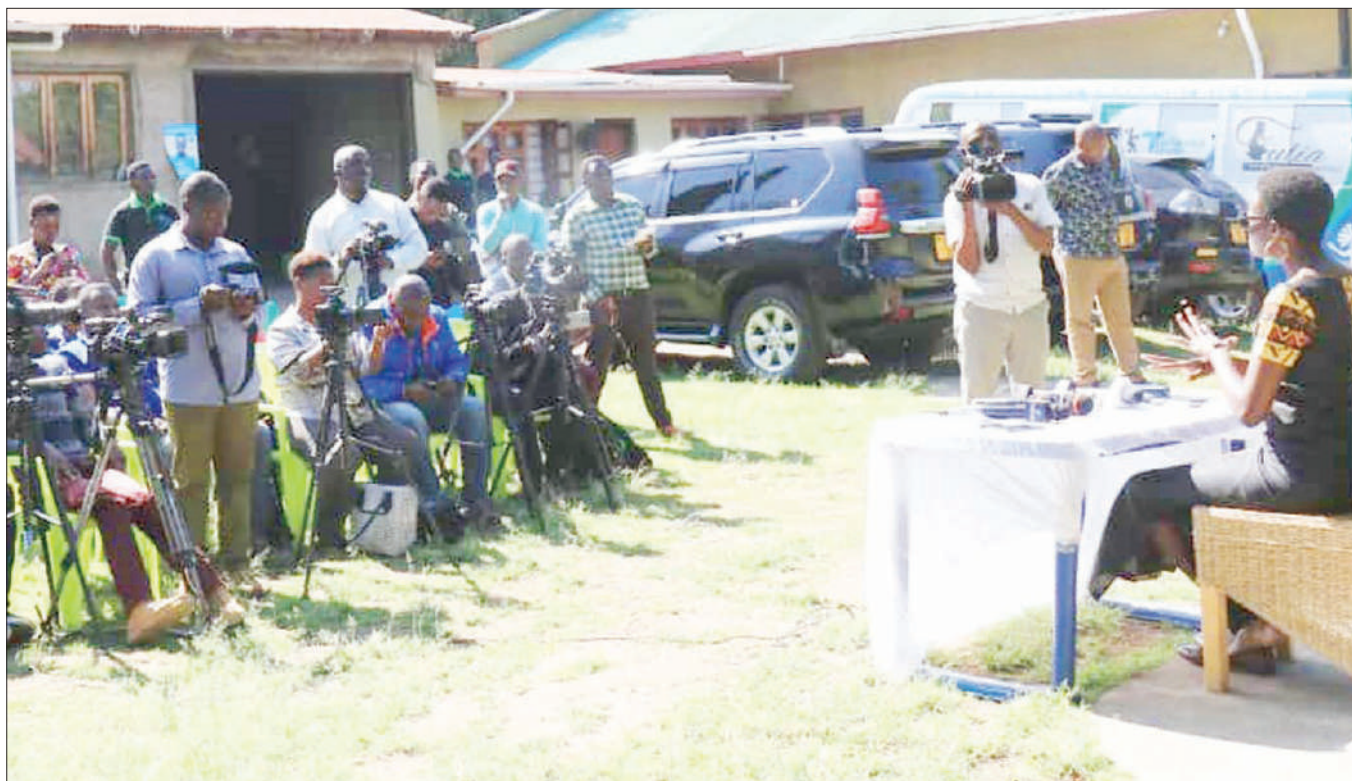
Mbunge wa Jimbo la Mbeya Mjini ambaye ni Naibu Spika wa Bunge la Jamhuri ya Muungano wa Tanzania, Dk. Tulia Akson (kulia), akizungumza na waandishi wa habari juzi, kuhusu mambo mbalimbali ikiwamo kuanza utekelezaji wa ahadi alizoahidi wakati wa kampeni.

Baadhi ya vijana waliohudhuria makabidhiano hayo, walihidhi kufuata nyayo za mdau huyo wa maendeleo kwa kufanya kazi kwa bidii ili na wao wajikwamue kiuchumi.