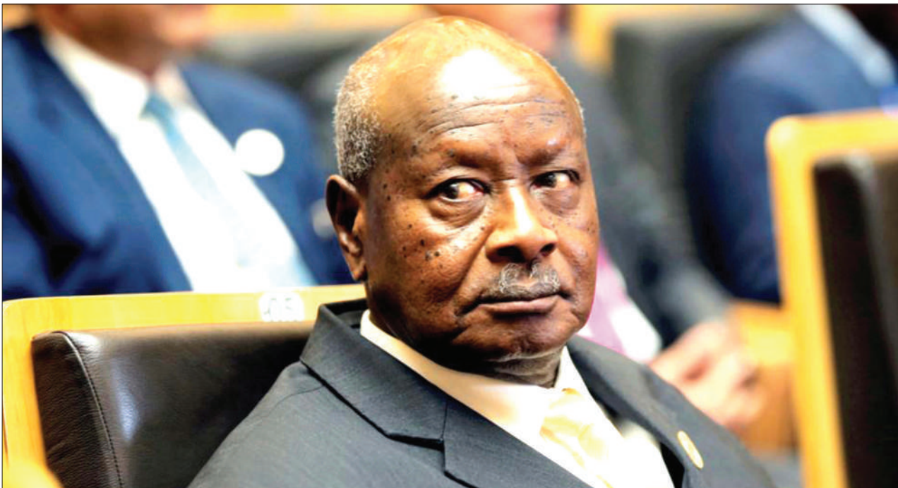
Rais wa Uganda, Yoweri Museveni, ambaye vyombo vya habari nchini humo vilimgomea kurusha hotuba yake.