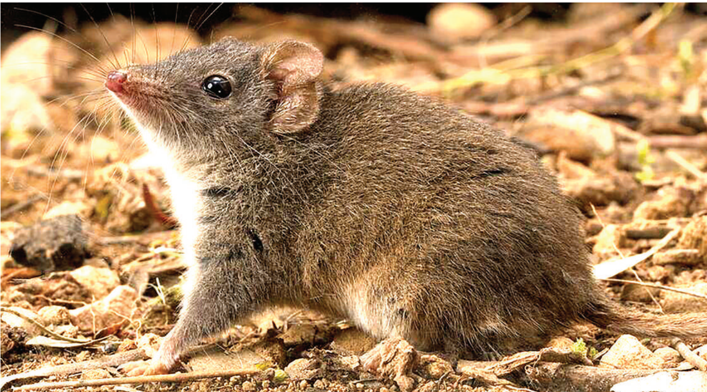
Wanyama hawa hufa kwenye uzazi. Huitwa wanyama kwa vile viumbe hai huundwa na makundi mawili mimea na wanyama.

K UPATA mwenza unayemtaka si jambo jepesi kwa kuwa hata kwa wanyama wengi hupoteza uhai pale tu wanapokutana na wale wawapendao na wa muhimu kwao.