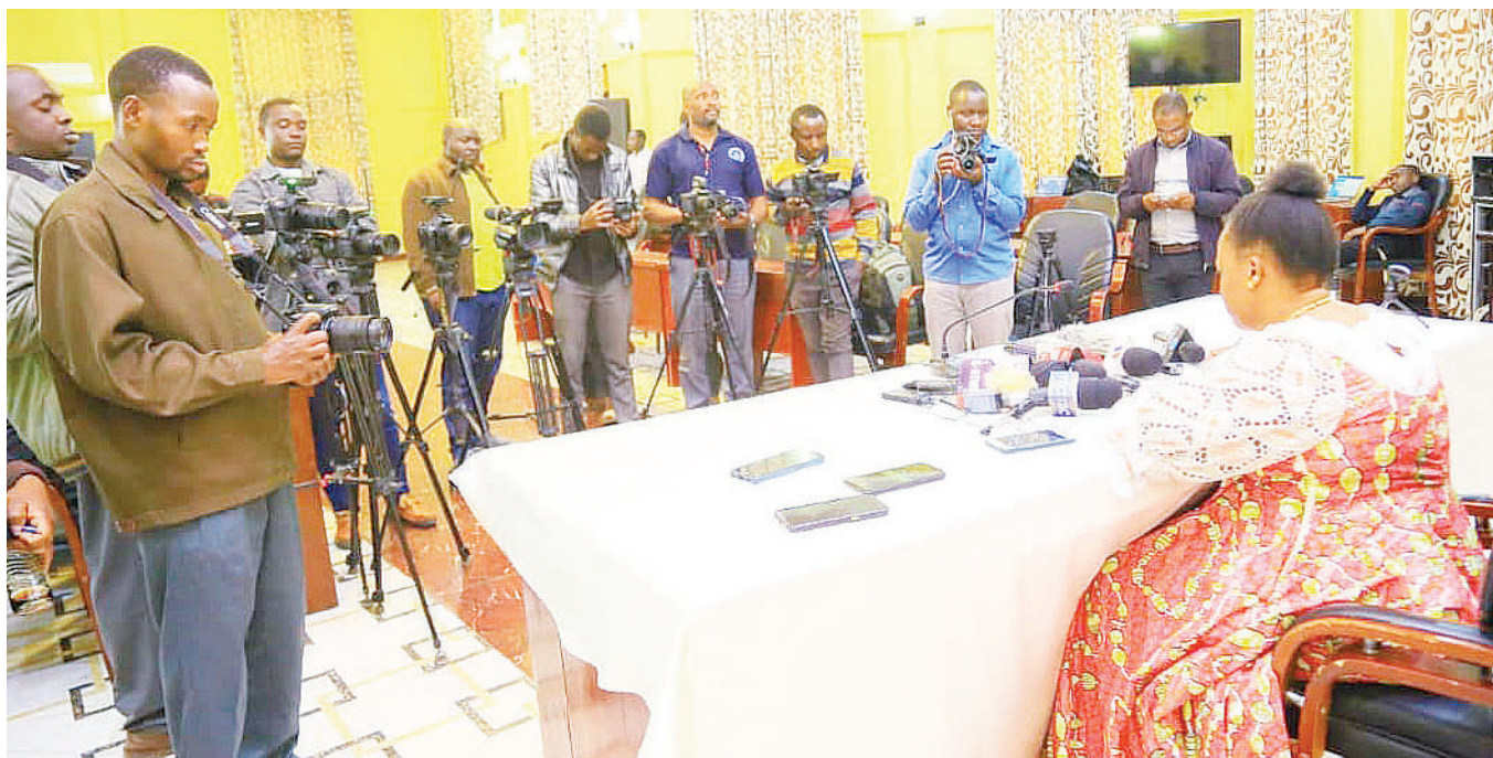
Naibu Waziri wa Maji, Maryprisca Mahundi, akizungumza na waandishi wa habari juzi kuhusu mpango wake wa kushirikiana na Hospitali ya Rufani ya Mkoa wa Mbeya kuwafanyia upasuaji wa mtoto wa jicho wananchi wenye tatizo hilo.

Alisema NIC kwa muda mrefu linajendesha kama kinara katika soko la huduma za hisa nchini, likihudumia mahitaji ya wateja kwa kuwapatia huduma tofauti za bima ambazo zinalinda maisha, mali, na biashara zao.