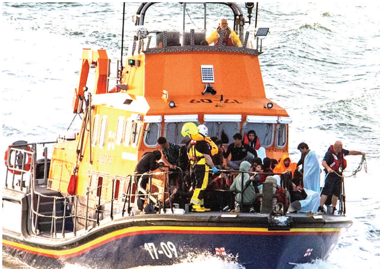
Wafanyakazi wa uokoaji wakiwapeleka wahamiaji ufukweni, baada ya boti iliyokuwa imewabeba kutoka Ufaransa kuzama katika njia ya maji Dover, Uingereza juu.