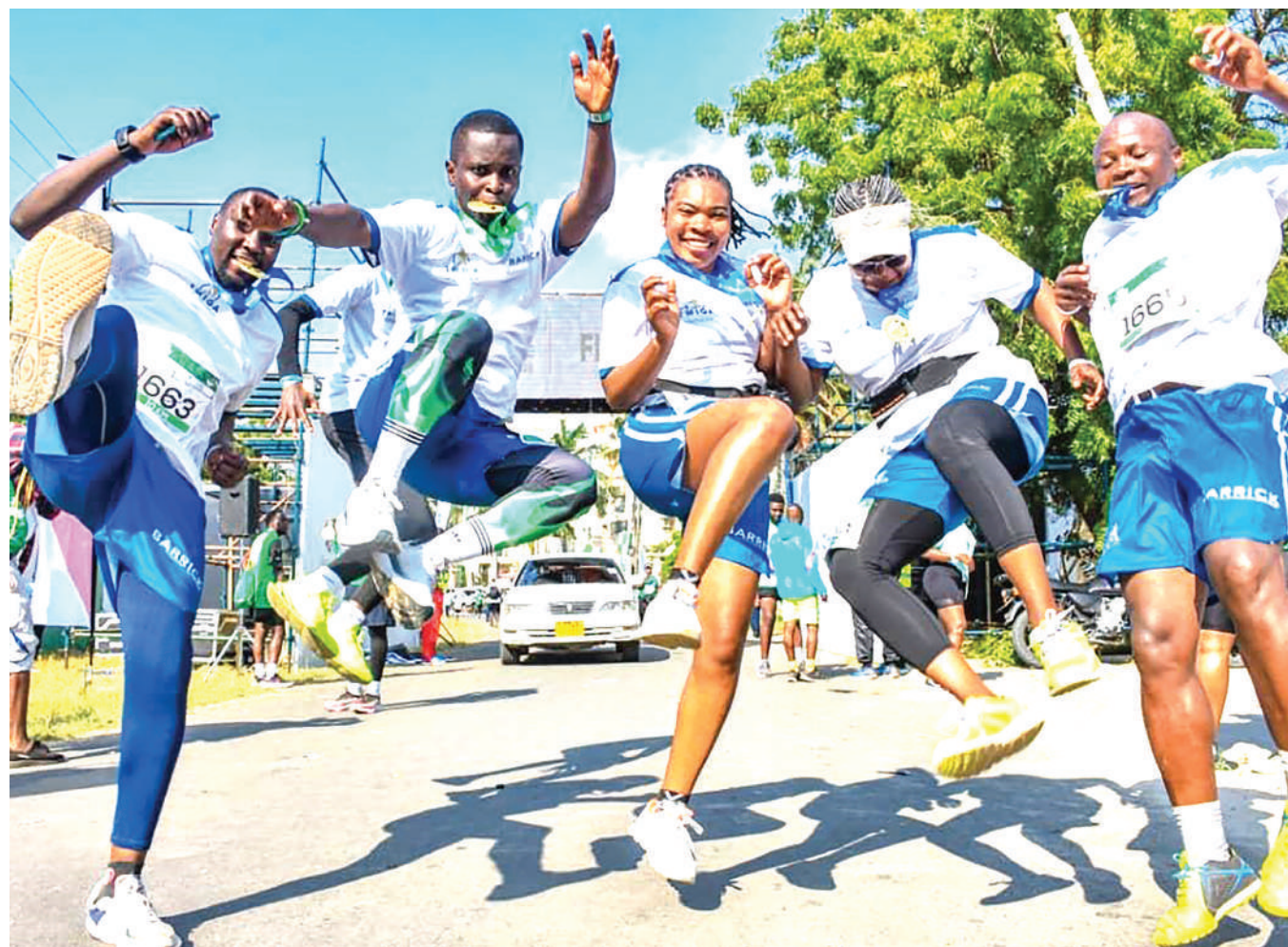
Baadhi ya Wafanyakazi wa Kampuni ya Barrick nchini wakishiriki mbio za riadha za CRDB Marathon zilizofanyika jijini Dar es Salaam mwishoni mwa wiki.