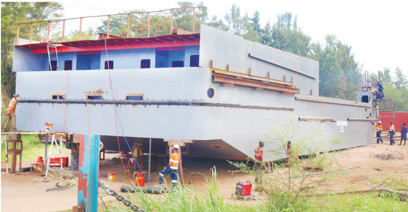
Mafundi wakiendelea na ujenzi wa kivuko kipya cha Ijinga-Kahangala kinachojengwa katika karakana ya Songoro Marine iliyoko Ilemela mkoani Mwanza, kimegharimu Sh. bilioni 5.2 kitakapokamilika kitatoa huduma Ijinga na Kahangala wilayani Magu mkoani Mwanza.