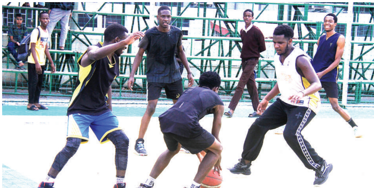
Wachezaji wa timu ya mpira wa kikapu ya Dynamos wakifanya mazoezi maalum ili kujiimarisha kwenye Uwanja wa JMK Park, Dar es Salaam jana.

JKT Queens itashuka tena dimbani kesho kucheza mechi ya pili dhidi ya New Generation FC ya Zanzibar ambayo juzi ilipata kichapo cha mabao 3-1 kutoka kwa Vihiga Queens ya Kenya.