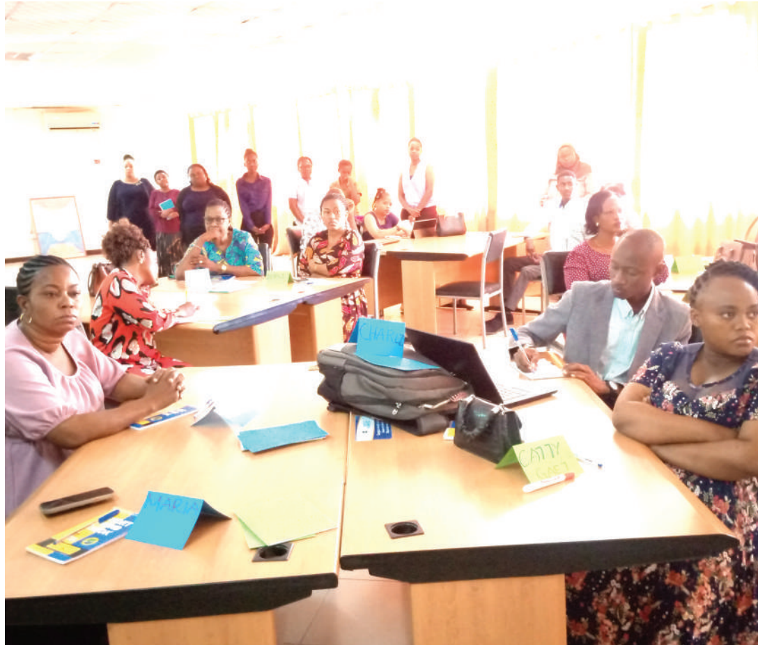
Baadhi ya viongozi wa asasi za kiraia wakiwa katika mafunzo ya kufuatilia bajeti.

gozo na mbinu bora za ufuatiliaji na uwajibikaji jamii kwa mtazamo wa kijinsia, kubadilishana uzoefu kwa ajili ya kuimarisha usawa wa kijinsia," anasema.