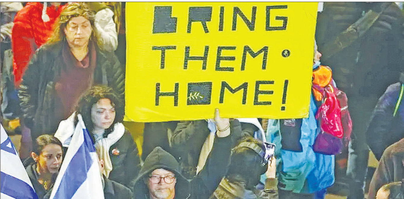
Wananchi mbalimbali wa Israel wakishinikiza serikali ya nchini humo kuharakisha jitihada za kuwarudisha mateka waliowekwa kizuizini na kundi la Hamas huko Gaza.

Wakati hayo yakiendelea, bado inabakia kusubiriwa ni hatua gani zaidi zitachukuliwa na matokeo gani balozi huyo atakabiliana nayo, huku ikielezwa kuwa tukio hilo limeacha doa kwa sifa ya kidiplomasia ya Zambia na kuibua maswali juu ya mwenendo wa wawakilishi wake nje ya nchi.