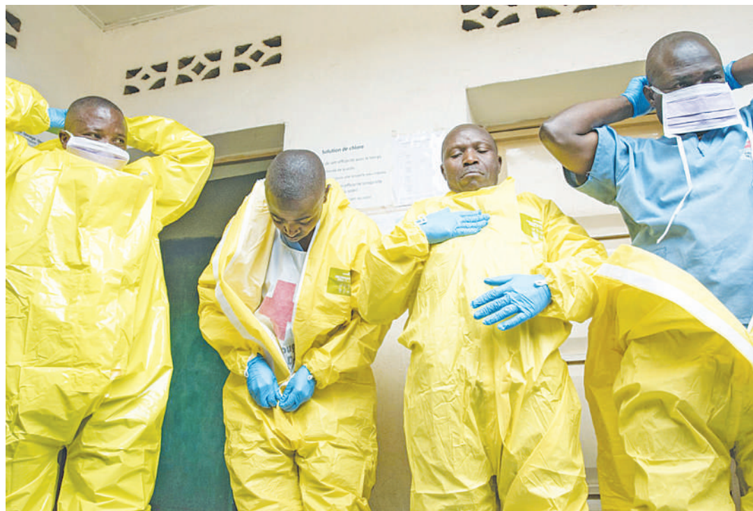
Matabibu katika harakati za kupambana na magonjwa ya virusi.

Anaongeza kuwa: "Magonjwa yanaonekana kuwa mabaya zaidi