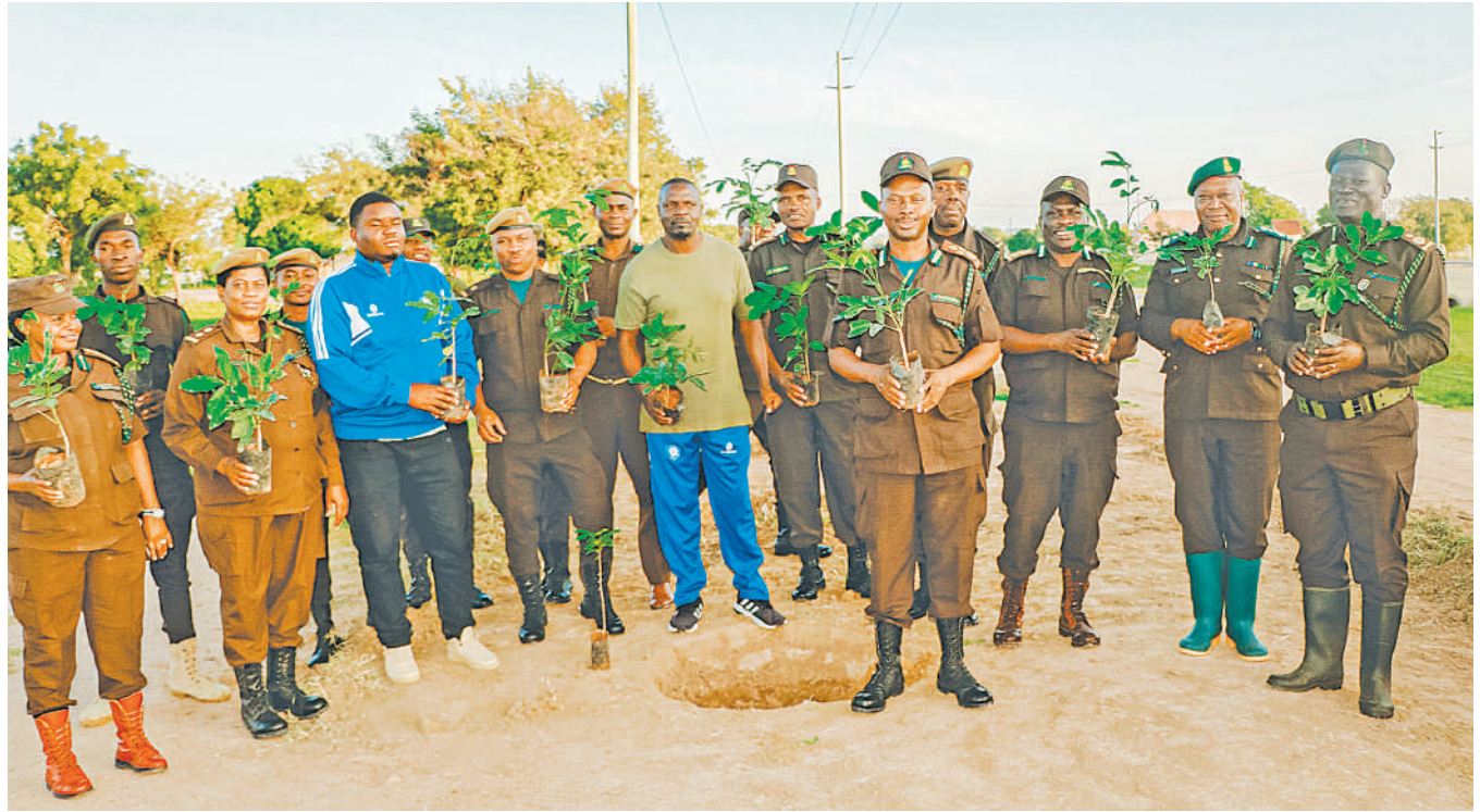
Kamishna Msaidizi Mwandamizi wa Jeshi la Magereza kutoka Ofisi ya Kilimo, Ufugaji na Utunzaji Mazingira, Daimu Mmolosho (wa nne kulia), akiwa na maofisa wengine wameshika miti tayari kwa ajili ya upandaji katika kata ya Msalato, Dodoma jana, jumla ya miti 1,500 ilipandwa.

"Mpaka sasa tumeshaweka zaidi ya vigingi 1,100 katika maeneo mbalimbali ya hifadhi," alisema Kagoma.