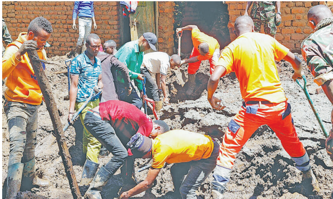
Waokoaji wakitafuta miili kwenye matope ya mafuriko na maporomoko ya udongo Hanang Desemba 2023.

Halikadhalika, mahitaji ya mazao ya misitu mathalani mbaao, nguzo, mkaa na kuni yakoongezeka kasi yake ikichochea