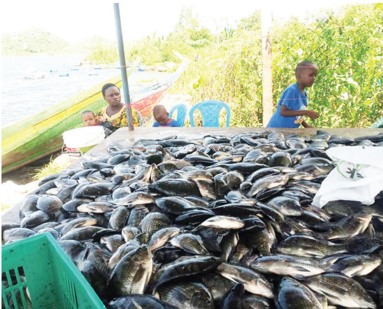
Mkazi wa jijini Mwanza akikusanya samaki aina ya sato ili kuwaandaa kwa ajili ya kuwauza jana, baada ya kuwavuna kwa njia ya kisasa ya vizimba inayotumiwa ndani ya Ziwa Victoria.