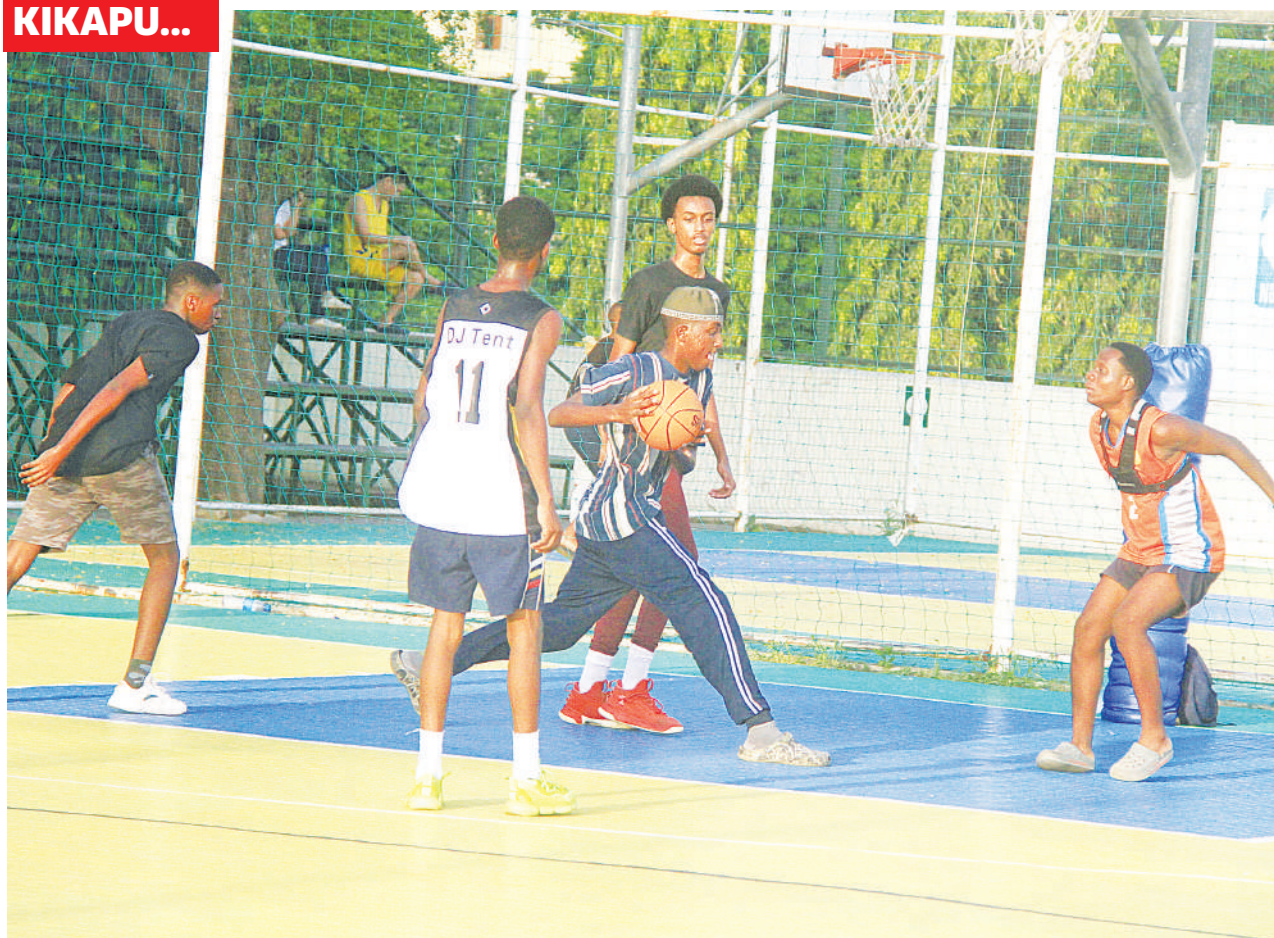
Vijana wakifanya mazoezi ya mpira wa kikapu katika Uwanja wa Kituo cha Michezo cha Jakaya Kikwete jijini Dar es Salaam jana.