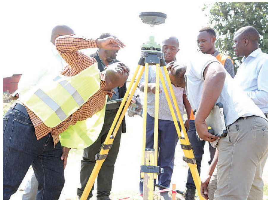
Wataalamu kutoka Chuo cha Ardhi Morogoro (ARIMO) wakiwa katika mataayarisho ya awali ya kazi ya urasimishaji makazi holela katika Mji Mdogo wa Mbalizi mkoani Mbeya mwishoni mwa wiki.