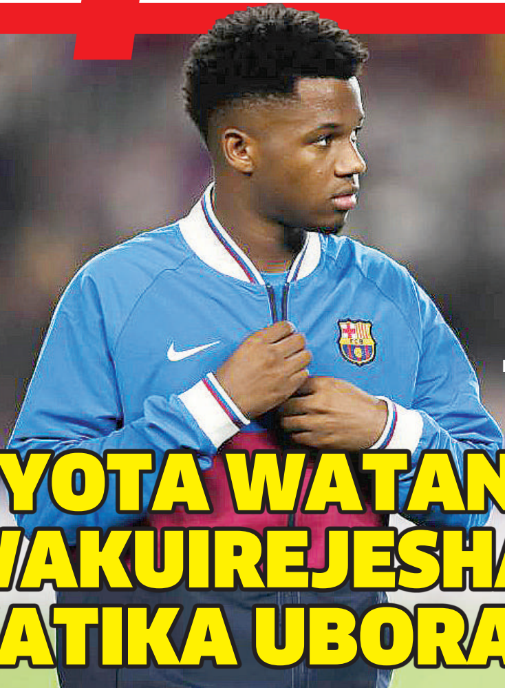
FATI NA GAVI

VIUNGO WA KATI 10 BORA MWAKA 2021 UK. 12 - 13