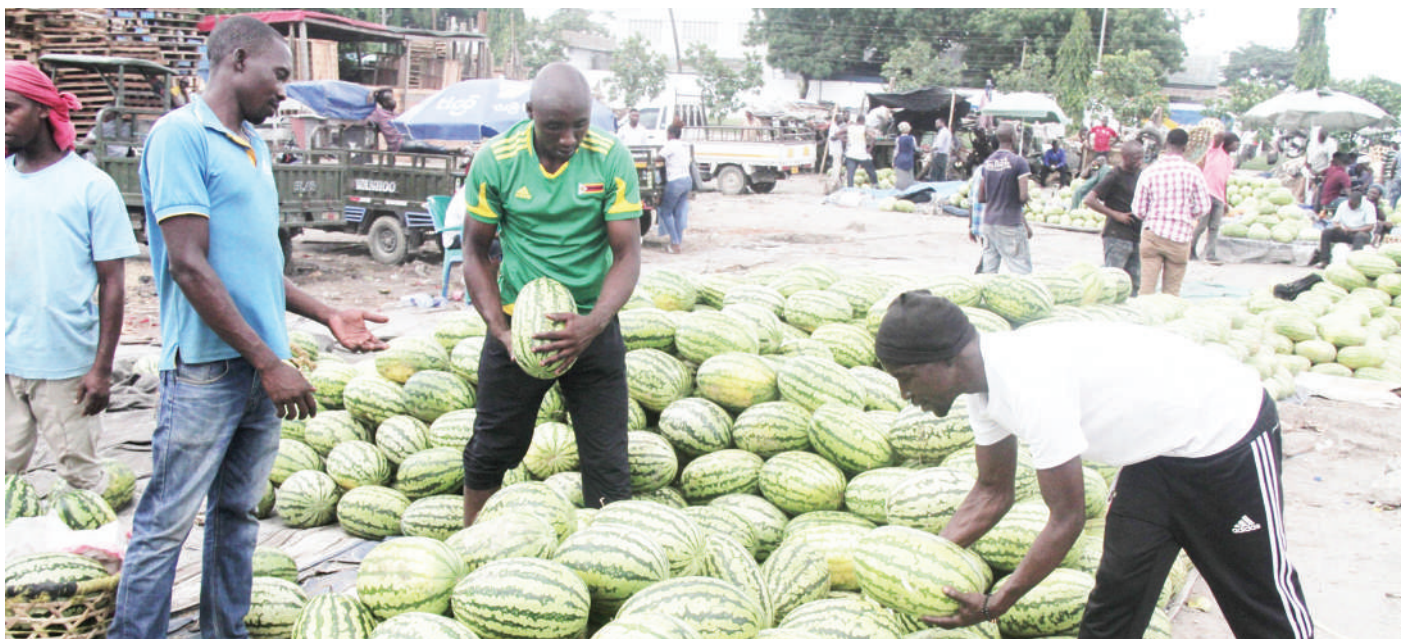
Wateja wakichagua matikiti maji katika Soko la Vetinari jijini Dar es Salaam jana, tikiti moja liliuzwa kwa Sh. 2,000 hadi Sh. 5,000 kwa bei ya jumla.

“Kazi hizi za awali zikamilika tunatarajia kuingia uwandani Januari 10, mwaka 2022 na kwa hivi sasa pamoja na maandalizi mengine pia tumeanza kuandaa vilingi na timu imesambaa kila eneo kuhakikisha tunaratibu vizuri maana nina imani tukianza vizuri tutamaliza vizuri,” alisema Majogolo.