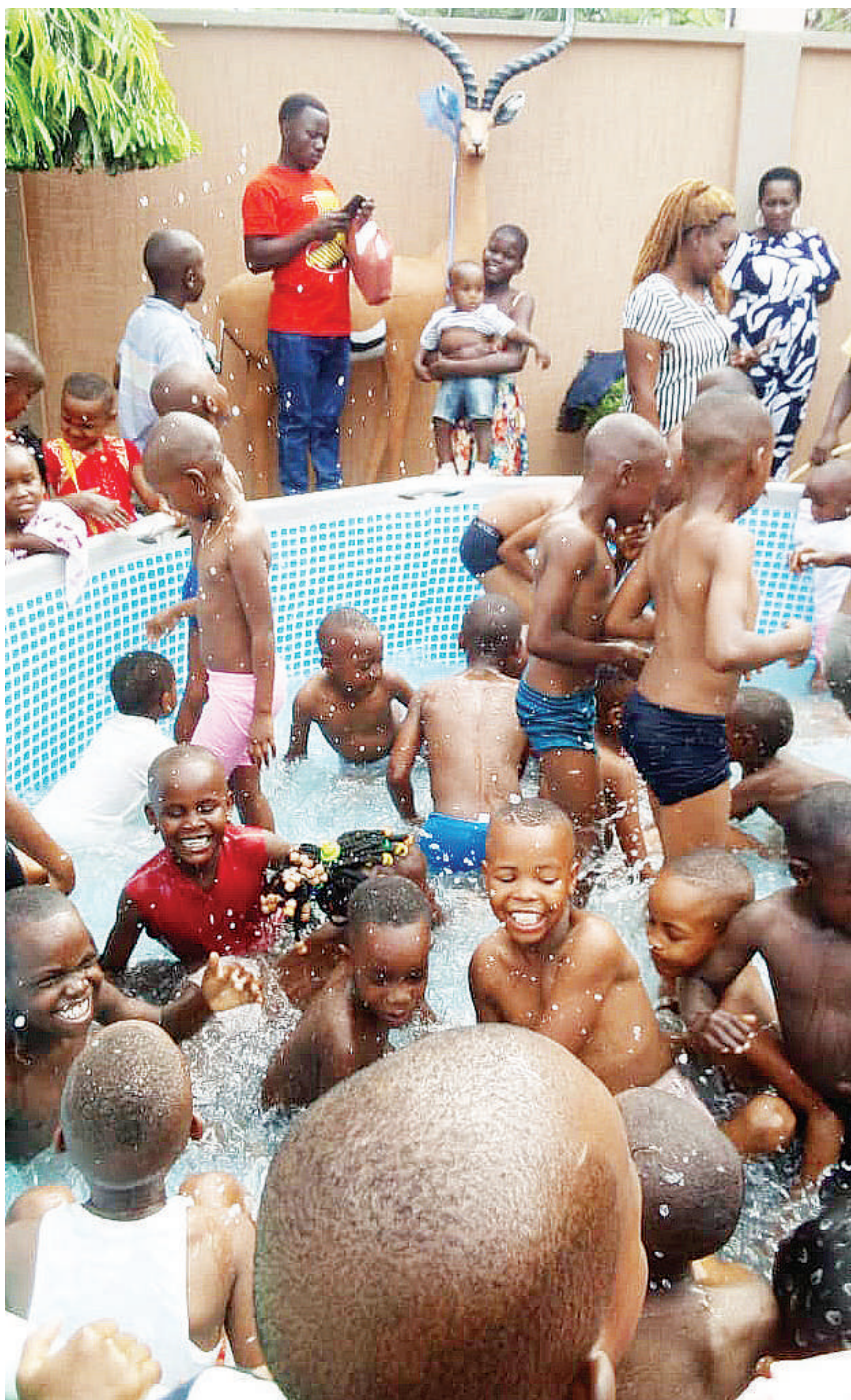
Watoto wa Mji Mdogo wa Mirerani wilayani Simanjiro mkoani Manyara, wakisherehekea sikukuu ya Mwaka Mpya 2022 kwenye bwawa la kuogelea lililopo Mazubu Grand Hotel juzi.