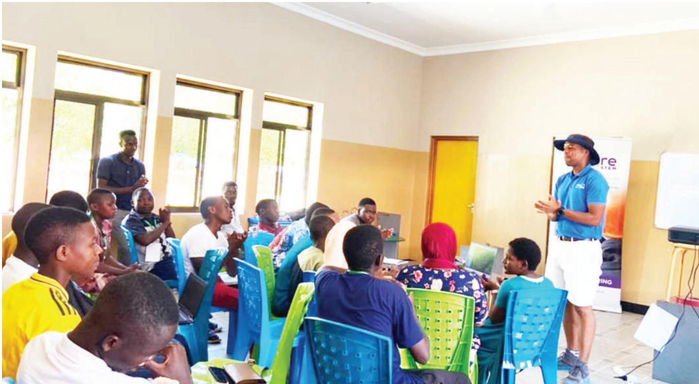
Wanafunzi wa darasa la uhandisi kwenye kempu ya Boot inayoendelea katika Kituo cha Sayansi Kisosora wakijifunza jinsi ya kuchukua data kwa 'drone' na kuziingiza kwenye mfumo wa GIS. Wanafunzi hao wametengeneza 'appu' ya simu ambayo inaonyesha vituo vya afya vya Jiji la Tanga, na huduma zitolewazo maeneo husika.