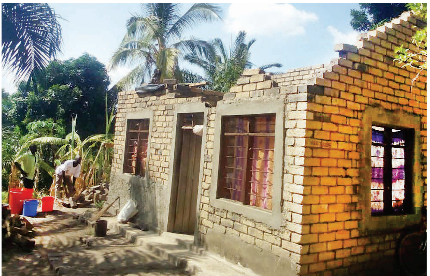
Moja ya nyumba 21 za wakazi wa Halmashauri ya Mlimba Wilaya ya Kilombero mkoani Morogoro ikiwa imezuliwa na upepo ulioambatana na mvua kubwa iliyonyesha mwishoni mwa wiki.

Nyumba zaezuliwa, zaidi ya 100 wakosa makazi