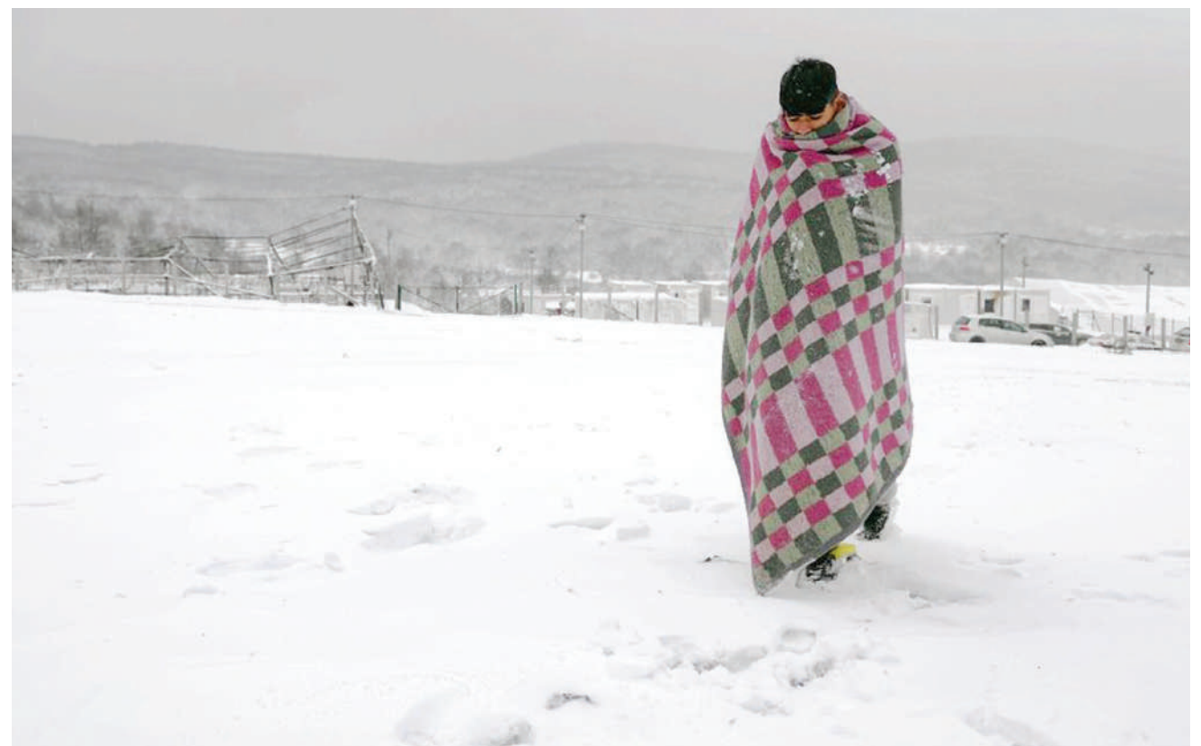
Mhamiaji akitembea kwenye theluji huku amejifunika blanketi katika kambi ya Lipa Kaskazini Magharibi mwa Bosnia, karibu na mpaka na Croatia, mwishoni mwa wiki. Mamia ya wahamiaji wanakumbwa na baridi huku theluji nzito ikianguka ikiwa ni majira ya baridi na hali mbaya ya hewa.

Alisema ujumbe; uwezo wa kujikinga uongezwe ili dunia ikabiliane na mlipuko mwingine. UN