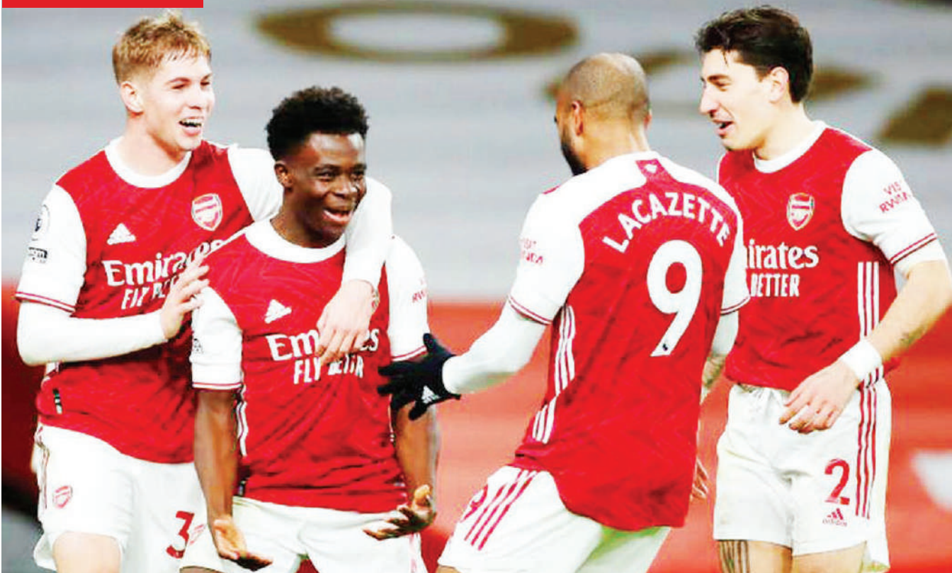
Bukayo Saka (wa pili kushoto) akipongezwa na wachezaji wenzake wa Arsenal baada ya kuifungua timu yake bao la tatu wakati ikishinda 3-1 dhidi ya Chelsea kwenye mechi ya Ligi Kuu England iliyopigwa Uwanja wa Emirates juzi.