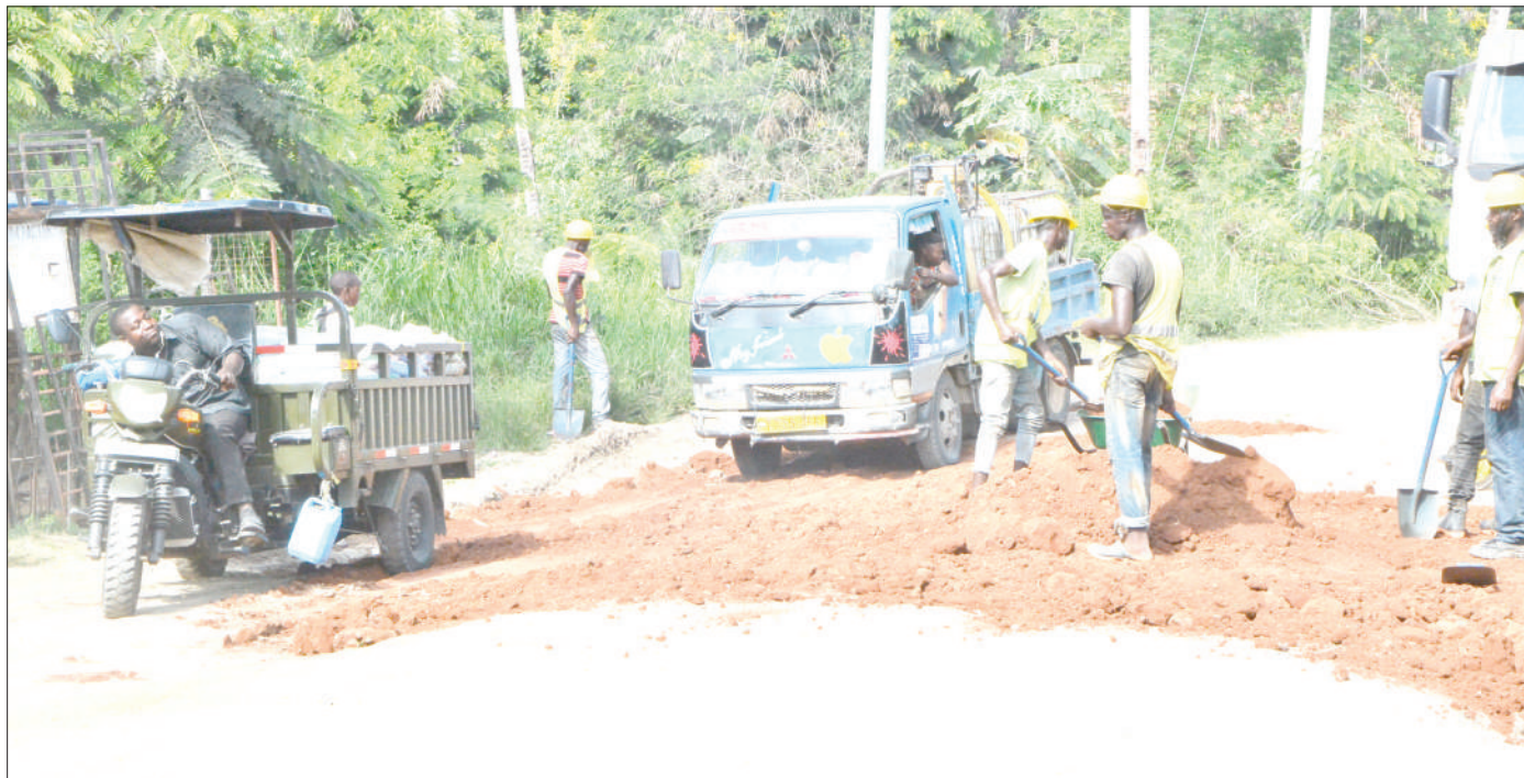
Wafanyakazi wa kampuni ya ujenzi ya Hainan wakijaza kifusi sehemu ambazo zimeharibika, katika barabara ya Goba Tegeta A, jijini Dar es Salaam jana.

"Tumepewa eneo lingine na Dodoma kwa ajili ya kulitunza sababu kubwa ni viongozi wameona jinsi ambavyo tunaifanya Dodoma inakuwa ya kijani, kikubwa ni kufanya kazi fursa zitakuja," alisema.