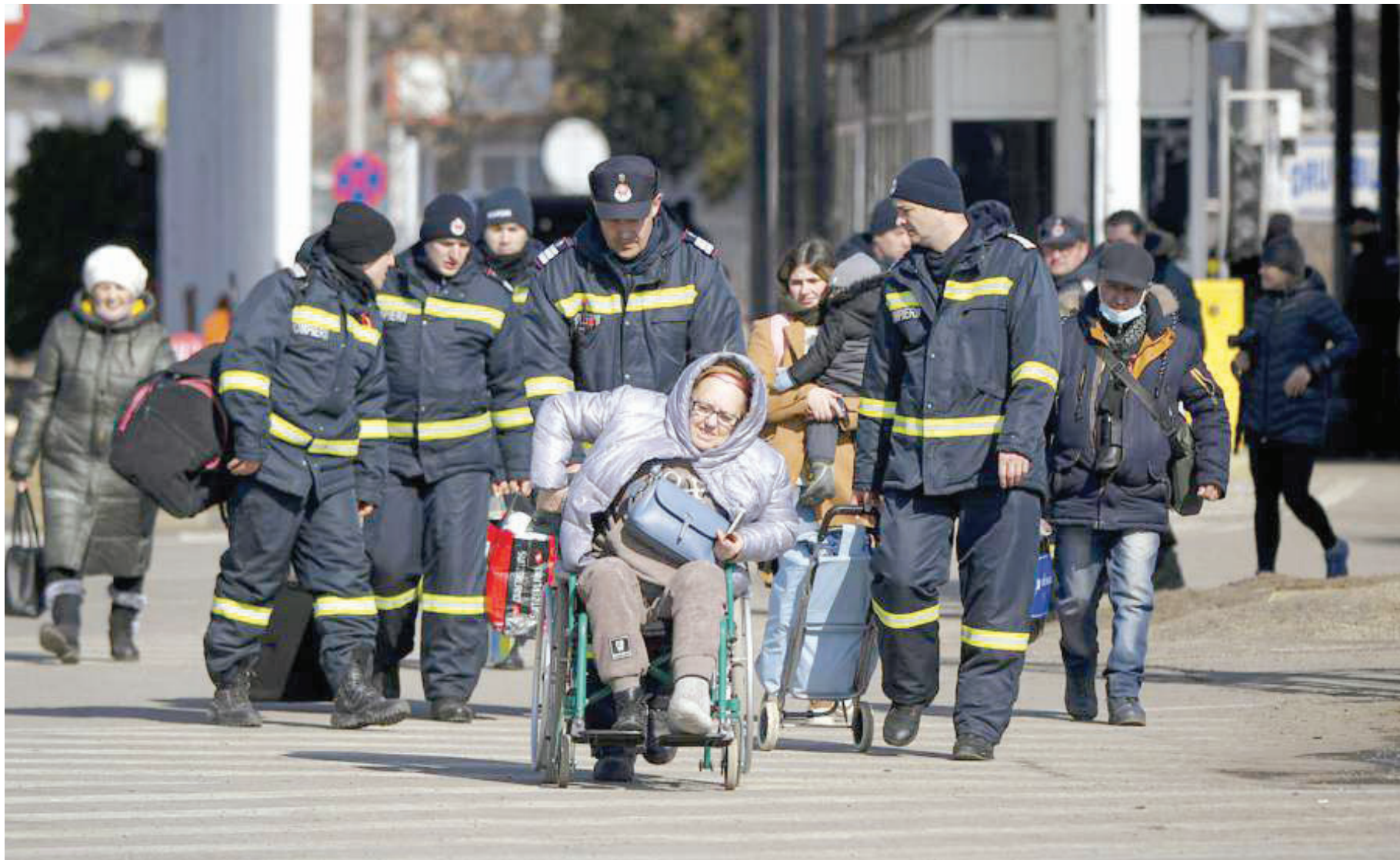
Kikosi cha Zimamoto kikimsaidia mkimbizi nchini Ukraine kuelekea nchi jirani kwenye mpaka wa Romania -Ukraine, eneo la Siret, jana.

• Russia yakanusha kuomba msaada wa kijeshi China