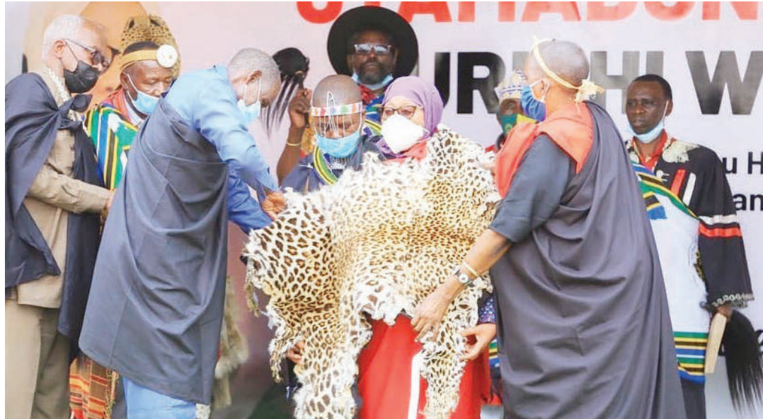
Rais Samia Suluhu Hassan alipotawazwa na kupewa jina la Chifu Hangaya.

Na jingine ni ombi la wahariri wanaopendekeza kuihamishia Idara ya Habari kwenda Wizara ya Teknolojia ya Habari na Mawasiliano. Awali Idara ya Habari ilikuwa kwenye Wizara ya Utamaduni, Sanaa na Michezo, wana-habari wakiona kuwa pengine hapo hapakuwa mahala pake, Rais aliridhia ombi na ushauri huo wa wana-habari, alipouona unafaa kwa maendeleo ya taifa, aliihamisha na