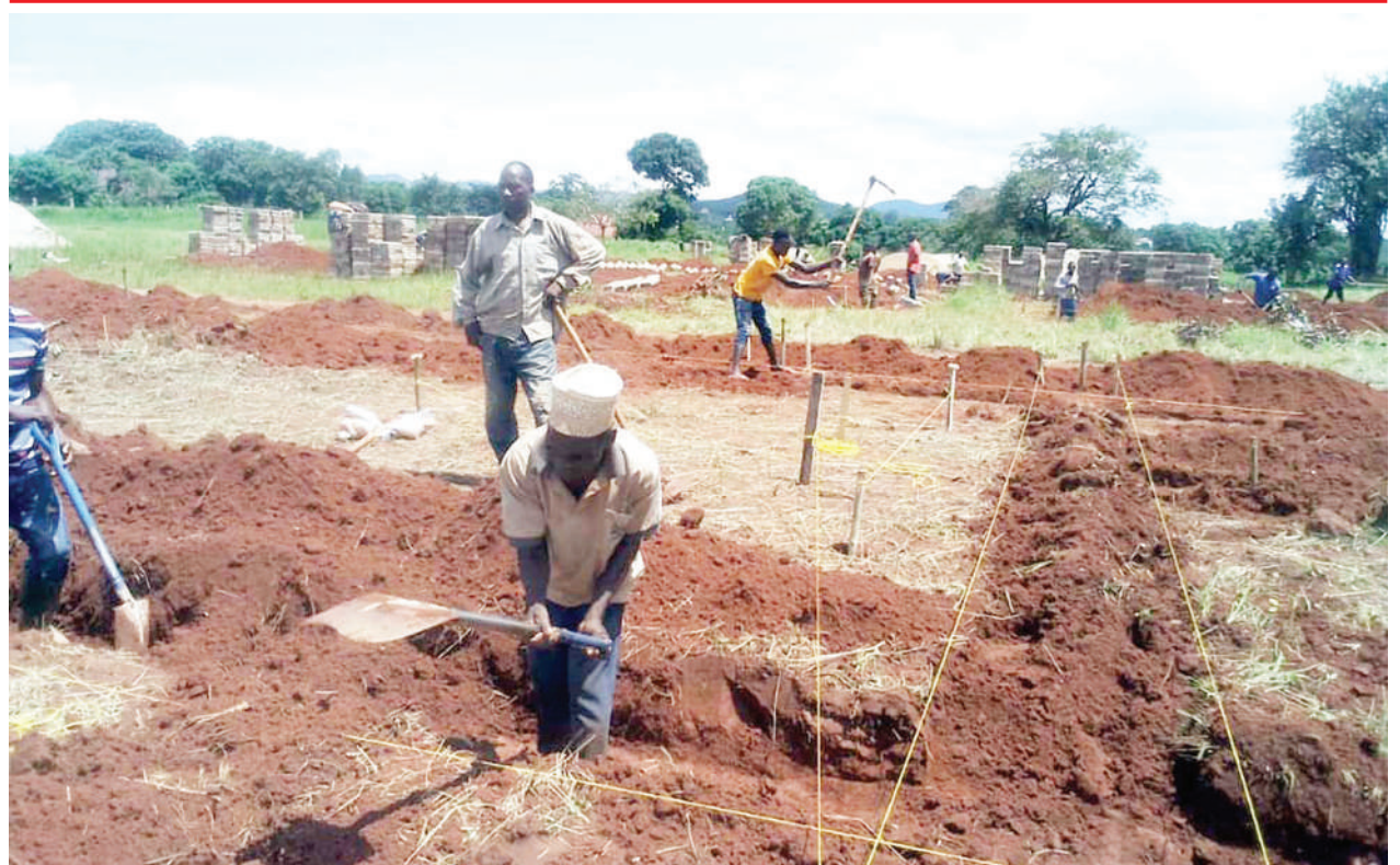
Mafundi wakichimba msingi ikiwa ni maandalizi ya ujenzi wa Shule ya Sekondari Mshangano inayojengwa katika Mtaa wa Namanyigu, Kata ya Mshangano, Manispaa ya Songea mkoani Ruvuma juu.

Mshtakiwa yuko nje kwa dhamana yenye masharti ya kuwa na wadhambi wawili waliokuwa na barua zinazotambulika kisheria na walisaini dhamana ya maandishi ya shilingi milioni moja.