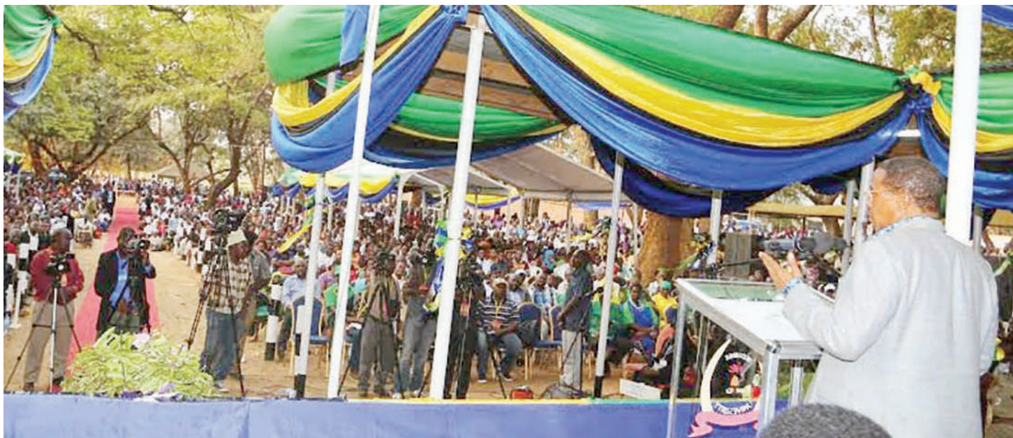
Wanafunzi wa Chuo Kikuu Mzumbe, walipokusanyika kumsikia Rais Jakaya Kikwete (sasa mstaafu), alipozuru chuoni hapo.

• Ahueni; yafutwa riba asilimia 15 • Kigezo kipya; kila aliyejiunga chuo