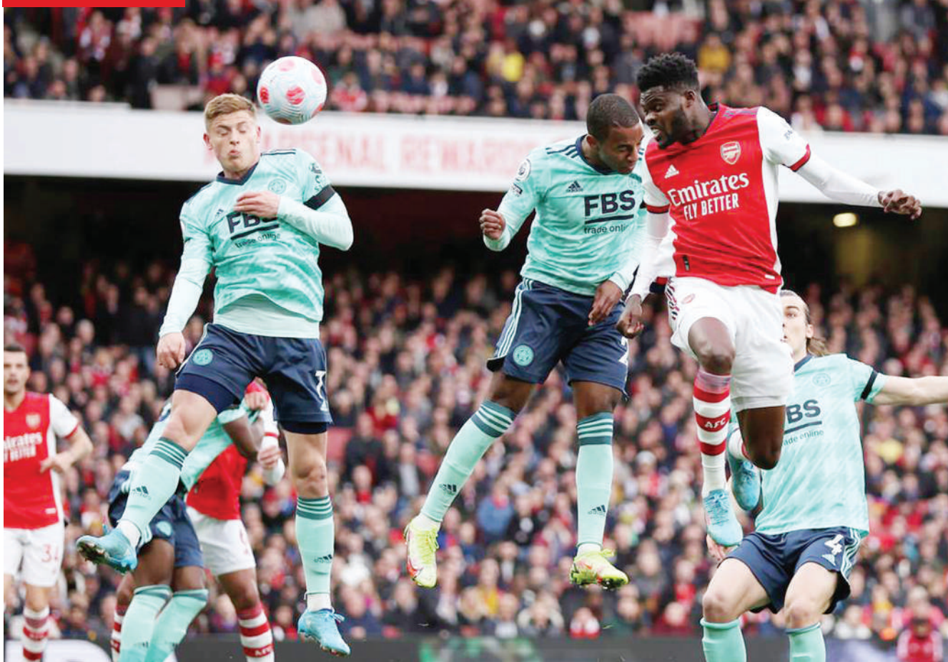
Kiungo wa Arsenal, Mghana Thomas Partey (jezi nyekundu), akiifungia timu yake bao la kwanza kwa kichwa wakati wakiibuka na ushindi wa mabao 2-0 dhidi ya Leicester City kwenye mechi ya Ligi Kuu England iliyopigwa Uwanja wa Emirates juzi.