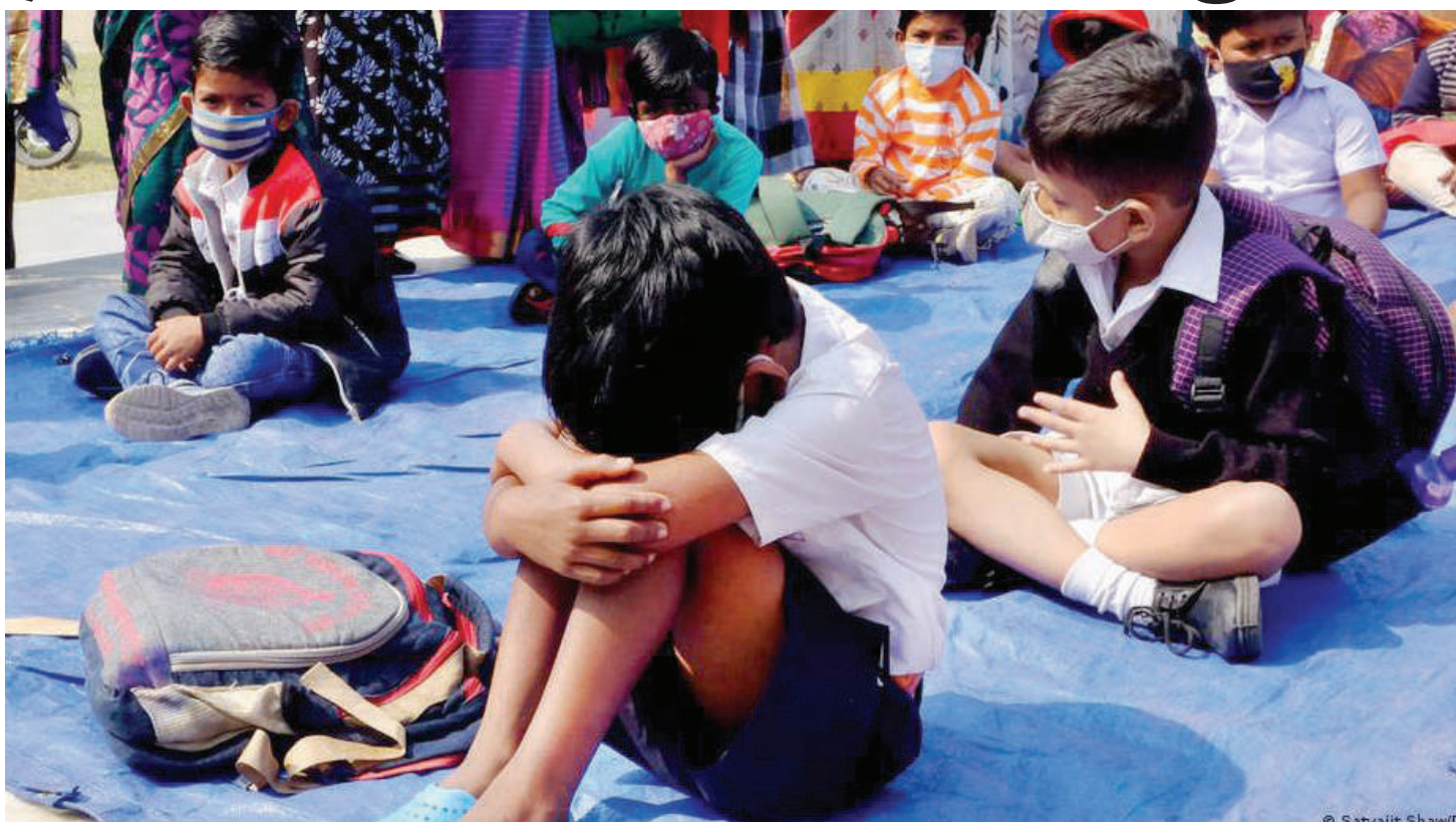
Baadhi ya wanafunzi wa nchini India, wanaosomea nje ya darasa kukabili hatari ya maambukizi ya corona.

Wakati dunia inaingia katika mwaka wa tatu wa janga hilo kidunia, mwanya wa ukosefu wa usawa umezidi kupanuka na mfano hai ni katika usambazaji wa chanjo dhidi ya virusi vya corona.