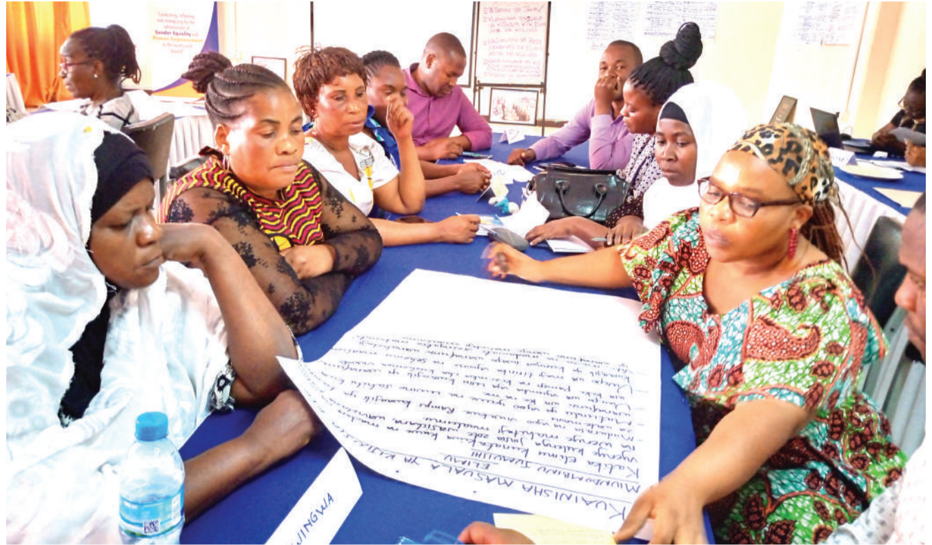
Baadhi ya wajumbe wa bodi na kamati za elimu, afya na kilimo, kutoka mikoa mbalimbali, wakiwa katika vikundi vya kujadili na kuainisha changamoto kwenye bodi na kamati hizo, katika warsha ya siku tatu ya kuwezesha majadiliano ya uchechemuzi iliyondaliwa na Mtandao wa Jinsia Tanzania (TGNP), Mabibo Dar es Salaam juzi.

Alisema Shirika la Fedha Duniani (IMF) limetabiri kwamba China itachangia asilimia 34.9 katika uchumi wa dunia.