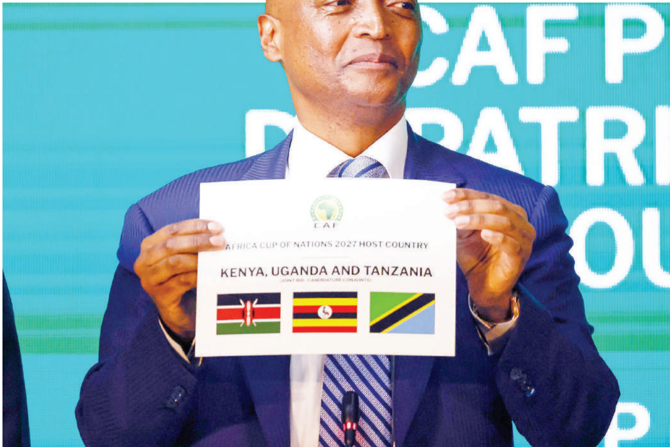
Rais wa Shirikisho la soka Afrika (CAF) Patrice Motsepe akiwa ameshika karatasi maalum inayozionyesha nchi za Kenya, Uganda na Tanzania kuwa wenyeji wa Fainali za Afcon mwaka 2027 baada ya kutangazwa rasmi jana jijini Cairo, Misri.