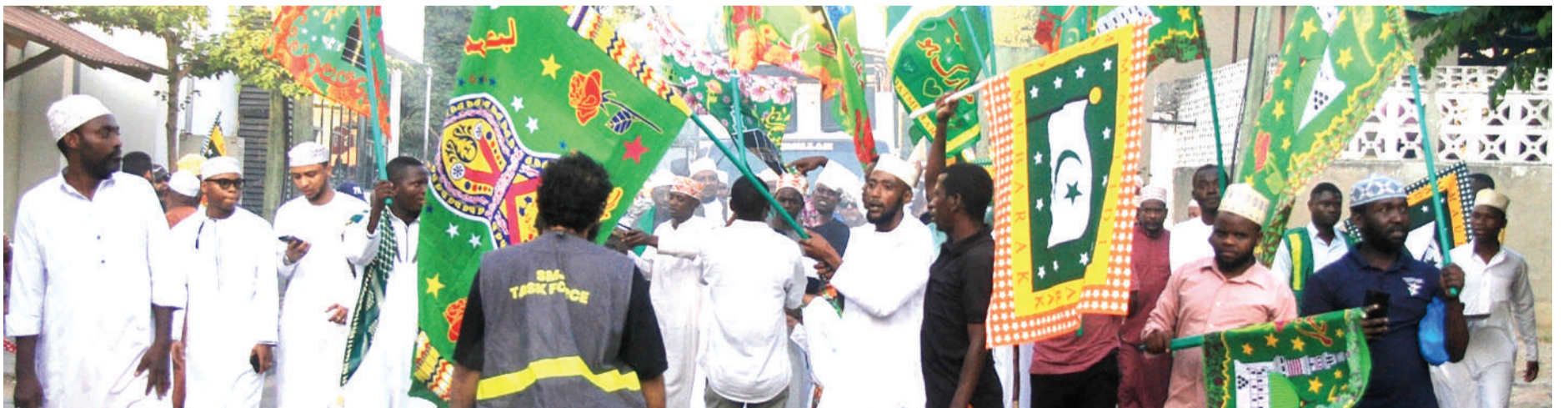
Waumini wa dini ya Kiislamu wakiwa katika maandamano ya kumbukumbu ya kuzaliwa kwa Mtume Muhammad (S.A.W), Dar es Salaam juzi jioni.