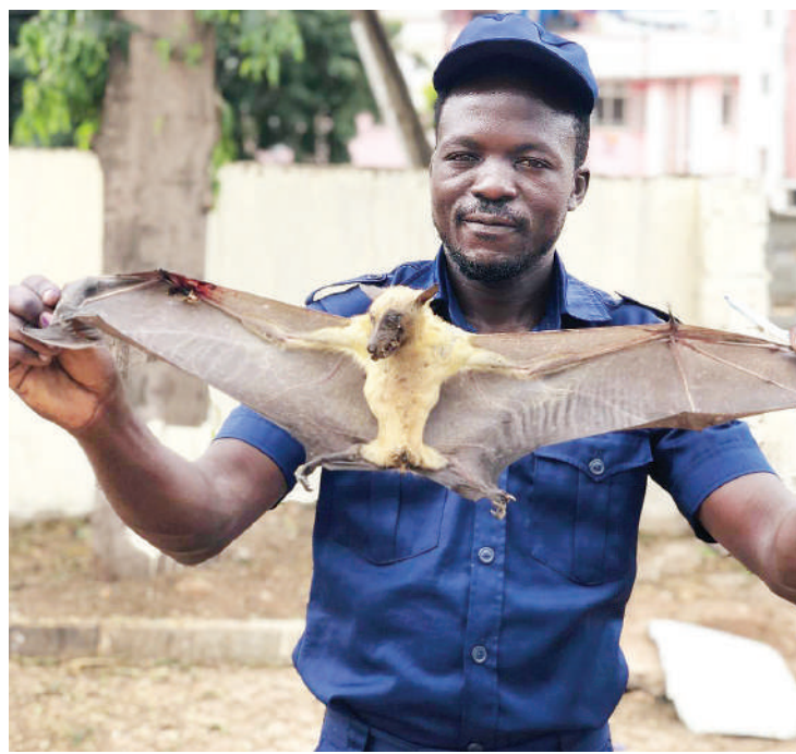
Popo akiwa ameshikiliwa.

Kwa mantiki hiyo ni kwamba, makundi tu hayo mawili, la jamii ya panya na popo wanatengeneza zaidi ya asilimia 60, waliopo kwenye kundi la mamalia.