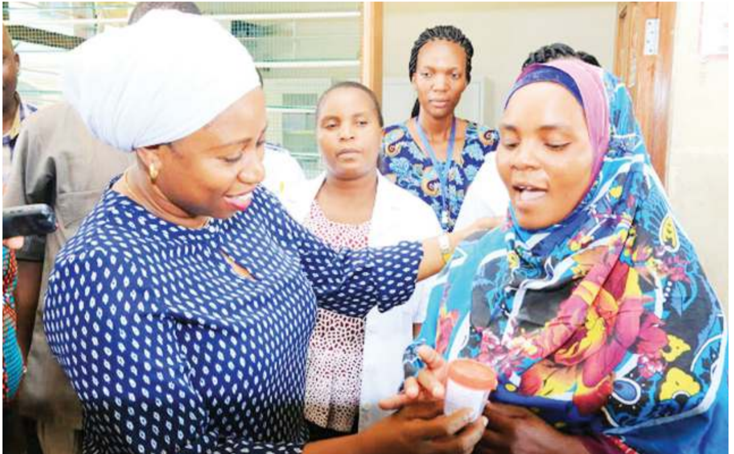
Waziri wa Afya, Maendeleo ya Jamii, Jinsia, Wazee na Watoto, Ummu Mwalimu (kushoto), akishiriki ugawaji dawa za TB, jijini Dar es Salaam.