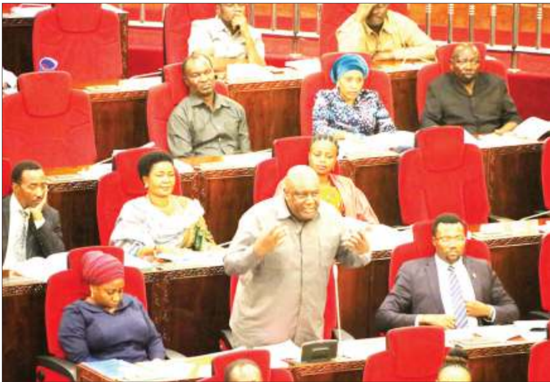
Waziri wa Mambo ya Ndani, Kangi Lugola akisisitiza kuhusu hatua zina-zochukuliwa na Serikali kushughulikia makosa ya jinai, ikiwemo kufanya uchunguzi dhidi ya tuhuma husika na kubaini ukweli, katika kikao cha Bunge, jijini Dodoma juzi.