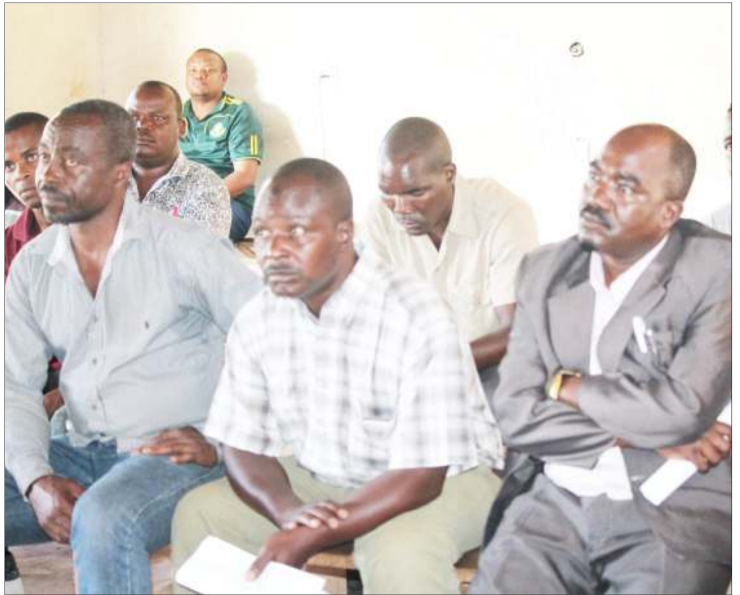
Wachimbaji wadogo wa madini katika Mji wa Mkwajuni, wilayani Songwe, wakisikiliza kwa makini mafunzo ya elimu ya afya na usalama kwenye migodi, yaliyotolewa na Wakala wa Usalama na Afya Mahali pa Kazi (OSHA), wilayani humo, mkoani Songwe jana.

Alisema Serikali inakabiliwa na changamoto ya mashamba ya kilimo cha vizazi mbegu nchini isipokuwa nyanda za juu kusini, hivyo uzalishaji wa mbegu nchini utakuwa mwarobaini na kwamba mbegu hizo zitakidhi mahitaji ya wakulima.