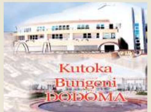
Habari zote na Augusta Njoji, DODOMA

"Hivyo, Tume ya Uchaguzi inatarajia kuhakiki tena majimbo ya uchaguzi wa ubunge katika Jamhuri ya Muungano wa Tanzania ikiwamo Zanzibar baada ya kutangaza kufanya hivyo kwa mujibu wa Katiba," alisema.