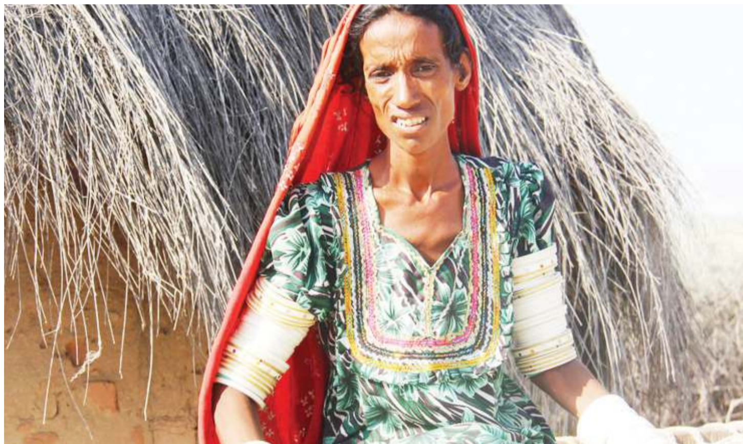
Raia wa Pakistani mwenye TB, aliyedumu miaka mitano bila ya kugundulika kuwa na ugonjwa huo, kutokana kushindwa kumudu Dola za Marekani mbili (Sh. 4,600) za usafiri kutoka kijijini kwake hadi hospitali ya serikali, mjini Tharparkar kupimwa afya.

S HIRIKA la Afya Duniani (WHO), linautaja ugonjwa wa Kifua Kikuu (TB), uko juu katika maambukizi na kuu duniani kote.