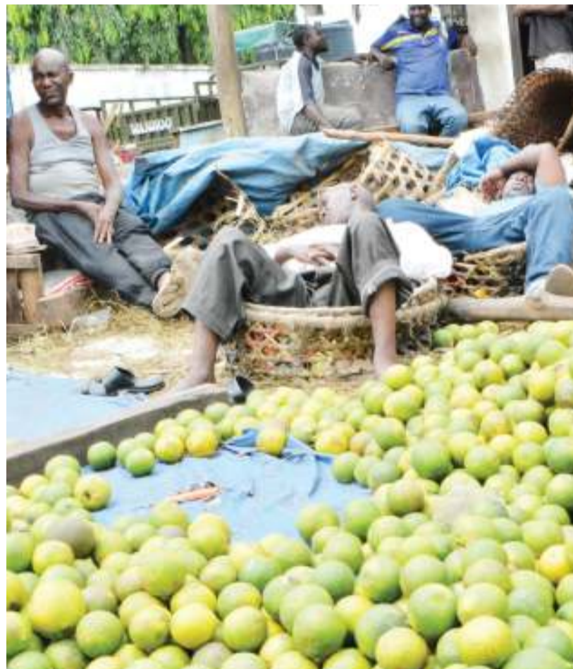
Wachuuzi wa machungwa wakiwa wamejipumzisha wakati wakisubiri wateja katika Soko la Buguruni, jijini Dar es Salaam jana.

Katika kesi ya msingi inadaiwa kuwa Julai 3, 2017 katika ofisi za makao makuu ya Chadema zilizopo Mtaa wa Ufipa wilayani Kinondoni, Mdee alitamka maneno dhidi ya Rais John Magufuli kuwa, 'anaongea ovyo, anatakiwa afungwe breki,' kitendo kinachodaiwa kuwa ni kumdhaliisha Rais na kusababisha uvunjifu wa amani.