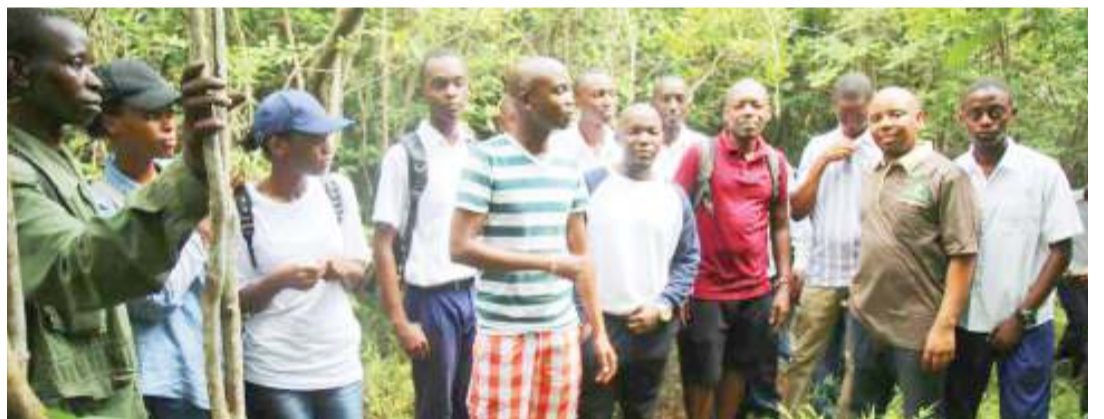
Wanafunzi waliotembelea Hifadhi ya Msitu wa Pugu, Dar es Salaam.

Ukiwa chini ya msitu wa mazingira asilia utakuwa chini ya uangalizi madhubuti. Haitoruhusiwa shughuli zozote za kibinadamu kufanyika ndani ya msitu huu, isipokuwa shughuli za kitafiti, elimu na ikolojia.