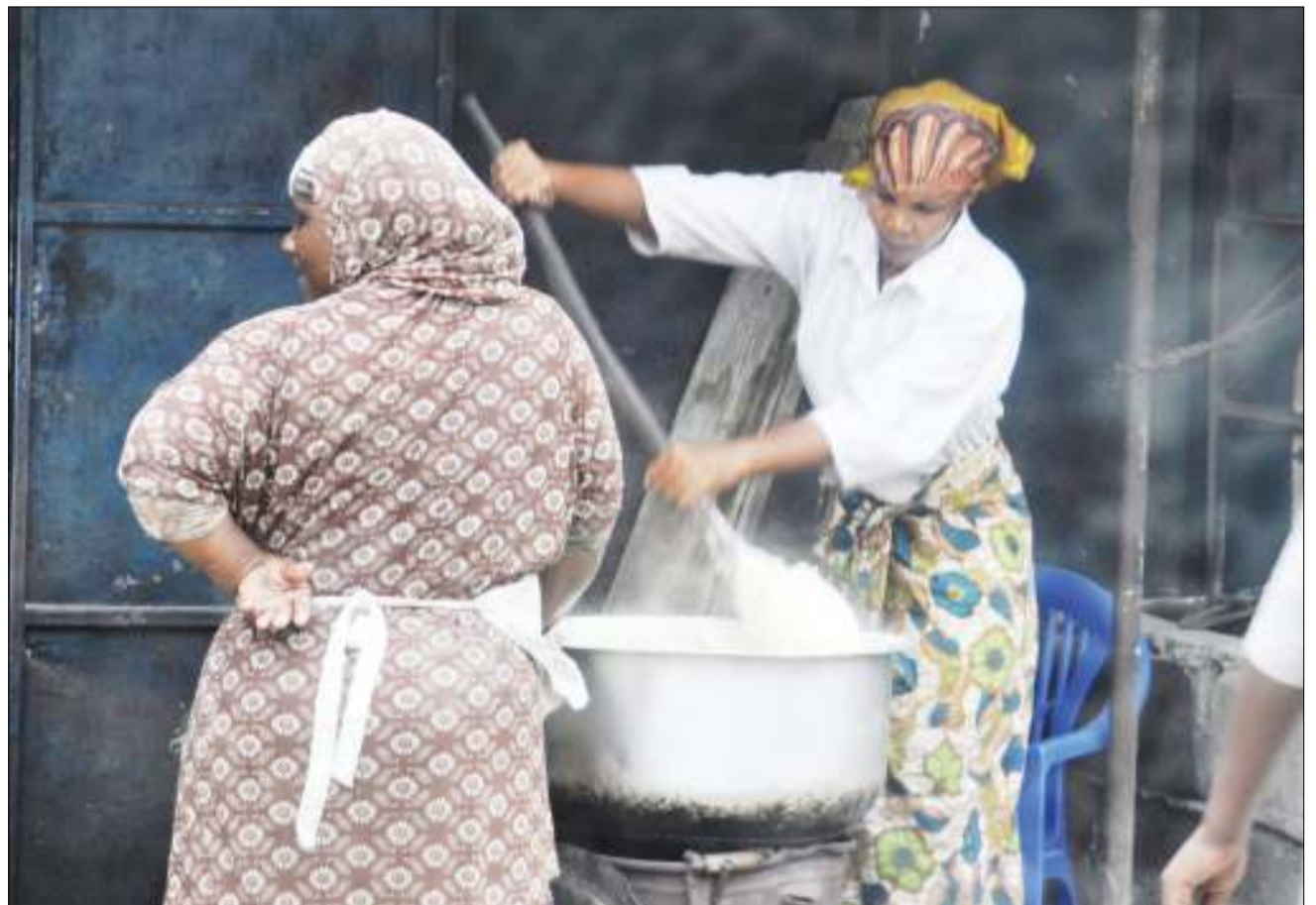
Mamalisha akiandaa ugali kwa ajili ya mlo wa mchana kwa wateja wake, katika Mtaa wa Tandamti, eneo la Kariakoo, jijini Dar es Salaam jana.