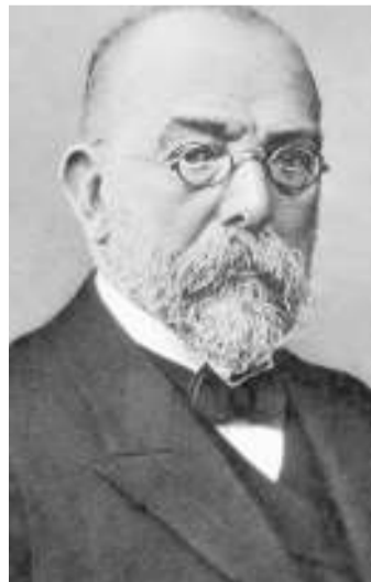
Dk. Robert Koch, mtaalamu aliyegudua bakteria wa TB.

Siku ya TB ni maalum kwa kumbukumbu ya siku ambayo, mwaka 1882, mtaalamu Dk. Robert Koch alitangaza kugundua bakteria anayesababisha TB na hivyo ikafungua njia kuelekea kuugundua ugonjwa na matibabu yake.