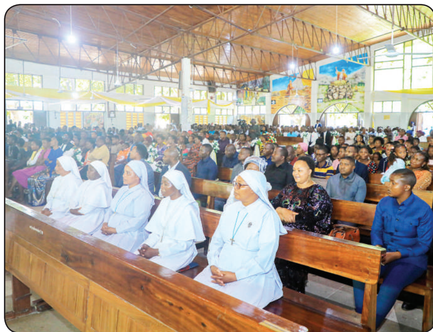
Baadhi ya waumini wakiwa katika ibada ya Sikukuu ya Krismasi katika Kanisa Katoliki Parokia ya Mwenyeheri Maria Theresa Ledochowska Kiwanja cha Ndege Dodoma jana.