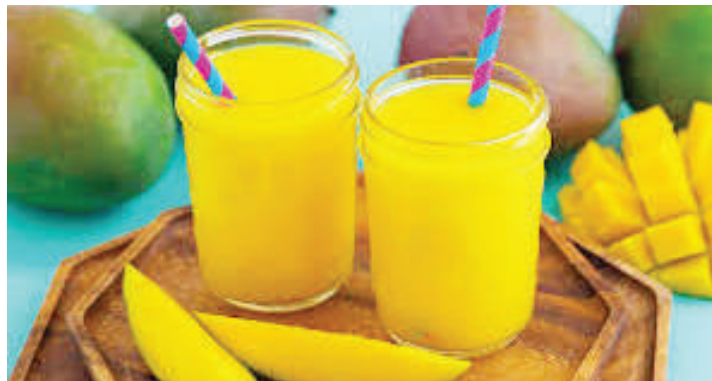
Juisi hupendwa sana na wengi kukamilishia mlo.