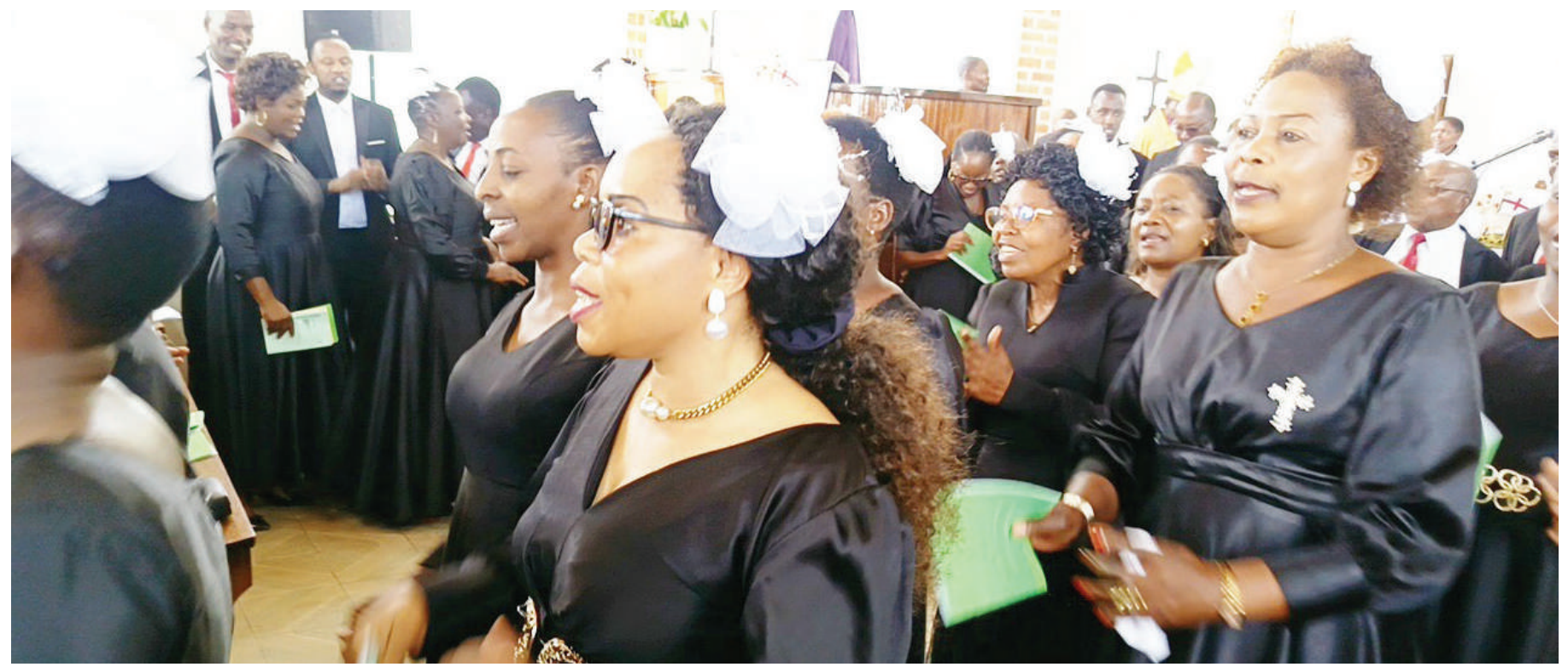
Baadhi ya waumini wa Kanisa la Kiinjili la Kilutheri Tanzania (KKKT) Dayosisi ya Iringa wakiwa katika ibada ya kitaifa ya Krismasi iliyofanyika katika dayosisi hiyo jana.

• Walia na Katiba Mpya, kilichojiri Uchaguzi S/Mitaa, utekaji, mauaji, sumu ya michepuko... Ukurasa 2, 3, 4, 5, 7, 15 na 17