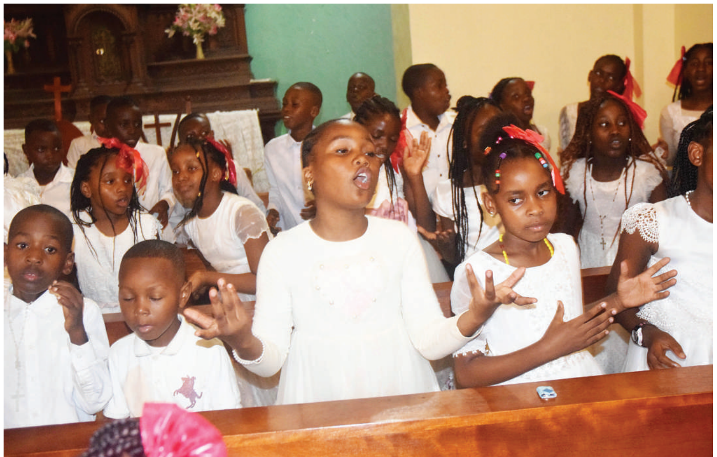
Watoto wa kikundi cha Haki na Amani Zanzibar wakiimba kwenye ibada ya mkeshwa wa Krismasi jana.

Alisisitiza na kutaka amani hiyo kudumishwa wakati taifa likielekea katika uchaguzi mkuu kwa ajili ya kupata viongozi wataoiongoza nchi katika miko-no salama.