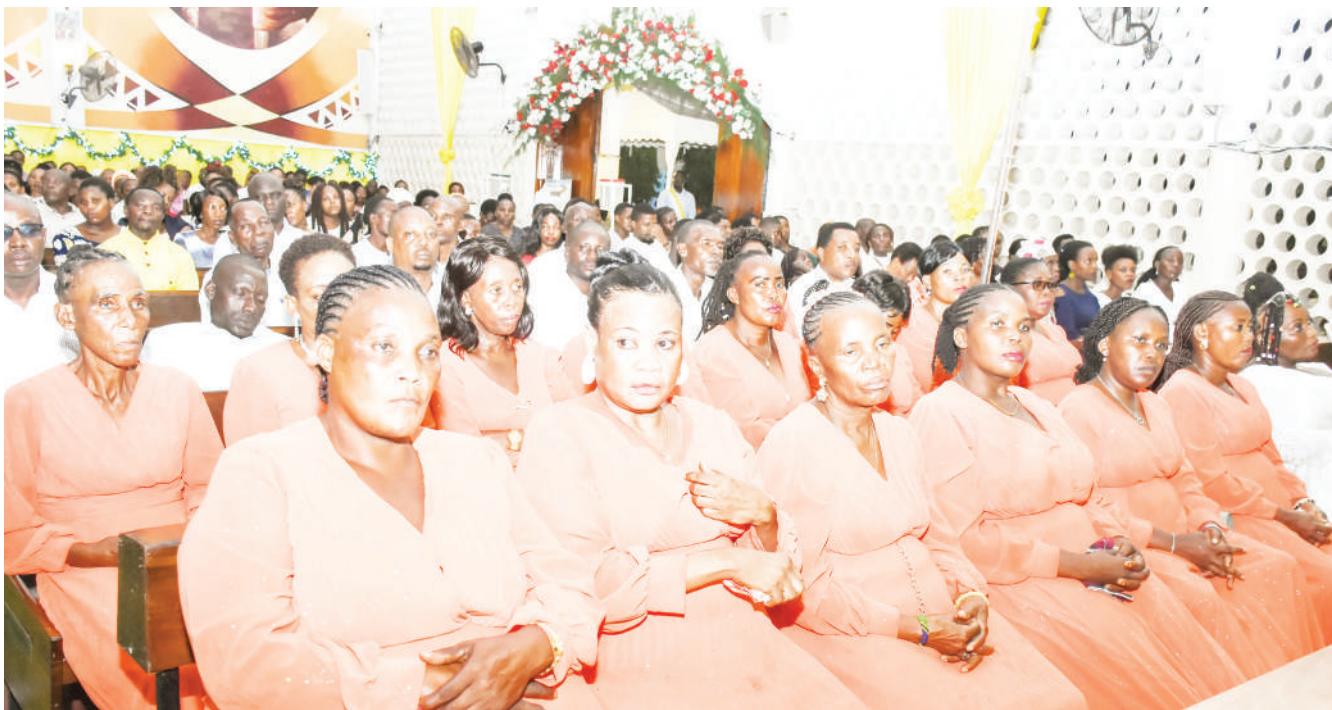
Waumini wakifuatilia misa takatifu ya Krismasi iliyofanyika katika kanisa la mtakatifu Petro Oysterbay, jijini Dar es Salaam jana.

Alisema lengo la serikali ni kuona vifo hivyo havitokei kabisa, hivyo kupitia Idara ya mama na mtoto Wizara ya Afya imeanzisha huduma za kambi ya matibabu ya madaktari wa Rais Samia pamoja na mafunzo ya kazi kwa watumishi wa hospitali, ili kuhakikisha wananchi wanapata huduma bora za matibabu.