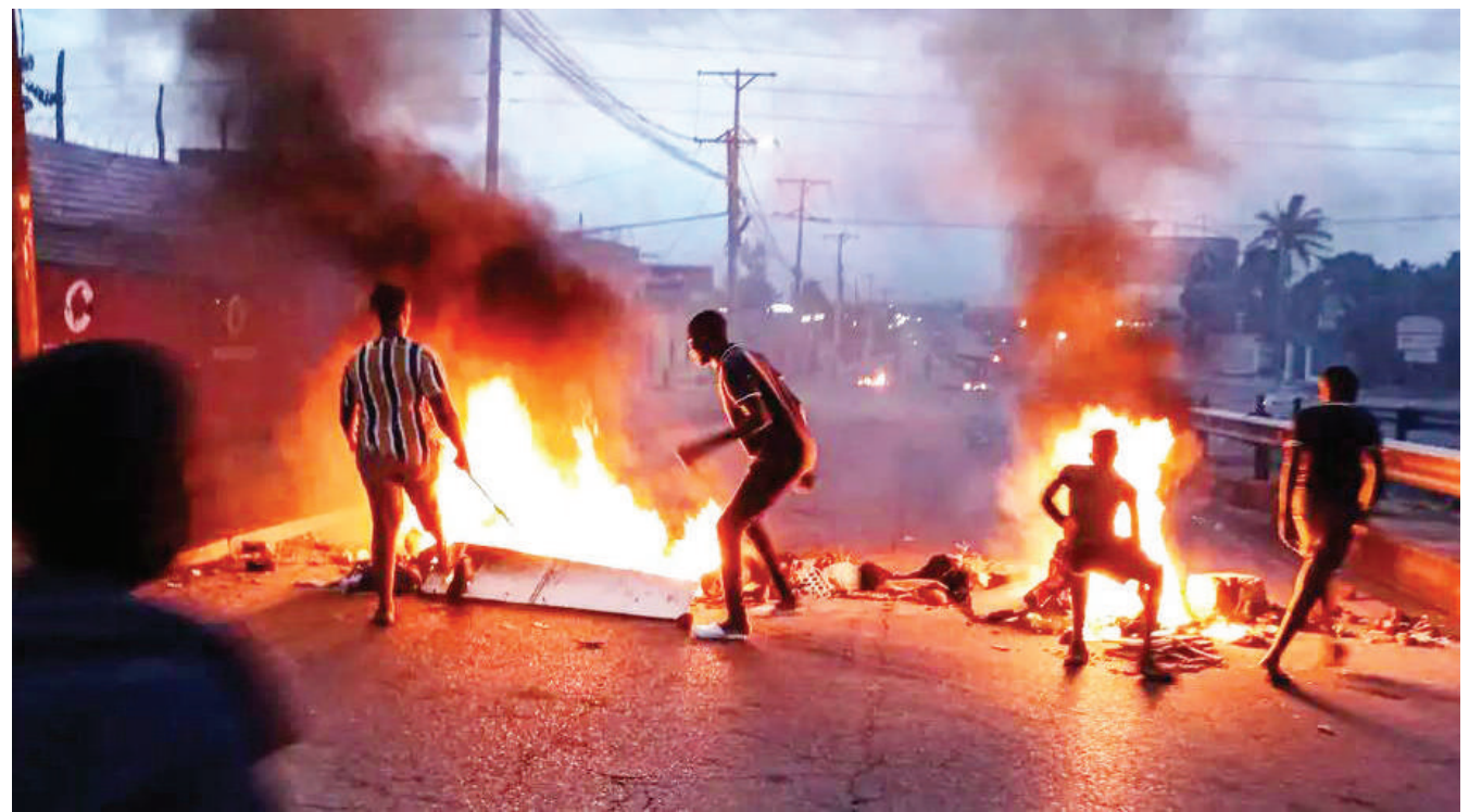
Waandamanaji wakichoma matairi barabarani katika maandamano yaliyoambatana na vurugu mjini Maputo juzi.