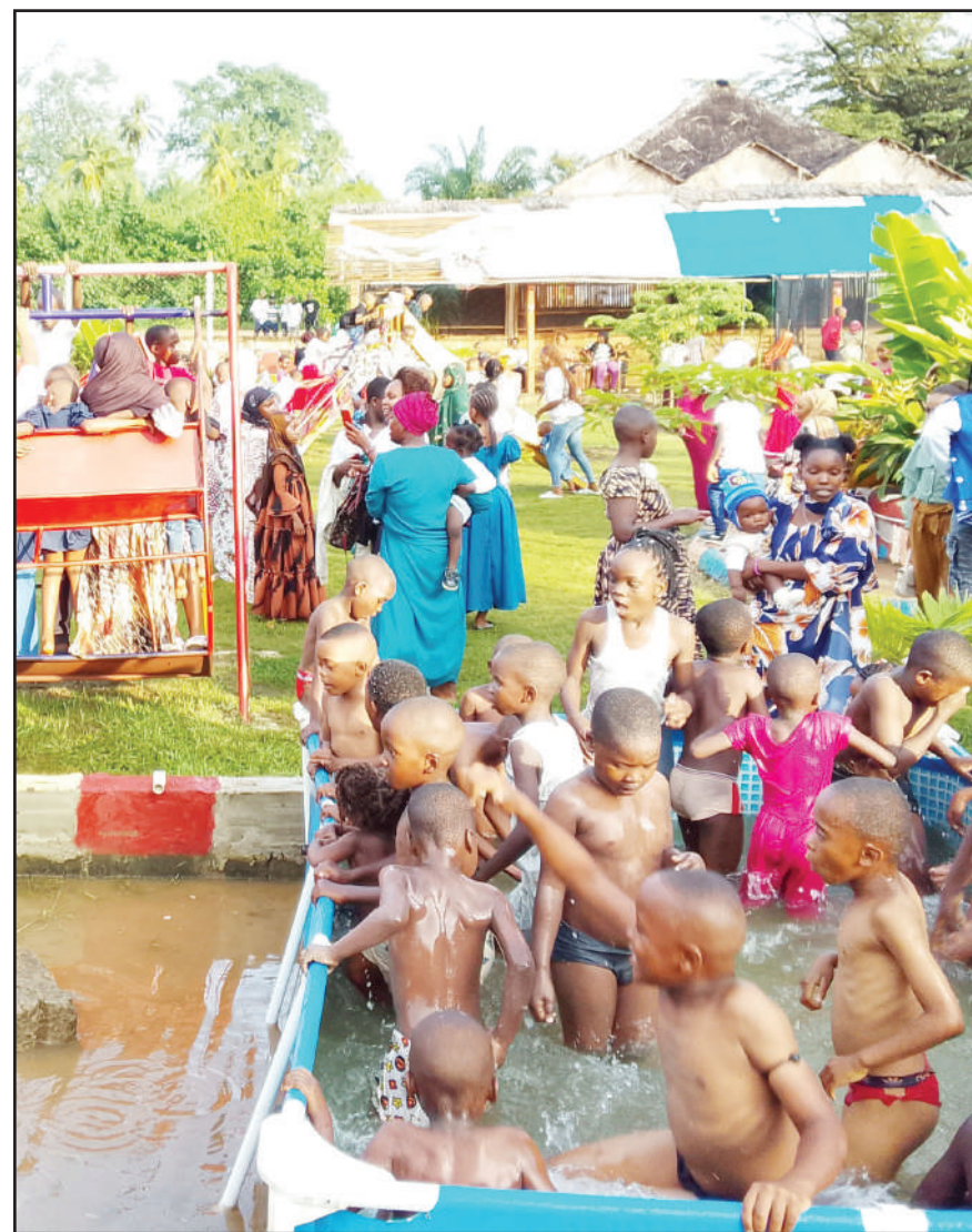
Watoto wakiogelea na kubemba katika eneo la Msekwa Park, wilayani Muheza, Tanga jana katika kusheherekea sikukuu ya Krismasi.