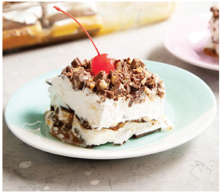
Sehemu ya vinavyokamilisha mlo 'dessert' ambavyo vikutimika vibaya, huishia kuzalisha madhara.