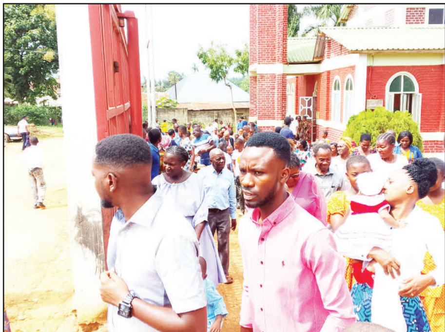
Waumini wa Kanisa Katoliki la Kristo Mfufuka Mtaa wa Majengo, wilayani Muheza, mkoani Tanga wakitoka kanisani katika ibada ya sikukuu ya Krismasi jana.