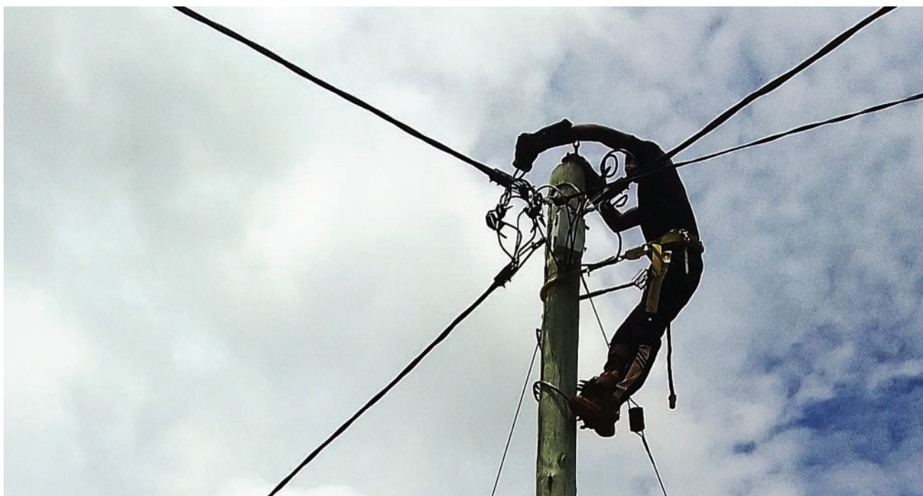
Fundi umeme kitengo cha dharura kutoka Shirika la umeme Tanzania (TANESCO) Mkoa wa Shinyanga akifanya matengenezo ya umeme katika Mtaa wa Ndembezi Ubalaji Manispaa ya Shinyanga jana.