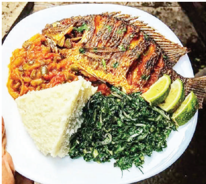
Mlo uliokamilika 'vigezo na 'masharti' kula kwa tahadhari na kuzingatia kanuni zake.

jumuisha protini kwa kila mlo, kwa kuwa inakuza utimilifu na inaweza kuwa muhimu kwa kudumisha uzito.