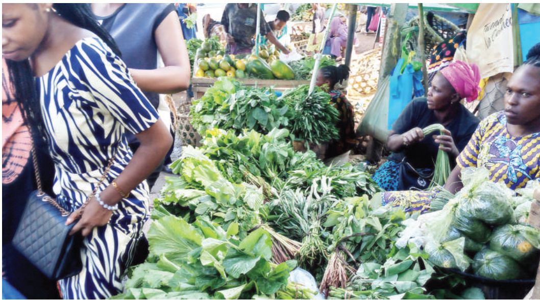
Wachuuzi wa mboga wakisubiri wateja katika eneo lao la biashara Mbezi Mwisho Dar es Salaam jana.