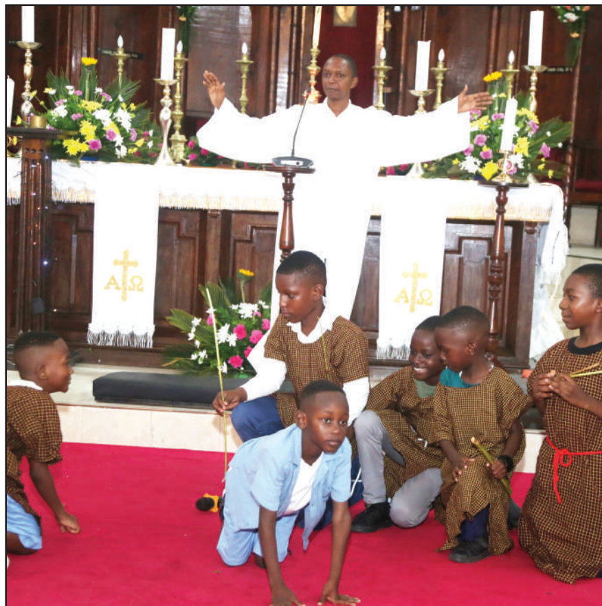
Watoto na waumini wa Kanisa la St Alban, wakifanya maigizo wakati wa mkesho wa ibada ya Krismasi jijini Dar es Salaam juzi usiku.