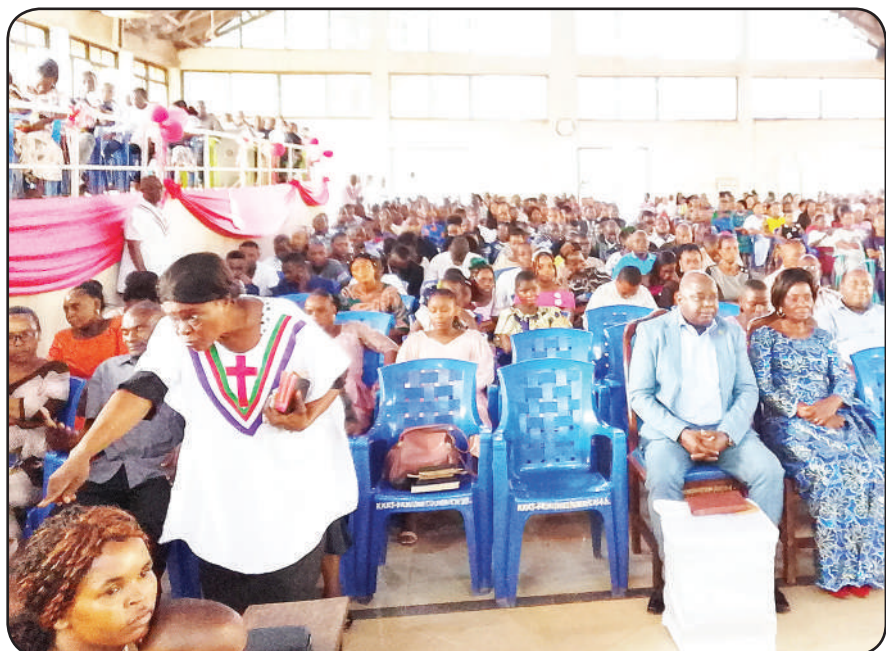
Waumini wakiwa katika ibada Krismasi katika Kanisa la Kiinjili la Kilutheri Usharika wa Muheza mkoani Tanga jana.