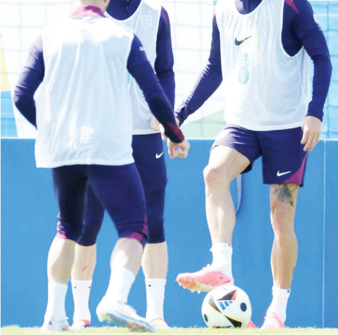
Wachezaji wa Timu ya Taifa ya England wakifanya mazoezi kwa ajili ya kujiandaa na mechi ya Kundi C ya mashindano ya Euro 2024 dhidi ya Serbia itakayochezwa leo usiku.