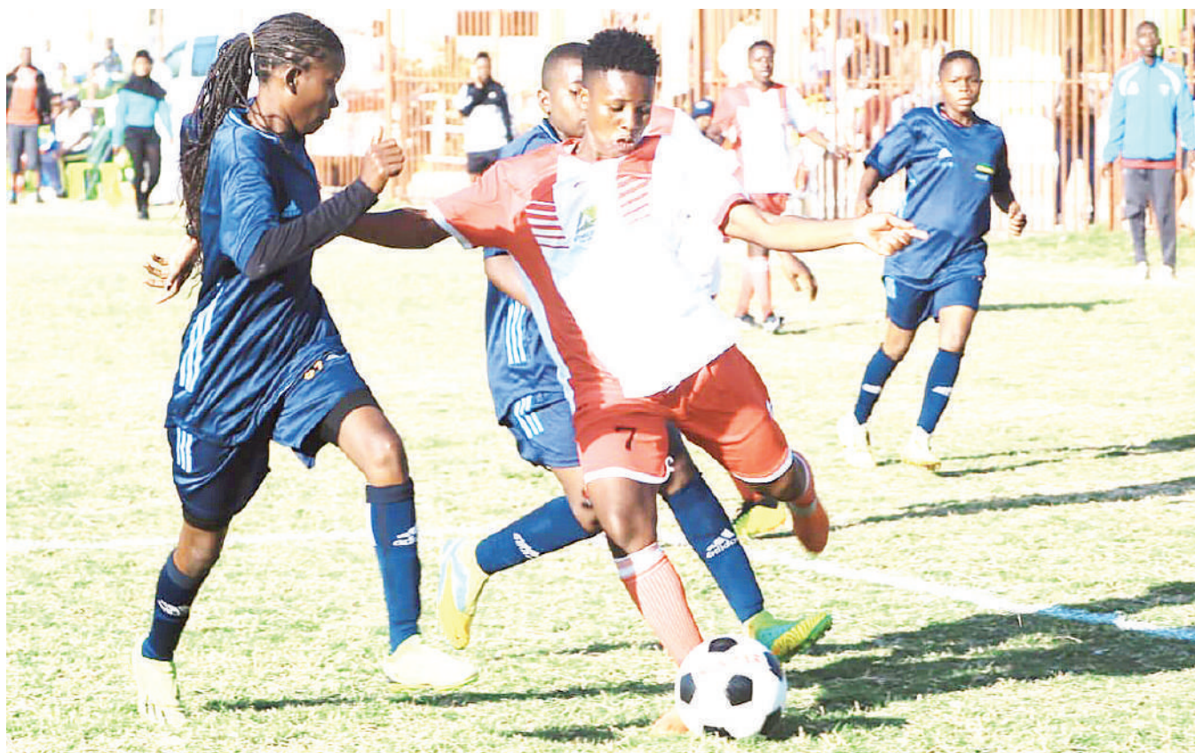
Mshambuliaji wa Mapinduzi Queens ya Njombe (kulia), akimtoka nyota wa JMK Park katika mechi ya Ligi Daraja la Kwanza Wanawake (WFDL), iliyochezwa kwenye Uwanja wa Fountain Gate jijini, Dodoma jana. Timu hizo zilitoka sare ya mabao 2-2.