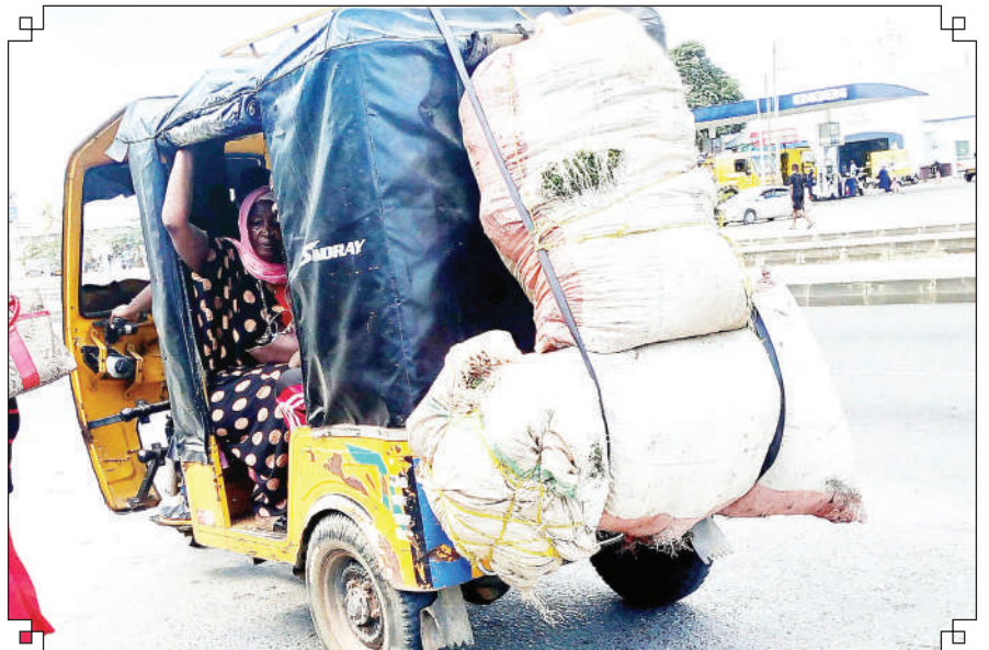
Dereva wa bajaji, akiwa amepakia mizigo kupita uwezo wa chombo chake katika Barabara ya Morogoro, eneo la Ubungo Dar es Salaam juzi, kitendo ambacho ni hatari kwa usalama barabarani.