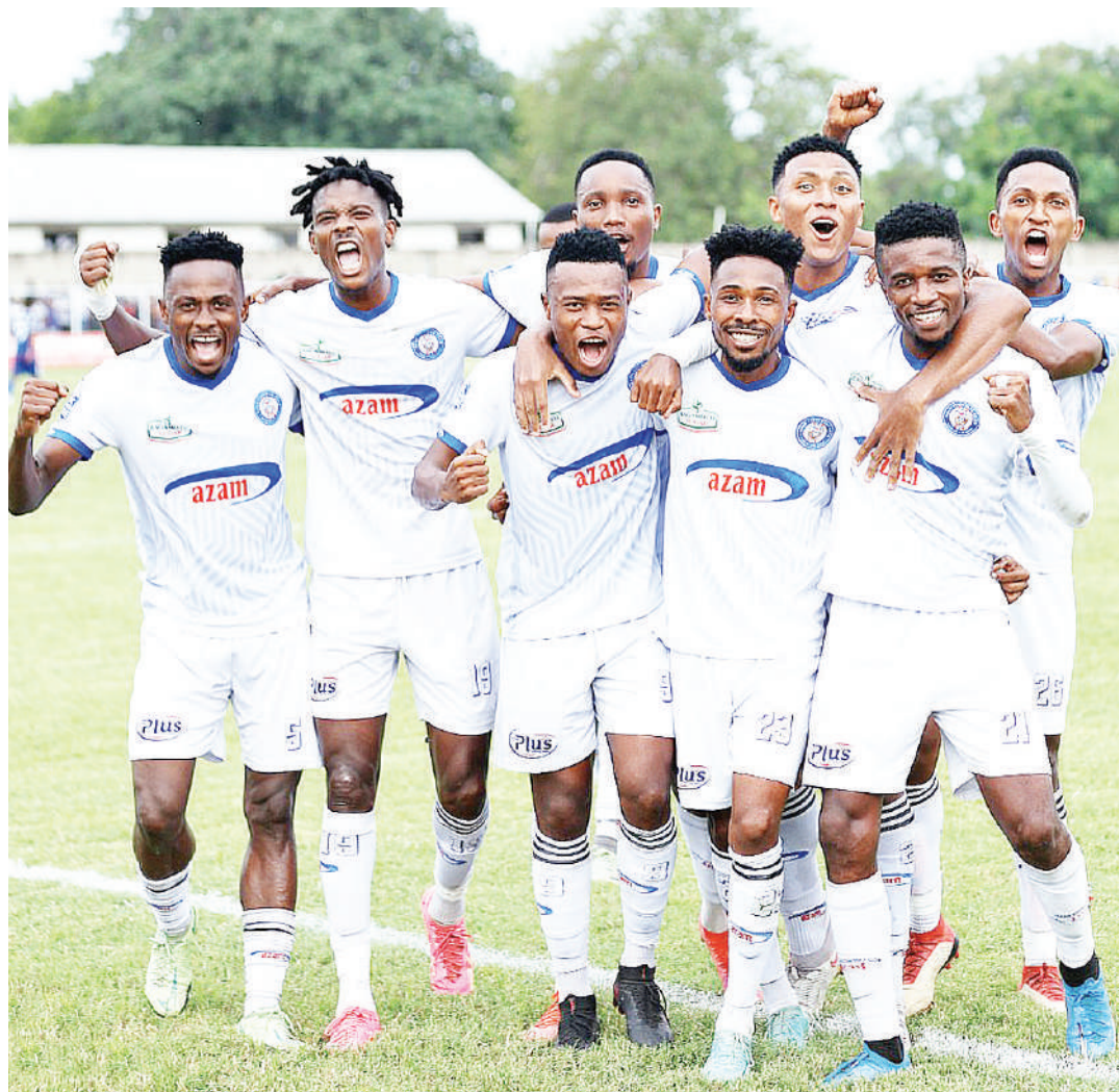
Wachezaji wa Azam FC wakishangilia bao katika mechi ya Ligi Kuu Bara msimu wa 2023/2024 uliomalizika hivi karibuni dhidi ya JKT Tanzania iliyochezwa kwenye Uwanja wa Meja Isamuhyo, Dar es Salaam. Azam ilishinda mabao 2-0.

Bao pekee la Stars katika mechi hiyo iliyochezwa kwenye Uwanja wa Levy Mwanawasa ulioko Ndola lililifungwa na straiika wa KMC FC, Waziri Jr, dakika ya tano.