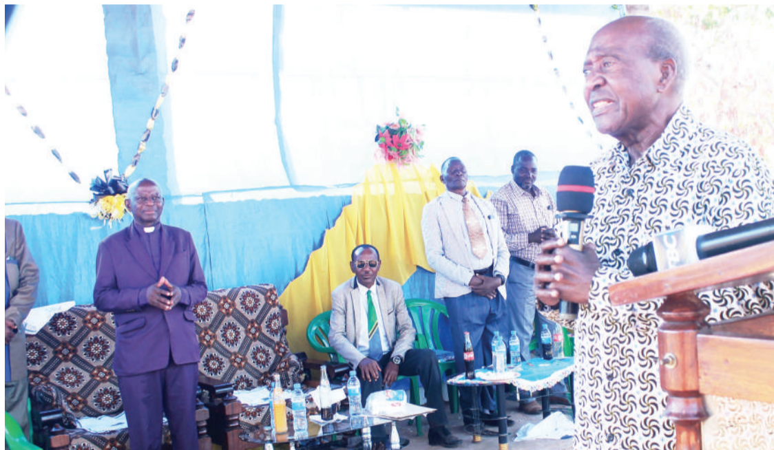
Waziri Mkuu mstaafu, Dk John Malecela akizungumza wakati akifungua kongamano la vijana katika uwanja wa Kanisa la Revival Evangelist Assemblies of God Tanzania Mtera, wilayani Mpwapwa, mkoani Dodoma juzi.