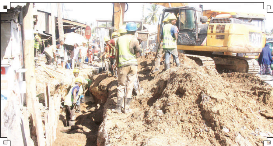
Mafundi wakichimba mfereji kwa ajili ya kutandika bomba la maji katika eneo la Kitunda jijini Dar es Salaam jana ikiwa ni mikakati ya Serikali kusambaza huduma hiyo nchini kote.