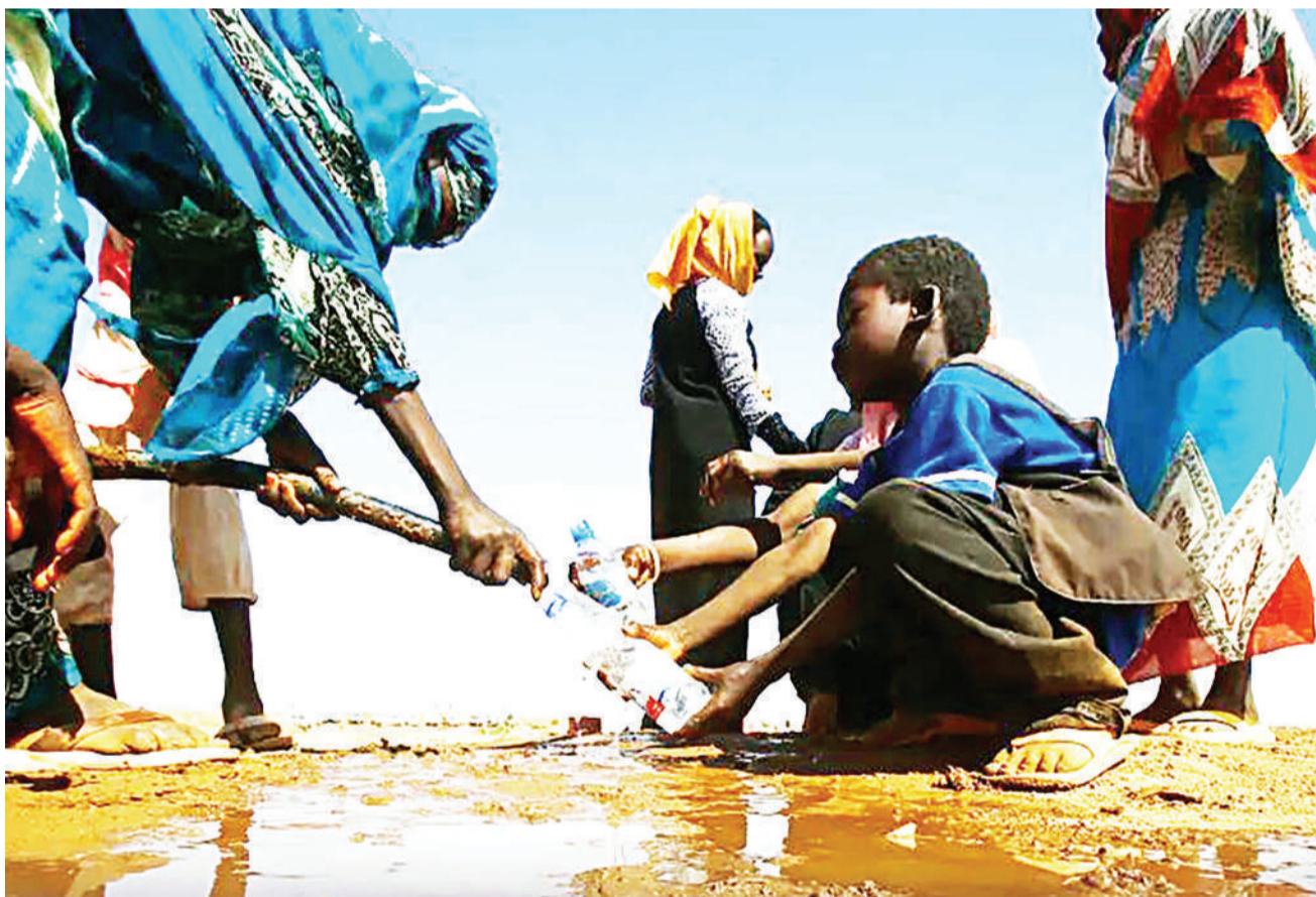
Wakimbizi wa Sudan wakichota maji kutoka katika bomba lililokatika kwa ajili ya kunywa. Vita vinavyoendelea nchini humo vimeathiri miundombinu ya kijamii.

Mnamo Januari mwaka huu, mkuu wa mashtaka katika mahakama ya kimataifa ya Jinai Karim Khan, alisema zipo sababu za msingi kuamini kwamba pande mbili husika katika machafuko ya sasa ya Sudan zimefanya uhalifu wa kivita dhidi ya ubinadamu au zimefanya mauaji ya kimbari katika jimbo la Darfur.