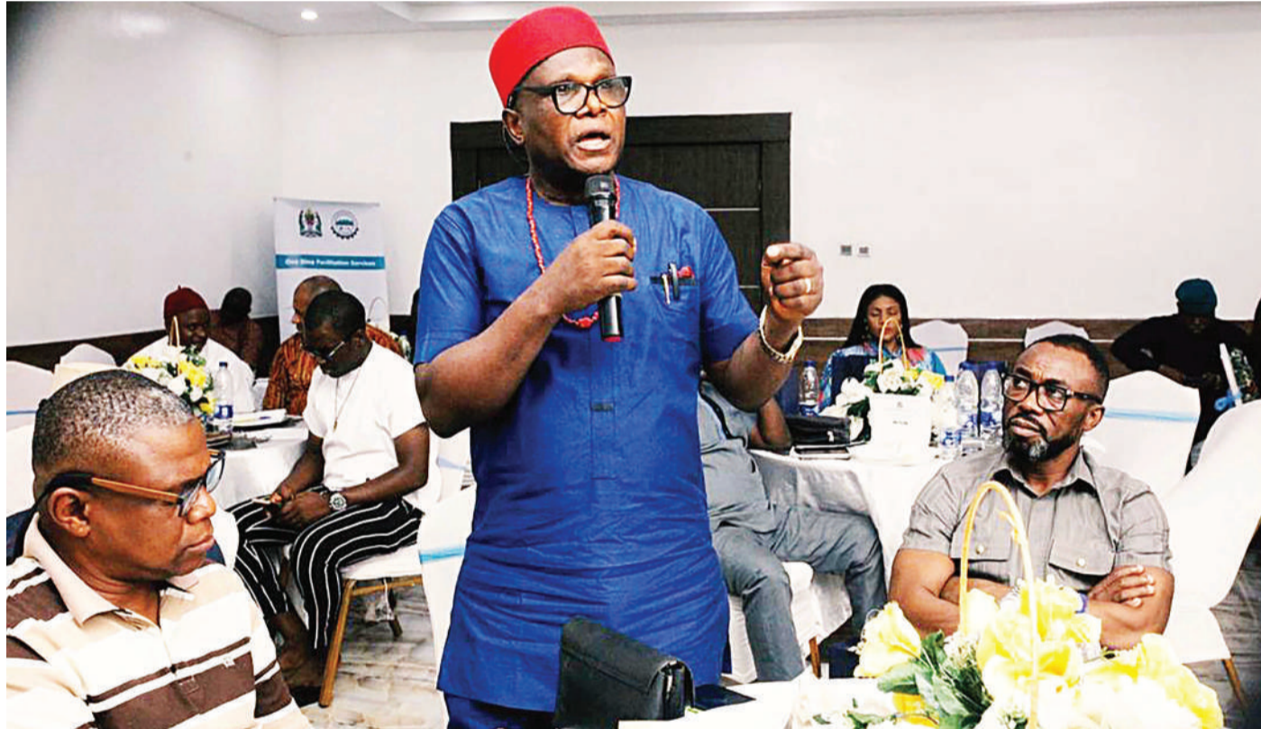
Mmoja wa washiriki akichangia mjadala wakati wa kongamano la uwekezaji lililoandaliwa na Kituo cha Uwekezaji Tanzania (TIC) kwa kushirikiana na Ubalozzi wa Tanzania, jijini Lagos, nchini Nigeria, hivi karibuni.

Kongamano hilo lilijadili kuhusu sekta ya uzalishaji viwandani, ujenzi wa majengo, utalii, dawa, uchumi wa buluu, misitu, mifugo, huduma za kifedha, mafuta na gesi na uchakataji wa mazao ya chakula.