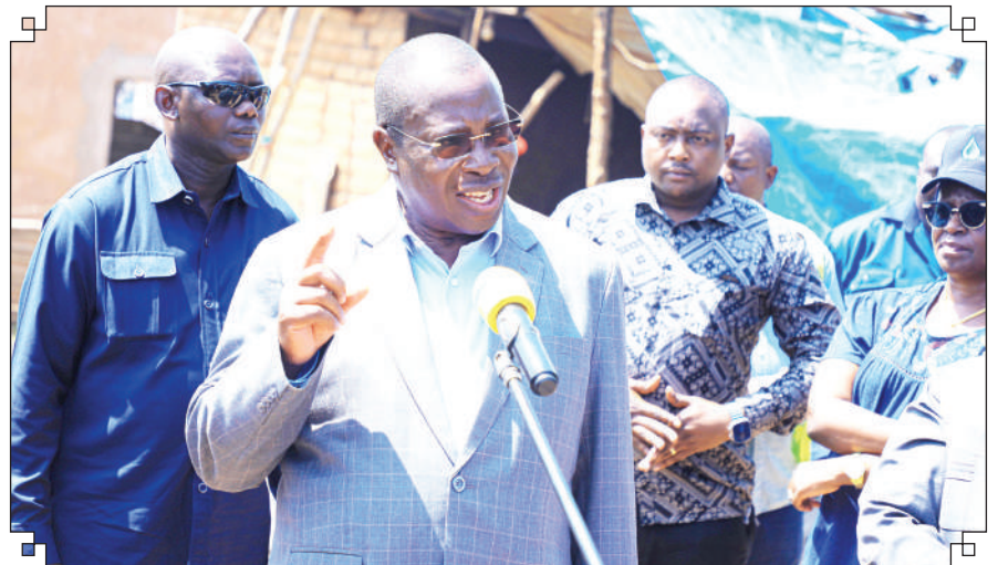
Makamu wa Rais, Dk. Philip Mpango akizungumza na wananchi wa Kijiji cha Mkizingo, Wilaya ya Mwanga walioanza kunufaika na Mradi wa Maji wa Same - Mwanga - Korogwe wakati akikagua mradi huo akiwa wilayani humo, mkoani Kilimanjaro jana.