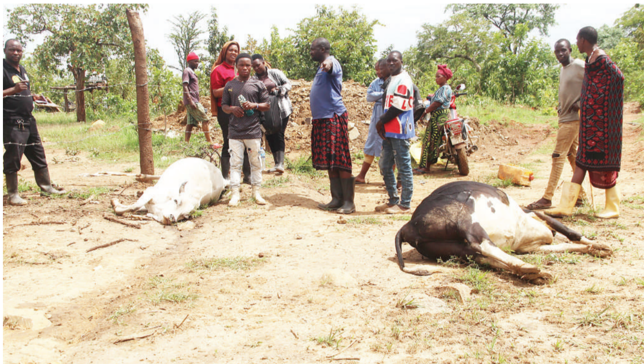
Baadhi ya wakazi wa Kijiji cha Mlima Nji kilichoko Kata ya Mbugani wilayani Chunya, Mkoa wa Mbeya, wakiangalia mizoga ya ng'ombe ya mmoja wa wafugaji wa kijiji hicho wanaodaiwa kufa baada ya kunywa maji yenye kemikali za sumu zilizotirishwa kutoka kwenye moja ya mitambo ya kuchenjulia dhahabu mwishoni mwa wiki.

Alisema kituo hicho cha Mwakaleli ni miongoni mwa vituo muhimu kulingana na idadi kubwa ya watu wanaoishi bonde hilo kuhitaji huduma za matibabu.