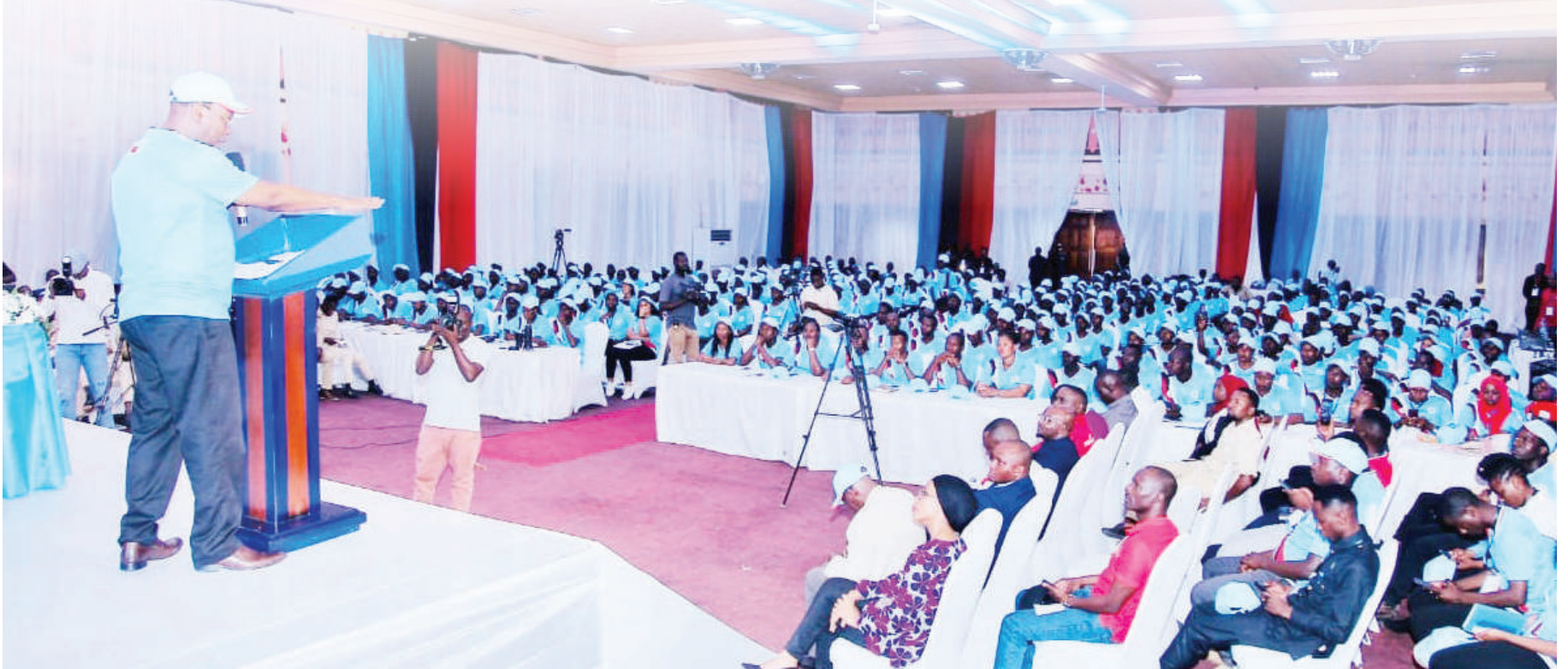
Mwenyekiti wa CHADEMA, Freeman Mbowe, akizungumza katika Mkutano Mkuu wa Baraza la Vijana wa chama hicho (BAVICHA), jijini Dar es Salaam jana.

• Aja na hoja kukosoa viherehere, shetani anayewaandama; Lissu naye afunguka... Endelea ukurasa 2