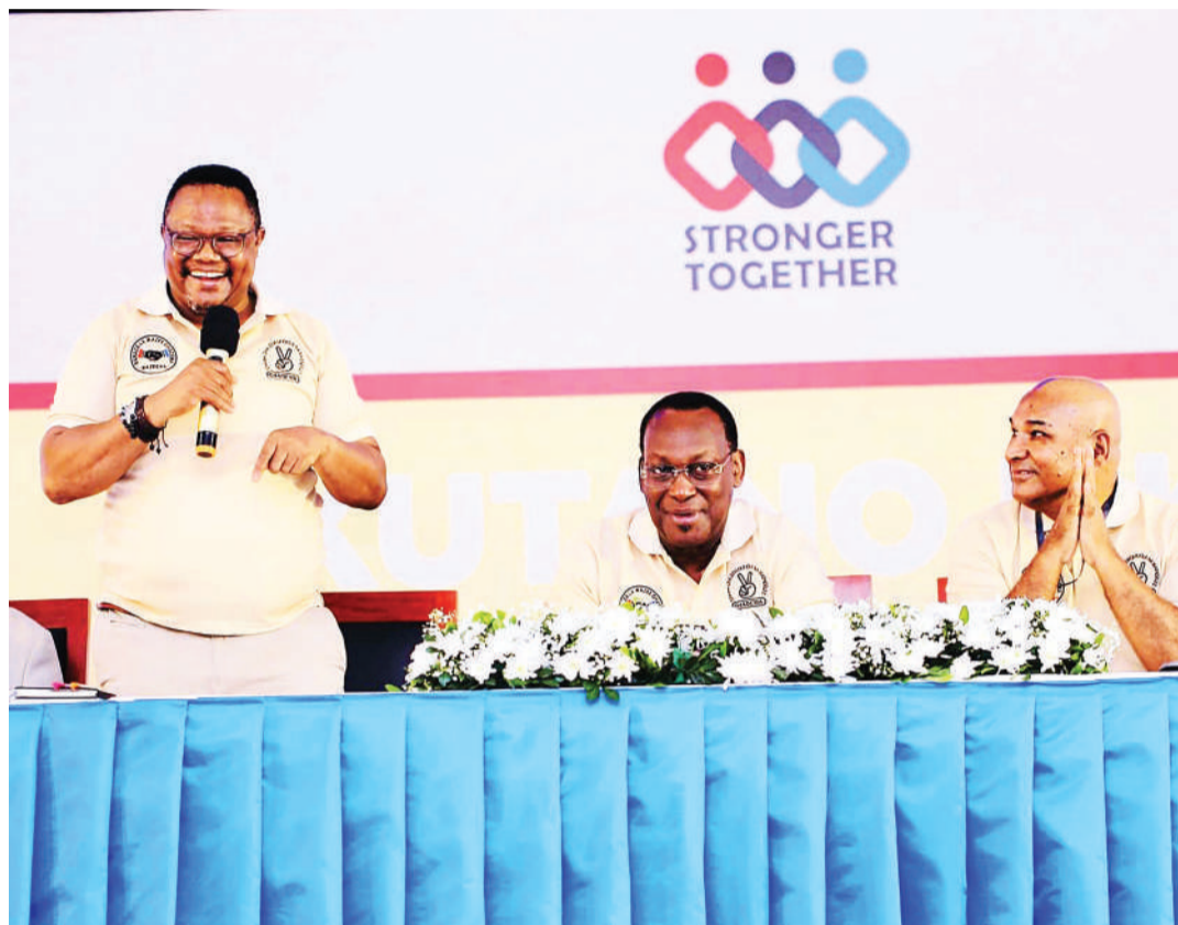
Makamu Mwenyekiti wa CHADEMA, Tundu Lissu akizungumza katika Mkutano Mkuu wa Vijana wa chama hicho, jijini Dar es Salaam jana.

“Juzi nilikuwa ninaongea na vyombo vya habari, nikakemea tabia moja ambayo inaanza kujengwa na vijana kufikiri uzee ni laana na kutokuuona kama busara, kutokuuona kama uzoefu na kutokuuona uzee kama maktaba ya chama, kwamba tunaweza kuwa na ujasiri wa kuwahukumu vion-