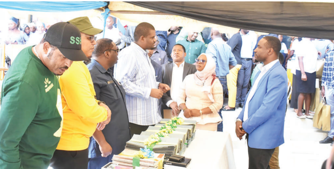
Waziri wa Ardhi, Nyumba na Maendeleo ya Makazi, Deogratius Ndejemi, akizungumza na viongozi kabla ya kugawa hati miliki zilizotolewa juzi kwa wakazi wa Wilaya ya Ikungi mkoani Singida.

Aliwataka wakulima kuendesha kilimo chenye tija kwa kushirikiana na tume hiyo baada ya kuahidi kuwa mstari wa mbele kuwahakikishia utunzaji na usimamizi bora.