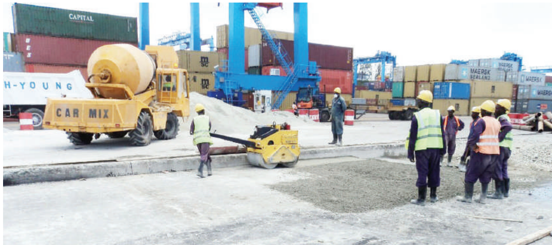
Kama ni mkandarasi wa barabara watoto wako wawe sehemu ya wahandisi wajenzi.

Ethiopia na Somalia kuna jamii zinazofanya jambo hilo, lakini