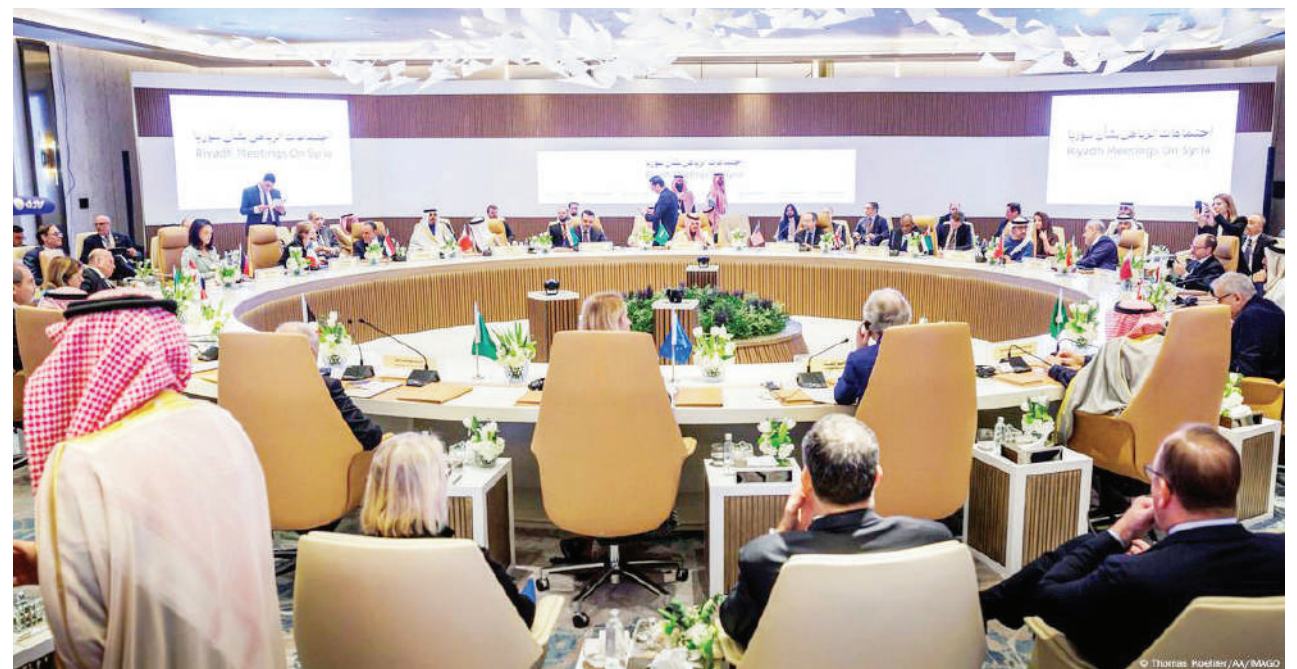
Mkutano wa mawaziri wa kigeni wa Ulaya na Uarabuni kuhusu Syria ukifanyika mjini Riyadh, Saudi Arabia jana.

Shirika la Amnesty tawi la Kenya lilisema alitekwa nyara na watu watatu waliokuwa na silaha kwenye gari nyeusi (Toyota) Noah majira ya saa tisa mchana katika eneo la Kilimani katikati mwa Nairobi. TRT